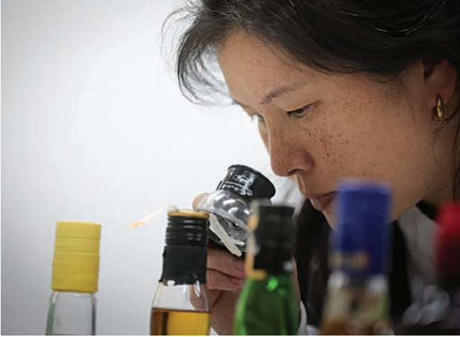
As denúncias estão sendo averiguadas por diferentes órgãos

As unidades de saúde do estado estão preparadas para lidar com a situação. A Secretaria de Saúde reco-