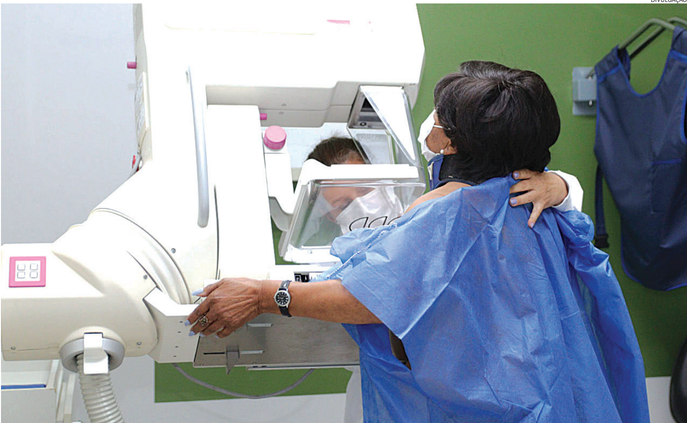
O mês também é voltado para ampliar o olhar para outros cuidados com a saúde da mulher

Durante a ação, mulheres acima de 40 anos também puderam aproveitar para solicitar o agenda-