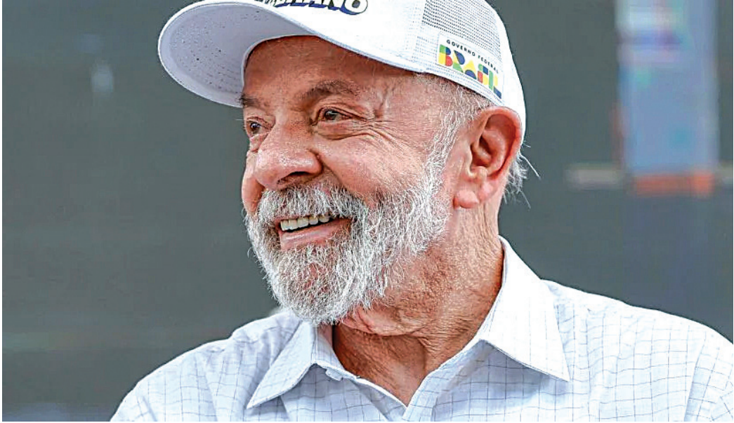
Lula afirma que é muito difícil que a direita vença a eleição no ano que vem

que vai atuar para pacificar a sua base no Maranhão, que se divide entre aliados do gover-