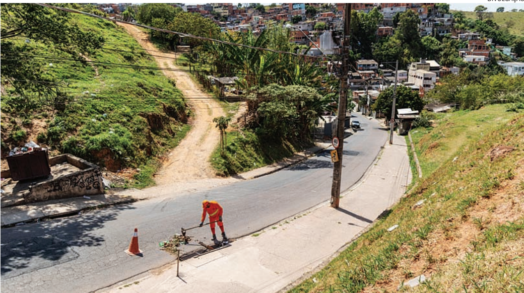
Ação tem como principal objetivo garantir a desobstrução das galerias de águas pluviais