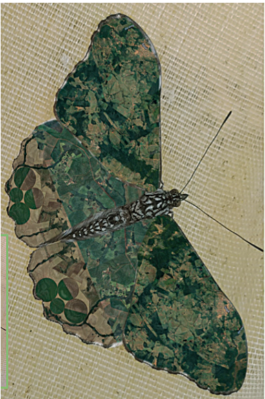
A exposição traz nove fotografias de borboletas e mariposas tropicais

A artista desenvolveu sua pesquisa visual na intersecção entre arte, ciência e tecnologia, e utilizou para realização as obras ferramentas tecnológicas como fotografia digital, aplicativos de tratamento de imagem, aplicativos de geocalização e contam com o apoio de biólogos para identificação de espécies e referências teóricas.