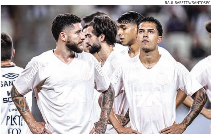
O Peixe fechou a 27ª rodada com 30.1% de chance de queda