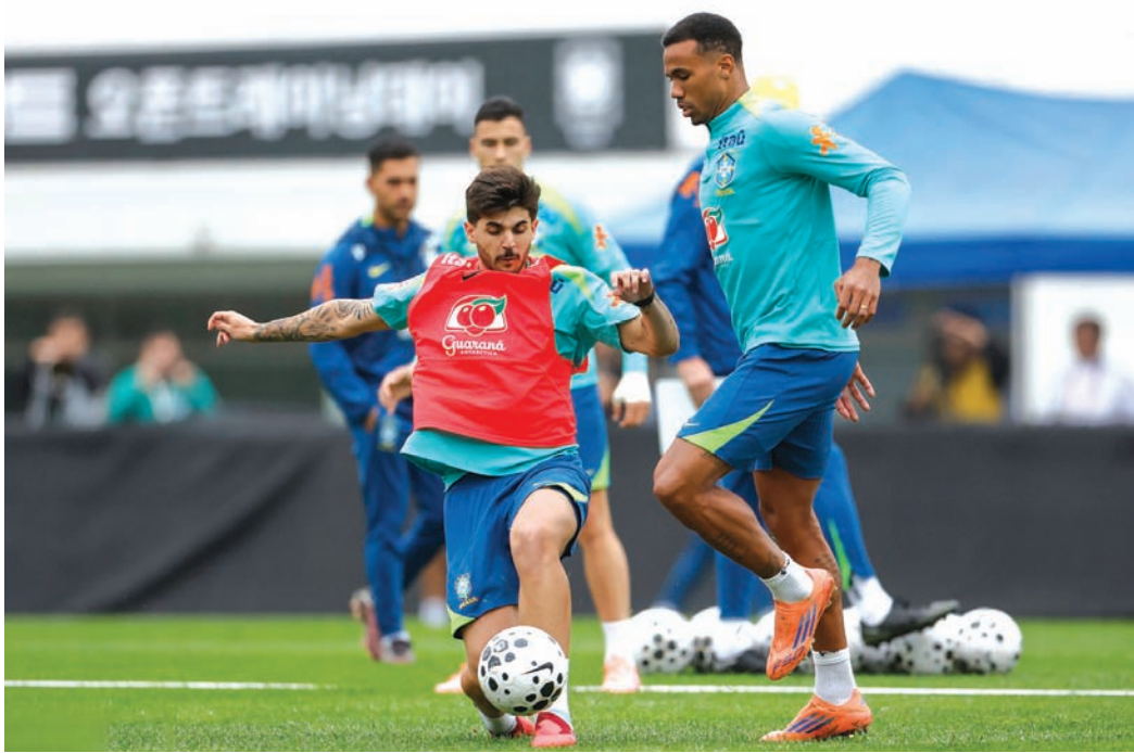
Ancelotti ainda não definiu a formação e os jogadores para a partida

Agora, o Brasil voltará a treinar no complexo do Goyang Stadium hoje e na