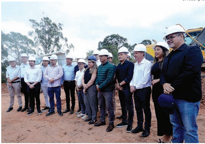
Início das obras marca o recomeço para famílias da Vila Real

Entre janeiro e setembro deste ano, Jundiaí apresentou uma leve redução nos registros de perturbação do sossego entre janeiro e setembro de 2025, segundo dados da Prefeitura. Foram registradas 688 denúncias, contra 748 no mesmo período do ano passado. Além da perturbação do sossego, os números de queimadas também apresentaram queda. Foram 195 registros em 2025, comparados a 197 no ano anterior. Já as denúncias relacionadas a rojões somaram 12 casos neste ano. Em agosto deste ano, a Câmara Municipal aprovou um projeto que prevê a criação de um canal de denúncias, no site da Prefeitura Municipal, sobre fogos de artifício, queimadas e perturbação do sossego. A Lei foi promulgada em setembro e, segundo a Prefeitura, o novo canal específico para esses registros está em fase de organização e será divulgado em breve à população.