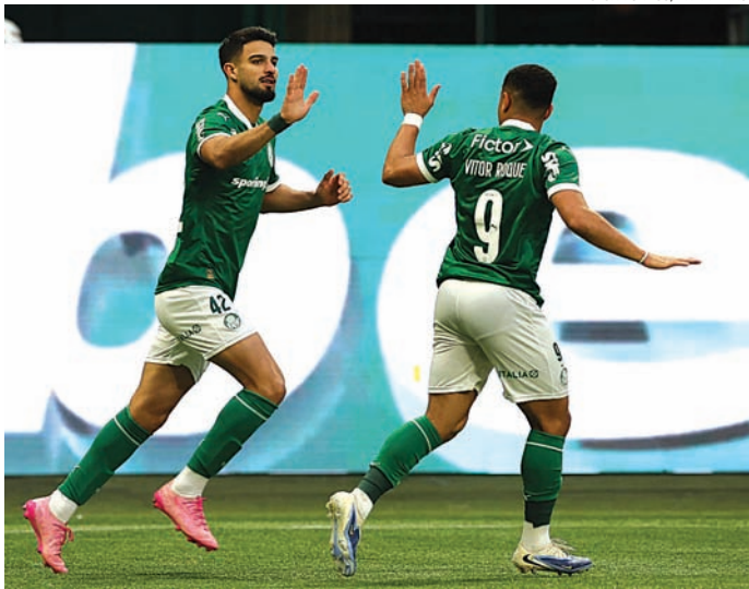
O Verdão terá uma ‘enxurrada’ de desfalques

No próximo sábado, contra o Juventude, o Pal-