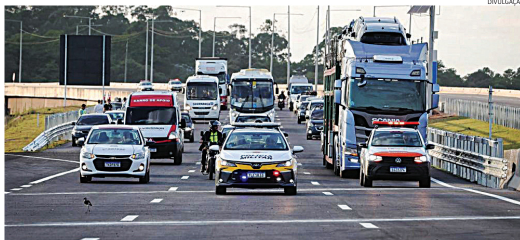
A integração com o Muralha permitirá que o sistema faça a leitura das placas

De acordo com a Artesp (Agência de Transporte do Estado de São Paulo), o sistema terá capacidade para detectar tentativas de invasão das vias com uma precisão de 10 a 20 metros, e pode