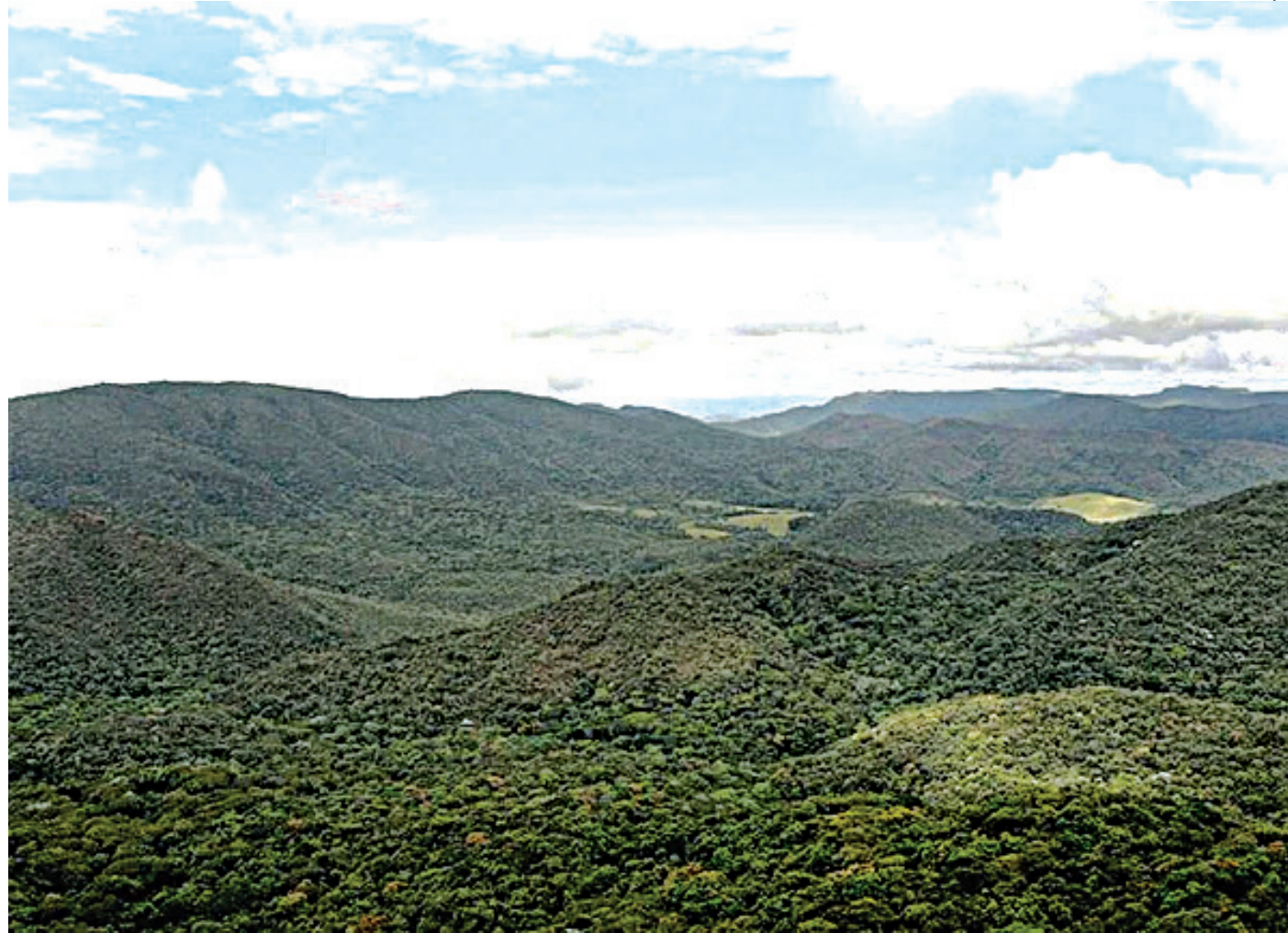
Novo loteamento, entre a Serra do Japi e a rodovia Dom Gabriel, causa preocupações

O documento pede que a audiência seja realizada pela prefeitura, com apresentação dos estudos técnicos e avaliações de impactos ambientais e urbanísticos. O protocolo argumenta que o projeto, com 411 lotes entre a Rodovia Dom Gabriel Paulino Couto e a Serra do Japi, está localizado em uma área de relevância ambiental inserida no bioma Mata Atlântica, o que demanda ampla discussão pública e maior transparência sobre possíveis impactos na mobilidade, infraestrutura e