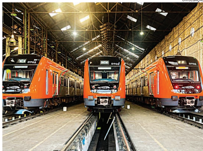
A Linha 7-Rubi é a base operacional dos três serviços do projeto TIC

A Linha 7-Rubi, entre São Paulo e Jundiaí, é a base operacional dos três serviços do