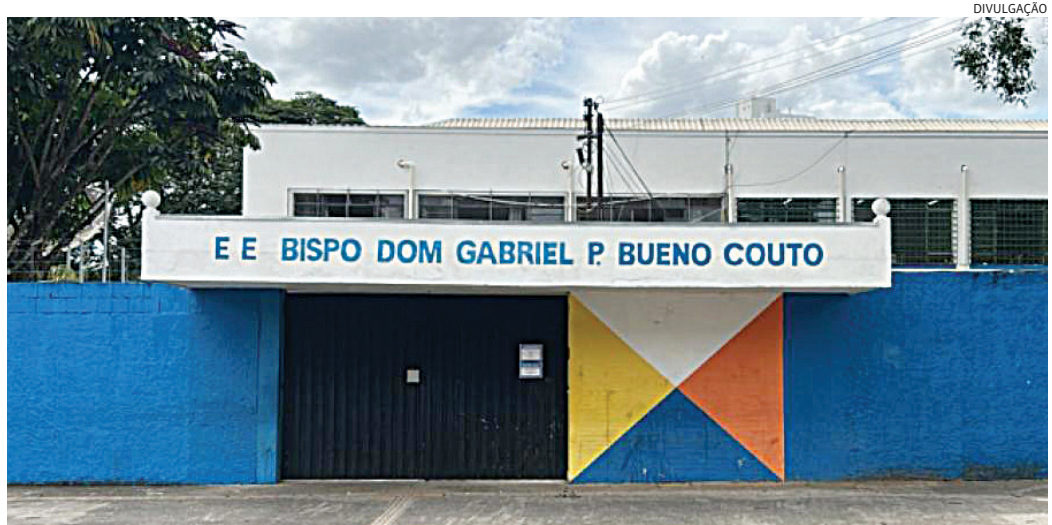
Os 80 serão comemorados com atividades ao longo da semana

Originada da antiga Escola Normal de Jundiaí, em 1928, a unidade passou por diversas denominações até a atual, mas mantém o legado. O Bispo tem tradição na aprovação de alunos em universidades públicas e privadas via vestibular, Enem e, mais recentemente, Prova Paulista. "Esse resultado vem do trabalho coletivo, do comprometimento dos professores e da cultura de incentivo aos estudos. O Bispo mostra o potencial da escola pública quando há continuidade pedagógica e pertencimento da comunidade", conclui o diretor.