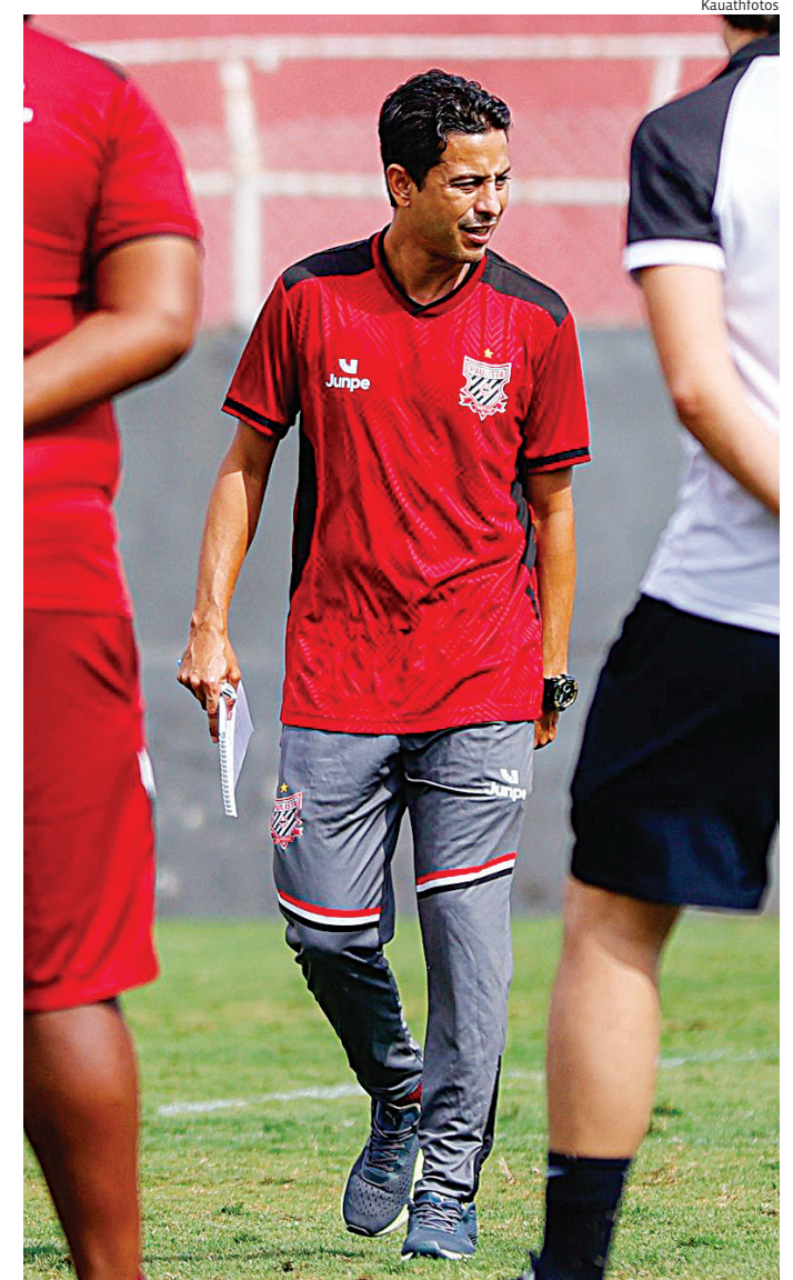
FPF divulga grupos e datas da Série B estadual de base sub-20

O Sub-20 do Paulista vem passando por reformulação para a temporada. Recentemente, o clube anunciou mudanças na comissão técnica e iniciou avaliações de atletas visando a montagem do elenco para a disputa estadual.