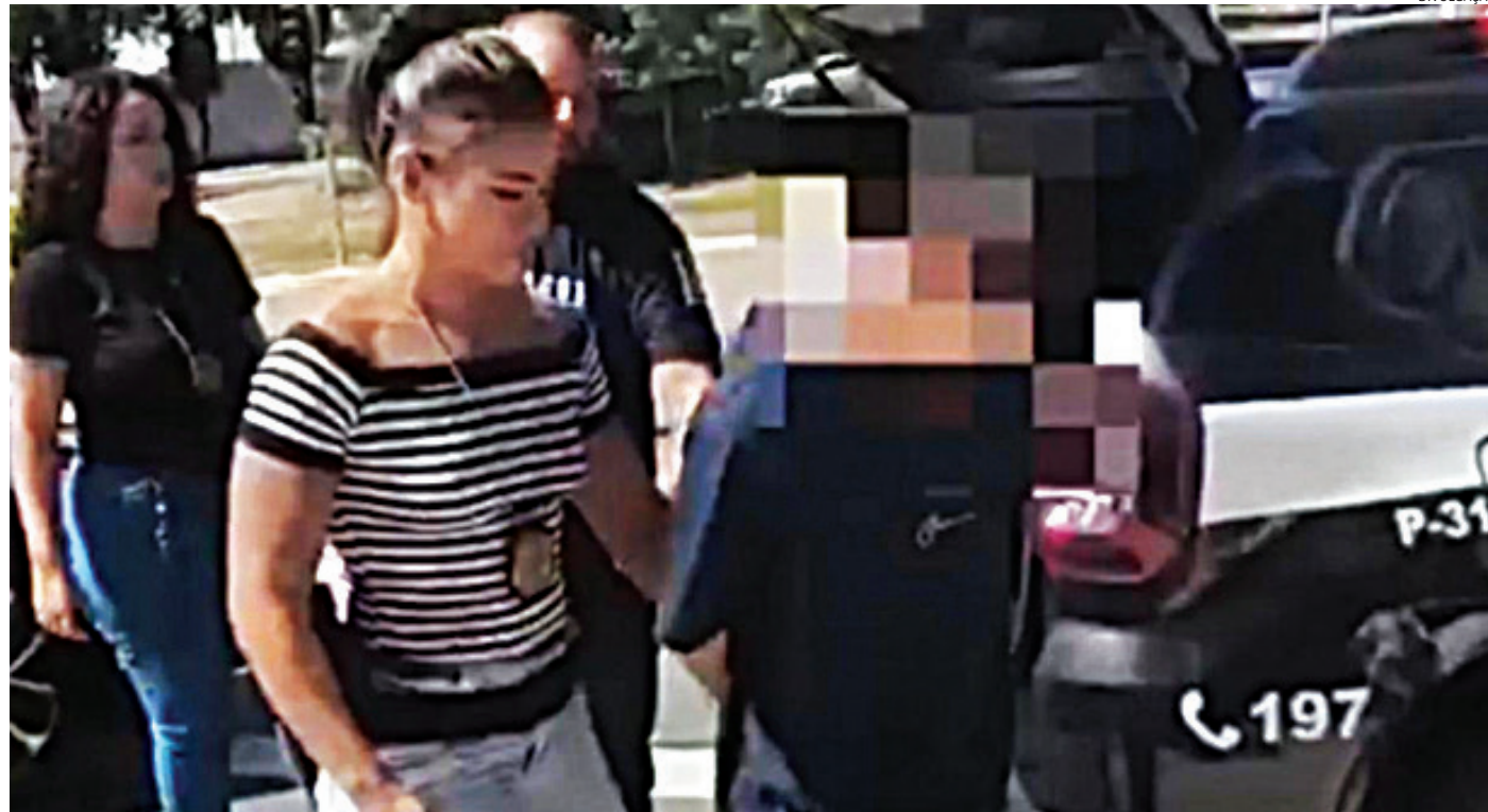
O companheiro da vítima foi preso em seu local de trabalho

Nesta quinta-feira, porém, a mulher foi à DDM pa-