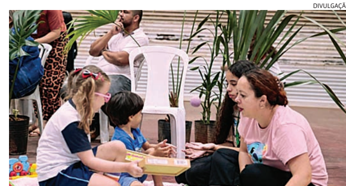
O encontro tem o objetivo de oferecer informação qualificada e orientação

Além de ampliar o conhecimento técnico, a iniciativa reforça a importância de uma atuação humanizada e informada, promovendo o protagonismo das famílias no contexto. A capacitação é resultado de uma mobilização do Clube de Mães Atípicas, do Fundo Social de Solidariedade de Jundiaí, e surge como uma oportunidade relevante de aprendizado e troca de experiências. O evento será realizado na sede da Escola de Gestão Pública, na rua Princesa Isabel, 257, Vila Arens. Mais informações na versão on-line do JJ (jj.com.br)