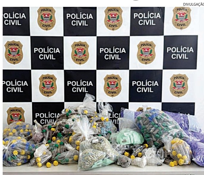
Um homem foi preso em flagrante por tráfico