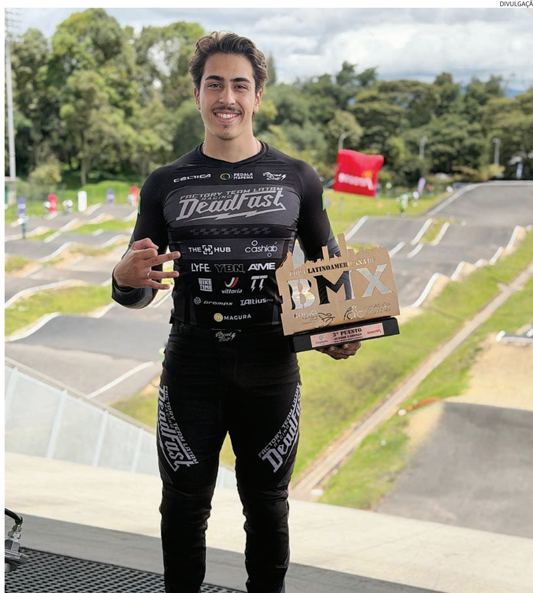
A competição reuniu alguns dos principais nomes da categoria Júnior do continente

A medalha conquistada na Colômbia também representa mais um passo impor-