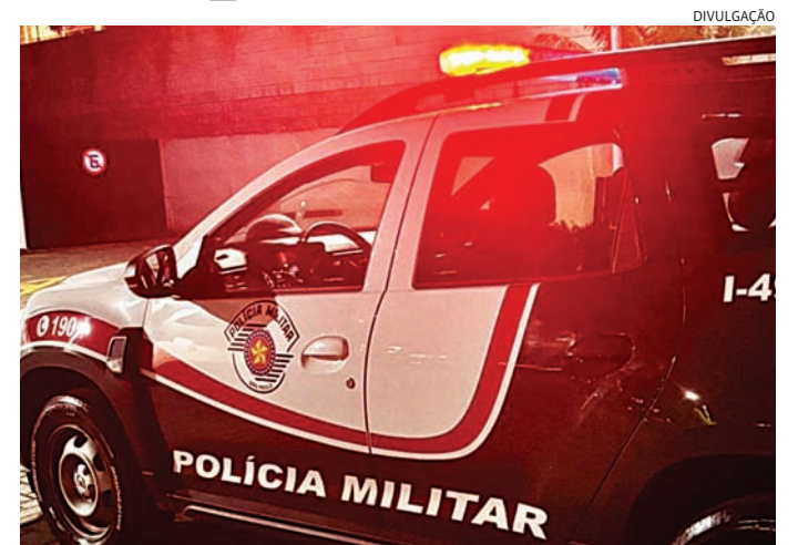
O homem foi encaminhado ao Plantão Policial

Nada de ilícito foi encontrado durante a revista pessoal. Porém, ao consultarem os dados dos abordados nos sistemas policiais, os PMs constataram que um deles possuía um mandado de prisão em aberto por dívida