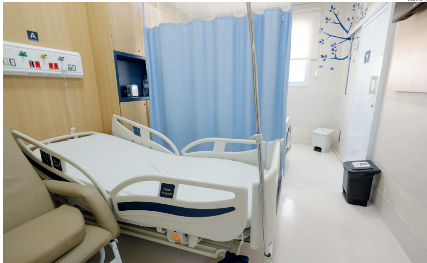
O Hospital São Vicente está sem dívidas e com a estrutura remodelada, com atendimento de ponta

A produção acompanhou a curva de crescimento implantada pelos novos equipamentos e organização dos serviços. A Atenção Básica saltou de cerca de