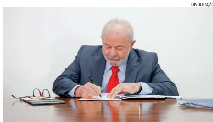
Lula sanciona lei que endurece penas para turismo sexual