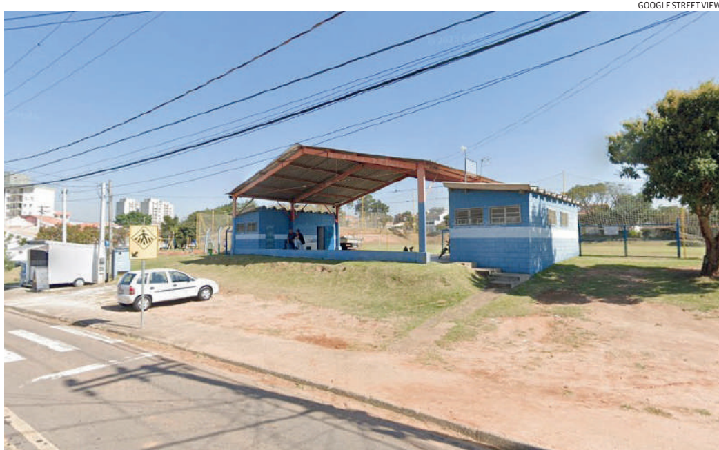
O local foi um dos que mais recebeu melhorias ao longo da gestão

Algumas medidas de segurança serão implantadas no local e, a partir daí, o ginásio estará liberado para a população.