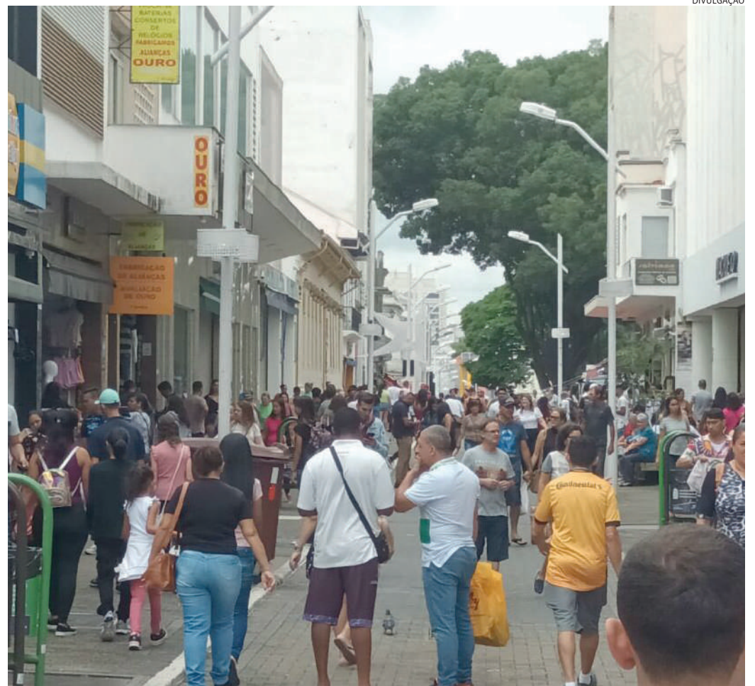
Jundiaí criou 600 novos postos de trabalho no mês passado, dos quais, 70% foram pelo Comércio

Até entre os que não foram contratados como aprendizes, o emprego teve mais oferta entre jovens de até 24 anos. Já em relação à escolaridade, a maioria dos postos de emprego criados em novembro foi para pessoas com Ensino Médio completo, seguidos pelos que têm Ensino Médio incompleto.