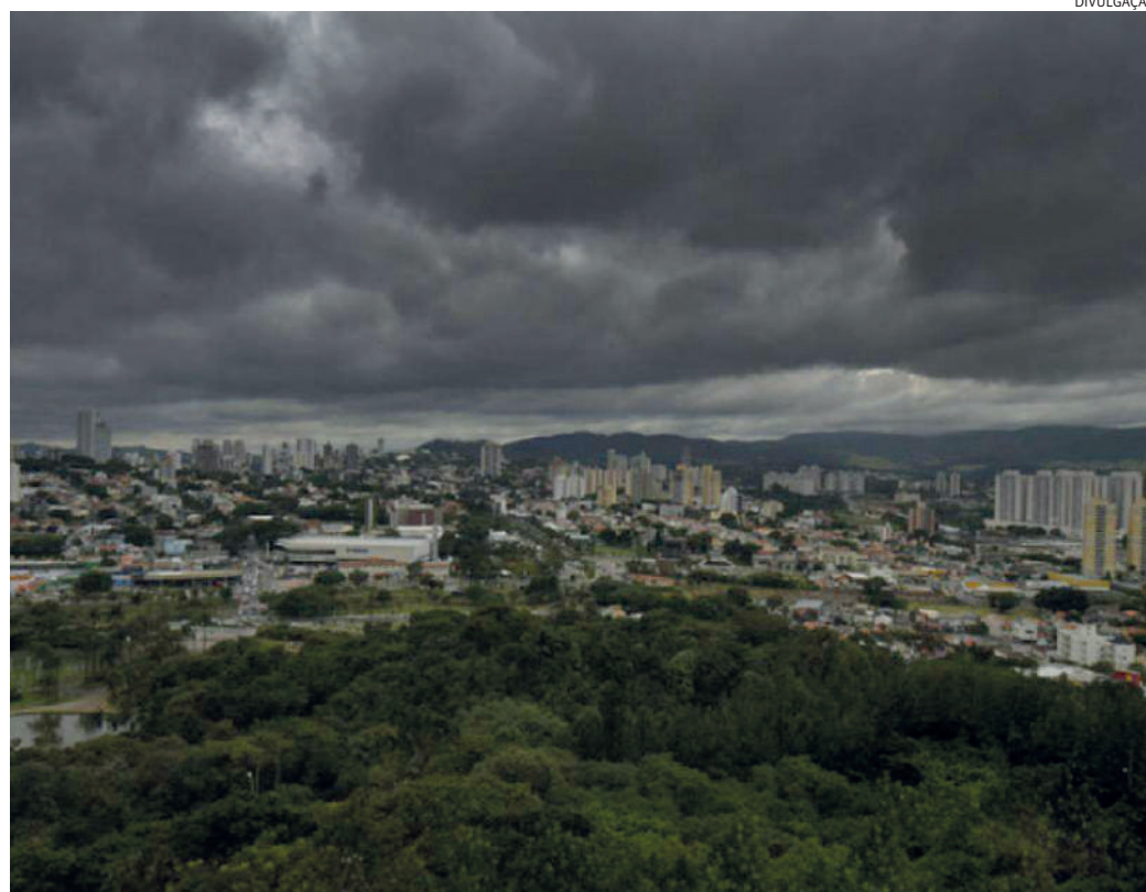
Defesa Civil de Jundiaí trabalhou na remoção de uma árvore caída sobre uma residência na Vila Esperança

A Defesa Civil de Jundiaí orienta os moradores de áreas de risco a ficarem atentos a sinais de possíveis deslizamentos, como rachaduras em paredes, solo encharcado e inclinação de árvores ou postes. Em situações de emergência, a população deve acionar os números 199 ou 193.