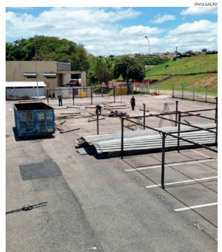
A usina vai suprir aproximadamente 70% do consumo de baixa tensão

O estacionamento de funcionários passará a ter 310 vagas de carros, todas cobertas, incluindo as preferenciais, para pessoas com deficiência, idosos e gestantes, adequadas de acordo com a legislação e as necessidades da empresa. As obras contam com investimento de R$ 14 milhões.