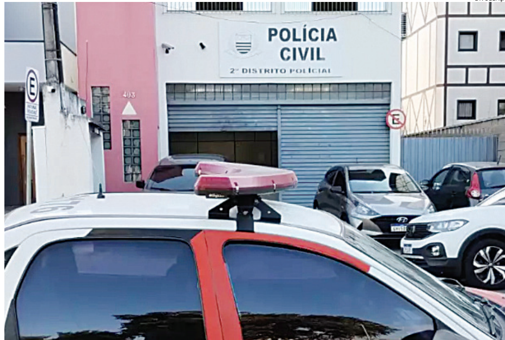
O caso foi registrado no Plantão Policial e será investigado pelo 2º DP

As informações preliminares são de que a mulher, de 25 anos, estava bebendo