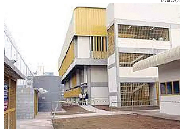
Adolescente foi levado para a Fundação Casa, onde ficará internado