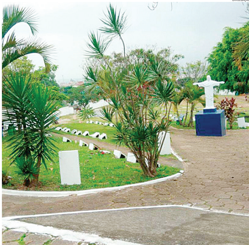
Celebrações terão quatro horários ao longo do dia e a expectativa é de grande público na data