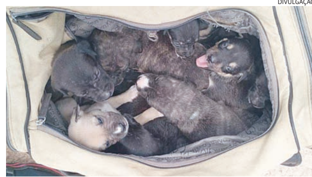
A protetora de animais que resgatou os cachorrinhos agora procura lares que deem amor aos 10 filhotes

São dez filhotinhos de cachorro que estavam na bolsa de viagem e, quem quiser adotar, pode entrar em contato com a protetora pelo telefone/Whatsapp (11) 97484-8253.