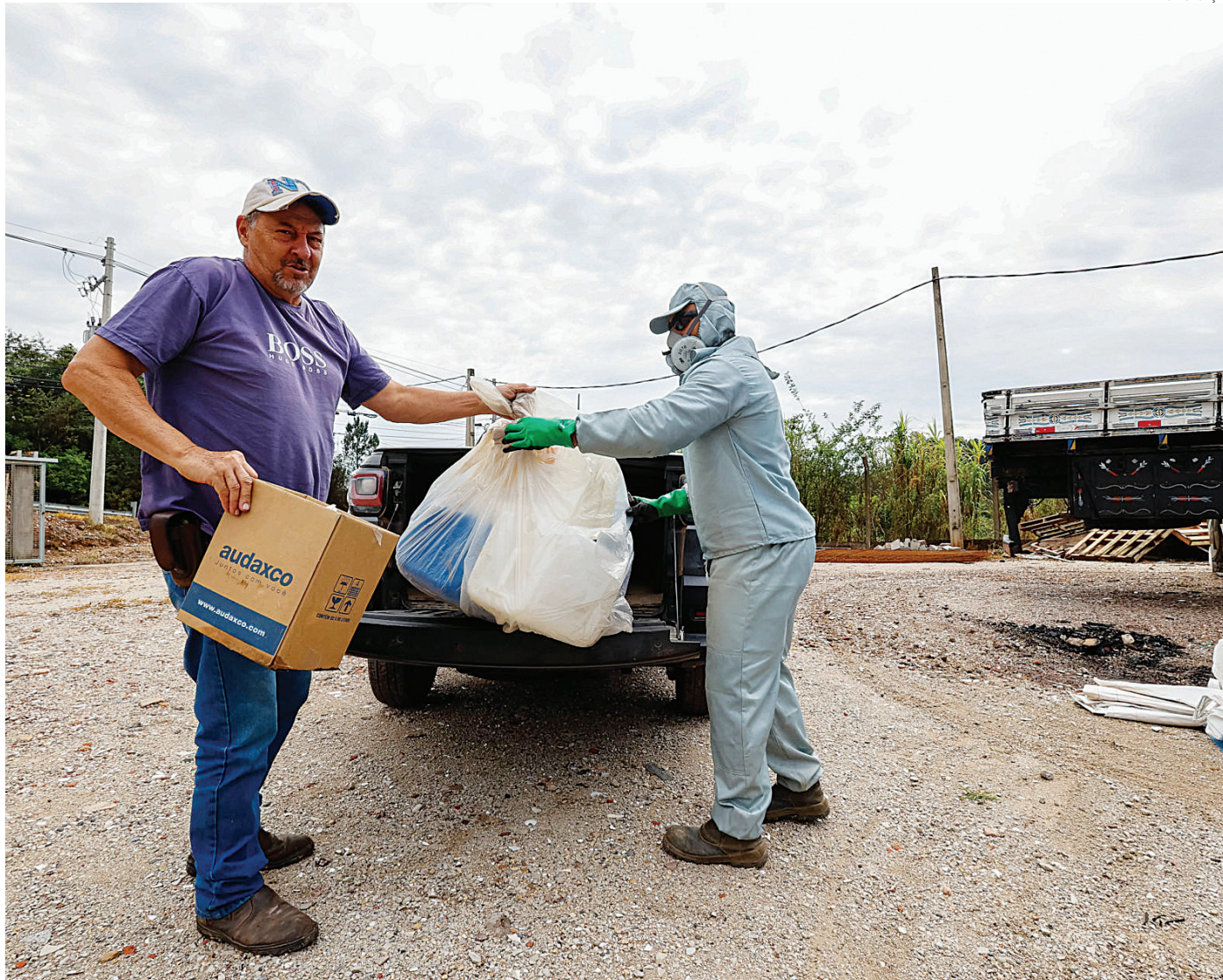
A entrega faz parte dos processos de certificação dos agricultores para inscrição nos programas municipais