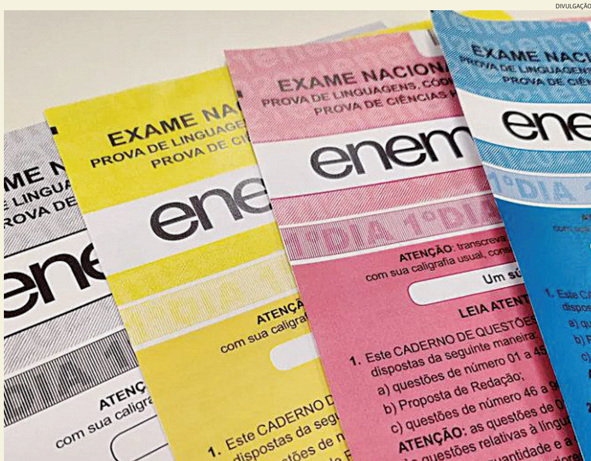
Mais jovens jundiaienses estão prestando o Enem - principal ferramenta para o acesso à universidade