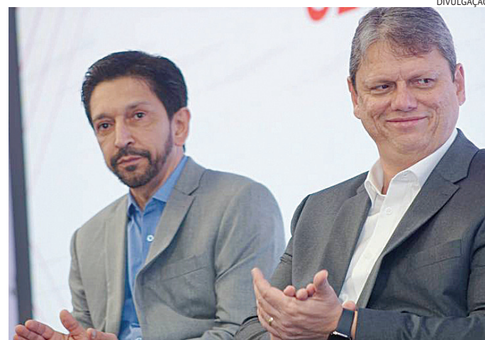
Candidatura de Tarcísio a presidente aumentou após eleição

O nome de Tarcísio se consolidou na direita e na