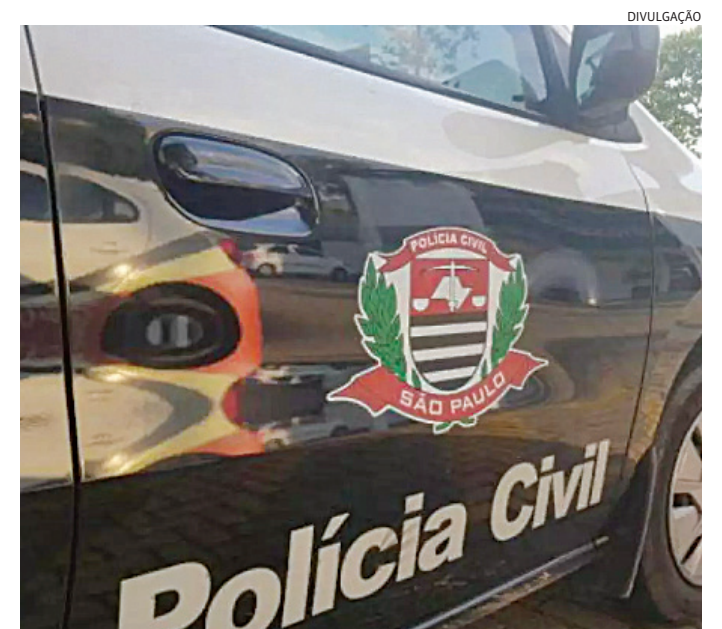
O caso será investigado pela Polícia Civil de Jundiaí

O caso foi registrado no Plantão Policial e será investigado pela Polícia Civil.