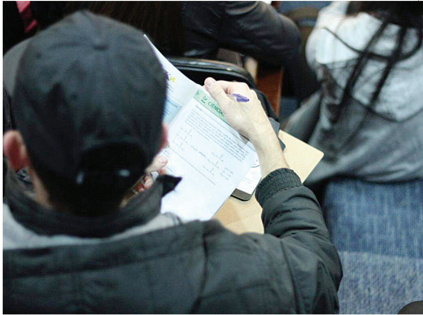
A preparação para as provas está na reta final e neste fim de semana (domingo, 3) já acontece a primeira aplicação nas escolas

As provas do Enem são aplicadas em dois domingos subsequentes, o próximo, dia 3, e também no dia 10. Na Região Metropolitana de Jundiaí (RMJ), Jari-nu é o único município que não tem local para a realização do exame. No primeiro dia, além da redação, serão aplicadas as provas de linguagens, códigos e suas tecnologias, e ciências humanas e suas tecnologias. Já no segundo dia, os participantes fazem as provas de ciências da natureza e suas tecnologias, assim como de matemática e suas tecnologias. São 45 questões em ca-