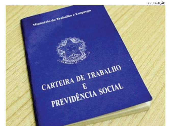
Cargos oferecidos são variados, como auxiliar, electricista e frentista

Endereço: avenida Dr. Sebastião Mendes da Silva, 901, Anhangabaú