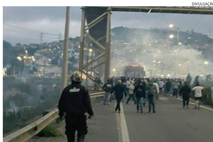
A emboscada deixou um morto e 17 feridos na madrugada do domingo (27)

Em contato com a reportagem, a Secretaria de Segurança Pública de São Paulo (SSPSP) informou que o caso foi registrado como