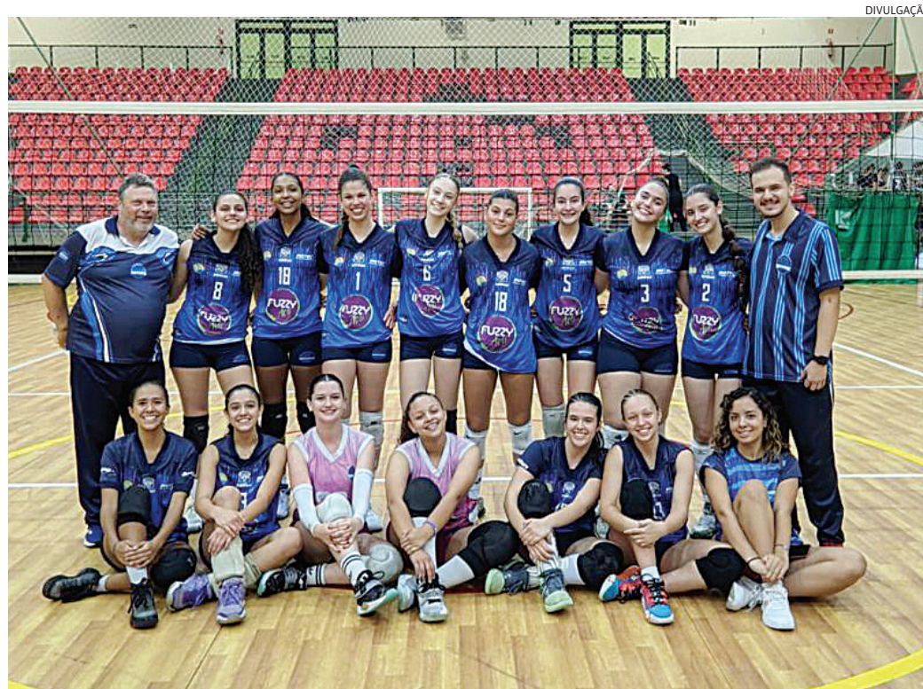
A equipe feminina sub-17 de vôlei se classificou para a final da Copinha