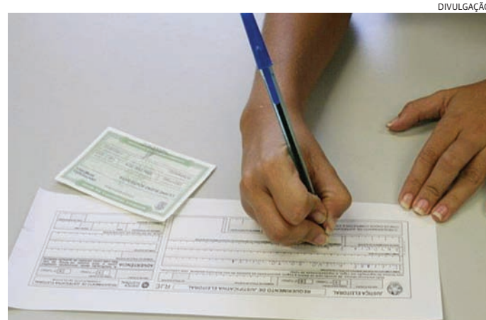
A justificativa deve ser entregue no prazo para evitar a multa

PSD - Partido Social Democrático lidera a lista de partidos com maior número de prefeitos eleitos em todo o Brasil. O partido conquistou a prefeitura de 887, dos quais cinco capitais, o que representa aumento de 35% se comparado ao resultado