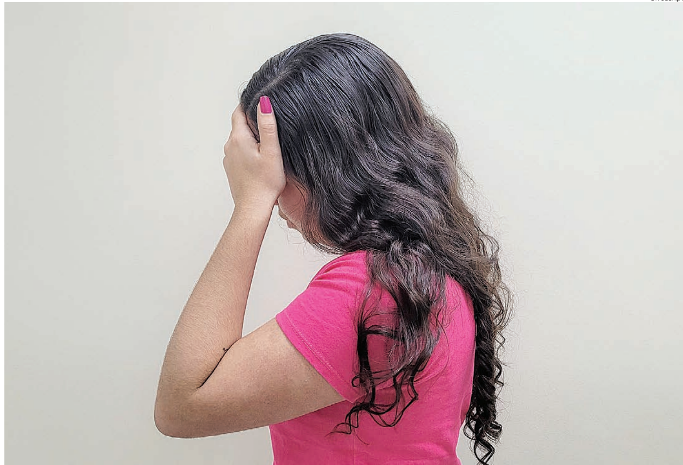
Hipertensão, diabetes, colesterol alto e tabagismo são fatores de risco para o AVC, alimentação balanceada e exercícios ajudam a prevenir a doença

Existem dois tipos de Acidente Vascular Cerebral (AVC): isquêmico e hemorrágico. O AVC isquêmico ocorre quando se forma um bloqueio em uma artéria que leva sangue ao cérebro, causando a morte das células cerebrais. Trata-se