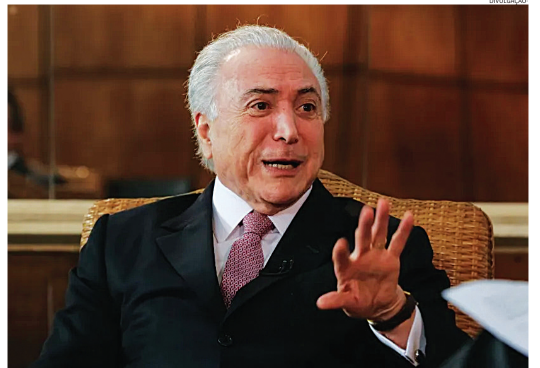
Bem-humorado, Temer descarta voltar à política

“Desde aquele episódio com o Alexandre [de Moraes, em que o ex-presidente mediu um entendimento entre o ministro do STF e Bolsonaro depois de crise em manifestação golpista no 7 de setembro de 2021], Bolsonaro me pede palpites de vez em quando. Mas nada mais do que isso”, diz Temer.