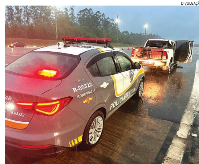
Os policiais conseguiram apreender a droga, que será destruída