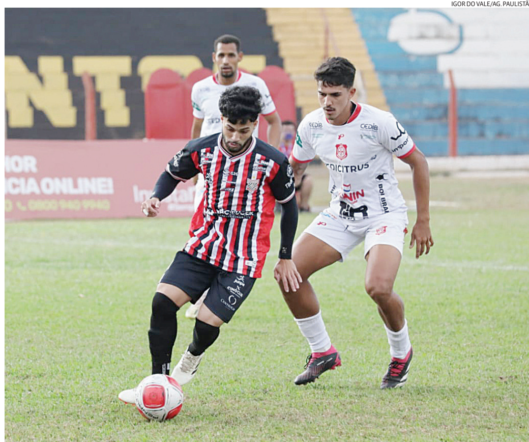
Na Bezinha, Galo e Lobo se enfrentaram 4 vezes, com duas vitórias para cada

A Federação Paulista de Futebol oficializou a participação do Araçatuba na tarde desta quinta-feira