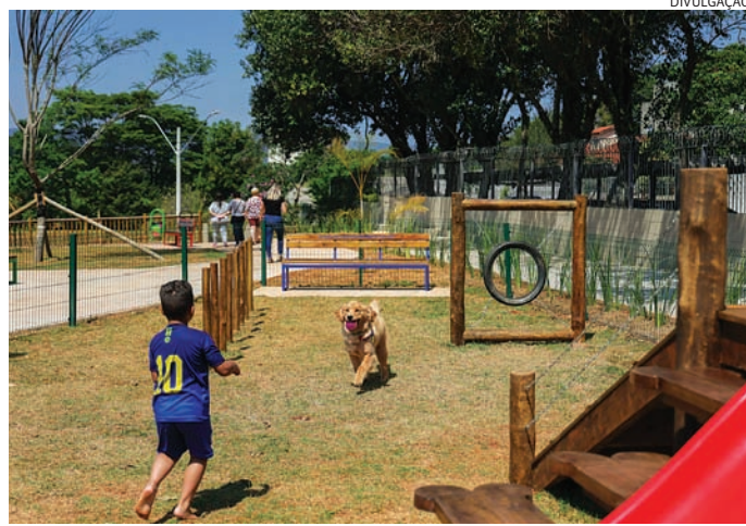
Jundiaí já conta com nove espaços dedicados e adequados aos pets

Espaços adequados para gastar a energia dos pets. A Unidade de Gestão de Infraestrutura e Serviços Públicos (UGISP), da Prefeitura de Jundiaí, avança com a conclusão de sete novos espaços dedicados para as famílias e seus animais de estimação. A previsão de entrega é até o final de 2024.