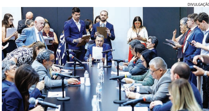
Congresso de comissões dá aval a projeto na Alesp

Na última sessão da Câmara Municipal de Jundiaí, realizada na última terça-feira (5), um cidadão jundiaieense fez uso da tribuna livre, que estava suspensa por conta do período eleitoral, e, logo após se identificar, pediu aos vereadores que fornecessem um “comprovante” que ele esteve naquele dia e local para falar, visto que ele “perdeu” um dia de trabalho para estar ali. Na sequência, já falou que se as sessões fossem realizadas à noite, com certeza ele não precisaria provar que esteve lá e que, com certeza teria mais gente assistindo às sessões. O retorno do horário noturno para as sessões ordinárias sempre foi assunto que rendeu conversas. Agora, volta a ser pauta de discussão entre um grupo de vereadores.