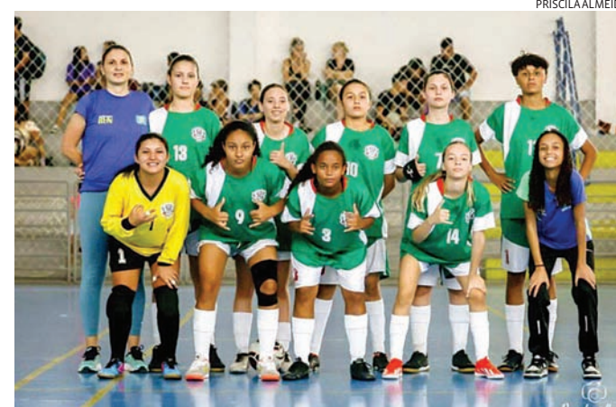
Os treinos acontecem no Complexo Esportivo Municipal

Criada em 2022, a equipe de futsal campo-limpense foi formada por alunas que participaram dos Jogos Escolares daquele ano, evento realizado pela prefeitura que visa a prática de atividades esportivas no cenário competitivo com alunos da rede educacional da cidade. Devido a alta participação de meninas na competição, a prefeitura decidiu pela criação da equipe, que desde sua criação, partici-