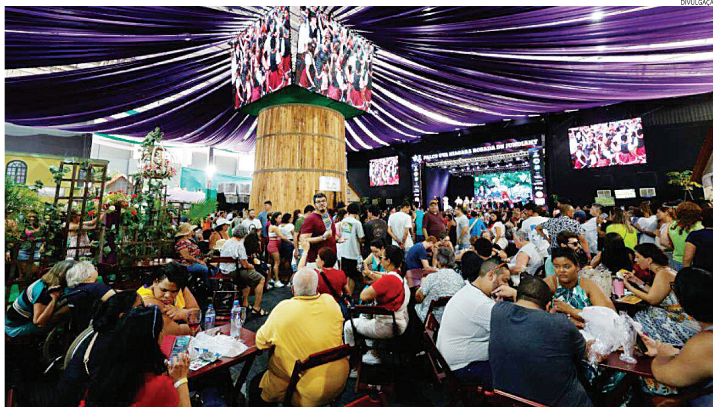
A Festa da Uva de Jundiaí acontece todos os anos entre janeiro e fevereiro, na safra da tradicional Uva Niágara Rosada de Jundiaí