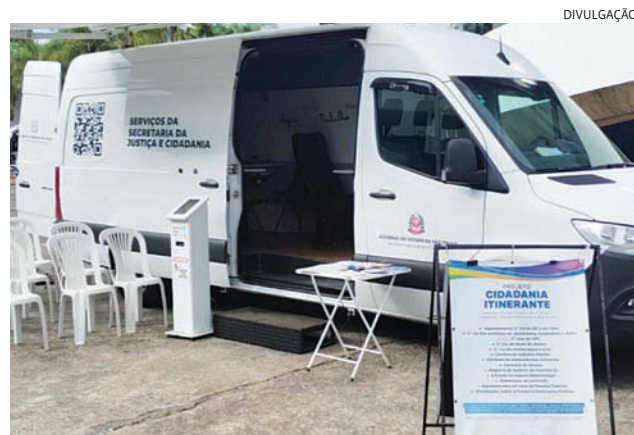
A van fica no Centro até sábado, atendendo 100 senhas por dia

Cidadania Itinerante no município de Jundiaí Data e horário: sexta-feira (8) e sábado (9), das 9h às 17h Endereço: Praça Gov. Pedro de Toledo - Centro, Jundiaí - SP Localização: https://maps.app.goo.gl/MvAd3g2BjQc34gfY8