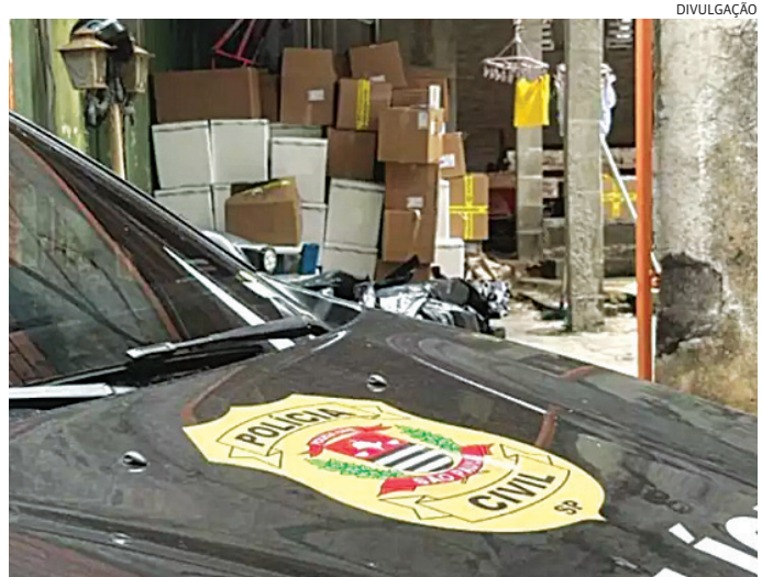
A carga foi recuperada pela DIG e devolvida à empresa

O depoimento prestado por ele deve ajudar a DIG a chegar ao restante da quadrilha, bem como elucidar outros crimes semelhantes ocorrido na região, como um que ocorreu no dia 16 do mês passado, em Itupeva. Na ocasião, a carga, também de medicamentos veterinários, era de R$ 1,5 milhão, e foi recuperada por policiais militares da 2ª Cia do 11º Batalhão, após perseguição que se iniciou na rodovia Hermenegildo Tonoli e se encerrou na Dom Gabriel Paulino Couto, em Jundiaí. O bandido motorista do furgão onde estava a carga abandonou o veículo após se chocar com defensas metálicas e fugiu por uma área de mata.