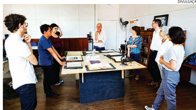
Comitiva da Universidade foi recebida pela equipe do Arquivo Histórico