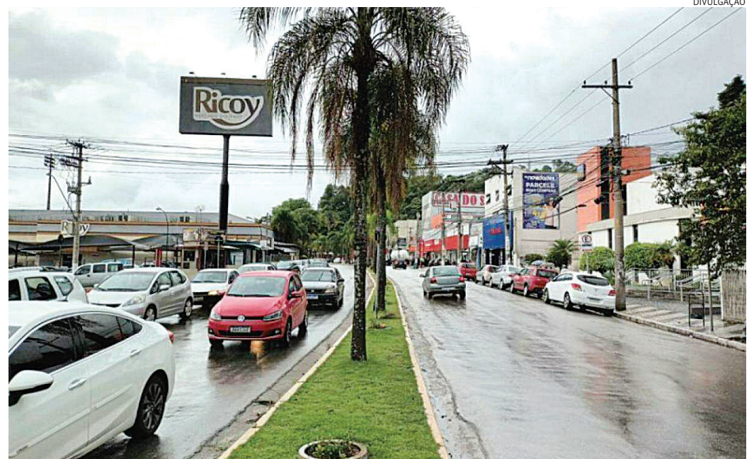
A interdição será parcial e ocorrerá de forma gradual, dividida em trechos, para minimizar o impacto no trânsito