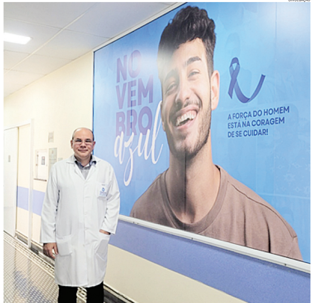
A campanha Novembro Azul é essencial para conscientização da população masculina

Campanhas como o Novembro Azul, que facilitam o acesso à informação e promovem a conscientização, são essenciais para mudar essa realidade não só durante o mês de novembro, mas o ano todo. “O desconforto de tratar uma do-