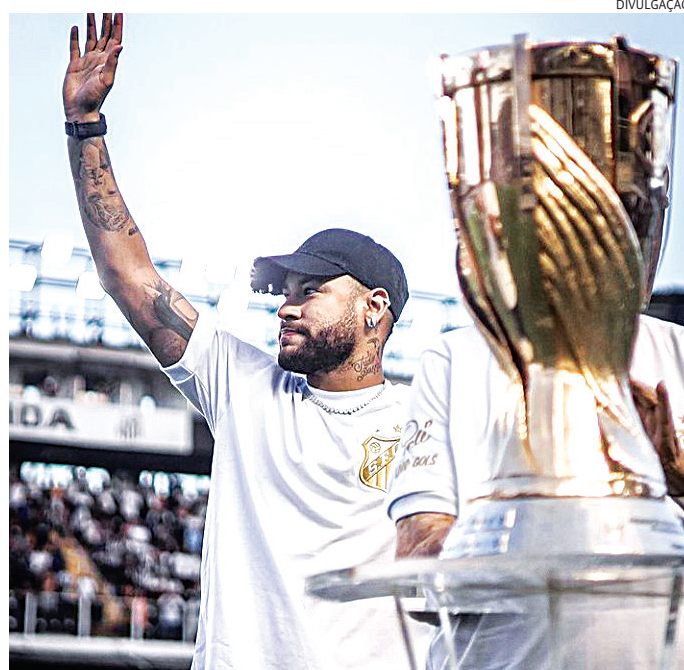
O Santos sabe que é difícil, mas tem muito otimismo no acerto

Neymar quer jogar no Santos. Ele perderia muito dinheiro nessa saída da Arábia Saudita, mas estaria onde é querido e provavelmente em alta antes da próxima Copa. O Peixe vê demonstrações espontâneas de carinho, como a ligação de vídeo para o elenco após a vitória contra o Vila Nova que encaminhou o acesso à Série A.