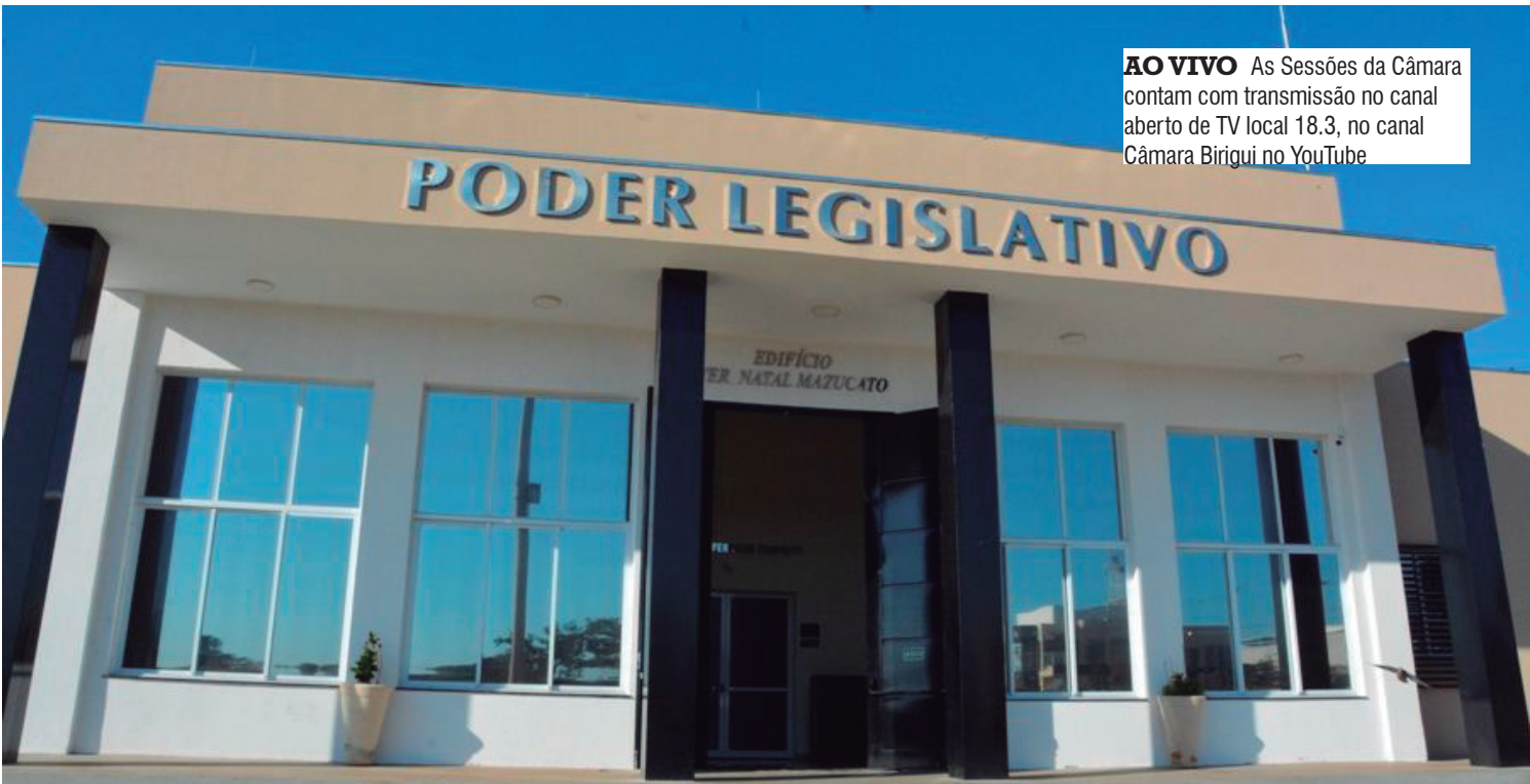
AO VIVO As Sessões da Câmara contam com transmissão no canal aberto de TV local 18.3, no canal Câmara Birigui no YouTube