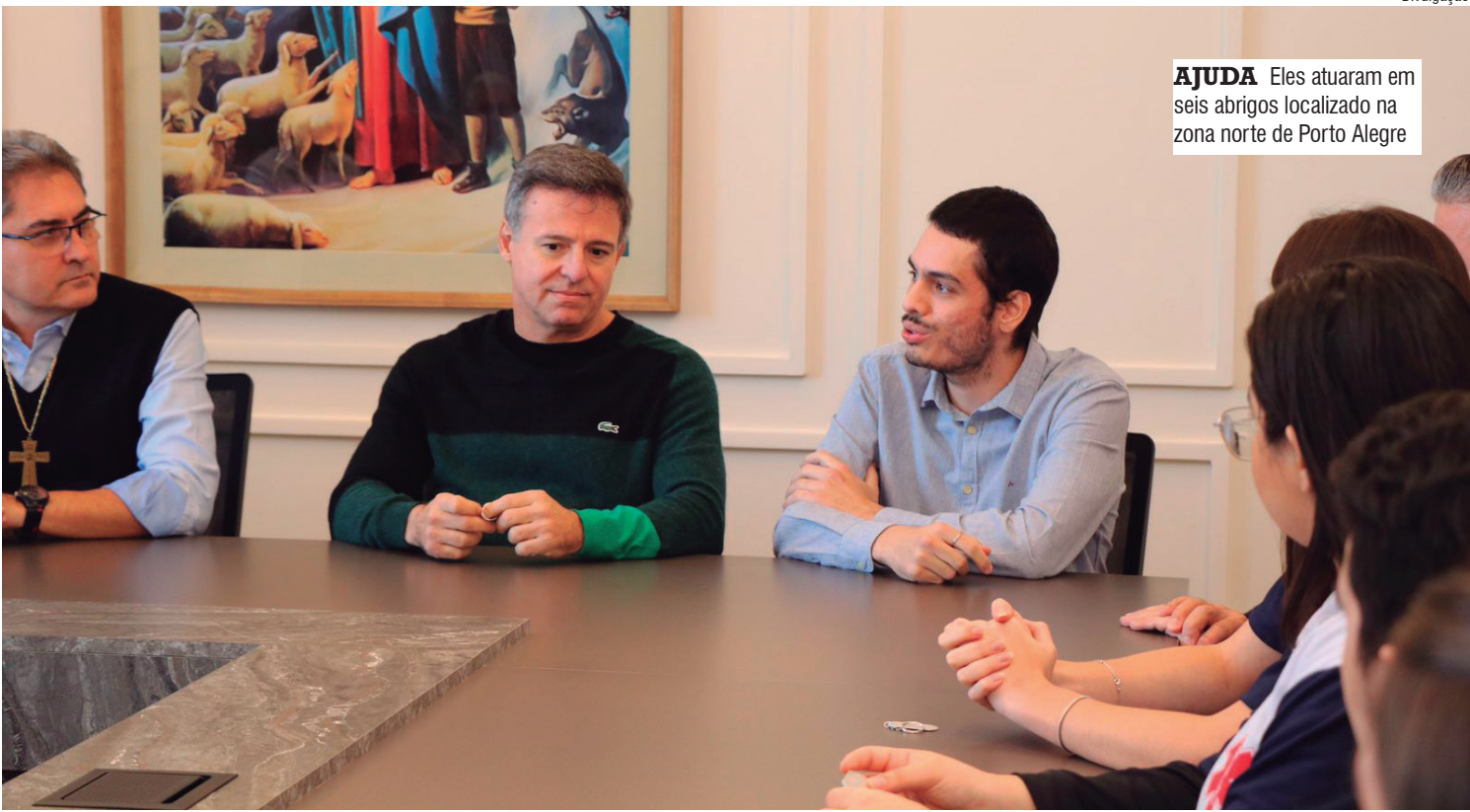
AJUDA Eles atuaram em seis abrigos localizado na zona norte de Porto Alegre