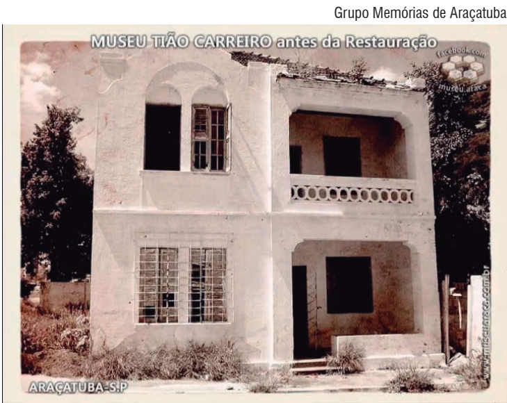
Museu Tião Carreiro

Nos últimos dias, repercutiu nas redes sociais o debate em torno do tema, com posicionamentos da atriz Luana Piovani contra a medida e do jogador de futebol Neymar Júnior a favor da PEC.