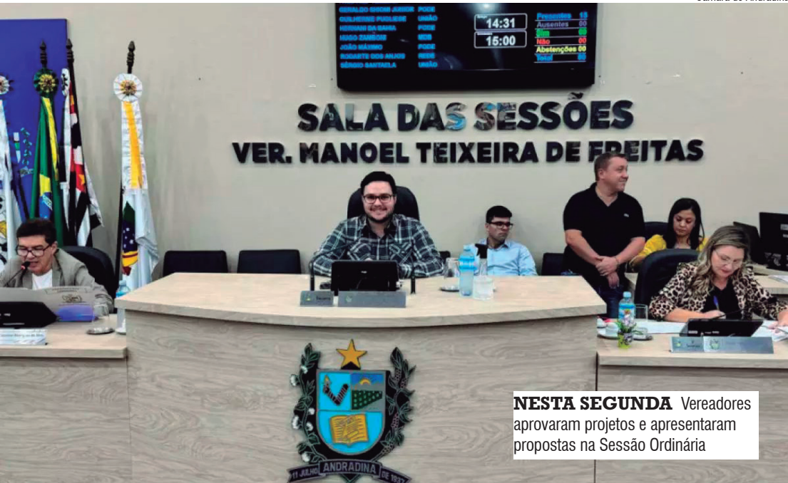
Câmara de Andradina

As Sessões da Câmara contam com transmissão ao vivo no canal aberto de TV local 18.3, no canal Câmara Birigui no YouTube e na página facebook.com/camarabirigui. Também é possível acessar a transmissão na página inicial deste site. Terminada a Sessão Ordinária, a gravação audiovisual do evento fica disponível no YouTube.