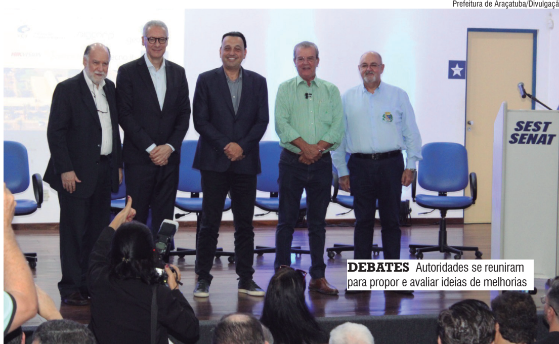
DEBATES Autoridades se reuniram para propor e avaliar ideias de melhorias

O objetivo central do encontro foi impulsionar o desenvolvimento de cidades inteligentes no estado de São Paulo, em parceria com o Governo Estadual, pautado nos pilares