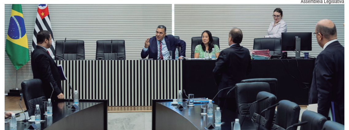
VOTAÇÃO Reunião da Comissão de Finanças, Orçamento e Planejamento da Alesp

Público complementa os recursos para o custeio dessas tarifas junto às empresas e concessionárias de água e energia do Estado.