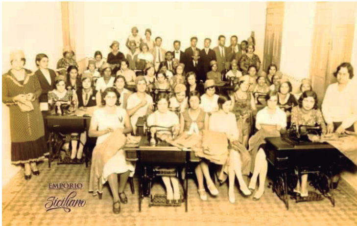
Casa da Costura