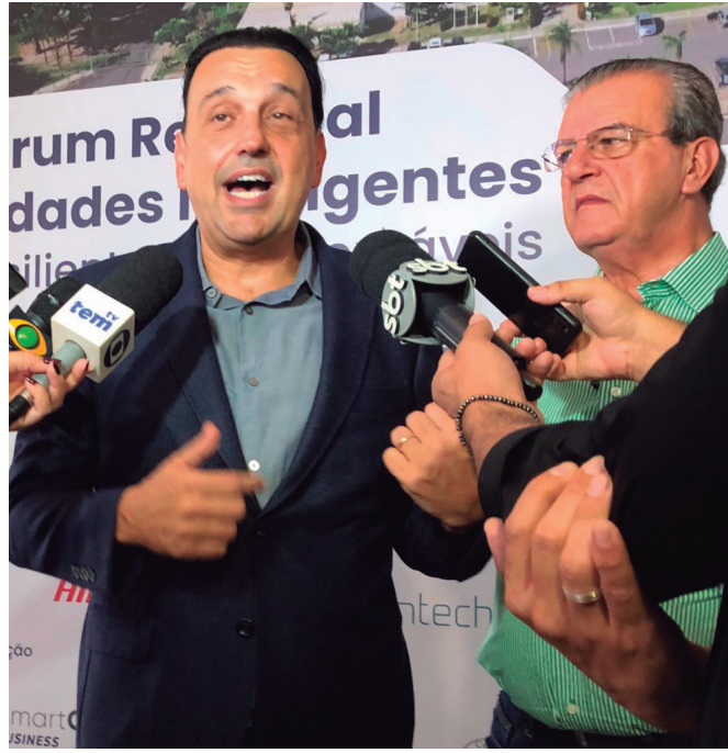
ESPERANÇA Felício Ramuth falou em valorização das ferrovias

do problemas nos municípios, pois as linhas passam por dentro das cidades e estão descuidadas. O vice-governador ressaltou a importância da reativação das ferrovias para a economia, destacando o potencial de contribuição para as cadeias produtivas, especialmente no escoamento e logística de mercadorias. A expectativa é que o projeto de reativação da Malha Oeste traga investimentos substanciais, podendo alcançar entre cinco a seis bilhões de reais, embora o modelo exato ainda não esteja definido.