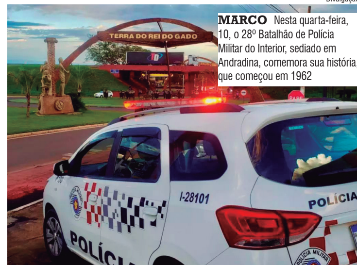
MARCO Nesta quarta-feira, 10, o 28º Batalhão de Polícia Militar do Interior, sediado em Andradina, comemora sua história, que começou em 1962

Em janeiro de 2006 iniciou-se a construção da sede do Batalhão, situada na avenida Barão do Rio Branco, 405, no Parque Santo Antônio, inaugurada em 28 de dezembro de 2006. A construção, feita a partir do terreno doado pelo município, representou um marco nas atividades da Unidade, porque é sob o teto dela,