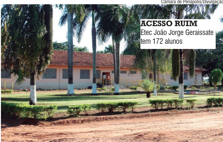
ACESSO RUIM Etec João Jorge Geraissate tem 172 alunos

Araçatuba, SP Da Redação pautasfr@gmail.com