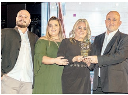
Açougue: Neco Empório da Carne