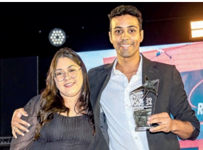
Retífica: Retífica Foco