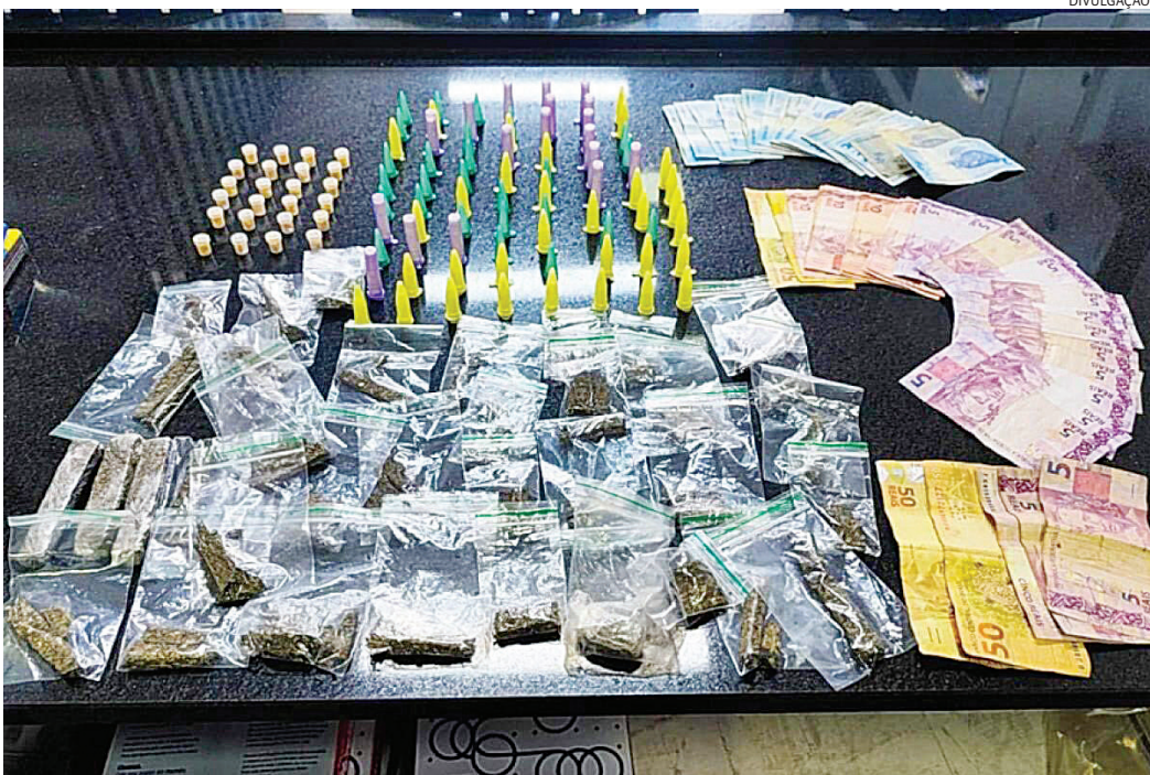
As drogas foram apreendidas pelas GMs e apresentadas na delegacia

Enquanto desenrolavam a ocorrência, um homem apareceu se apre-