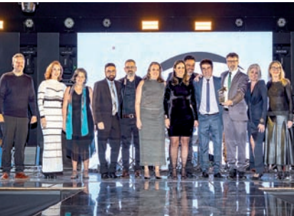
Complexo Cultural e Esportivo: Sesc Jundiaí