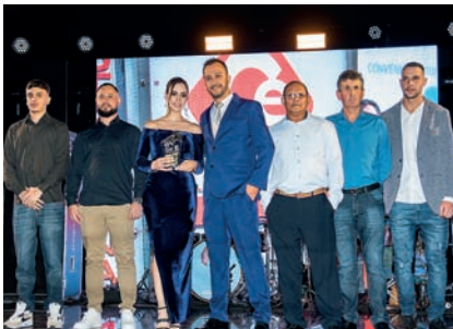
Estacionamento: Estacionamento Central