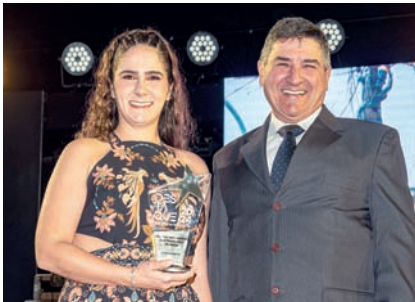
Clínica Veterinária: Clínica Veterinária São Francisco de Assis