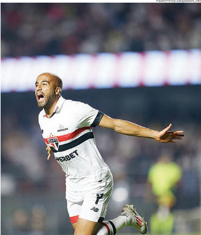
O Tricolor vem de vitória contra o Grêmio, pela última rodada

treinador é o atacante Calleri, que segue como dúvida para a partida desta tarde e o mais provável é que ele não seja relacionado para o duelo. O centroavante sentiu incômodo muscular na parte posterior da coxa direita diante do Grêmio e