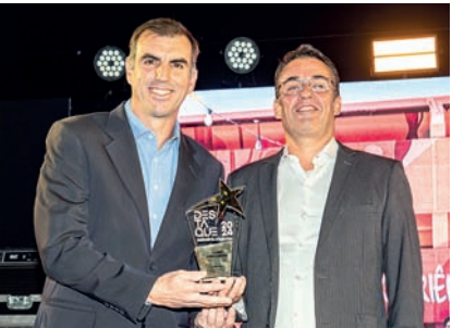
Clube Social: Clube Jundiaense