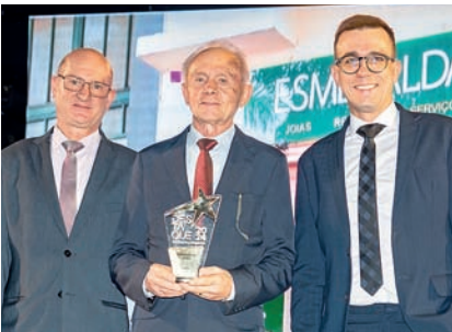
Joalheria: Esmeralda Joias