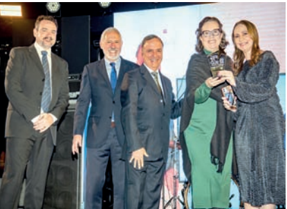
Construtora: Tebas Incorporadora