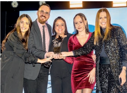
Emissora de TV: TV Tem