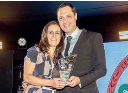
Cervejaria e Chopperia: Giffa Imperial Cervejaria