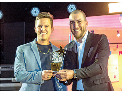
Açaiteria: Açai da Cidade

Confira a relação completa das categorias eleitas no Prêmio Destaque Caixeiro-Viajante 2024: