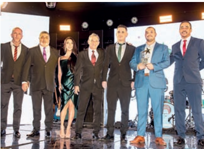
Pizzaria: Verace Cantina e Pizzeria Italiana