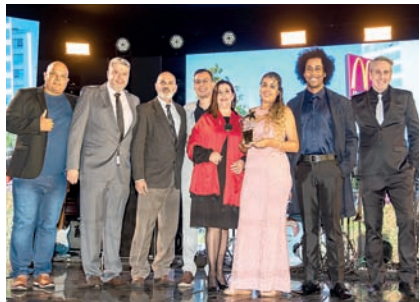
Fast Food: McDonald's