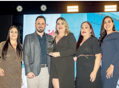
Clínica Popular: Amor Saúde