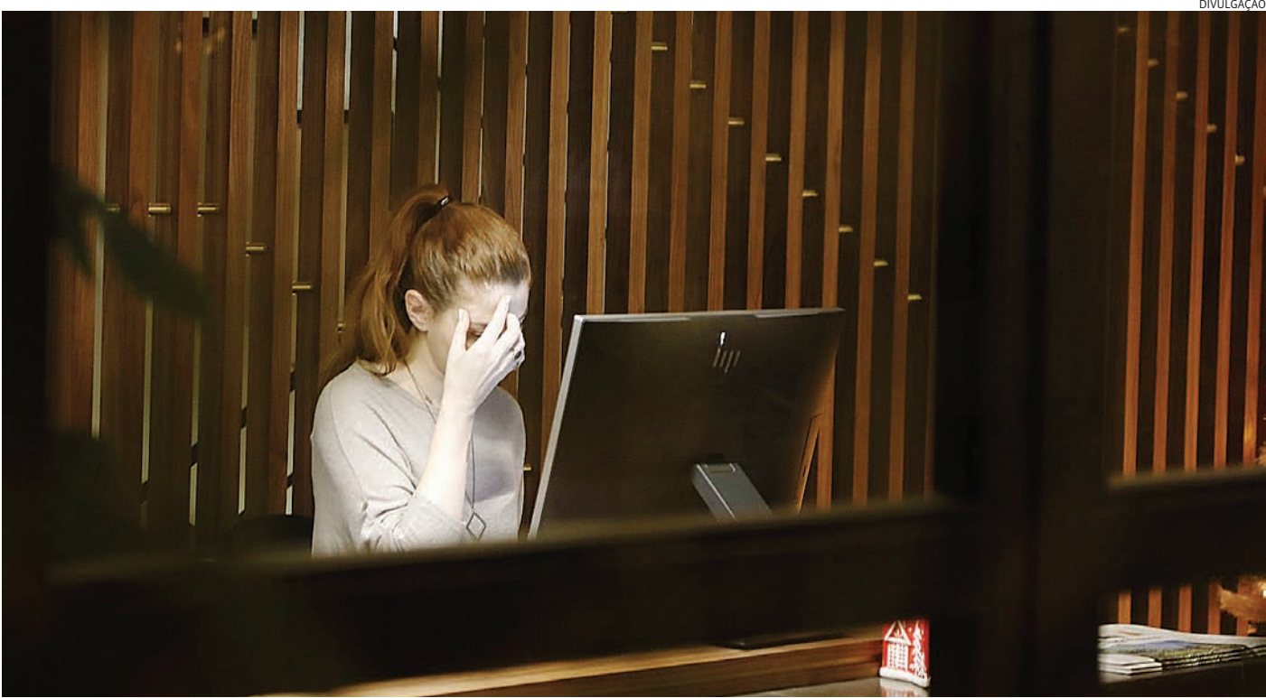
As promoções no trabalho geralmente são acompanhadas de uma carga maior de trabalho e responsabilidade