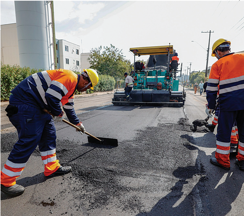
O programa chegou a 85% de execução e a expectativa é requalificar vias de aproximadamente 27 bairros

A requalificação de vias é realizada desde o início da gestão, sejam elas urbanas ou rurais. Em fases anteriores do Mais Asfalto, foram feitos mais de 999 mil