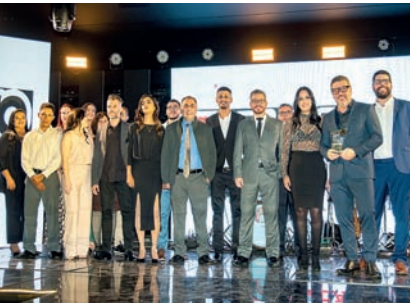
Concessionária de Motos: Mila Moto