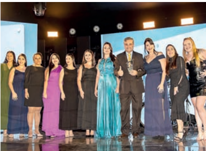
Escritório de Contabilidade: Barão Contábil