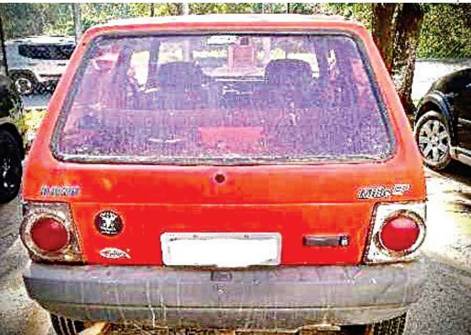
O carro foi localizado no bairro Jardim Santo Antônio

A ação foi coordenada entre o CCO e a GCM de Campo Limpo Paulista.