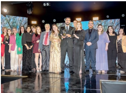
Laboratório de Análises Clínicas: Fleming Laboratório