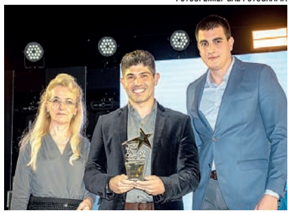
Administradora de Imóveis e Condomínios: Mediterrâneo Negócios Imobiliários