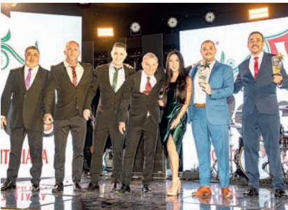
Restaurante Italiano: Verace Cantina e Pizzeria Italiana