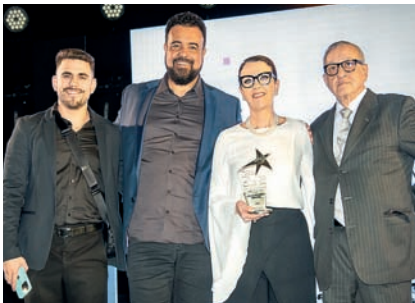
Jornal: Jornal de Jundiaí Regional