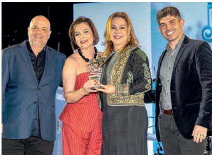
Imobiliária: Mediterrâneo Negócios Imobiliários