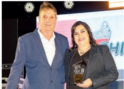
Restaurante de Comida Chinesa: China In Box