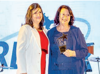
Agência de Turismo: Florestur Viagens e Turismo