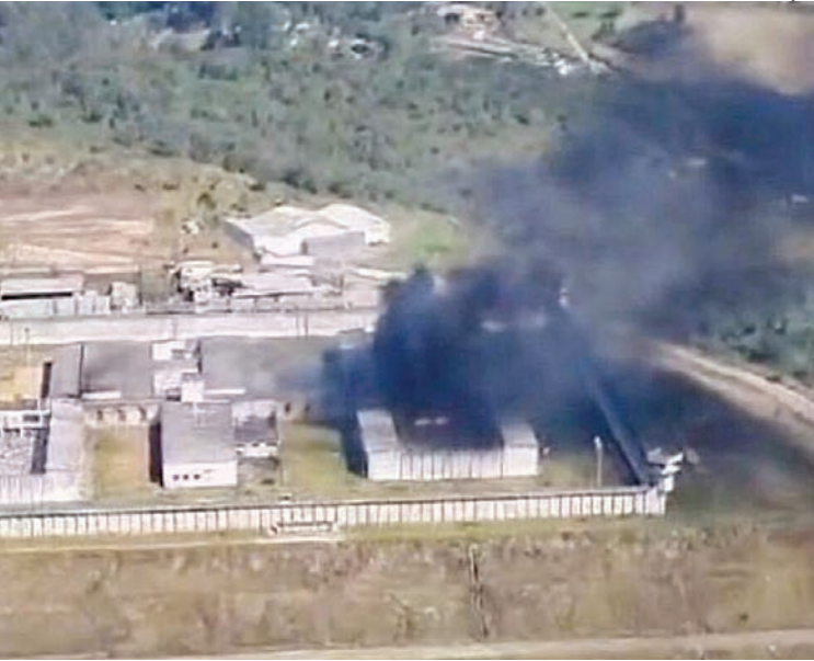
Agentes usaram balas de borracha para conter os presos

O motim teria sido motivado pela condição do local. Presos escreverem em