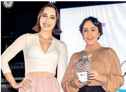
Farmácia de Manipulação: Almaderma