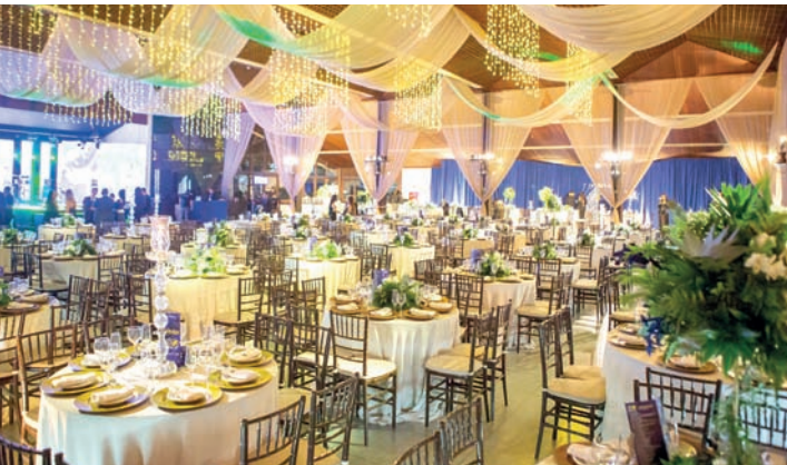
Decoração luxuosa no Clube Jundiense