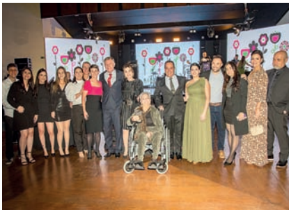
Parada Obrigatória: Kiosque Roseira