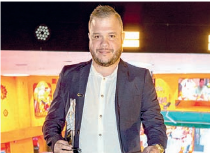
Comércio de Variedades: Maravilhas do Lar