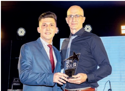
Comércio de Acessórios Automotivos/Autopeças: Josecar