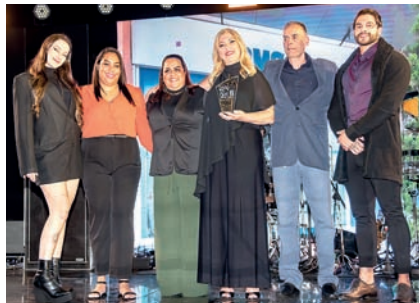
Lavanderia: Lavanderia Omo Nove de Julho