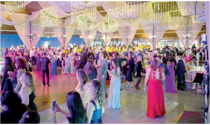
Público se divertiu com performance de ilusionista e atrações musicais