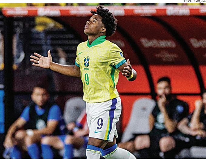
O evento vai acontecer no dia 27 de julho, às 17h

A programação de Endrick inclui a apresentação no próximo dia 27 e viagem a Chicago no dia 28, onde a equipe inicia uma excursão pelos EUA, em pré-temporada.