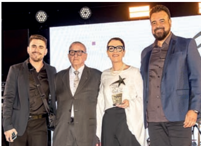
Rádio AM: Rádio Difusora (810 AM)