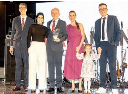
Restaurante Marmitex: La Bambina