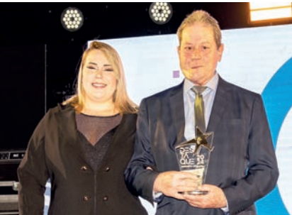
Comércio de Gases Industriais: Oxi-Gêneses