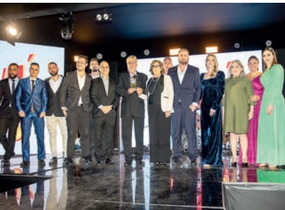
Food Service: Traviú Alimentos