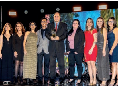
Escola de Ensino Profissionalizante: Senac Jundiaí