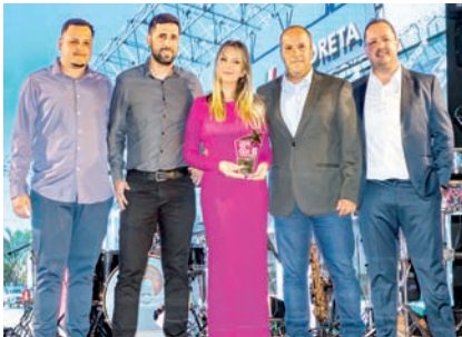
Concessionária de Veículos: Grupo Andreta