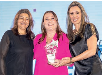
Instituto de Ensino Superior (particular): Anchieta