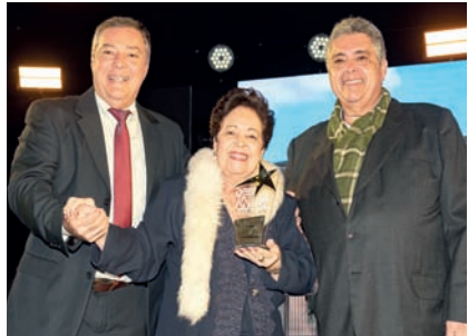
Casa de Chocolates: D'Viez