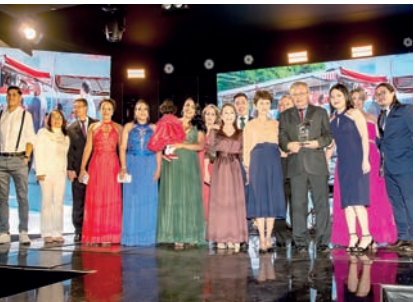
Pastelaria: L & F Pastéis