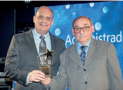
Administradora de Planos de Saúde: Pentágono Administradora de Benefícios e Planos de Saúde

te Executivo da Federação do Comércio de Bens, Serviços e Turismo do Estado de São Paulo (FecomercioSP) e para