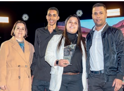
Hortifruti: Oba Hortifruti