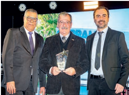
Corretora de Seguros: Gebram Corretora de Seguros