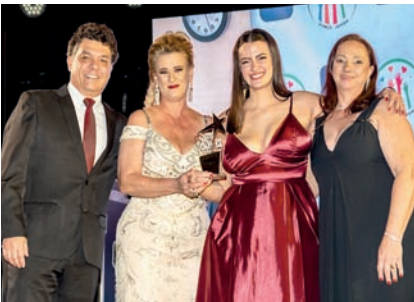
ONG: Força Jovem