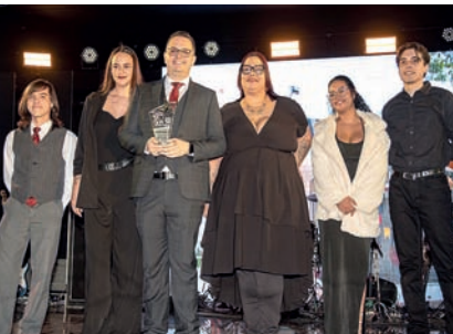
Escola de Idiomas: Wizard Jundiaí