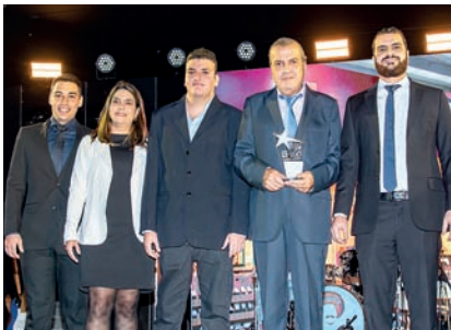
Restaurante de Comida Árabe: Andaluz Gastronomia