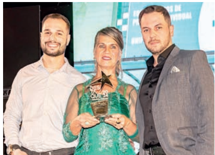
Venda de Equipamentos de Proteção Individual: Prot Línea