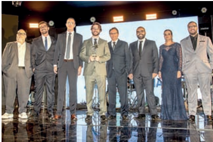
Cartório: 2º Oficial de Registro de Imóveis, Títulos e Documentos e Civil de Pessoa Jurídica da Comarca de Jundiaí