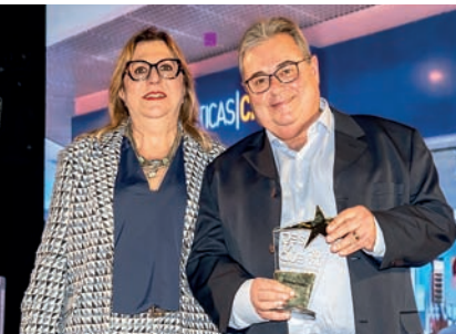
Ótica: Óticas Carol