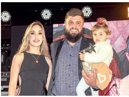
Adega: Adega Maziero