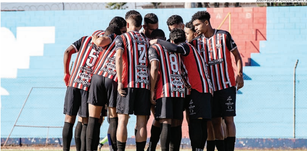
O Paulista dominou o primeiro tempo e desperdiçou muitas chances boas, mas a equipe conseguiu vencer