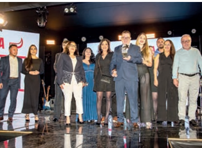
Restaurante Tradicional: O Bom da Picanha