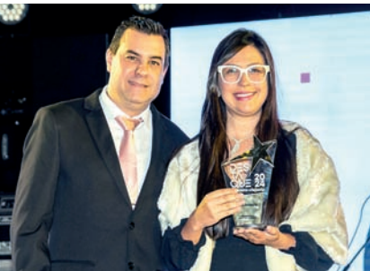
Distribuidora e Indústria de Bebidas: CRS Brands