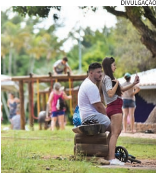
Jundiaí soma 68,54 pontos, segundo análise feita pela pasta

Entre as cidades de 200 mil a 500 mil habitantes, Jundiaí figura na nona posição no ranking o Índice de Progresso Social (IPS), lançado através de uma colaboração entre o Instituto do Homem e do Meio Ambiente da Amazônia (Imazon), Fundação Avina, Centro de Empreendedorismo da Amazônia, iniciativa Amazônia 2030, Anattá - Pesquisa e Desenvolvimento, e o Social Progress Imperative. O indicador tem por objetivo avaliar as cidades em vários segmentos que promo-