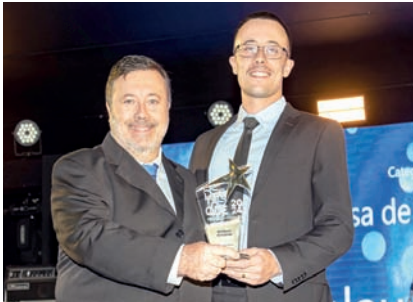
Casa de Baterias: Batelau Baterias