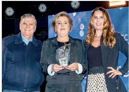
Comércio de Colchões: Good Dream Colchões