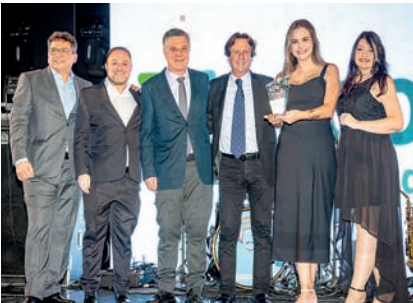
Cooperativa de Crédito: Sicoob CDL Jundiaí