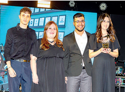
Agência de Publicidade: Agência Urso