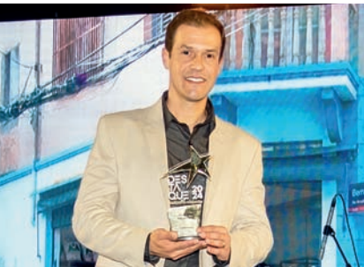
Loja de Tecidos: Lojas dos Velhinhos