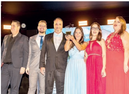
Vacinas: Trivacin Premium