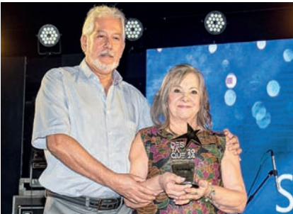
Clínica Capilar: Slim Capilar