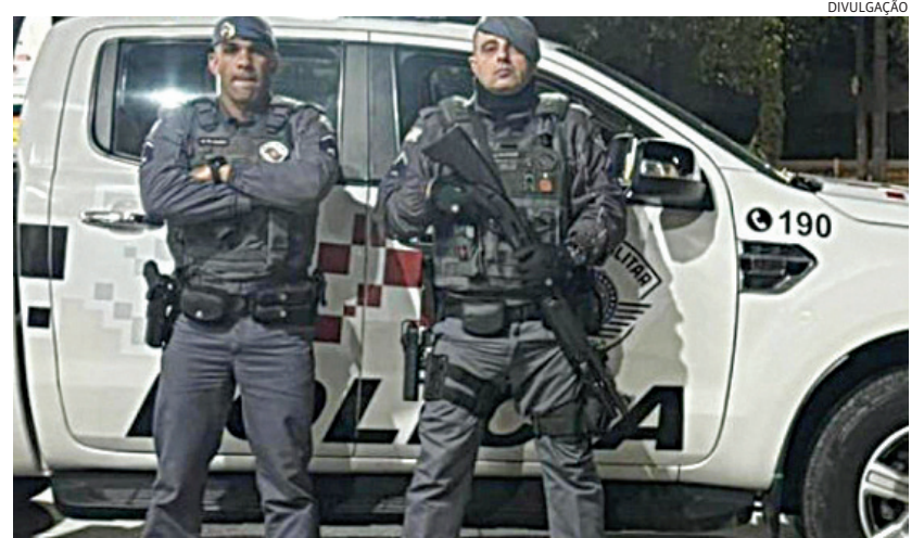
Bandido também tinha condenação por tráfico de drogas

assassinato brutal de uma professora em Nazaré Paulista, em 2017, foi capturado neste domingo (26), em Itatiba, por policiais militares da 2ª Cia do 49º Batalhão. Polícia 6