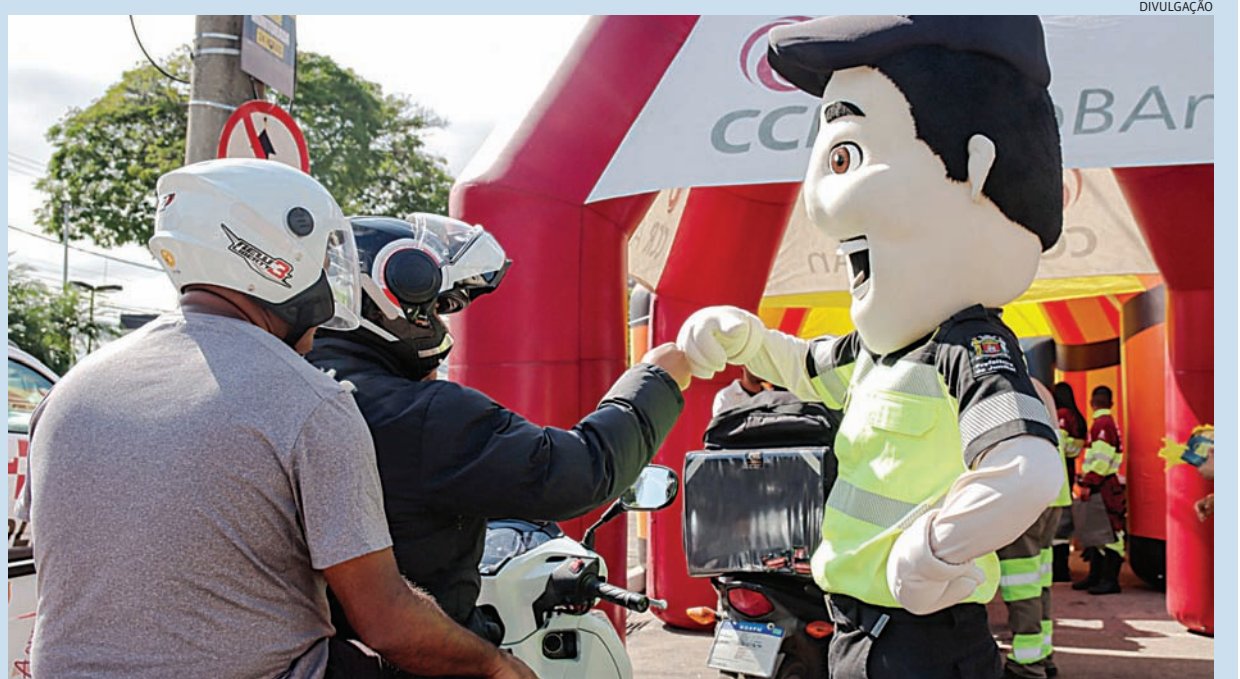
"Maio Amarelo" é uma campanha de conscientização para redução de acidentes de trânsito

associarão suas marcas em campanhas educativas e ações a serem realizadas em vários bairros de Jundiaí. Cidades 4