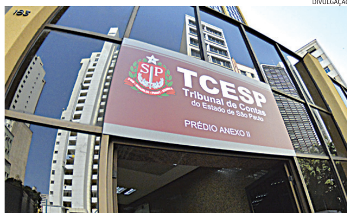
TCE fez manual para que municípios lidem corretamente com este recurso

Na esfera federal, as apurações de desvio de finalidade relacionadas a esses gastos são alvo de inquérito no STF, STF (Supremo Tribunal Federal), com decisões do ministro Flávio Dino que chegaram até, no ano passado, à suspensão desses repasses para algumas prefeituras.