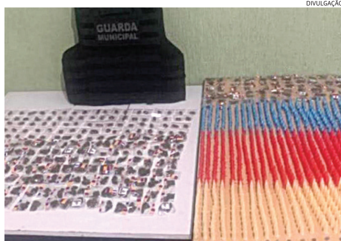
Ele confessou que estava no local traficando entorpecentes

Ele confessou que estava no local traficando entorpe-