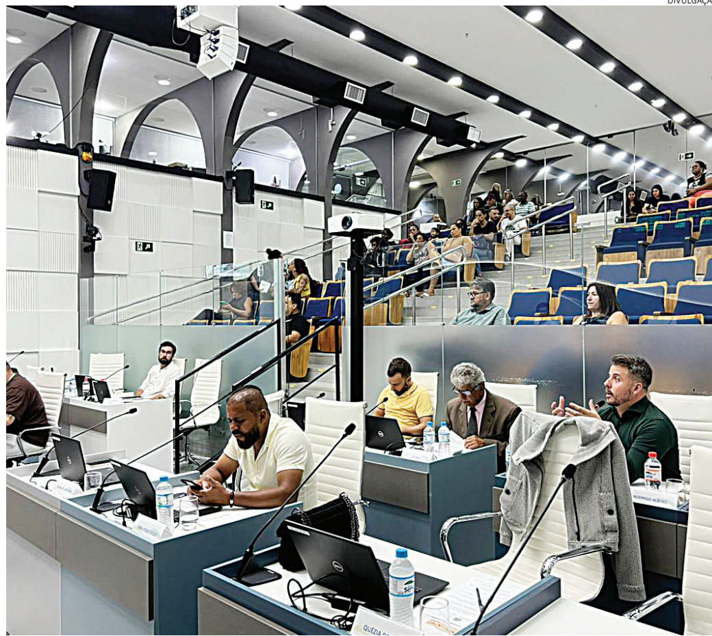
Sessão da Câmara irá analisar veto à liberdade religiosa nas escolas

A proposta trata da criação de diretrizes para combater a intolerância religiosa em escolas públicas e privadas do município. Segundo o autor, a casa entende que são imprescindíveis campanhas educativas