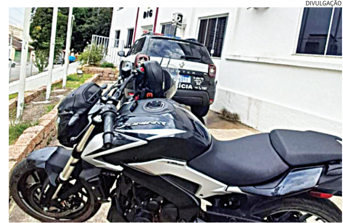
O veículo foi recuperado pelos policiais civis

vestigadores foram até o local e o prenderam. A motocicleta foi recuperada em uma área de mata.