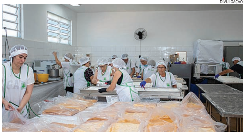
Tradicional bolo de Santo Antônio pode ser reconhecido como patrimônio imaterial

Bolo de Santo Antônio como patrimônio cultural imaterial do município. A audiência pública terá como principal objetivo ouvir a população e reunir contribuições que fortaleçam o reconhecimento dessa manifestação cultural. Cidades 5