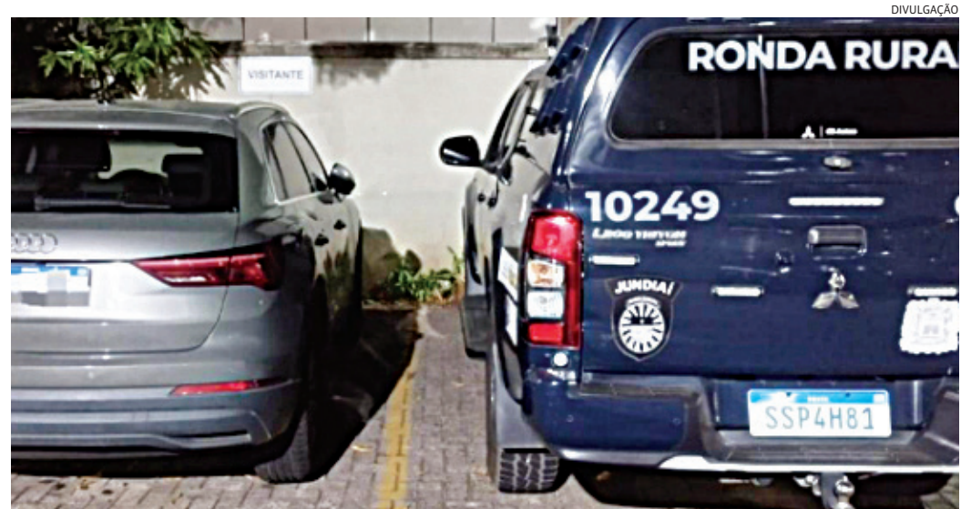
O veículo foi apreendido pelos GMs

Após a confirmação do crime, ele foi conduzido à delegacia, onde teve a prisão ratificada, sendo posteriormente encaminhado ao