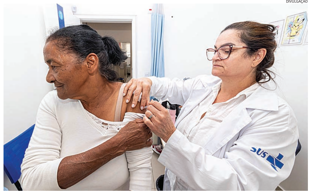
Para conter a onda de internação, vacinas são reforçadas

A vacina contra a gripe está disponível em todas as 35 unidades de saúde do município, incluindo Unidades Básicas de Saúde (UBSs) e Clínicas da Família. A imunização é destinada aos públicos prioritários definidos pelo Ministério da Saúde, como crianças