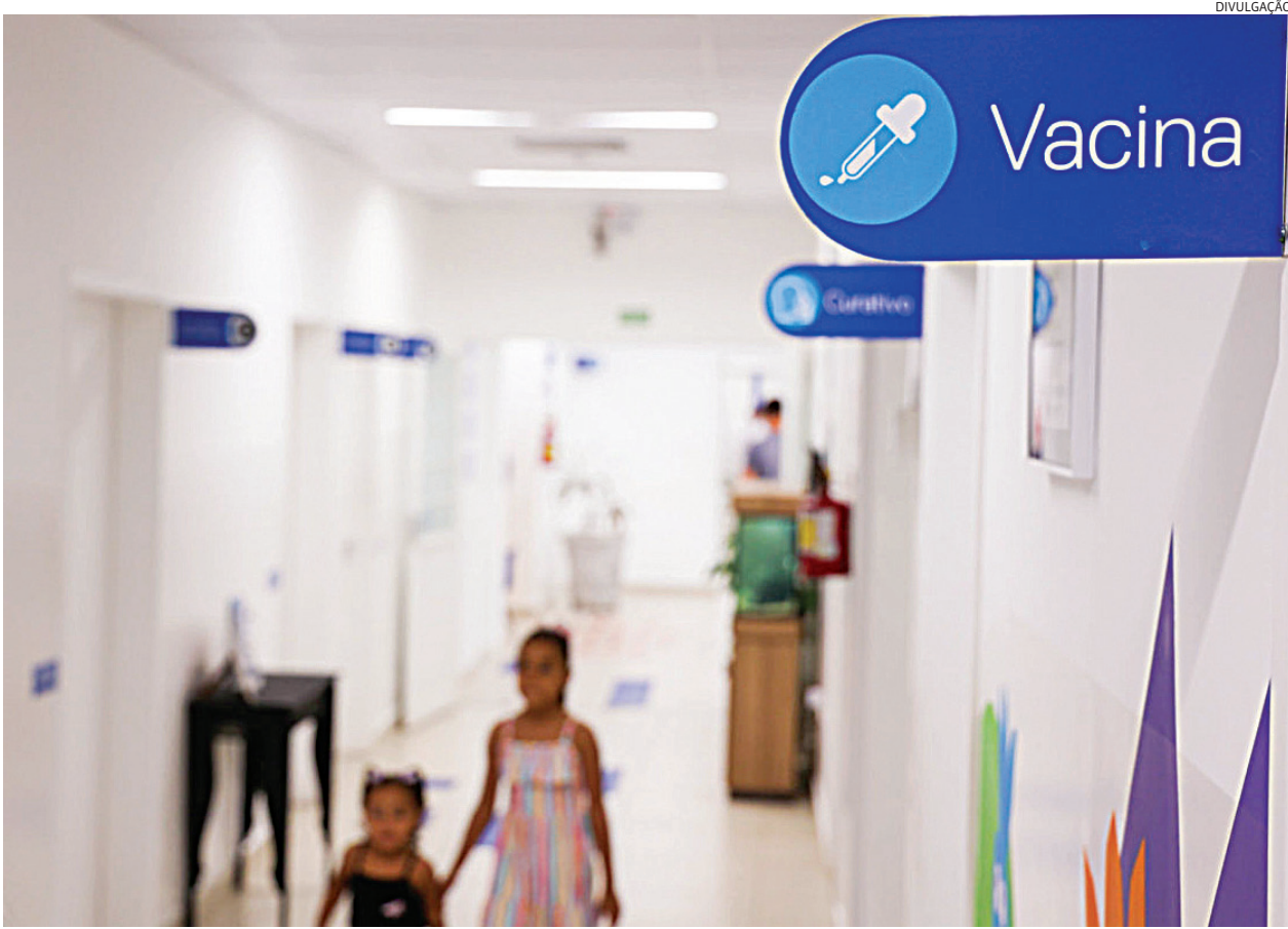
A cobertura prioritária está abaixo das médias estadual (55,11%) e nacional (54,15%)

Jundiaí tem somente 28% de cobertura vacinal contra a gripe. De acordo com dados atualizados da Secretaria de Promoção da Saúde, 12,41% das crianças de 6 meses a menores de 6 anos já foram vacinadas (3.483 de um total de 28.068). Entre as gestantes, a cobertura é de