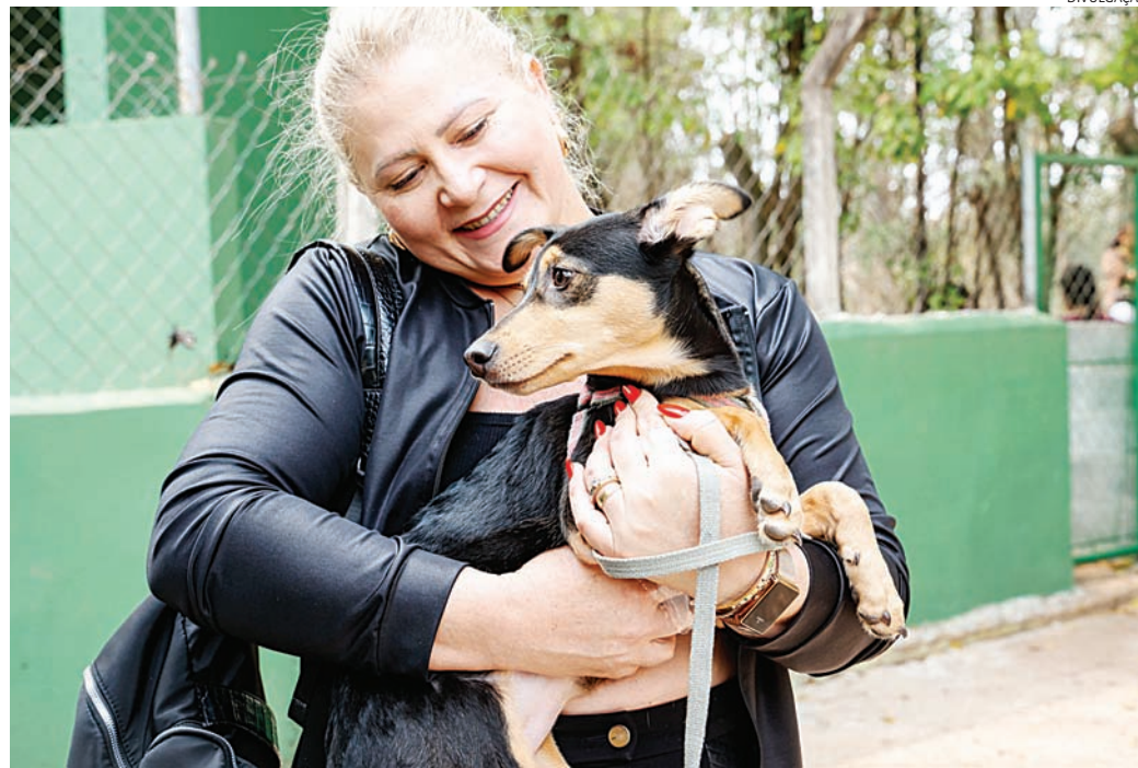
Os departamento responsáveis devem ser acionados

O Debea realiza a adoção de cães e gatos abrigados. O processo inclui entrevista