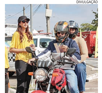
A data tem como foco diminuir os índices de acidentes

O Maio Amarelo é um movimento internacional que tem por objetivo colocar a segurança viária em evidência. A cor amarela simboliza atenção e alerta, reforçando a importância da educação como fer-