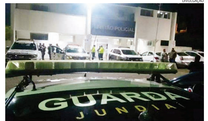
O agressor foi preso em flagrante e segue à disposição da Justiça

Testemunhas relataram que ouviram gritos vindos do quintal de uma residência e, ao intervir, conseguiram deter o agressor até a chegada da polícia. Segun-