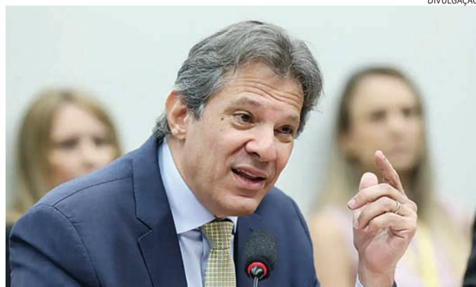
Equipe do ministro Haddad afirma que irá buscar novas receitas

Boa parte da deterioração nesse indicador é atribuída ao aperto na política monetária. Quase metade da dívida federal é atrelada à taxa básica de juros, a Selic, que já subiu a 12,25% ao ano e tem mais dois aumentos de um ponto