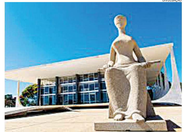
STF: com ajuda da tecnologia, há anos os ministros trabalham nas férias

Dino acionou a Polícia Federal para apurar irregu-