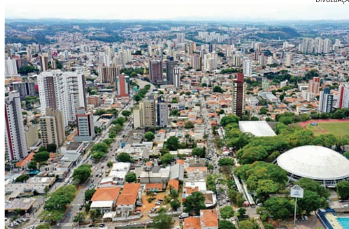
Este ano, a tendência é desaceleração imobiliária continuar

Principal ponto de comércio em Jundiaí, o Centro vem tendo uma movimentação pessimista nos últimos anos, com diversos imóveis desocupados. De acordo com análise da Fundação Instituto de Pesquisas Econômicas (Fipe), cidades de médio e grande portes têm parte desse movimento irreversível, pois as novas ferramentas e tecnologias tornam mais econômico para empresas operarem sem uma sede tradicional, especialmente as de menor porte. Há também outros fenômenos em paralelo, como migração de empresas para outros bairros ou cidades, onde o preço dos imóveis é mais barato. Por outro lado, uma maior ocupação de espaços comerciais depende também de uma di-