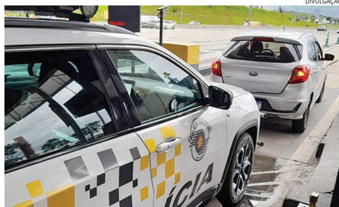
Uma mulher conseguiu escapar de um sequestro em andamento na rodovia

A equipe fez contato com o solicitante, que relatou que sua mãe estava sendo mantida refém e próxima a um parque de diversão, em Itupeva, sem saber o local exato. Logo após, o solicitante informou que sua mãe conseguiu sair do carro perto da praça de pedágio de Itupeva, na Rodovia dos Bandeirantes. A