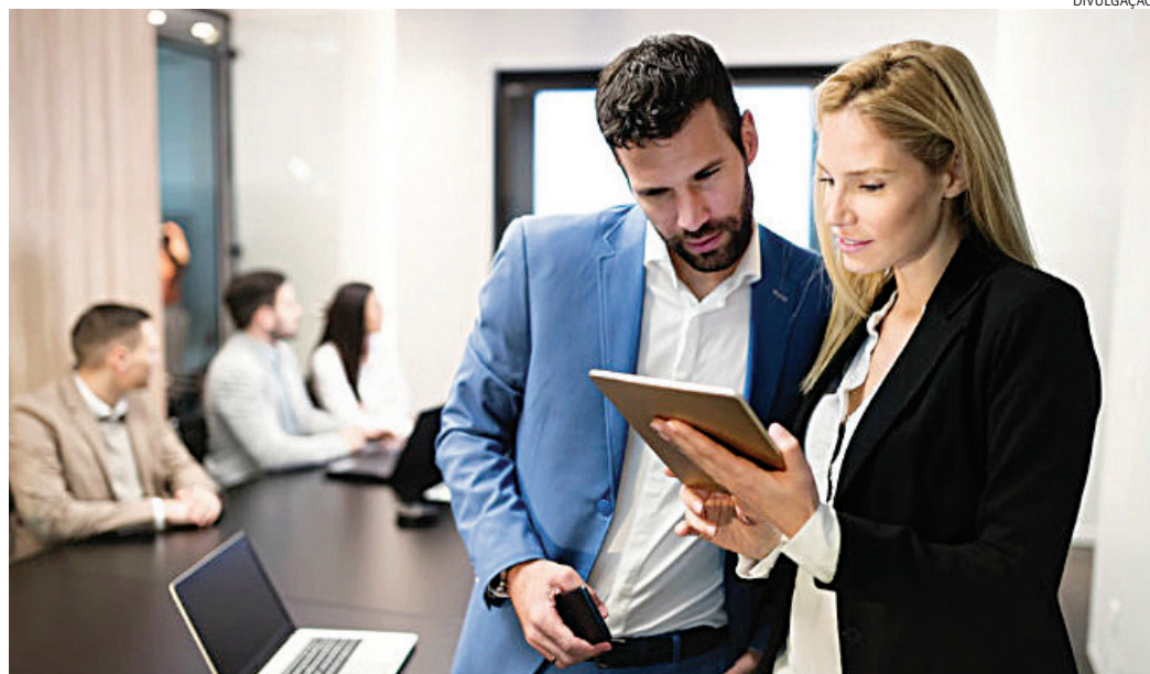
Brasileiros estão otimistas com o uso da IA, prevendo aumento de empregos