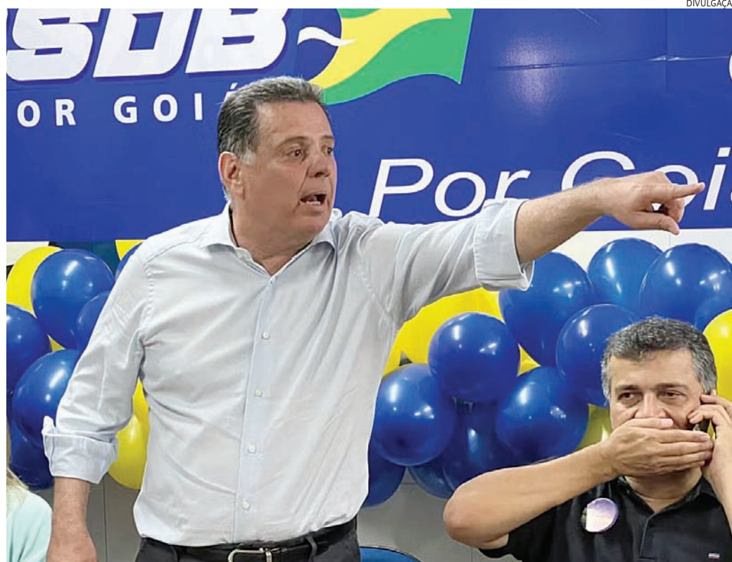
O PSDB, presidido por Marconi Perillo, cederá um fundo partidário de R$ 147 milhões à nova sigla