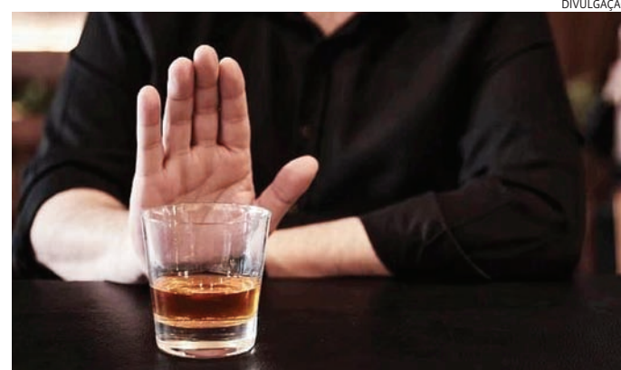
Sem álcool, corpo melhora absorção de nutrientes e diminui insulina