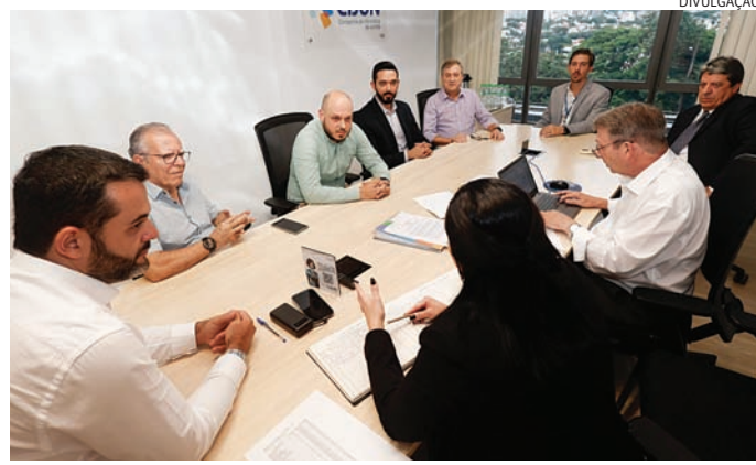
Cijun elege conselheiros para nova administração

"Esses conselhos são fundamentais para a nova gestão da companhia, pois os membros escolhidos estão alinhados com os valores e objetivos estabelecidos em nosso governo, focado no