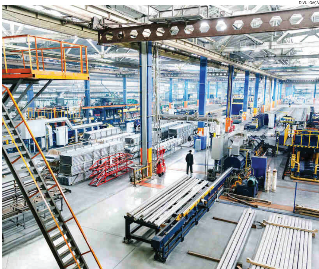
Indústrias e agropecuária puxaram a alta no consumo em novembro, exportações recuperaram crescimento

O expressivo crescimento da importação de 18,8% no trimestre móvel fechado em novembro resulta da expansão em todos os seus segmentos. Destaca-se que apenas a importação de bens intermediários respondeu por metade da alta das importações.