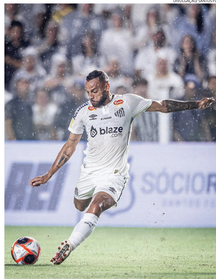
Santos encara mais um jogo duro em busca da liderança

Em muitos momentos da partida, o Santos se mostrou frágil defensivamente e cedeu diversas oportunidades claras ao Mirassol, que só conseguiu passar por Gabriel Brazão através de uma co-