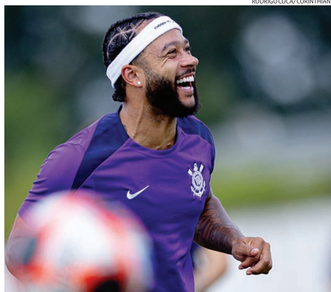
O atacante Memphis Depay deve ganhar minutos no jogo de hoje

Contra o RB Bragantino, nomes como Hugo Souza, Gustavo Henrique, Félix Torres, Matheus Bidu, Igor Coronado e Memphis Depay sequer viajaram com a delegação. Ramón, entretanto, não descartou que alguns deles estejam em condições de defender a equipe no jogo de hoje.