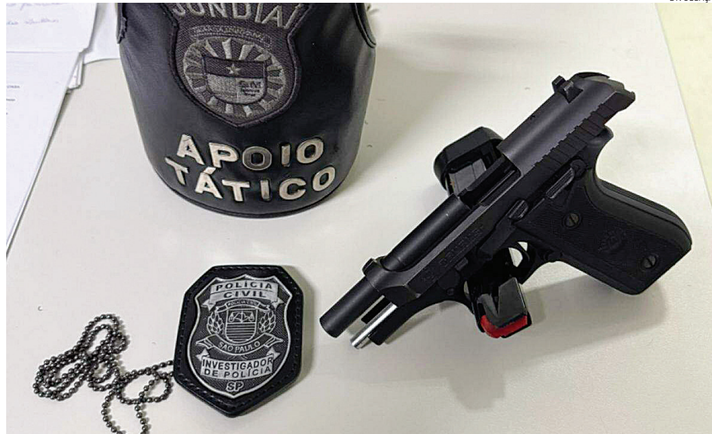
O empresário tinha o registro da arma, mas perdeu o direito ao uso

A vítima foi até a DDM informando que soube por um amigo, que seu ex-marido estava na farmácia, nervoso e possivelmente sob efeito de drogas, fazendo ameaças contra ela e sua família. As ameaças, inclusive, foram enviadas também por áudios através do celular e davam a entender que ele havia 'encomendado' a mor-