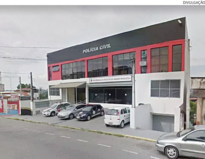
Os policiais o prenderam em flagrante por tráfico de drogas