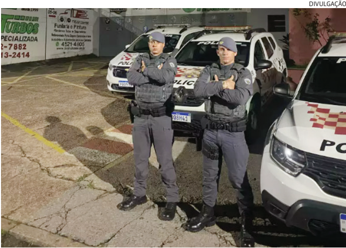
Os PMS fizeram uma varredura no local e prenderam o invasor