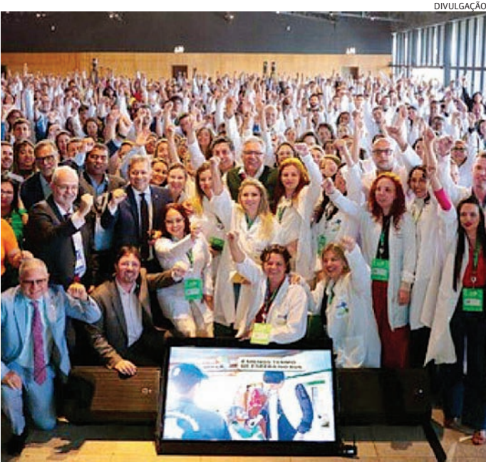
É prevista a contratação de 373 médicos no Estado de São Paulo

Louveira não tem médicos pelo Programa Mais Médicos.