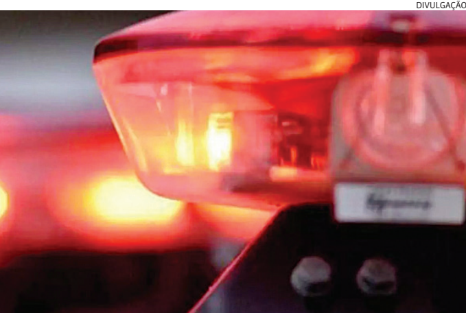
Os Gms prenderam o suspeito e o levaram para o Plantão Policial

Um homem foi preso por tráfico de drogas após jogar uma sacola cheia de entorpecentes sobre o telhado de uma casa na Vila Primavera, em Jarinu, no final da noite desta terça-feira (18). A prisão foi feita por guardas municipais. Os Gms faziam patrulhamento pela avenida Milton Viana, quando se depa-ram com um homem em atitude suspeita. Ele se apavorou e correu para a rua 32, onde atirou sobre o telhado uma sacola e se escondeu atrás de um carro. Ele foi abordado e, enquanto era revistado por um dos guardas, o outro recolheu a sacola que estava cheia de cocaína, maconha e crack. O homem foi conduzido ao Plantão Policial, onde acabou preso em flagrante por tráfico de drogas.