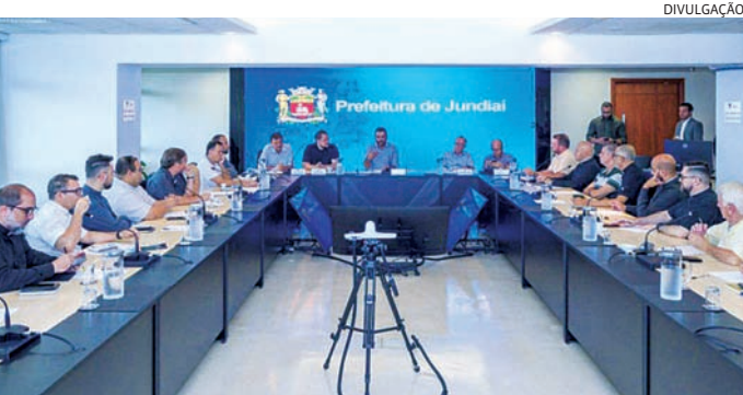
Prefeito se reuniu com representante de 27 paróquias de Jundiaí