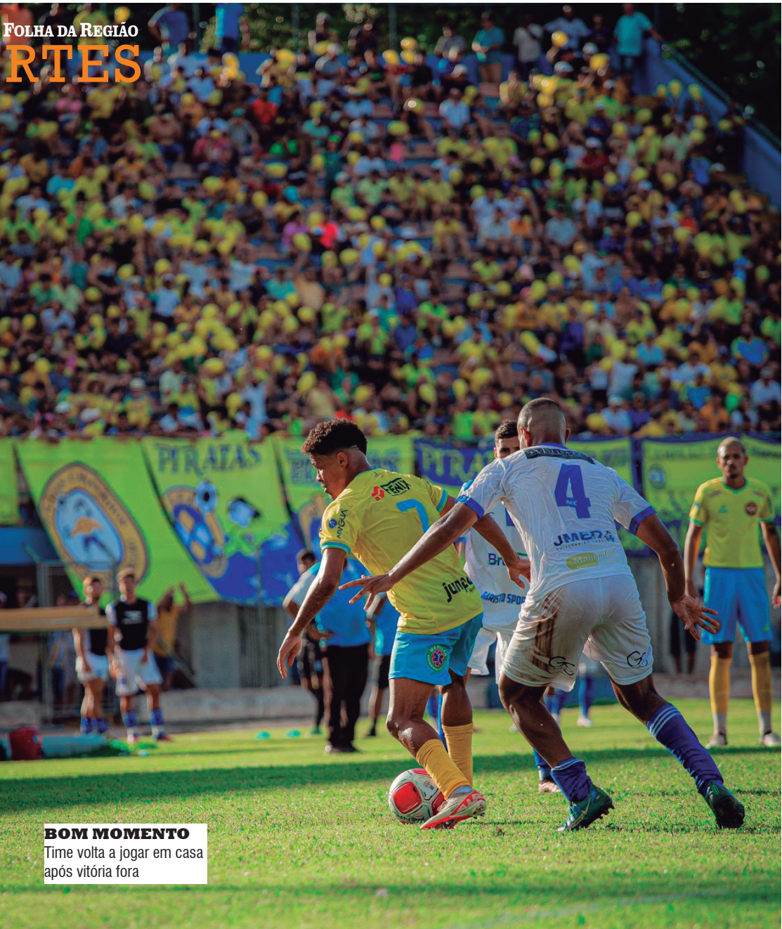
BOM MOMENTO Time volta a jogar em casa após vitória fora

Convidamos todos os amantes do futebol e da AEA a se juntarem a nós neste sábado para fazer história mais uma vez. Vamos transformar o Adhemar de Barros em um mar de camisas amarelas e empurrar nossa equipe rumo ao sucesso! É um convite especial para toda a comunidade de Araçatuba e região participar desse momento emocionante e vibrante.