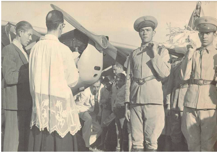
Batismo de de um avião em Araçatuba