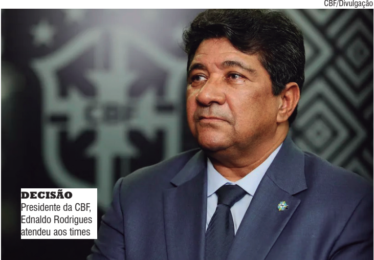
DECISÃO Presidente da CBF, Ednaldo Rodrigues atendeu aos times

Além dos 20 jogos das próximas duas rodadas do Brasileirão, outras oito partidas já haviam sido adiadas, sendo cinco por causa das enchentes no RS, duas por compromisso das equipes na Copa Verde, e outra pela Copa do Nordeste. Todos