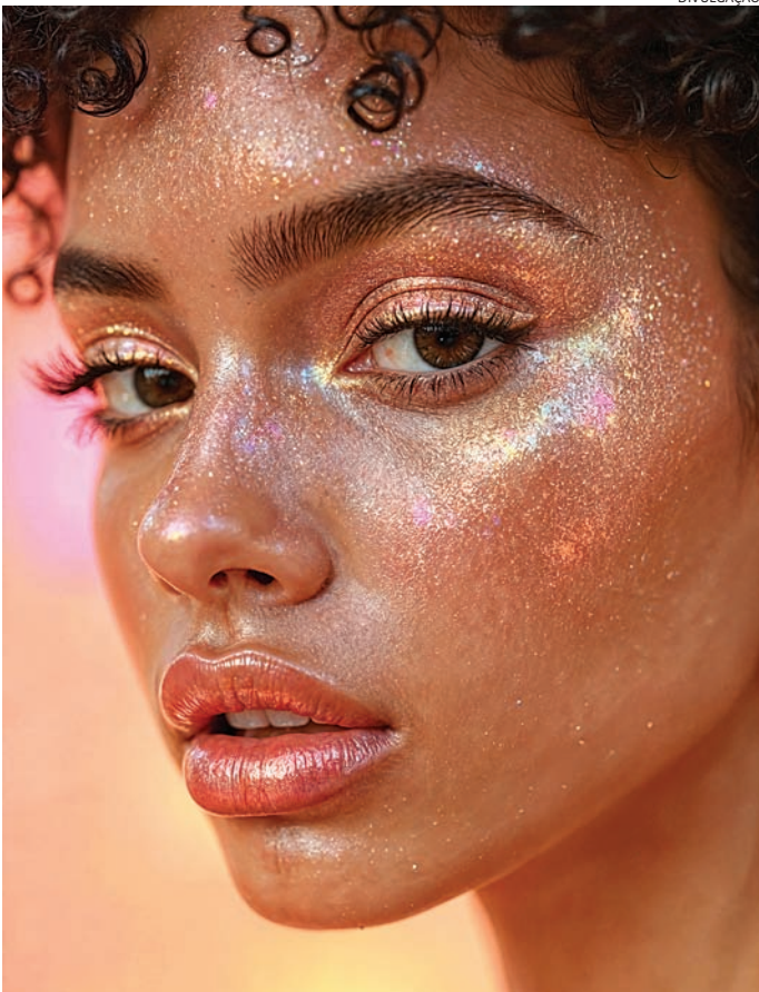
Glitter, suor e calor excessivos podem ‘atrapalhar’ a folia

Durante a folia, o aumento da temperatura corporal e a prática intensa de