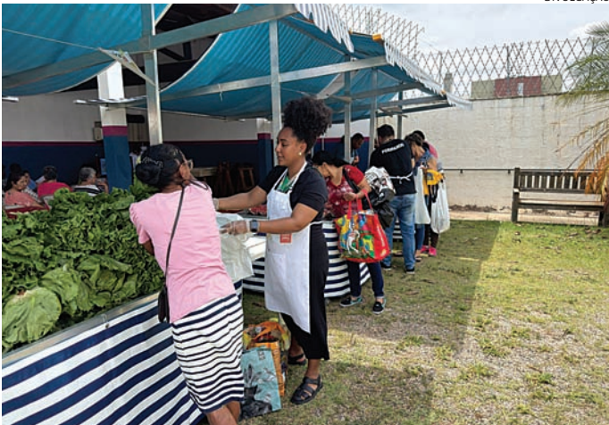
A expectativa é beneficiar mais de 3 mil famílias

A secretária de Assistência e Desenvolvimento Social (SMADS) também