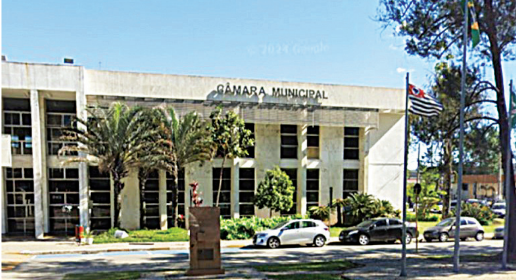
Sessão foi marcada por tumulto, presença de policiais, na tentativa de cassar o prefeito

O clima esquentou ainda mais quando uma advogada invadiu o plenário e deu voz de prisão ao presidente da Câmara, alegando abuso de autoridade. A sessão foi novamente suspensa por cerca de quatro horas e meia. Durante esse período, houve conflitos