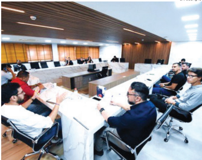
Primeira reunião de 2026 aconteceu nesta semana

O ministro Dias Toffoli, do Supremo Tribunal Federal (STF), determinou nesta quinta-feira (12) que a Polícia Federal encaminhe à Corte os dados extraídos dos celulares apreendidos na investigação sobre fraudes no Banco Master,