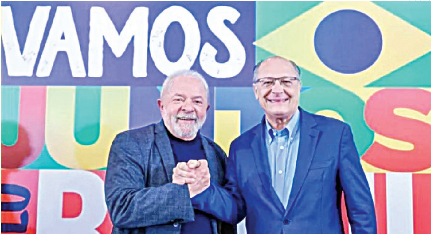
Geraldo Alckmin é o nome preferido para reeditar dupla com o atual presidente Lula