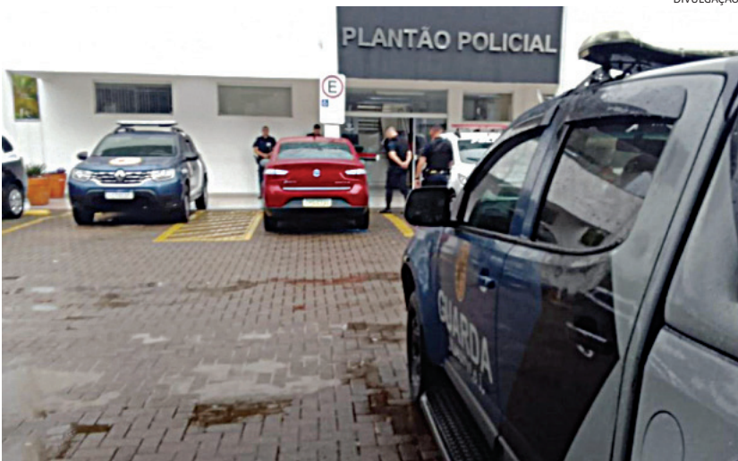
As mulheres, moradoras da capital, foram autuadas em flagrante por furto

São Paulo. A prisão foi feita por guardas municipais. Segundo a GM, os produtos furtados estão avaliados em aproximadamente R$ 10 mil. Polícia 6