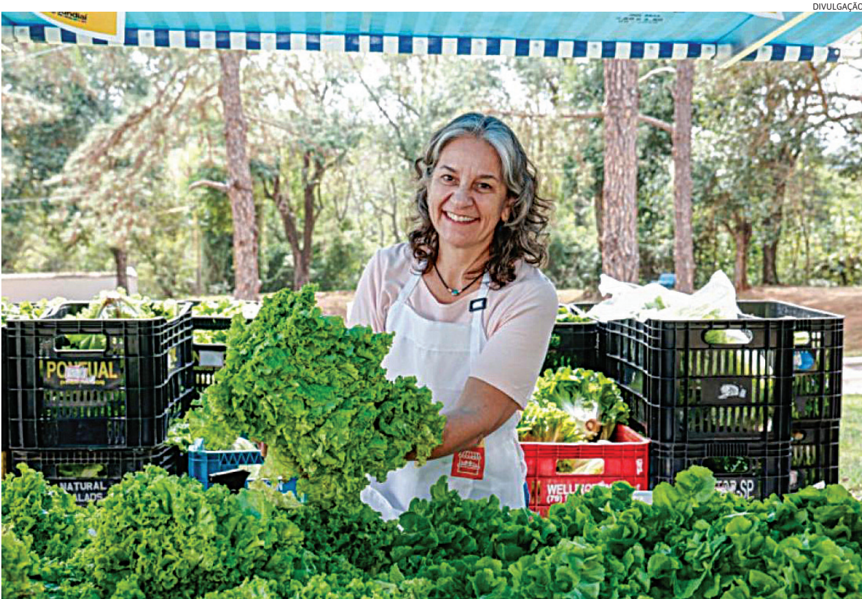
Programa beneficiará mais de 3 mil famílias, além de 500 idosos atendidos pelo município

A Prefeitura de Jundiaí vai investir R$ 500 mil na agricultura familiar, viabilizado por meio de parceria com o Governo do Estado de São Paulo. A iniciativa garante a compra direta de produtos dos agricultores locais, fortalecendo a produção rural e estimulando a economia do