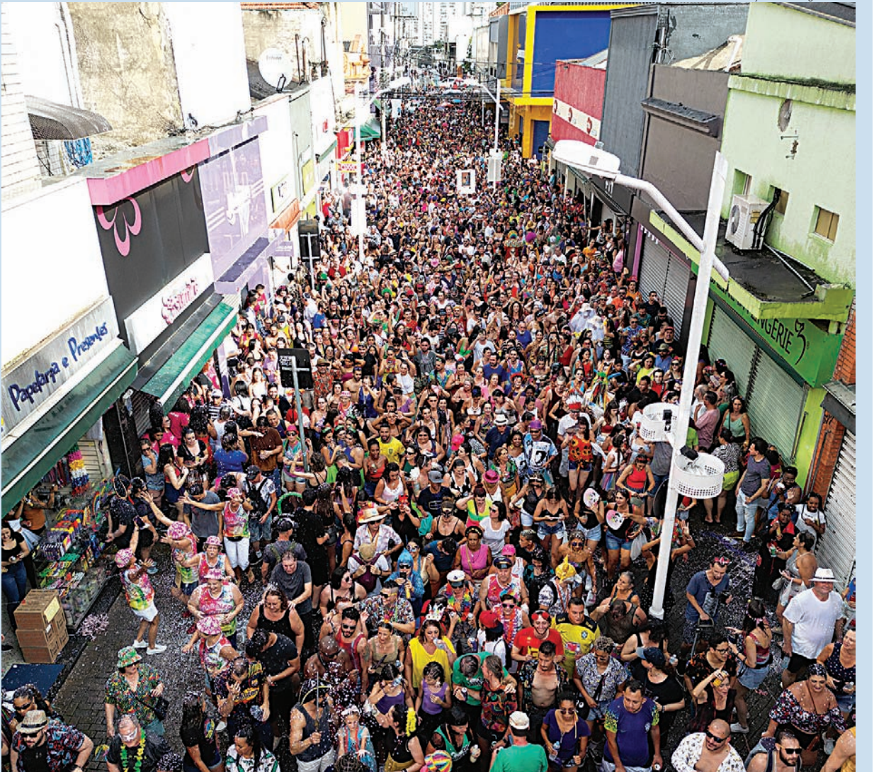
Com concentração na praça Ruy Barbosa, o Refogado irá transitar da rua Barão de Jundiaí até a rua Siqueira de Moraes

bilidade e Transporte, as interdições das vias para os desfiles de todos os blocos ocorrem sempre duas horas antes do início de cada evento. Cidades 4