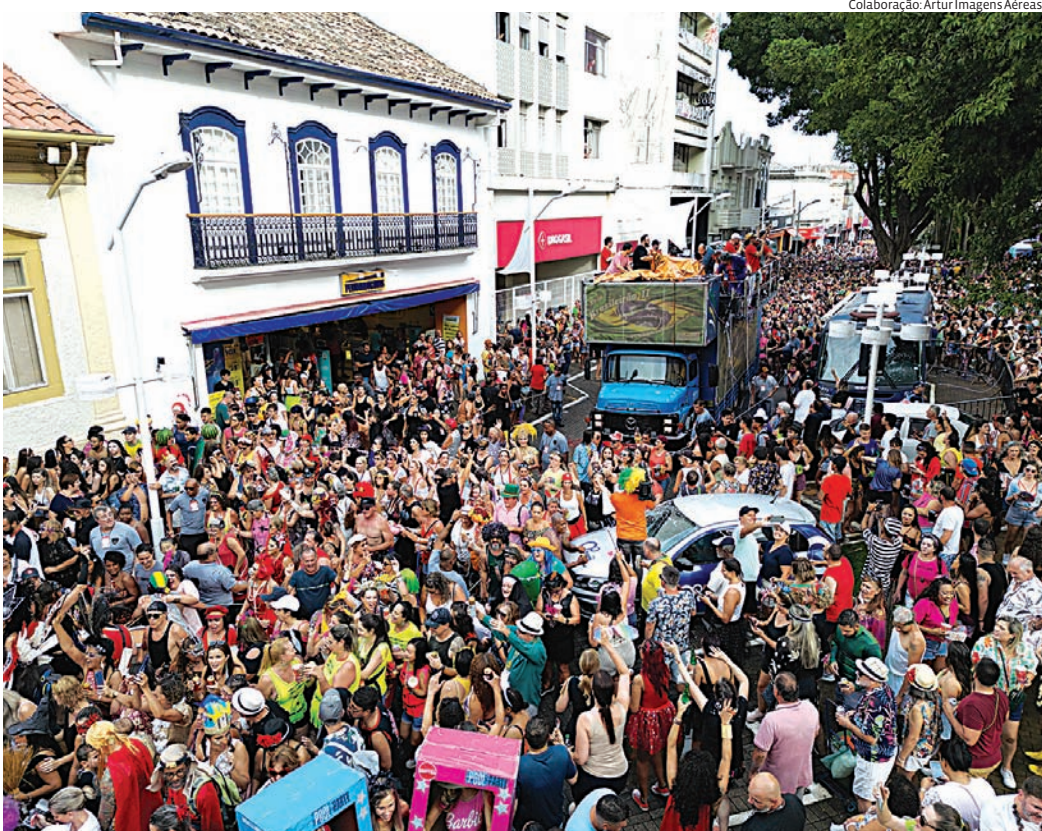
Refogado do Sandi dará o pontapé inicial ao ano de Carnaval em Jundiaí

As ruas do entorno permanecerão interditadas até duas horas após o término do desfile. A pasta informou, ainda, que todos os locais, inclusive para os demais blocos, contarão com monitoramento e acompanhamento dos agentes de trânsito, a fim de garantir a segurança viária e a fluidez do tráfego nas imediações. Com concentração na praça Ruy Barbosa, o Refogado do Sandi irá transitar pela rua Barão de Jundiaí até a rua Siqueira de Moraes e retor-