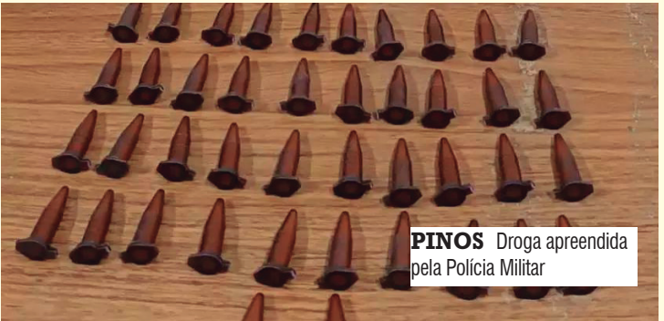
PINOS Droga apreendida pela Polícia Militar

Diante dos fatos, o autor foi conduzido ao Distrito Policial, onde permaneceu preso.