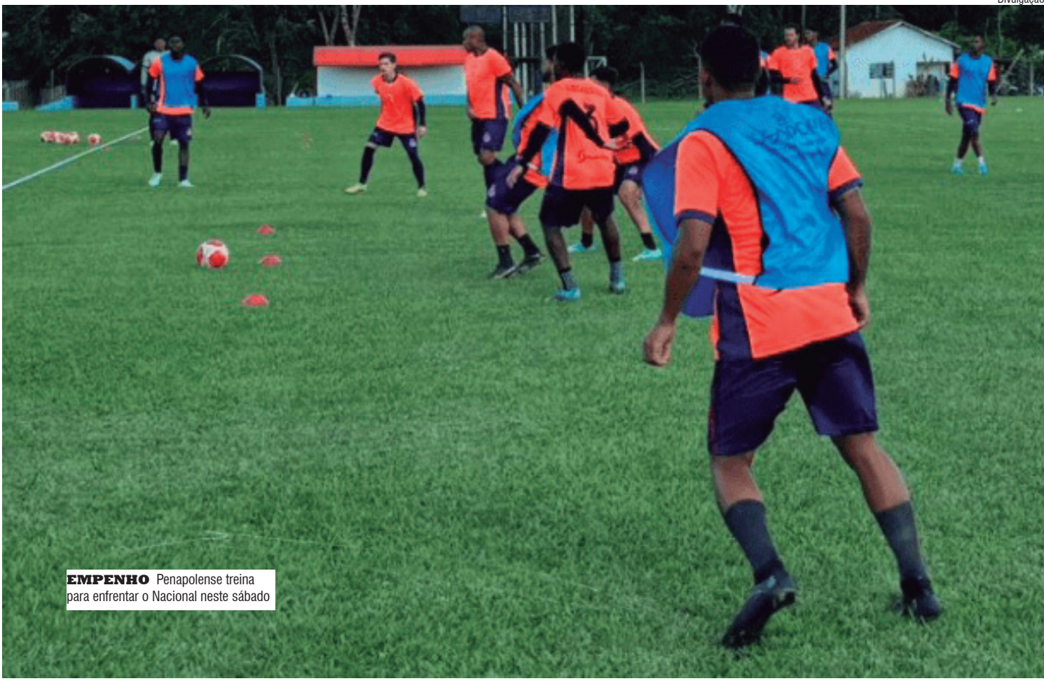
EMPENHO Penapolense treina para enfrentar o Nacional neste sábado