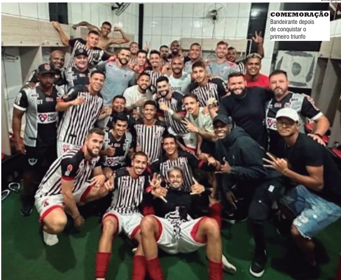
CELEBRAÇÃO Bandeirante depois de conquistar o primeiro triunfo

Birigui, SP Da Redação pautasfr@gmail.com