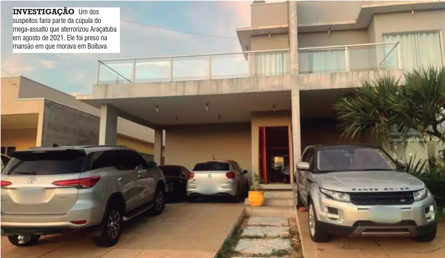
INVESTIGAÇÃO Um dos suspeitos faria parte da cúpula do mega-assalto que aterrorizou Araçatuba em agosto de 2021. Ele foi preso na mansão em que morava em Boituva

Até hoje o valor levado pelos assaltantes é uma incógnita. Fontes ouvidas pela reportagem, na época, afirmaram que nem 40% do que foi planejado foi levado. Especula-se que o prejuízo tenha ficado na casa dos R$ 17 milhões.