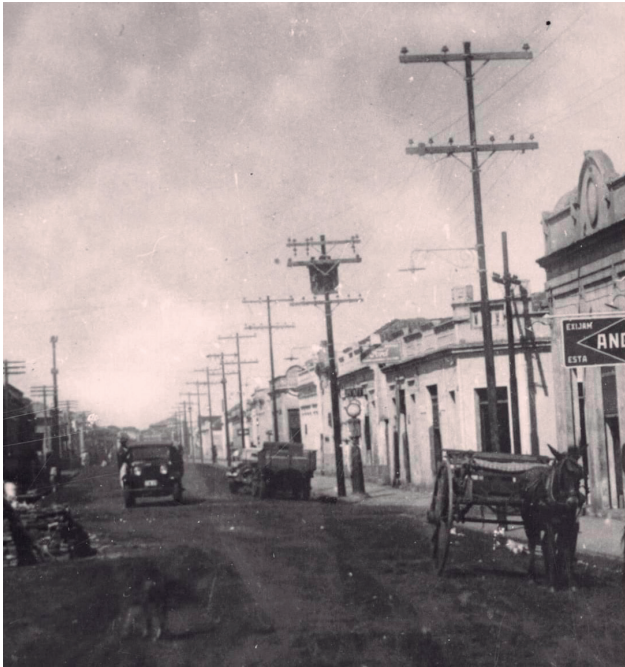
Rua Marechal Deodoro