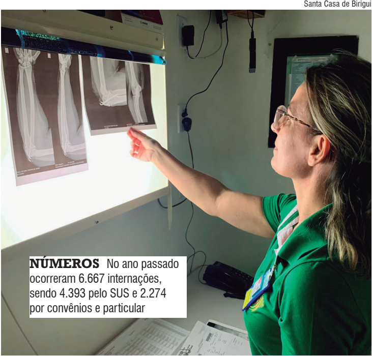
NÚMEROS No ano passado ocorreram 6.667 internações, sendo 4.393 pelo SUS e 2.274 por convênios e particular

Os dados mostram que foram realizadas 4.126 cirurgias (2.169 pelo SUS) e 1.283 partos. Já no Pronto Atendimento foram 20.436 atendimentos. Foram feitos 30.532