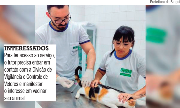
INTERESSADOS Para ter acesso ao serviço, o tutor precisa entrar em contato com a Divisão de Vigilância e Controle de Vetores e manifestar o interesse em vacinar seu animal