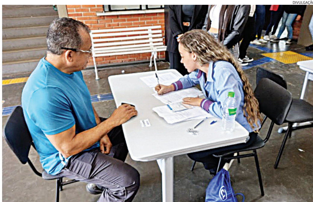
A expectativa é atender até 400 contribuintes nos dois dias do mutirão

ção aos R$ 33.888,00 vigentes no ano passado), assim como aquelas que obtiveram receita bruta da atividade rural acima de R$ 177.920,00 (antes, R$ 169.440,00). Estão, portanto, isentas da declaração as pessoas que receberam até dois salários-mínimos mensais durante 2025, salvo se se enquadrarem em outro critério de obrigatoriedade. Os demais critérios