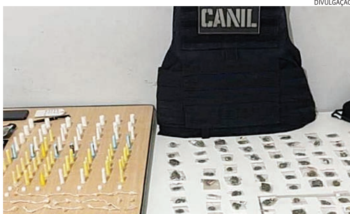
As drogas foram apreendidas pelos GMs

Ele foi abordado e, em uma sacola, os guardas localizaram quase 300 porções de maconha, cocaína e crack, além de dinheiro proveniente das vendas.