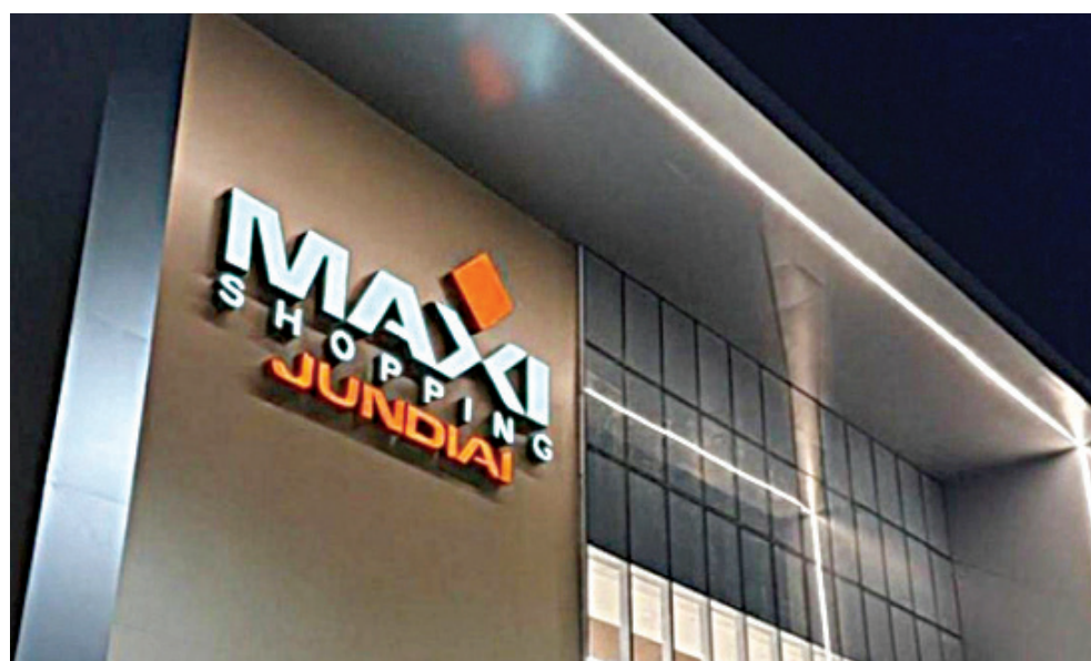
O colar é acompanhado de um pingente de pérola Morana

O recebimento do brinde está sujeito a disponibilidade de estoque no momento da retirada. O QRCode não garante o brinde ao participante. Maxi Shopping Jundiaí – Av. Antônio Frederico Ozanan, nº 6000.