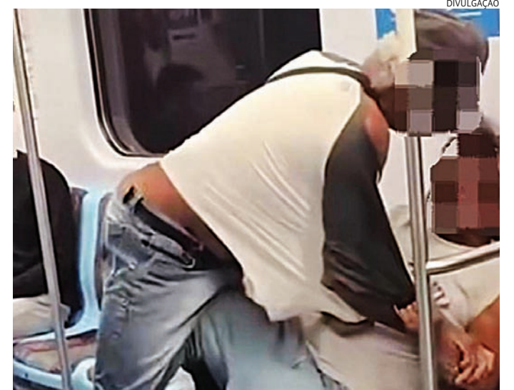
Apesar da situação, eles não se feriram

Apesar da situação, eles não se feriram e nem mesmo foram conduzidos à delegacia. Ao chegarem à estação de Francisco Morato, eles dispersaram e foram embora.