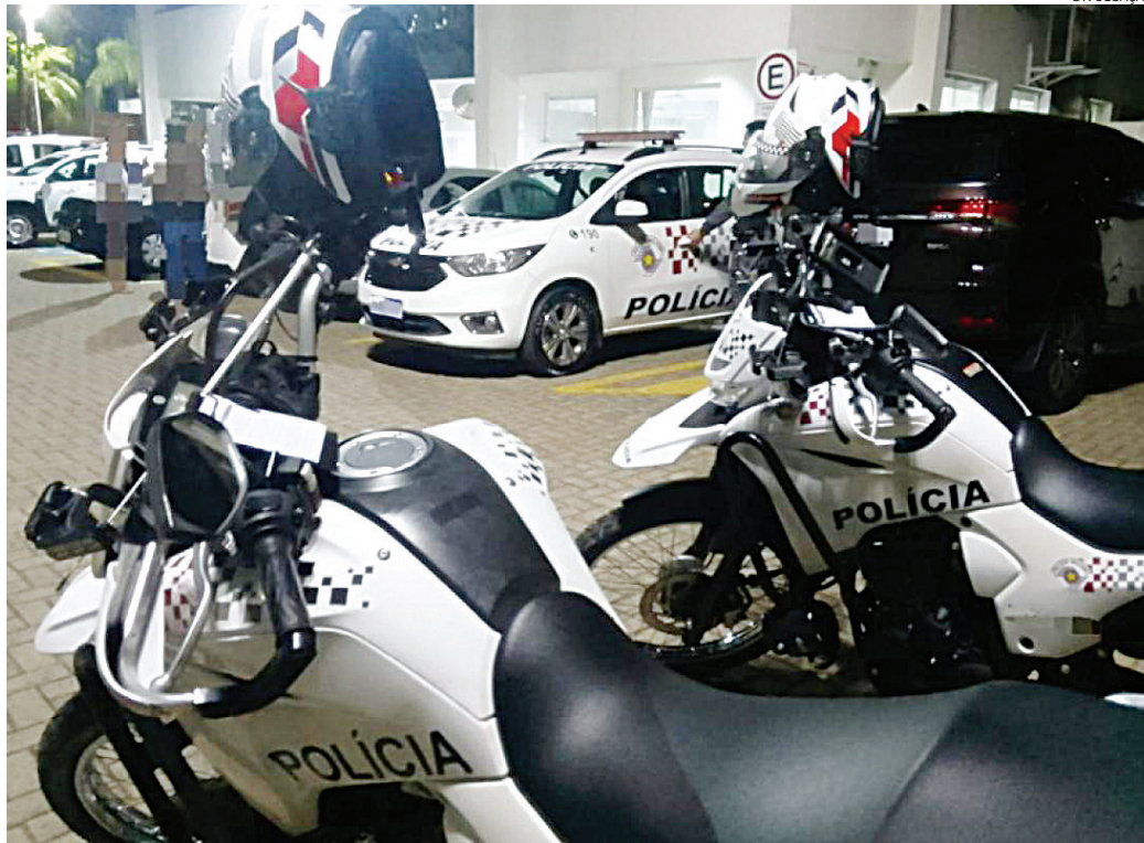
Foi preciso força física para conter o suspeito, que acabou preso

De acordo com a Polícia Militar, a equipe do Rádio Patrulhamento com Motos (RPM) realizava patrulhamento em uma área onde há diversos pontos de venda de entorpecentes concentrados em um curto trecho. Ao se apro-