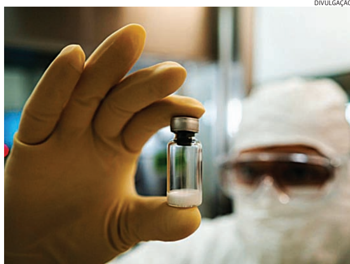
O vírus da chikungunya é transmitido pela picada do mosquito Aedes aegypti

Trata-se da mesma vacina, mas formulada e envasada no Brasil. A aprovação da produção local representa um importante passo na transferência de tecnologia entre as instituições, além de facilitar a incorporação do imunizante ao SUS.