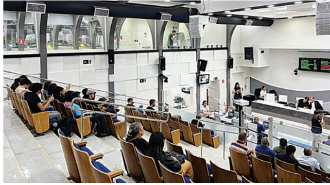
Câmara esteve vazia ontem, enquanto salários eram discutidos

O J questionou o Tribunal de Contas de São Paulo, que enfatizou a legalidade desse benefício estritamente condicionada à existência de uma lei municipal específica que o autoriza, sendo vedado qualquer tipo de pagamento retroativo a períodos anteriores à vigência da legislação local. Além disso, a despesa deve respeitar rigorosamente os limites de gastos com pessoal estabelecidos pela Lei de Responsabilidade Fiscal (LRF) e o teto remuneratório constitucional. A Corte esclareceu que não dispõe de um levantamento ou base de dados específica que consolide quais municípios paulistas adotam