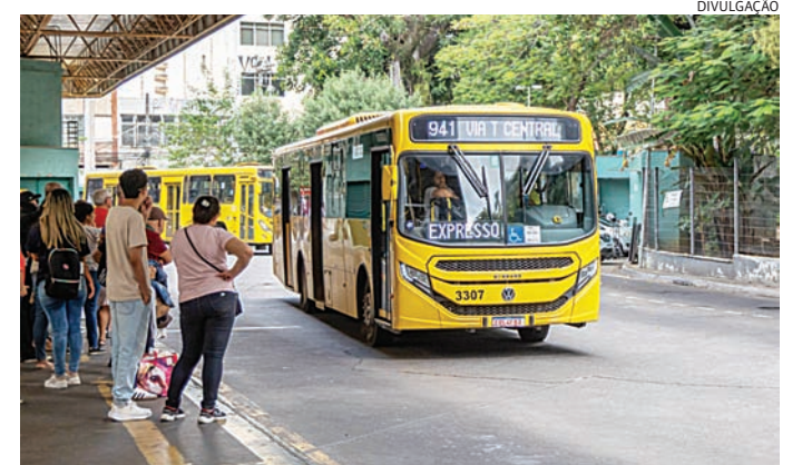
As linhas foram acrescidas para agilizar o itinerário

Anteriormente, a 941 operava apenas nos horários de pico, porém passará a contar agora com viagens das 10h30 às 15h30, com um acréscimo médio de seis partidas por sentido. Além da expansão do atendimento, a SMMT fará uma revisão em horários já existentes, visando otimi-