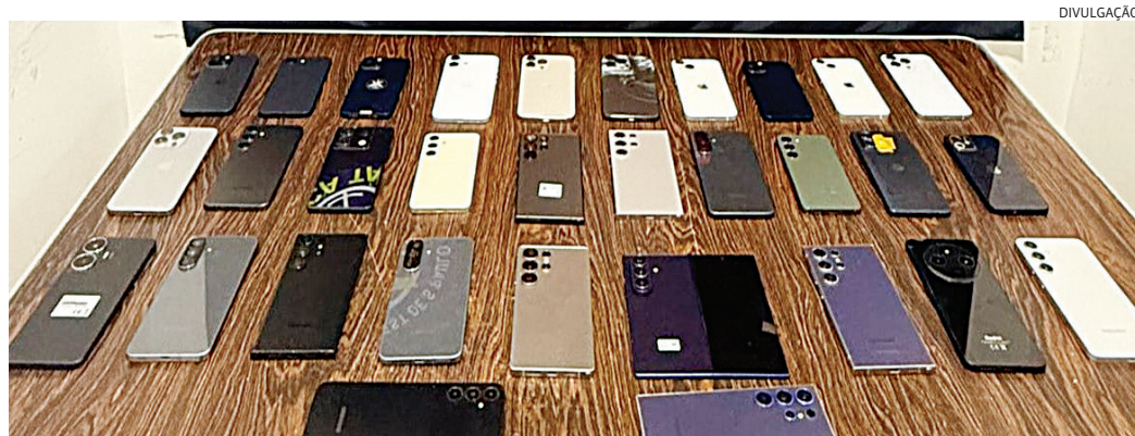
Os aparelhos haviam sido subtraídos durante um evento de música

gistrado como receptação e localização/apreensão de veículo no 8º Distrito Policial, no Brás. Os suspeitos permaneceram à disposição da Justiça