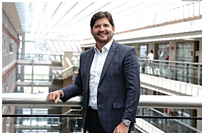
André do Prado, presidente da Alesp, será candidato a senador

André do Prado, que tem reduto eleitoral na região do Alto Tietê, no leste da região metropolitana da capital, havia viajado aos Estados Unidos