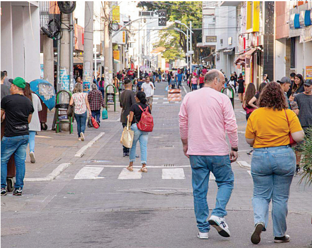
O Comércio jundiense sofreu uma retração que pode ser recuperada em breve, em datas significativas