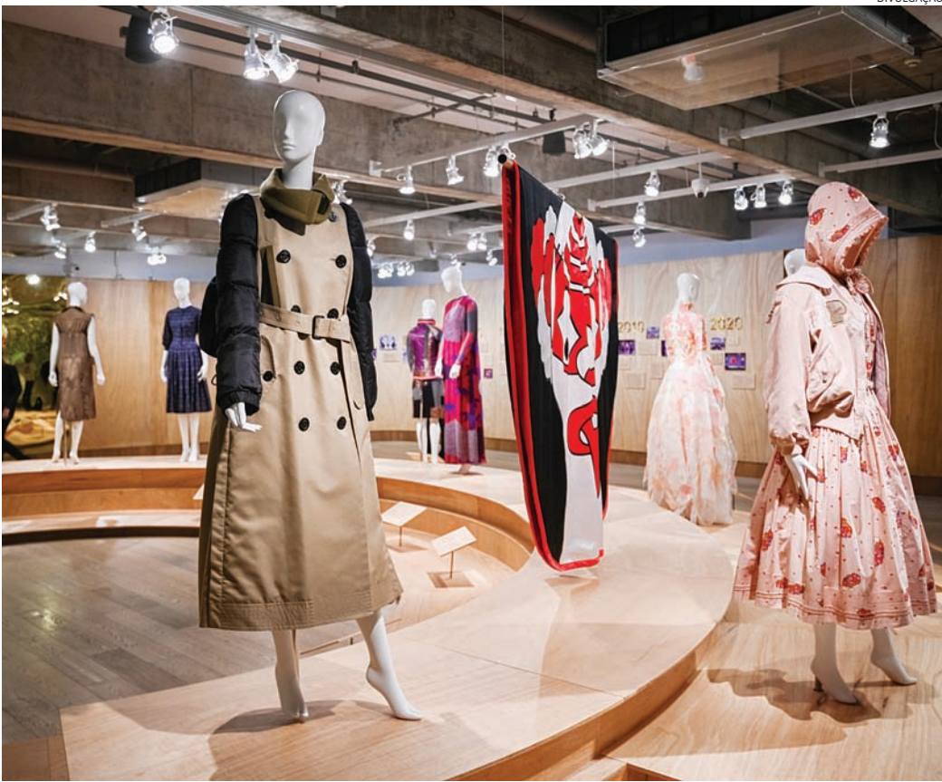
Nos encontros, os visitantes poderão conhecer mais a fundo a história e a trajetória da moda japonesa

Já as Visitas Mediadas pela mostra “Efeito Japão” acontecem nos dias 7 (quarta-feira), às 11h e 15h; dia 10 (sábado), às 11h; e dia 14 (quarta-feira), às 15h. Durante os encontros, os visitantes poderão conhecer mais a fundo a história e a trajetória da moda japonesa dos últimos 70 anos por meio de 15 criações assinadas por 13 designers japoneses consolidados no mer-