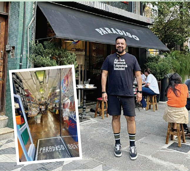
Paradiso, uma das atrações gastronômicas da Vila Buarque

Rua Barão de Tatuí, 339 - Vila Buarque - São Paulo @paradisocasacomida