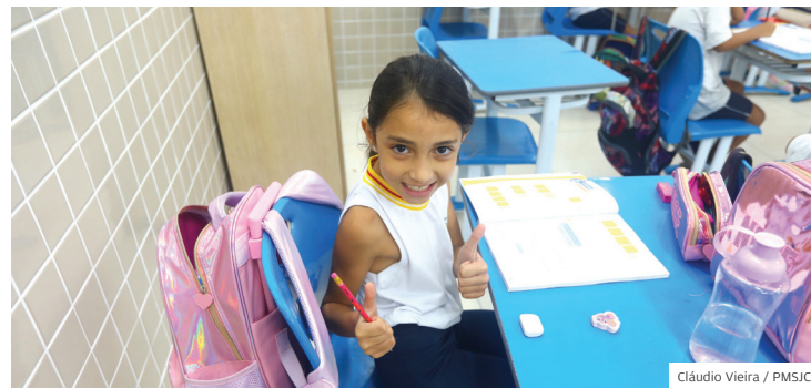
Animados. Ensino oferecido em S. José estimula alunos da cidade

De norte a sul, de leste a oeste. A Prefeitura certificou em março escolas de todas as regiões com o selo do programa Educação 5.0, que atualiza a educação pública e acompanha o desenvolvimento da sociedade com novas tecnologias