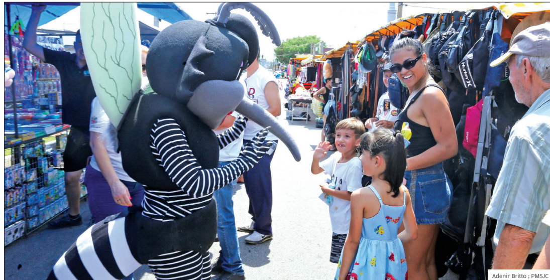
Papo. Boneco do mosquito Aedes Aegypti conversa com as crianças e ensina de maneira lúdica

VISTORIA POPULAÇÃO PODE FAZER UMA INSPEÇÃO EM CASA PELO MENOS UMA VEZ POR SEMANA PARA ENCONTRAR POSSÍVEIS FOCOS DE LARVAS