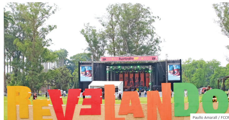
Clima. Festival acontece em um lugar especial: o Parque da Cidade