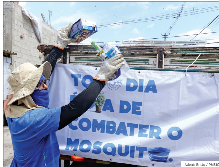
Limpo. Operação Casa Limpa retira materiais inservíveis das casas