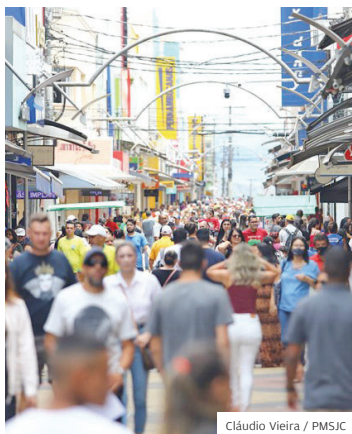
Comércio. Saldo positivo

POSITIVO. O ano de 2024 começou com boas perspectivas em relação à geração de empregos com carteira assinada em São José dos Campos. De acordo com dados do Caged, divulgados em março pelo Ministério do Trabalho e Emprego, a cidade registrou em janeiro deste ano um saldo positivo de 1.394 empregos formais.