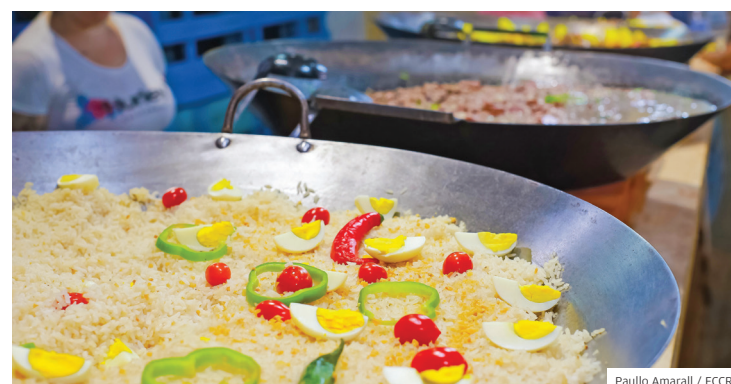
Delícias. Gastronomia é um dos pontos fortes do Revelando SP