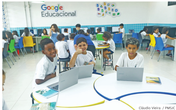
Aprender. Sala com tecnologia Google para os alunos