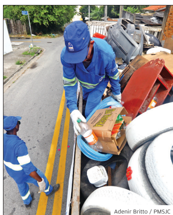
Região sul. Quatro toneladas

CRIADOUROS. A Operação Casa Limpa contra o Aedes aegypti, realizada pela Defesa Civil do Estado de São Paulo em parceria com a Prefeitura de São José dos Campos, no fim de fevereiro recolheu 4 toneladas de materiais inservíveis que podem ser possíveis criadouros do mosquito transmissor de doenças como dengue, chikungunya e zika.