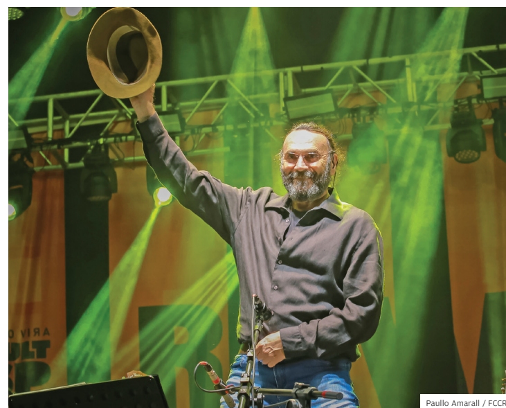
Música. Almir Sater se apresentou no Revelando SP de 2023

Em 2023, o Revelando SP teve duas edições, que foram realizadas em São José dos Campos e em São Paulo.