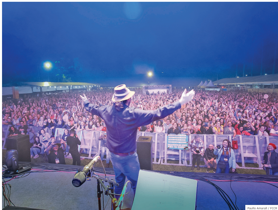
Lotado. Programação do evento ainda será divulgada, mas uma coisa é certa: o público vai prestigiar

TRADIÇÃO FESTIVAL OFERECE AO PÚBLICO PARTICIPANTE UMA VIAGEM PELAS TRADIÇÕES DO ESTADO DE SÃO PAULO