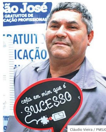
Vagas. Qualificação profissional

OFERTAS. Oportunidade para quem quer se capacitar e se qualificar para o mercado de trabalho. O programa Qualifica São José está com 3.178 vagas abertas em 32 cursos gratuitos em várias áreas de atuação profissional. Para se inscrever basta acessar a página do programa no site da Prefeitura e preencher alguns requisitos, como ser morador da cidade.