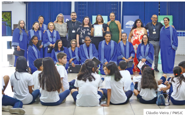
Festa. No Antônio Palma, alunos do EJA na certificação