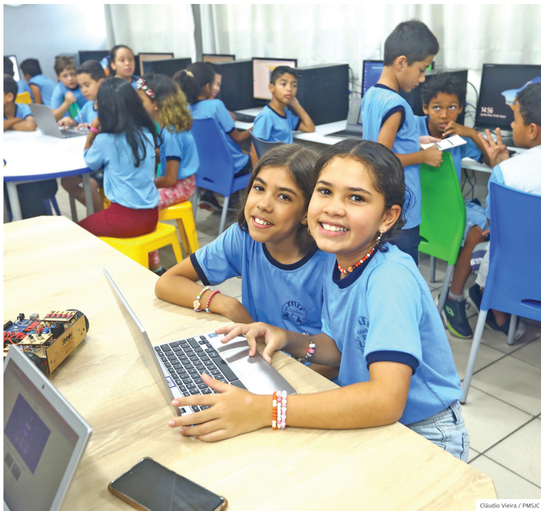
Ambientes. Escolas foram reformadas para garantir estrutura para professores e alunos em sala

De norte a sul, de leste a oeste. A Prefeitura certificou em março escolas de todas as regiões com o selo do programa Educação 5.0, que atualiza a educação pública e acompanha o desenvolvimento da sociedade com novas tecnologias