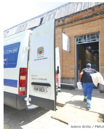
Apoio. Doações para famílias

FUNDO. A Prefeitura, por meio do Fundo Social de Solidariedade, da Secretaria de Apoio Social ao Cidadão e da Defesa Civil, prestou em março assistência às famílias da região norte que foram afetadas pelas cheias do rio Buquira. Em decorrência das intensas chuvas em Monteiro Lobato, aproximadamente 300 famílias foram impactadas.