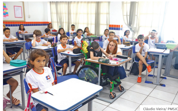
Para todos. Inclusão é levada a sério nas unidades