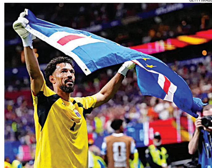
Equipes somaram um ponto na estreia e buscam primeira vitória

Cabo Verde também surpreendeu no primeiro compromisso ao segurar um empate sem gols diante da Espanha, resultado considerado histórico para a seleção africana em sua primeira participação em