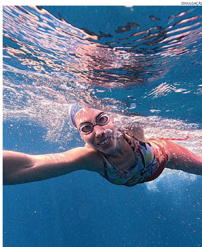
Seu recorde pessoal anterior era de 10 quilômetros em outras provas