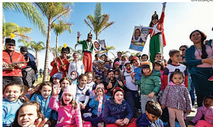
Pré-candidato a deputado federal defende políticas à infância

A transformação teve início em 2017, com a criação da Política Municipal da Crian-