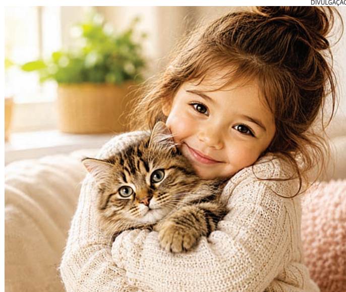
A presença de gatos não piora a asma das crianças, diz estudo