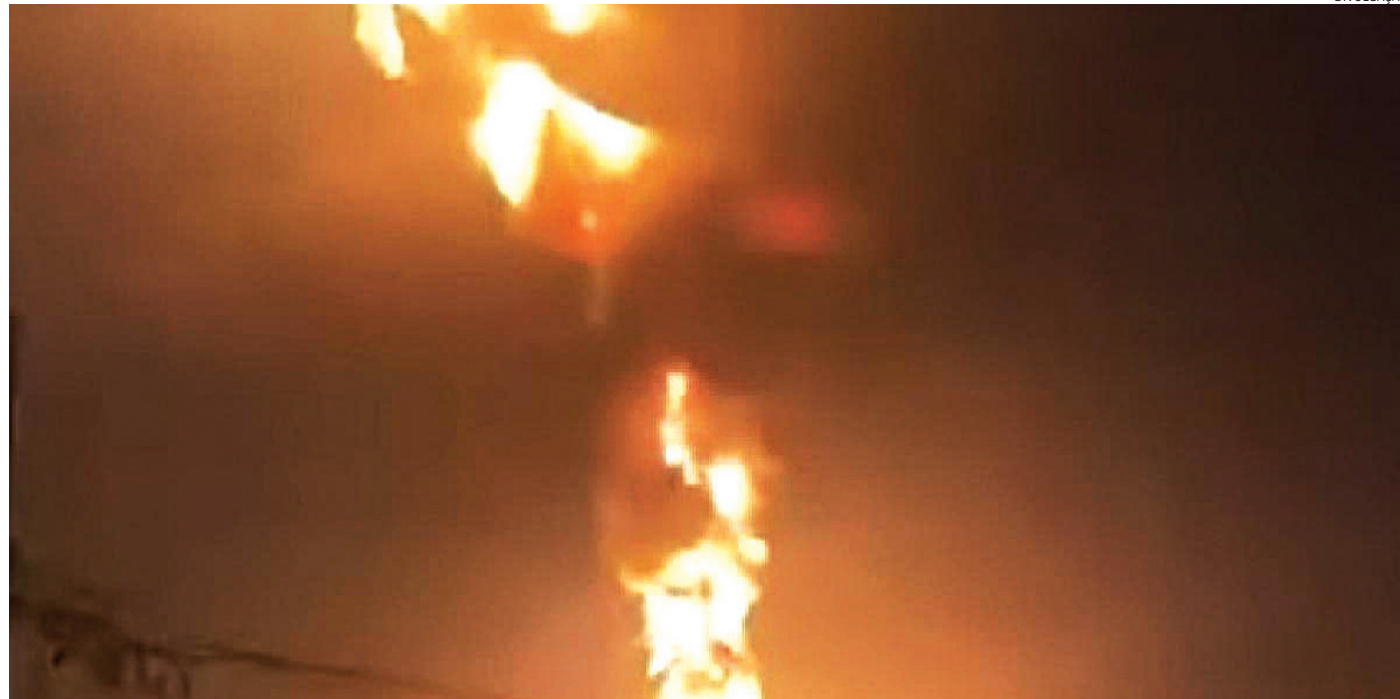
Segundo Corpo de Bombeiros, não houve vítimas

O Corpo de Bombeiros compareceu ao local para atender ao chamado e o incidente foi registrado por volta de 1h05 da madrugada e ocorreu após um dos tanques da empresa explodir e provocar uma bola de fogo no céu.