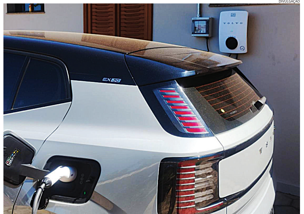
Há custos iniciais, como a instalação do carregador de parede, ou de energia solar

Já sobre o consumo, o eletricitista diz que é o mesmo se houver uso do wallbox ou de carregador portátil, conectado à tomada. “Se o carro precisa de 40 kWh para completar a carga, ele vai puxar esses