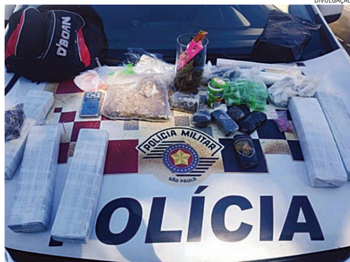
Em busca pelo veículo, os policiais encontraram maconha no porta-malas

De acordo com a PM, a abordagem do veículo ocorreu na avenida Emílio Cechinato, próximo ao Parque da Cidade, quando o carro foi avistado na via, emitindo ruídos excessivos pelo escapamento. Ainda segundo a PM, ao abordarem o motorista ele demonstrou nervosismo e relatos contraditórios. Em busca pelo