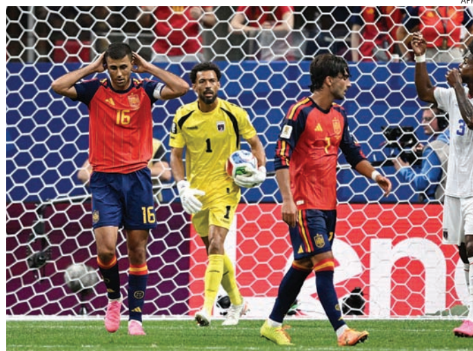
Seleções entram em campo pressionadas por triunfo no Grupo H

A Arábia Saudita também somou um ponto na estreia ao empatar por 1 a 1 com o Uruguai. O resultado aumentou a confiança dos sauditas, que mostram organização defensiva