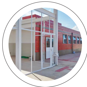
Investimentos. Prefeitura constrói novas unidades