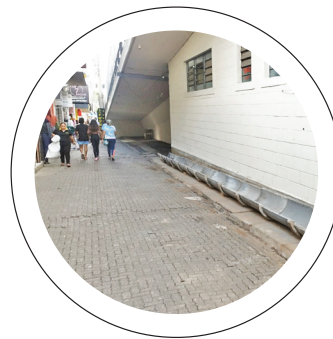
Viaduto Central. Novo Rumo permite a revitalização de pontos