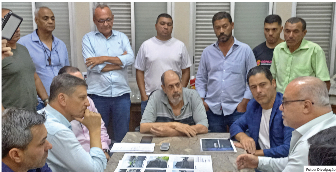
Saúde. Pindamonhangaba receberá R$ 3,5 milhões, via emenda deputado Marcio Alvino, para a implantação do Centro Integrado de Especialidades Médicas