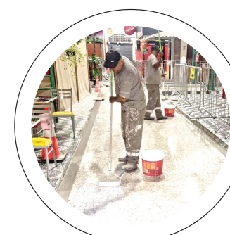
Mercado. Novo piso antiderrapante garante mais beleza e higiene