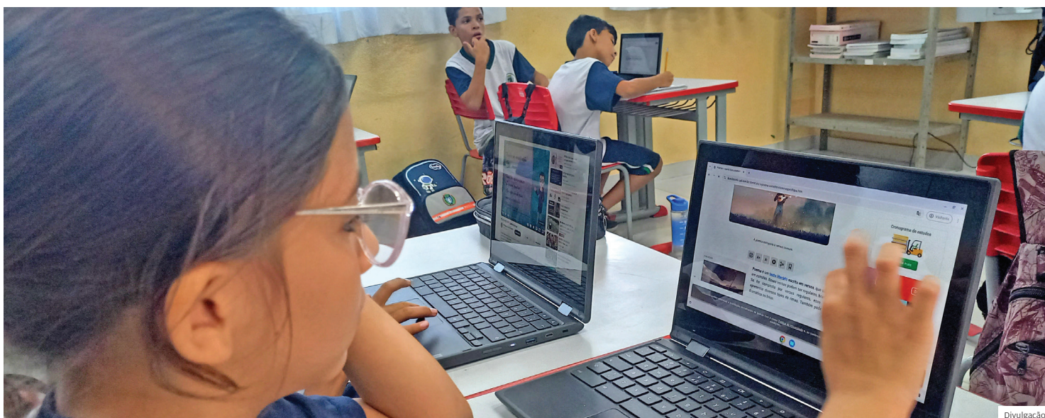
Educação. Uso de tecnologias, como chromebooks e lousas digitais, facilitam o aprendizado e tornam as aulas mais dinâmicas

As escolas premiadas tiveram o desafio de bater as suas metas, levando em conta a evolução das notas no Saresp, o Índice de Excelência Educacional, a complexidade da unidade e o histórico de notas. Não foi fácil, mas a premiação mostra que in-