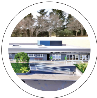
Atendimento. Centro Integrado de Especialidades Médicas