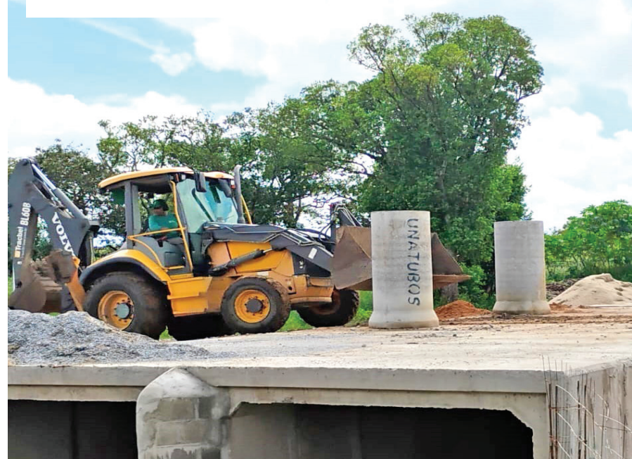
Obra. Nova Avenida entre a UPA do Araretama e Vila Rica/Lessa vai desafogar trânsito

TRÁFEGO CONSTRUÇÃO DA AVENIDA ESTRUTURAL VAI FACILITAR O TRÁFEGO E ATRAIR NOVAS EMPRESAS, GERANDO MAIS EMPREGOS NA CIDADE