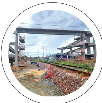
Construção. Passarela em obras por cima do trilho

CONSTRUÇÃO PREFEITURA DE PINDAMONHANGABA IMPULSIONA A CIDADE POR MEIO DE OBRAS, MELHORIAS EM ESPAÇOS PÚBLICOS E REFORMAS