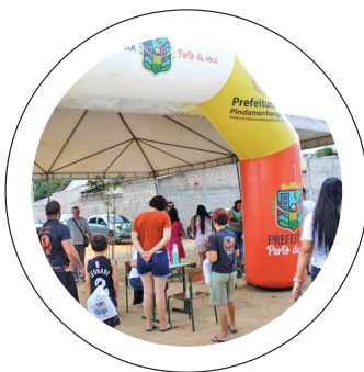
Atendimento. Iniciativa já beneficiou mais de 1.200 pessoas