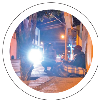
Novo rumo. Programa já tirou 27 pessoas das ruas de Pinda