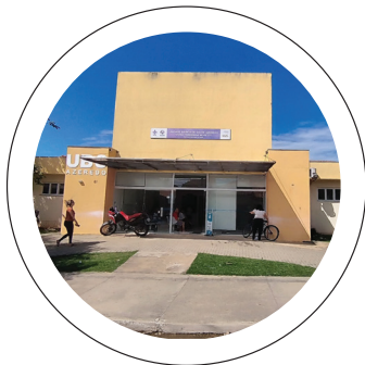
Obras. Unidades do Azeredo e Vila São Benedito terão reforma