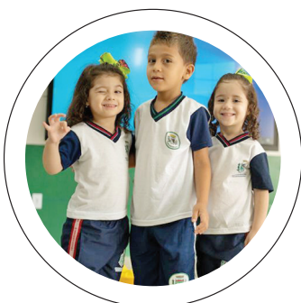
Base. Crianças com novos uniformes escolares na cidade