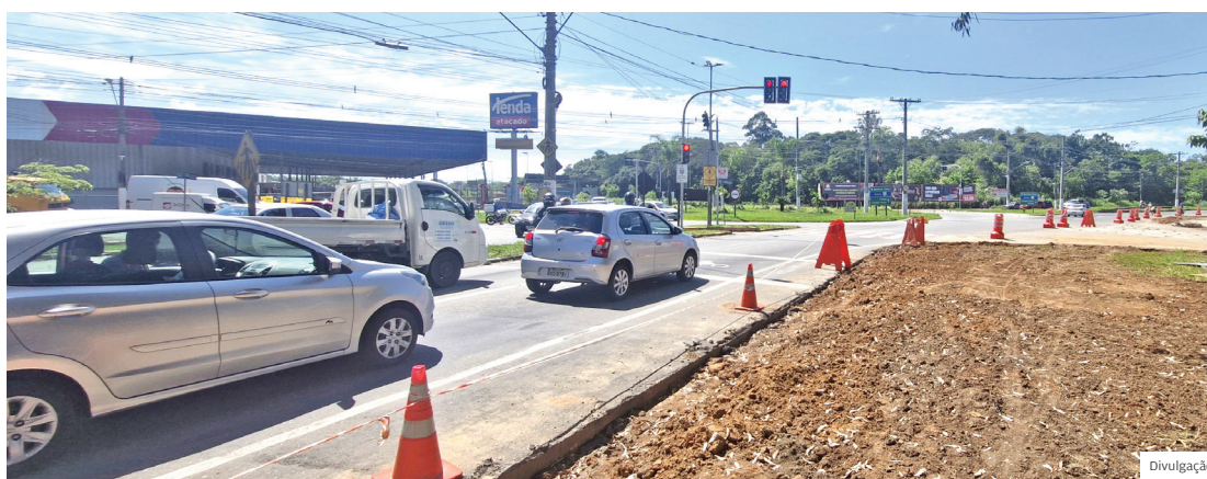
Rotatória do Tenda. Prefeitura de Pinda deu início às obras de adequação e construção de novas alças

No dia 18 de março, a Secretaria de Mobilidade e Trânsito recebeu quatro motocicletas Honda Sahara 300 e três pick-ups Mitsubishi L200 Triton. Cinco novos agentes de trânsito também foram convocados, por meio do último concurso público, para ampliar a