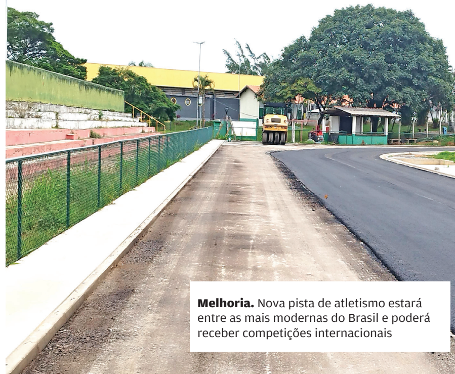
Melhoria. Nova pista de atletismo estará entre as mais modernas do Brasil e poderá receber competições internacionais