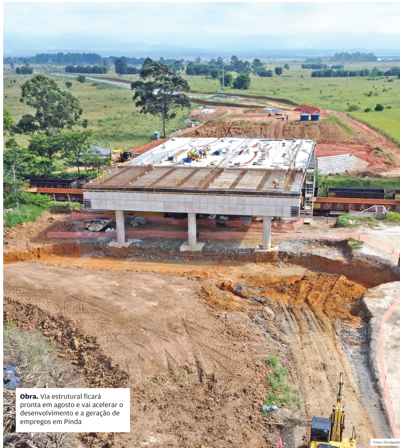
Obra. Via estrutural ficará pronta em agosto e vai acelerar o desenvolvimento e a geração de empregos em Pinda

SERVIÇOS. A Prefeitura de Pindamonhangaba iniciou nova fase de recapeamento asfáltico em ruas da cidade, totalizando 11 km de modernização do piso asfáltico no município. Com investimento de R$ 2,5 milhões, foram recapeadas sete ruas do bairro Vila Rica e outras duas vias do bairro São Benedito. A Prefeitura também recapeou ruas do Alto Cardoso, Araretama, Parque das Palmeiras e rotatórias. Além de melhorias no piso asfáltico, o recapeamento proporciona mais segurança no trânsito. ■