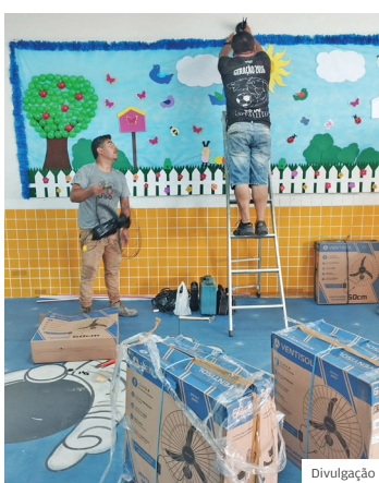
Equipamento. Ventiladores sendo instalados nas escolas

para as escolas e creches. As unidades também estão recebendo manutenção nas caixas d'água (25 unidades já feitas e mais 12 agendadas até o fim do mês) e substituição dos filtros dos bebedouros - 100 filtros para bebedouros e 80 para a cozinha instalados. Sem contar os serviços de zeladoria em praticamente todas as 67 unidades escolares do município. ■