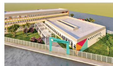
Corujinha. Prédio do INSS será transformado em PS Infantil

Outra novidade é a cessão do prédio do INSS à Prefeitura, para ser transformado em Pronto-Socorro Infantil 'Corujinha'. O município já capta recursos para a obra. ■