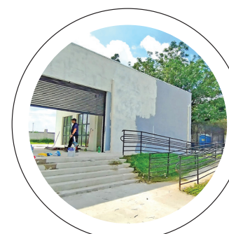
Centro. Moradores do Araretama vão ganhar Centro Cultural

Entre as mais importantes obras viárias de Pindamonhangaba, a construção da Avenida Estrutural, que ligará a Rodovia Vereador Abel Fabrício Dias (Pinda-Moreira César) na altura da indústria GV até a Avenida Buriti, no Feital, ao lado da Novellis, alcançou 75% de conclusão. A previsão da empresa contratada MRS é de concluir até agosto deste ano, incluindo o viaduto.