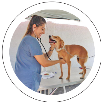
Castração. Meta é fazer 5.000 atendimentos em 2025