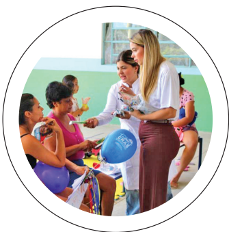
+ Perto de você. Programa aproxima o público e a gestão