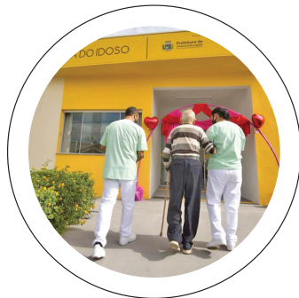
Melhor idade. Centro Dia do Idoso tem acolhimento

AMPLIAÇÃO REDE MUNICIPAL DE SAÚDE ESTÁ SENDO AMPLIADA EM PINDAMONHANGABA, PARA MELHORAR AINDA MAIS O ATENDIMENTO PELO SUS