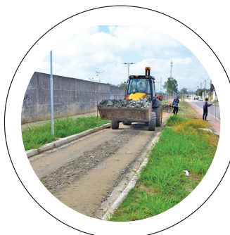
Obra. Ciclovia de 2,5 km entre Araretama e Bem Viver

Pindamonhangaba é um verdadeiro canteiro de obras, com diversas construções, reformas, ações de manutenção, recapeamento asfáltico e o trabalho de zeladoria para melhorar e transformar a vida da população.