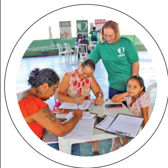
Olho no olho. Prefeitura Perto de Você no Castolira

GENTE CUIDAR DA POPULAÇÃO TRANSFORMA A VIDA DA CIDADE E DE QUEM VIVE NELA: COMPROMISSO DA PREFEITURA DE PINDAMONHANGABA