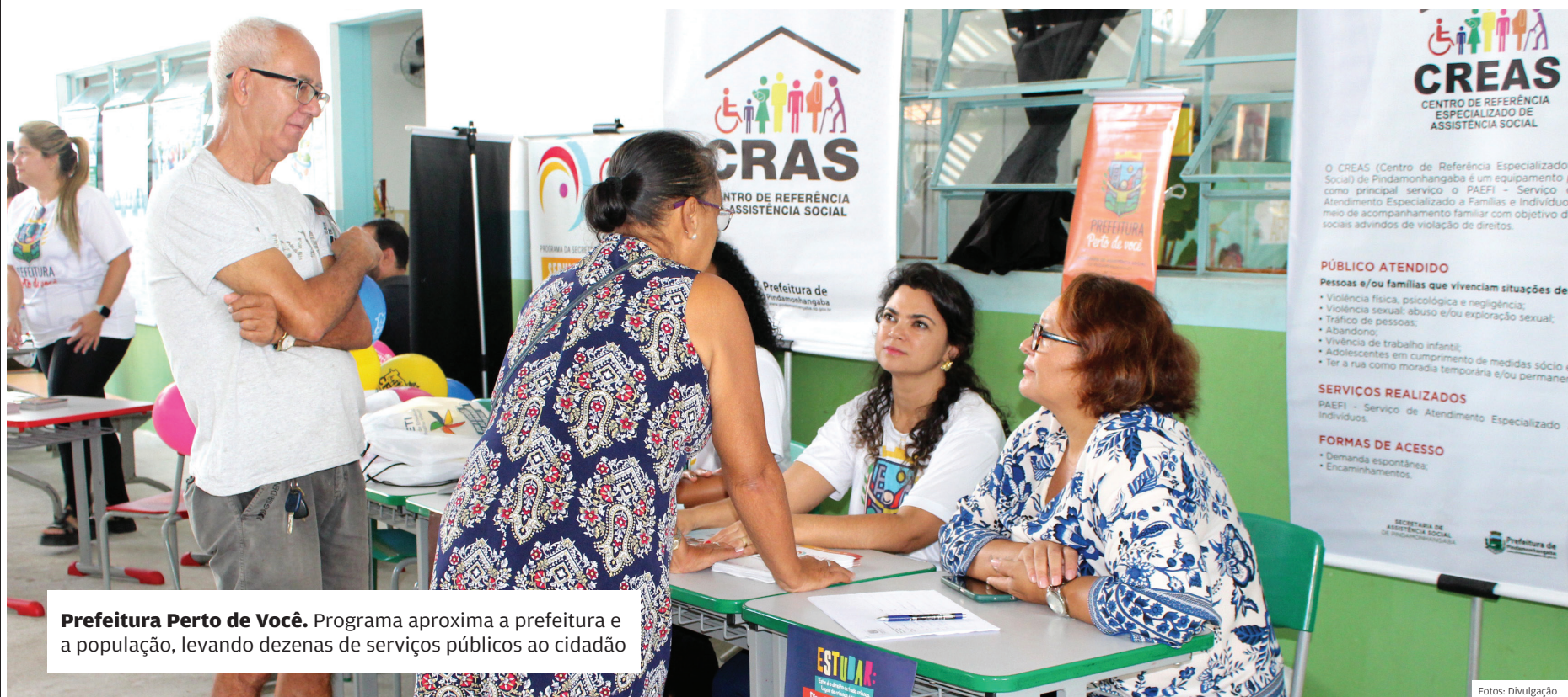
Prefeitura Perto de Você. Programa aproxima a prefeitura e a população, levando dezenas de serviços públicos ao cidadão