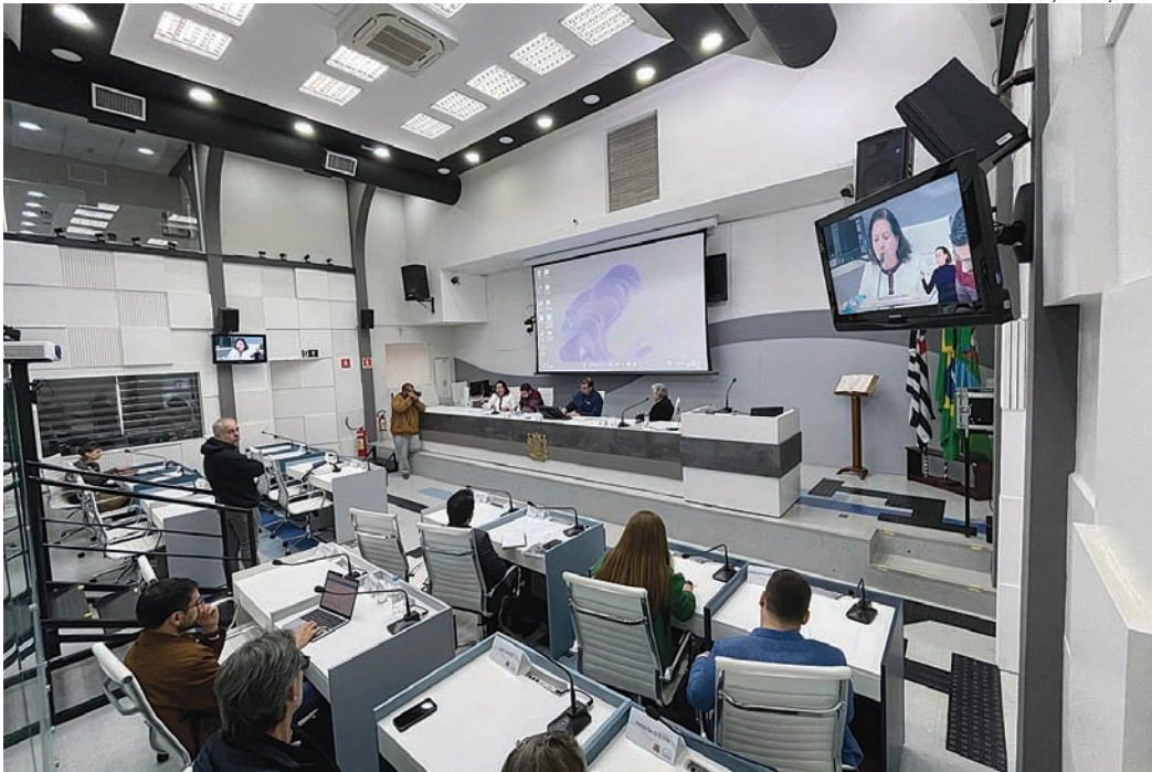
Vereadores debateram fortalecimento de comércio na região central