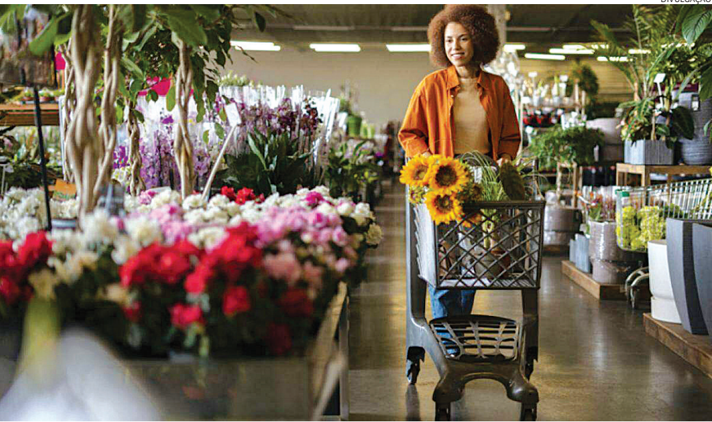
As flores seguem entre as preferências do público para a data