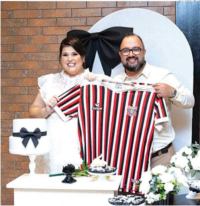
A ligação com o time foi ponto de partida para o relacionamento

O envolvimento com o time só aumentou. Nos últimos campeonatos, acompanharam todos os jogos