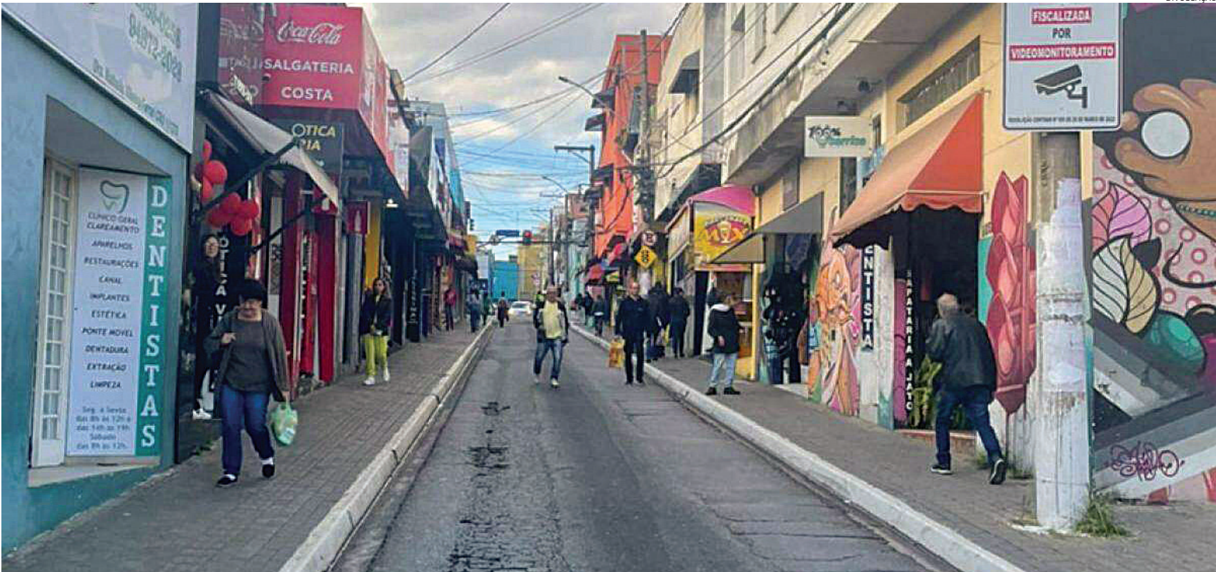
Chocolates e doces são os presentes preferidos de 35% dos consumidores que compram de pequenos consumidores

tra que o gasto médio com presentes será de aproximadamente R$ 250. Quase metade dos consumidores (49%) declarou que