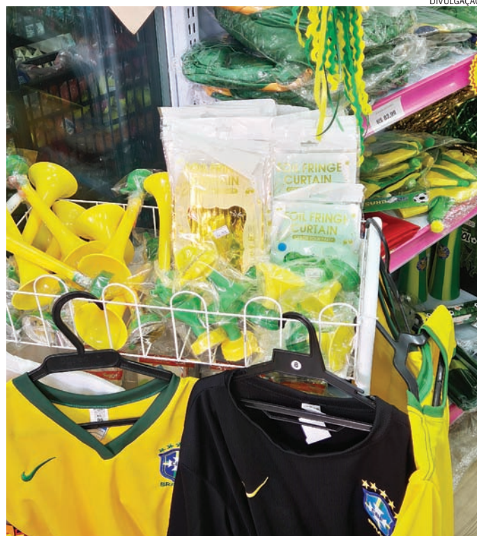
Entre os itens mais procurados estão bebidas, petiscos e carnes

“O programa é uma forma de ampliar o cuidado com os espaços públicos por meio da participação da iniciativa privada e da comunidade. Todos ganham. Em contrapartida, os adotantes podem instalar placas de publicidade