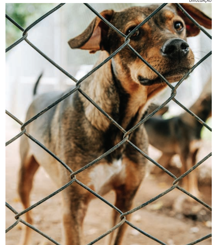
Os animais são vacinados, castrados e microchipados