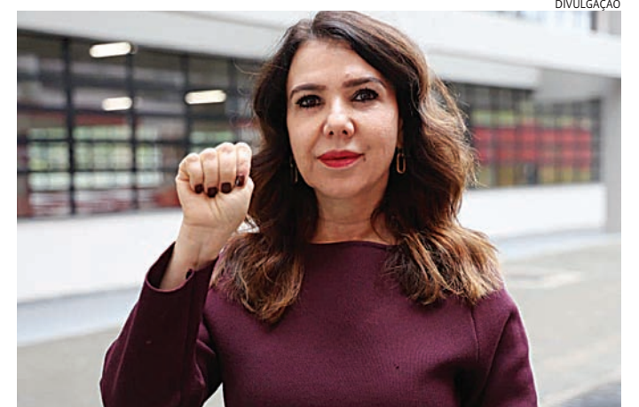
Entre as ações, palestras presenciais nas escolas

O protocolo também prevê a realização de palestras presenciais nas escolas, conduzidas por policiais civis especializados no enfre-