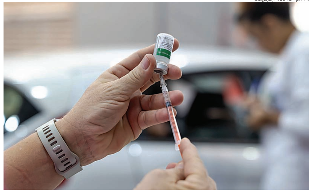
Vacinação contra a gripe está disponível para toda a população a partir dos 6 meses

Nos últimos três meses, a rede municipal registrou aumento nos atendimentos relacionados a síndromes respiratórias de forma geral. A