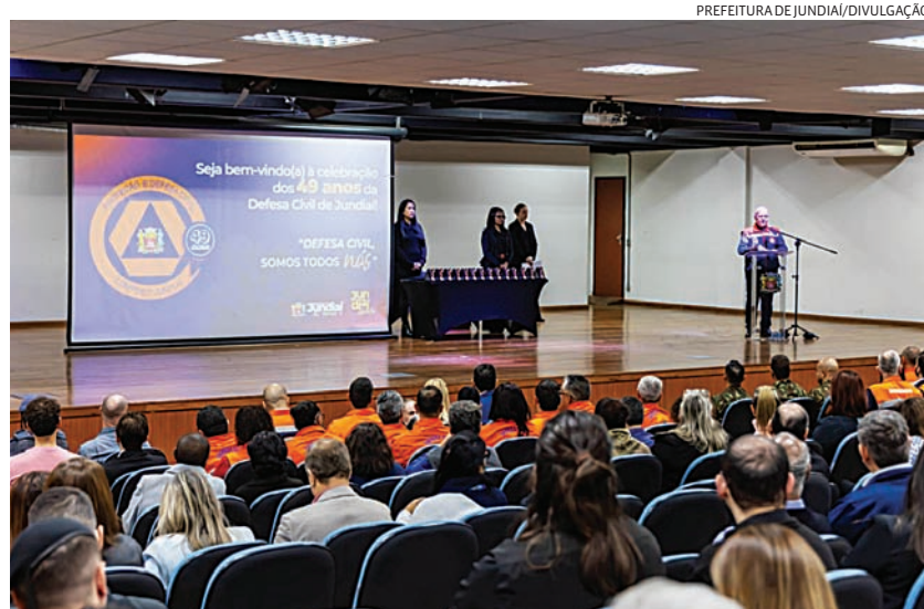
Cerimônia em prol da Defesa Civil foi na Unip