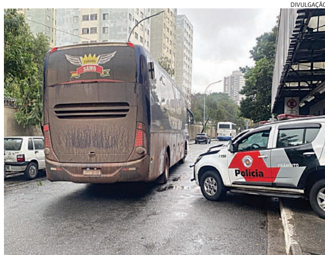
As drogas foram apreendidas pela Polícia Militar

Conforme o coronel Marcos Rogério da Cunha, comandante do CPTran, "a intenção da operação foi ampliar a fiscalização de veículos utilizados no transporte coletivo de passageiros no âmbito interes-