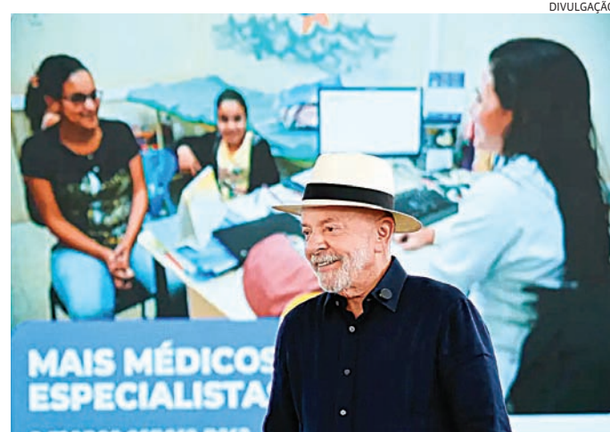
Lula abre vantagem no segundo turno em relação a Flávio Bolsonaro