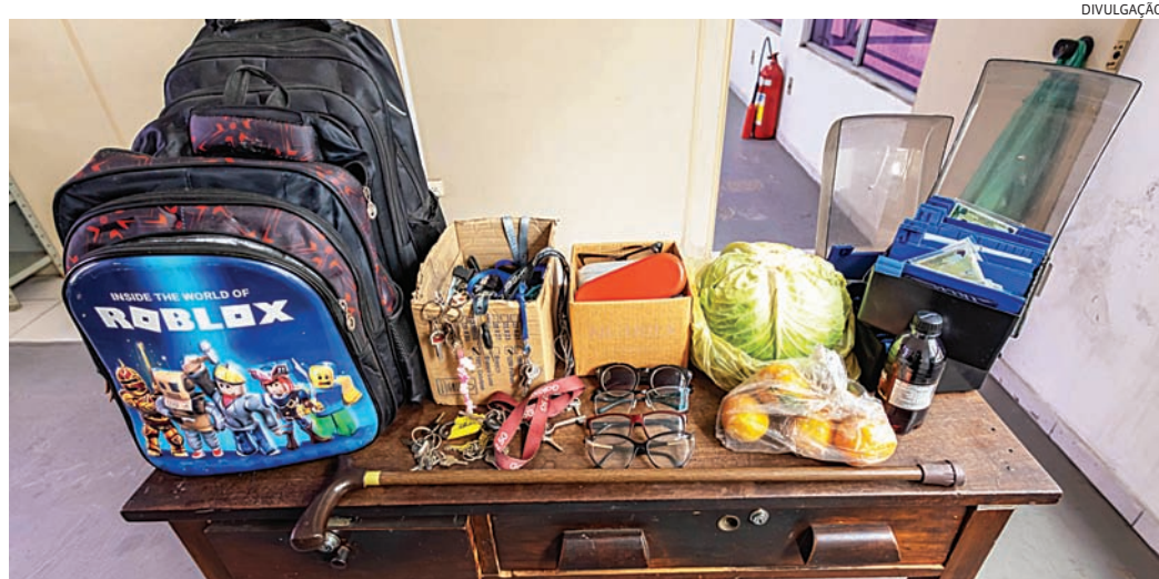
Só este ano o setor recebeu 450 documentos encontrados nos ônibus

coordenadas pelo Grupo de Trabalho do Centro (GT Centro), que vem promovendo melhorias para tornar a região central mais atrativa, acolhedora e movimentada. Além dos eventos culturais, gastronômicos e de lazer, o trabalho inclui investimentos em mobilidade urbana, iluminação pública, manutenção dos espaços e qualificação das áreas de convivência.