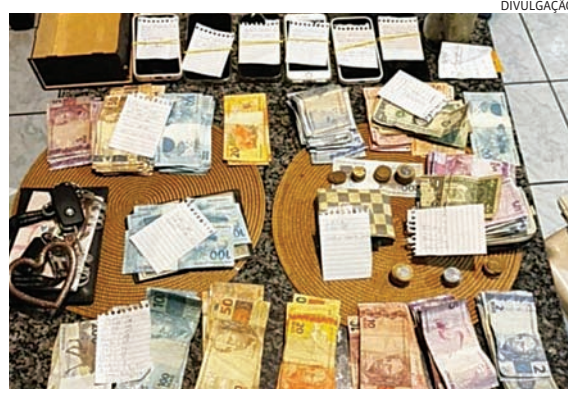
Os policiais apreenderam dinheiro, drogas, armas e celulares

Segundo o comandante do 11º Batalhão da Polícia Militar de Jundiaí, tenente-coronel Augusto José Martinelli, o trabalho investigativo revelou conexões entre grupos criminosos que atuam em Jundiaí e região com traficantes de cidades distantes, como Ribeirão Preto e São José do Rio Preto. "A ligação entre esses grupos estava no uso das mesmas empresas de fachada para a lavagem de dinheiro proveniente do crime organizado", explicou o comandante durante entrevista coletiva realizada na sede do 11º BPM/I.