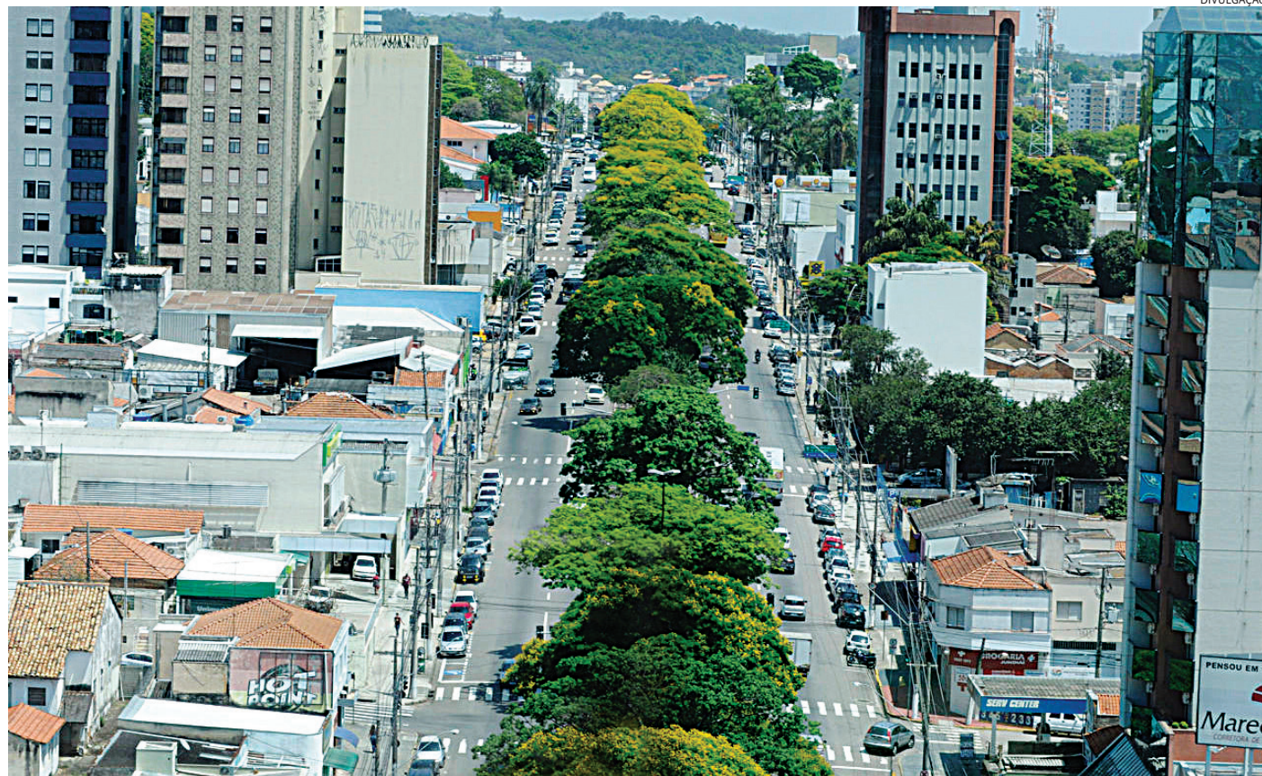
Atualmente Jundiaí possui mais de 29 mil unidades habitacionais aprovados

Vale lembrar que entre as principais medidas em estudos estão o ordenamento do território, ou seja, levantamento das demandas e início das discussões para revisão do Plano Diretor; re-