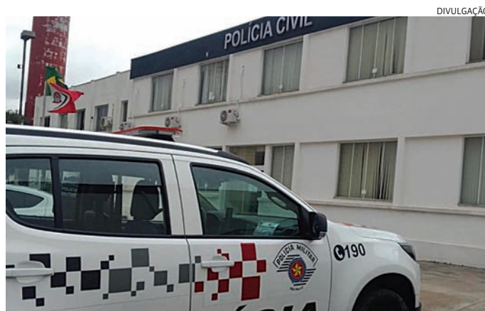
Os dois suspeitos foram conduzidos à DIG de Jundiaí

O Velório Municipal informou sobre 4 óbitos, autorizado pelas famílias.