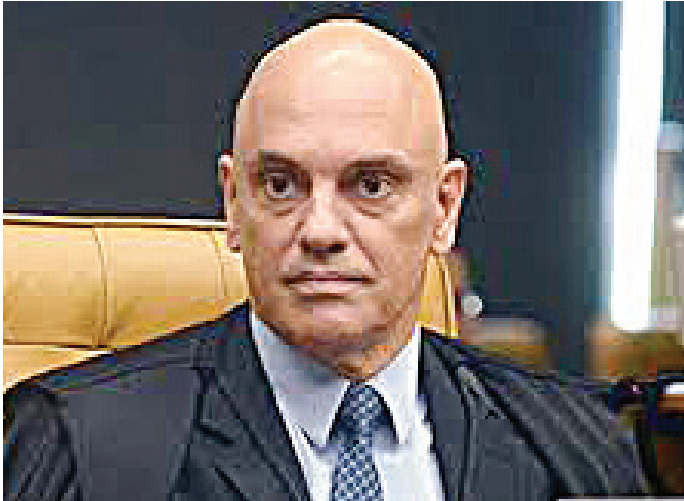
Ministro Alexandre de Moraes do STF ameaça tirar X do ar

Isso porque Alexandre de Moraes fixou multa diária de R$ 1,4 milhão caso o X não derubasse as contas do senador Marcos do Val (Podemos-ES) e outras seis pessoas. A decisão é do dia 13 de agosto, e a rede de Musk ainda não a cumpriu. Em sua conta oficial, Elon Musk comentou a decisão de Moraes. Ele disse que o ministro é um “criminoso da pior espécie, disfarçado de juiz” e disse que a esquerda tem apoiado “ditaduras em todo o mundo”. “O tirano @alexandre é o ditador do Brasil”, escreveu Musk. Nesta quarta-feira (28), Moraes também intimou o empresário, via mensagem publicada na rede, a indicar em 24 horas um novo representante da empresa no Brasil. Ele estabeleceu a pena de suspensão das atividades da rede social, caso a medida não seja cumprida. A intimação de Moraes foi postada pelo perfil do Supremo do próprio X, na qual a conta do empresário na rede e do Global Government Affairs foram marcados. A publicação foi feita às 20h07 de quarta e o prazo para a resposta termina