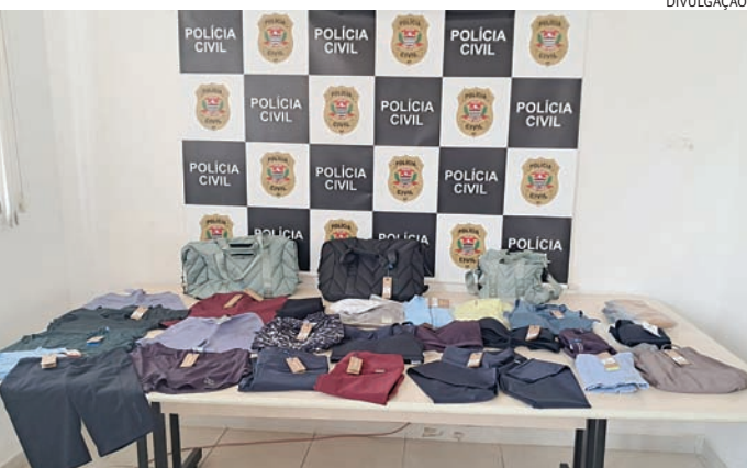
Toda a mercadoria localizada com ela foi apreendida pelos policiais