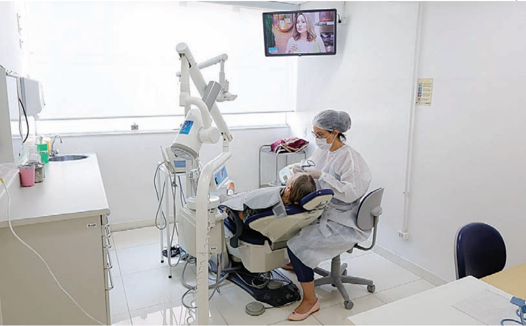
A estrutura física e o mobiliário já estão adequados para o tipo de atendimento