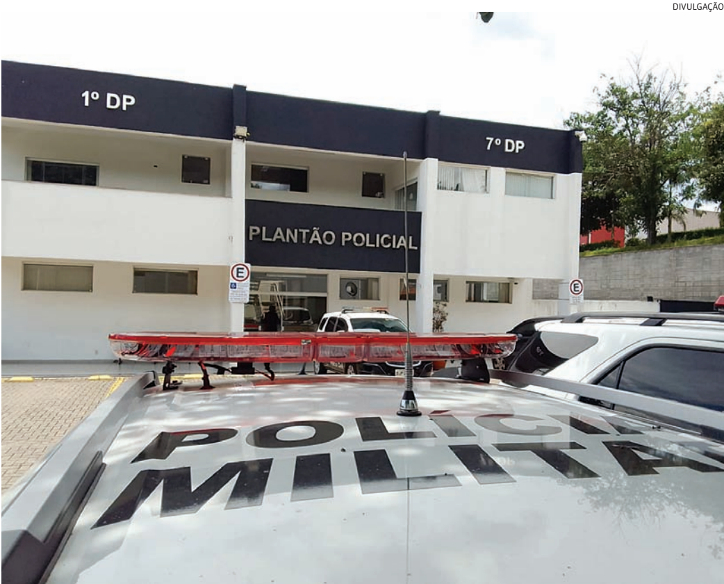
Um homem suspeito de participar da tortura foi preso e confessou o crime

Um homem com os pés e mãos amarrados com fios e panos, e bastante ferido após uma sessão de tortura, praticada por bandidos da facção criminosa Primeiro Comando da Capital (PCC), foi salvo por policiais militares no instante em que seria morto e enterrado, na tarde desta quarta-feira (28), no Jardim Novo Horizonte (Varjão), em Jundiaí. A PM foi acionada via 190 para atender a uma ocorrência em que várias pessoas estariam agredindo um homem em um terreno no Varjão. Uma equipe foi para o local - um pasto onde ocorre tráfico de drogas -, e se deparou com quatro pessoas em atitude suspeita, e que correram para um