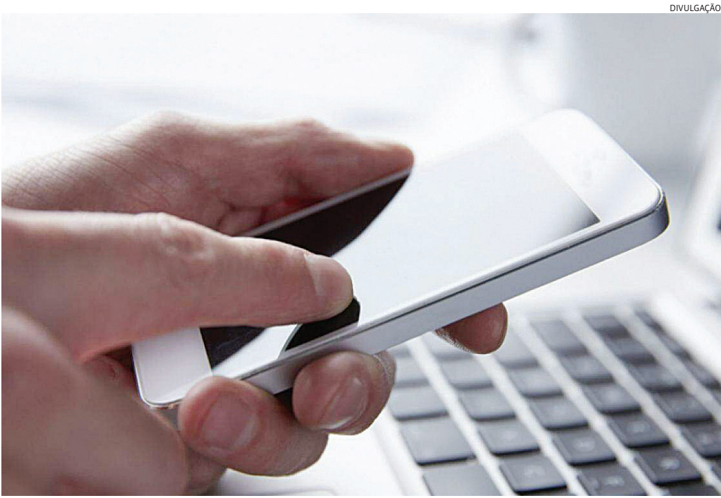
Pesquisa revelou que 24% dos participantes já sofreram golpes em função do uso da tecnologia

Já 24% (198 participantes) afirmaram ter sido vítimas de golpes ou fraudes em função do uso da ferramenta, citando situações como perfis falsos, valores bem abaixo do mercado, entre outros. A percepção revelada pelos consumidores com relação aos golpes atribuídos ao uso da IA aponta para a necessidade de mais atenção por parte das empresas e dos órgãos de defesa do consumidor na prevenção contra esse