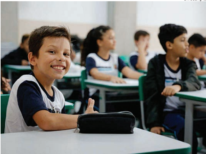
Pais ou responsáveis precisam ir até a escola municipal mais próxima