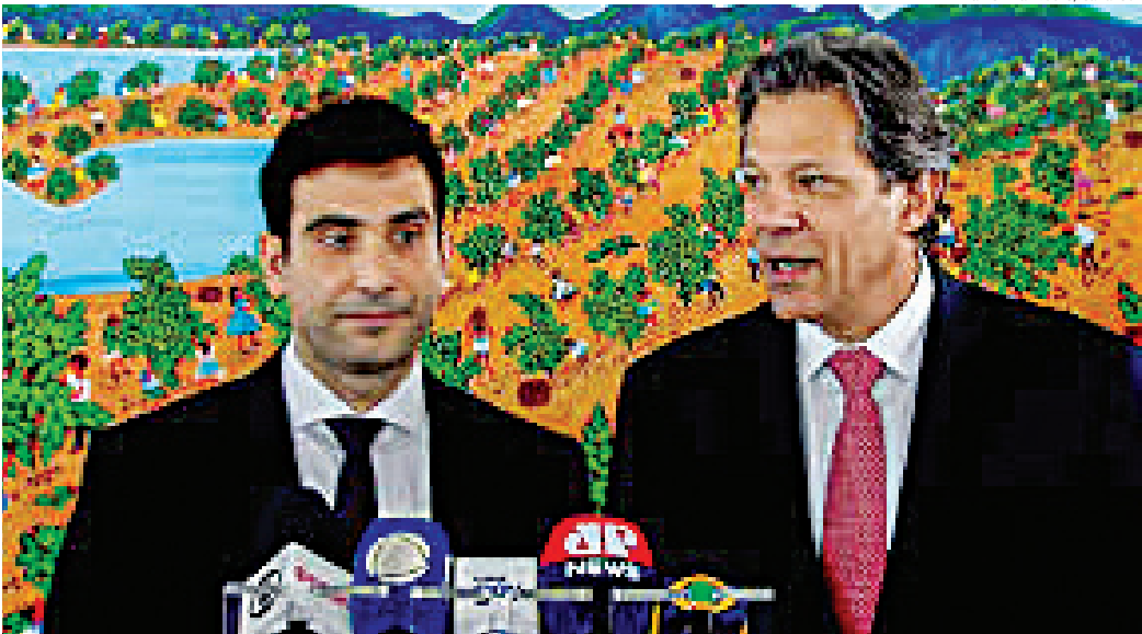
Gabriel Galípolo foi indicado pelo presidente Lula para presidir o Banco Central; Senado tem que aprovar

Tem candidato a vereador querendo comprar o voto em cidades da região, conforme denúncias de leitores do JJ. As eleições estão chegando e é importante que o eleitor fique atento a