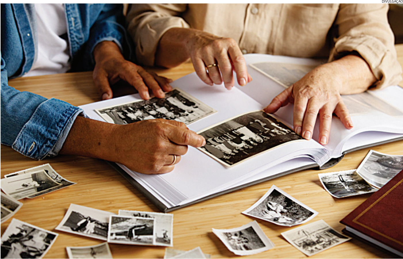
A maioria dos desaparecimentos dura alguns dias e a pessoa então é encontrada e volta para casa, mas há casos que perduram por anos sem solução

Na região abrangida pela Delegacia Seccional de Jundiaí, com nove cidades, são de 30 a 40 desaparecimentos por mês registrados em boletim de ocorrência. Ao menos um por dia na média, segundo dados do Processo de Investigação de Desaparecimento (PID), da Delegacia de Investigações Gerais (DIG) de Jundiaí. Ainda segundo o PID, essas pessoas somem por diversos motivos, como dependência química, fugas, ausência intencional. Apenas uma pequena parte dos desaparecidos não é mais encontrada.