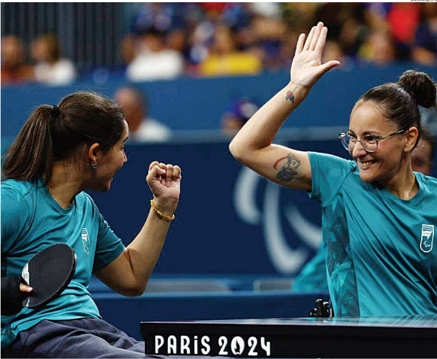
As brasileiras voltam à arena hoje (30), a partir das 7h, pelas semifinais da categoria

Além da categoria duplas, a atleta jundiaieense