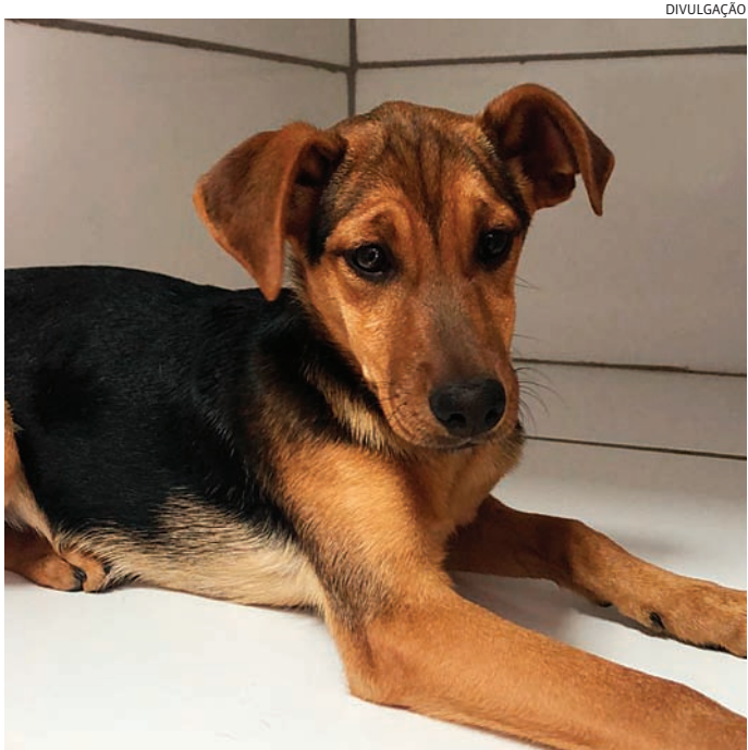
O evento vai ter cães e gatos adultos vermifugados e filhotes

SERVIÇO: Feira de Adoção de Animais do Instituto Focinho Feliz Dia: 31/8/2024 Horário: Das 11h às 15h Local: No hall da Entrada G2 Leste do Maxi Shopping Endereço: Av. Antônio Frederico Ozanan, nº 6000 – Vila Rio Branco - Jundiaí Entrada Franca no Evento