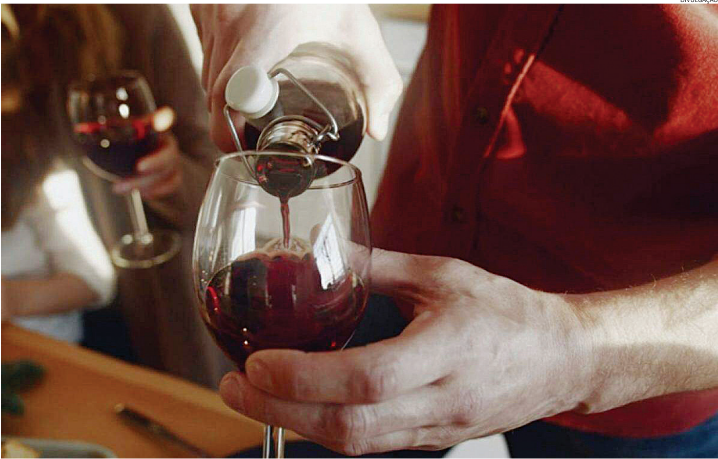
Iniciativa do Governo de SP incentiva o turismo e o agronegócio ligados à cadeia produtiva do vinho no estado de São Paulo

Outras 11 vinícolas foram organizadas como enódestinos e estão localizadas em dez municípios: Campinas, Piracicaba, Águas da Prata, Amparo (2), Leme, Penápolis, Bofete, São Paulo, São Miguel Arcanjo e Ribeirão Branco.