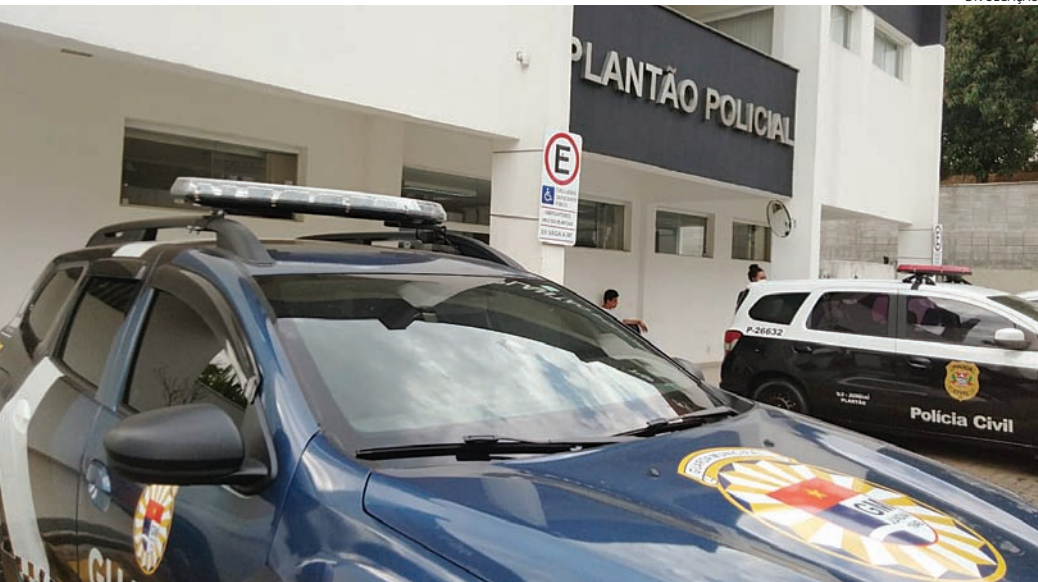
Os GMs foram acionados e prenderam o filho em flagrante

Um homem morreu atropelado na rodovia dos Bandeirantes, na madrugada desta quinta-feira (29), ao tentar atravessar a pista para fugir de uma abordagem da Polícia Militar Rodoviária. O caso aconteceu no km 036+700 da pista Norte, em Caieiras. Os policiais estavam em patrulhamento pela via, quando se depararam com um acidente envolvendo dois caminhões e um automóvel. Quando notou a aproximação, um dos envolvidos correu e pulou a mureta de concreto na tentativa de atravessar a rodovia, sendo neste momento atingido por uma Renault/Master, quando estava na segunda faixa de rolamento. Ele morreu no local. Não se sabe, ainda, a razão para a tentativa de fuga. O caso será investigado.