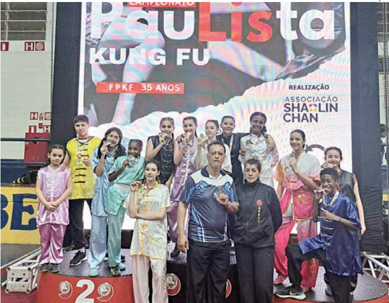
Os jundiaieense competiram ao lado de mais 400 atletas de todo o estado

dos nestes complexos formam a equipe de competição, que realiza os treinos na Associação Hu Kung-Fu Wu Shu do Brasil. Maiores informações nas redes sociais (@hukungfuwushu) e ou (@timejundiaí).