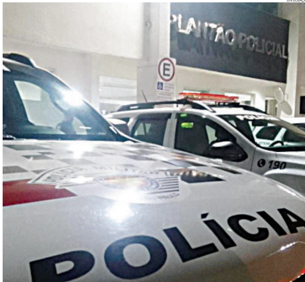
Os PMs prenderam a mulher em flagrante por tentativa de homicídio

O homem, que tem 26 anos, estava dormindo em sua residência quando, por volta das 2h30, ouviu gritos na rua. Ao sair para verificar o que ocorria, encontrou a ex-esposa ao lado de um carro, com a filha do casal dentro do veículo. Os dois iniciaram