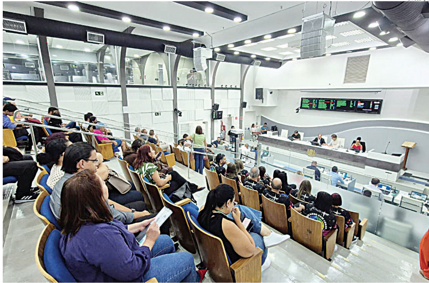
Vereadores aprovaram todos os projetos e pedidos propostos na noite de terça

ciativa busca quebrar os ciclos de violência sofridos dentro de casa. “Isso representa uma oportunidade real de mudança de vida para muitas mulheres da ci-