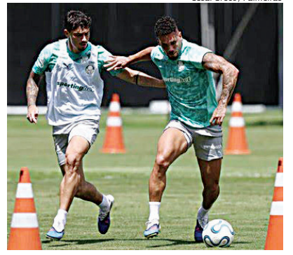
César Greco / Palmeiras

Palmeiras encara o Junior Barranquilla nesta quarta, às 21h30, na Colômbia, pela estreia na Libertadores. Verdão busca começar com vitória fora de casa. Esportes 8