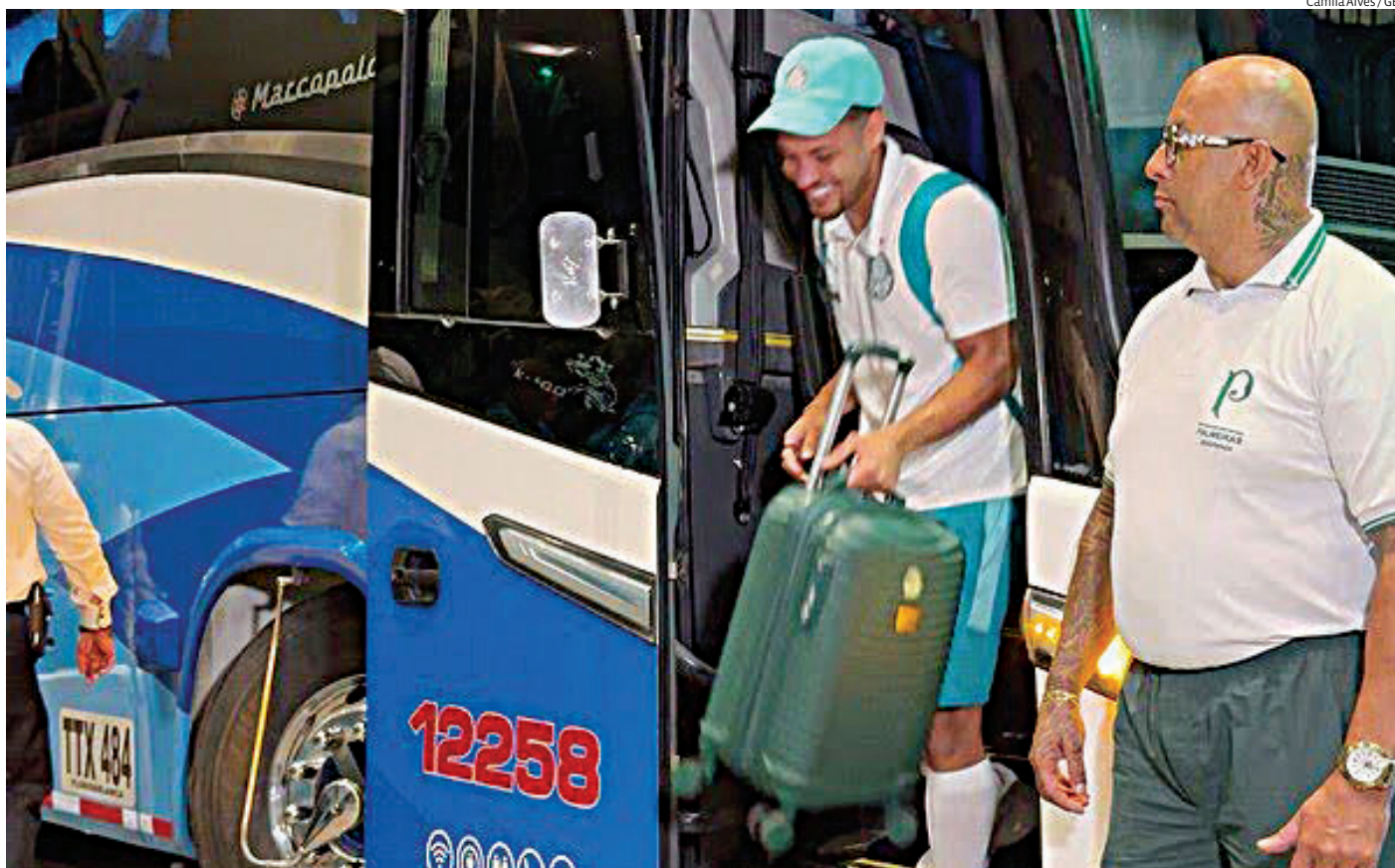
O Palmeiras chega como favorito para o duelo, sustentado pelo momento recente e pela experiência em competições internacionais

A crise também resultou na troca de comando técnico, com a saída de Dorival Júnior e a chegada de Fernando Diniz, que iniciou os trabalhos no clube nesta semana. A expectativa é de reação imediata dentro de campo, enquanto o ambiente externo segue marcado por cobranças da torcida organizada.