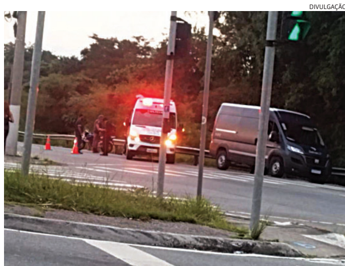
Dezenas de condutores foram parados e passaram por averiguação

constatado, por meio do chassi, que o automóvel era produto de roubo ocorrido no dia 2 de abril, em Várzea Paulista, e circulava com placas adulteradas. Diante dos fatos, o suspeito foi conduzido ao 2º Distrito Policial de Limeira, onde permaneceu preso à disposição da Justiça.