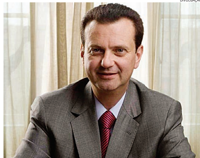
Kassab afirma que Caiado é uma alternativa à polarização

Caiado foi confirmado pré-candidato do partido na semana passada. Na ocasião, prometeu conceder indulto a Jair Bolsonaro (PL),