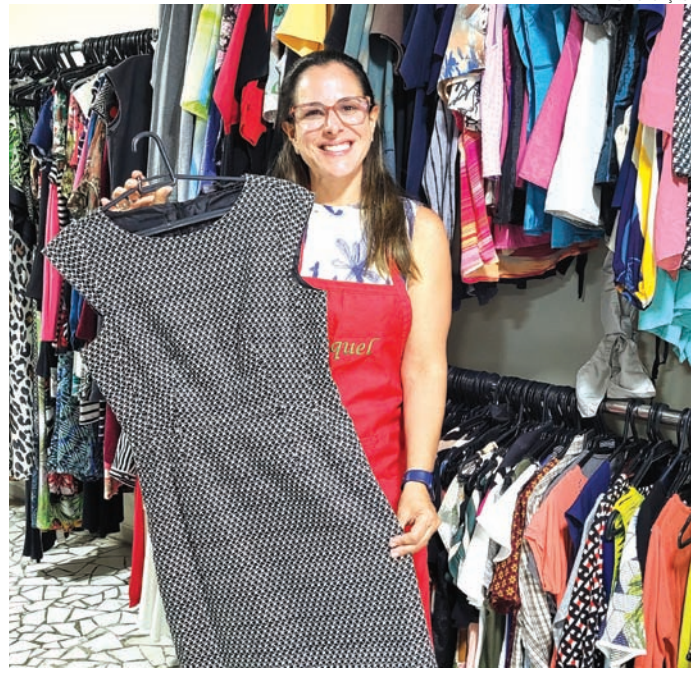
As roupas serão comercializadas a partir de R$ 3

O Bazar do Hospital São Vicente une solidariedade e consumo consciente, com toda a renda revertida em prol da Instituição. “Cada item do nosso Bazar traz consigo uma história que