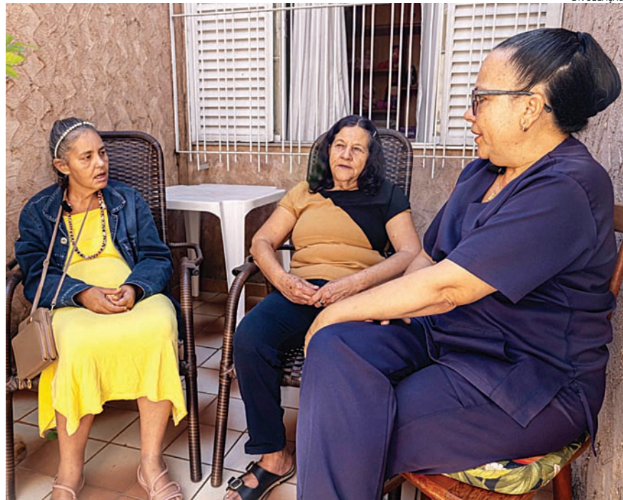
Cada SRT conta com equipes de enfermagem e cuidadores

pessoas acolhidas pelo serviço vieram de décadas de internação psiquiátrica em modelo manicomial, uma forma de tratamento em saúde mental marcada pela segregação social e pela contenção do paciente. “Ver esses indivíduos sendo cuidados com humanização é uma reparação histórica. Aqui, eles têm de volta tudo o que foi tirado deles por anos”, salienta.