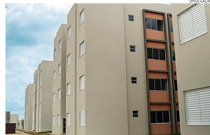
Em todos os casos, 50% das unidades têm reserva de cotas

Os empreendimentos serão Residencial Angatu, na avenida Benedito Chrispim, bairro do Castanho, com 720 unidades; Portal dos Ipês, na rua Renato Barata, bairro Colônia, com 180 unidades; Portal dos Lírios, na avenida Justiniano Borin, bairro Colônia, com 180 unidades; e Smart Apê Medeiros, na avenida João Gonçalves dos Reis, Medeiros, com 174 unidades.