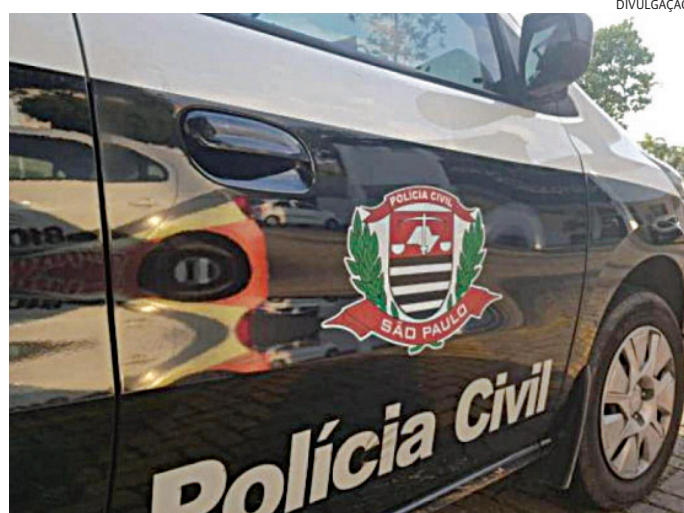
A Polícia Civil investiga sobre um possível crime de homicídio

Durante o atendimento da ocorrência, os policiais receberam informações de pessoas que preferiram