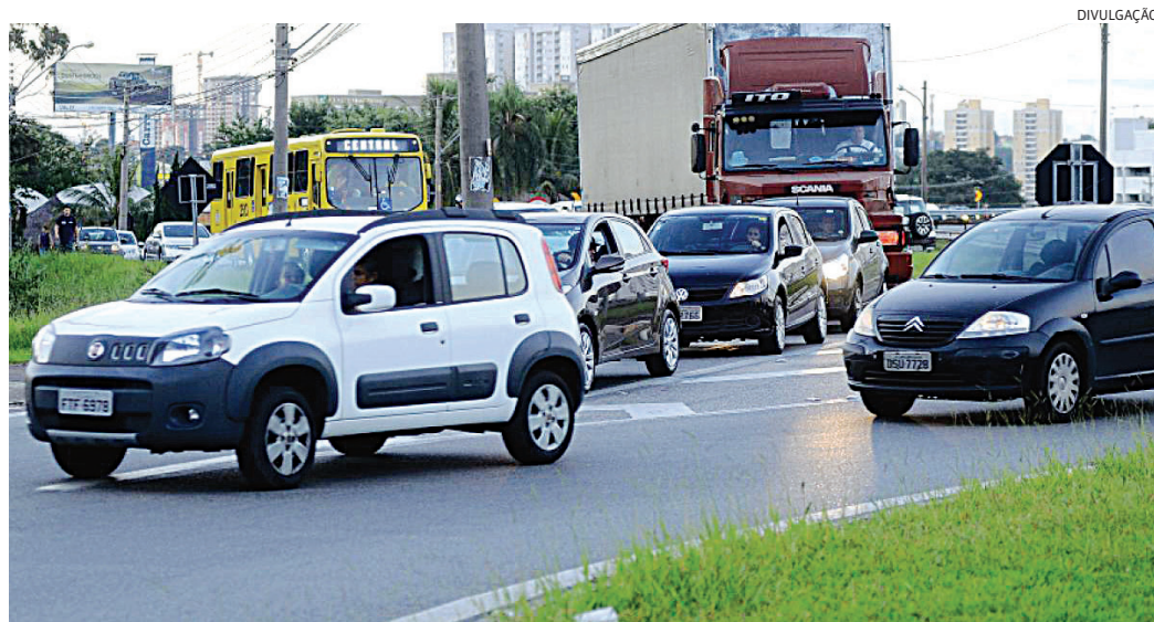
Em Jundiaí, o aumento de veículos licenciados aumentou 2,5%