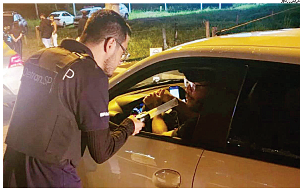
Números de infrações aumentaram em 2025 e voltaram a cair em 2026

Entre as punições estão multa de R$ 2.934,70, sus-