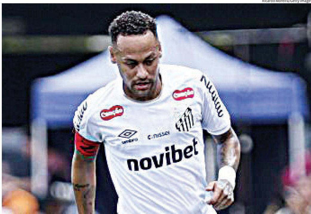
A partida é válida pela primeira rodada do Grupo D e representa um desafio fora de casa

A partida terá transmissão por TV fechada e streaming, marcando o início da caminhada santista em busca de protagonismo na Sul-Americana.