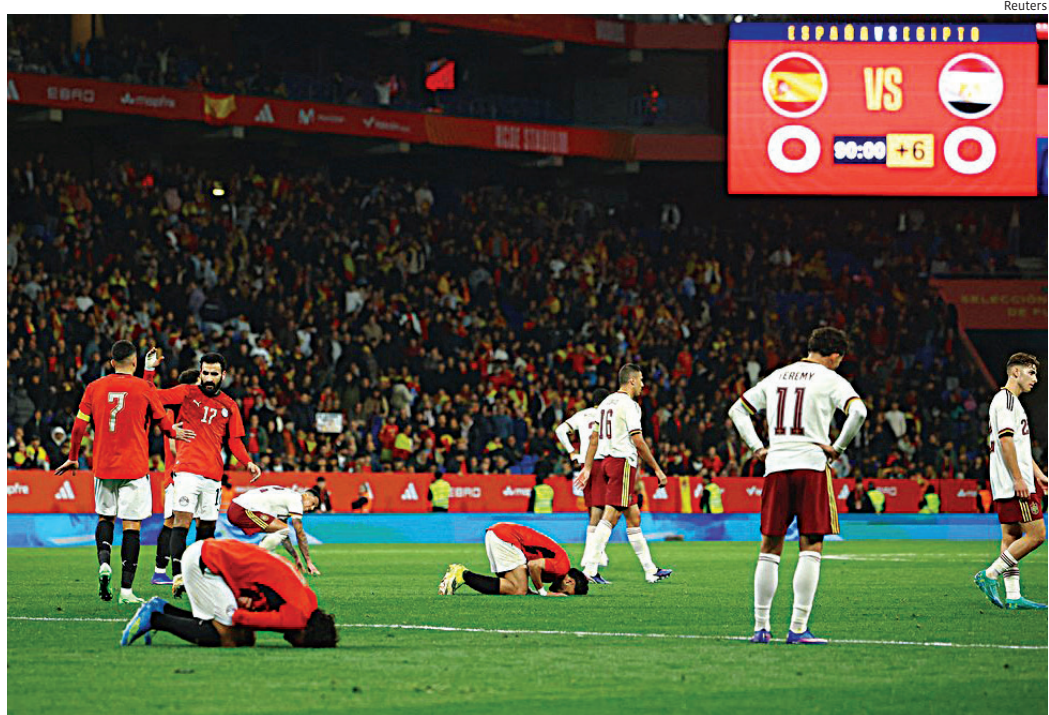
O protocolo antirracismo foi acionado no estádio, com avisos sonoros pedindo a interrupção das manifestações