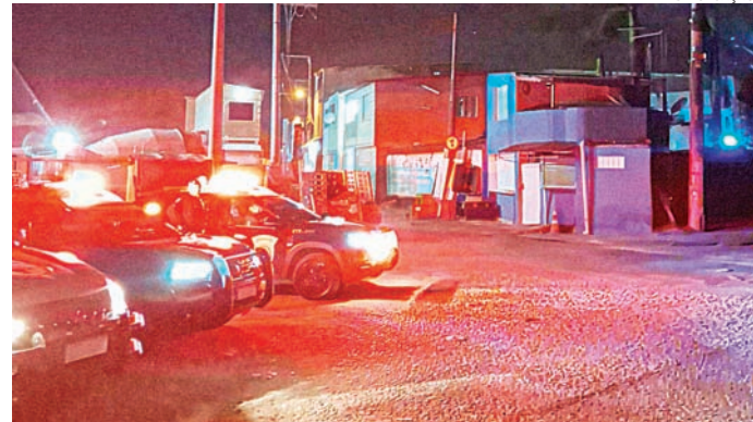
Os bairros foram monitorados de acordo com as denúncias

da Guarda Municipal de Jundiaí, pelos telefones 153 e (11) 4492-9060, além do aplicativo ‘153 Jundiaí’.