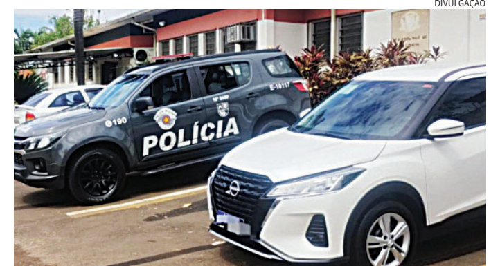
O automóvel era produto de roubo ocorrido no dia 2 de abril

Diante disso, os policiais intensificaram as buscas e localizaram o carro na Avenida Fausto Esteves dos Santos, no bairro Cecap. Ao perceber a aproximação das