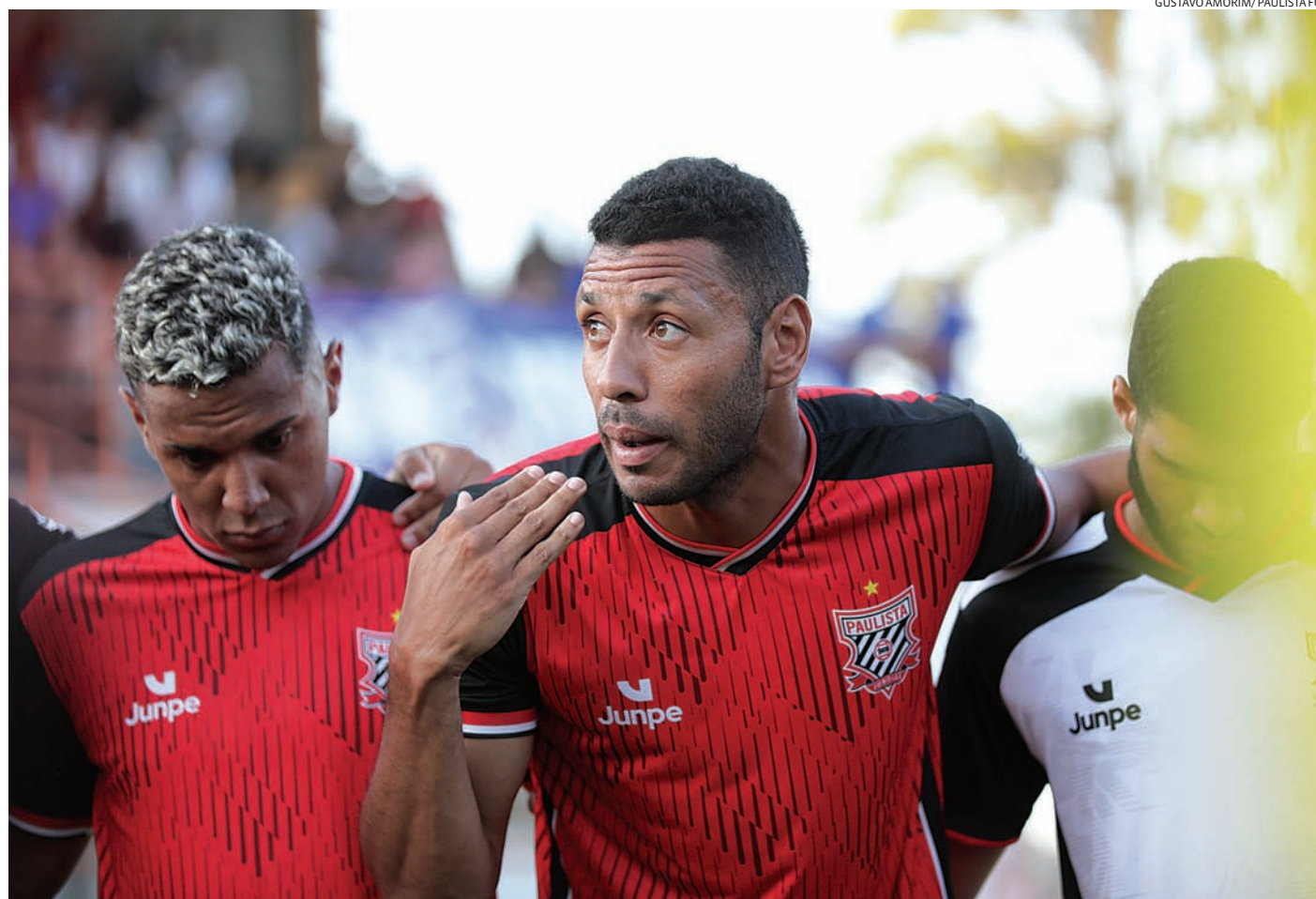
O primeiro compromisso do Paulista está marcado para a próxima quarta-feira (22), no Jayme Cintra

De acordo com o regulamento da Federação Paulista de Futebol (FPF), o clubes devem inscrever para a disputa da competição uma Lista A com até 26 jogadores. Porém, jogadores comprovadamente formados na base do clube podem ser inscritos em uma Lista B, com número ilimitado de jogadores e durante toda a competição.