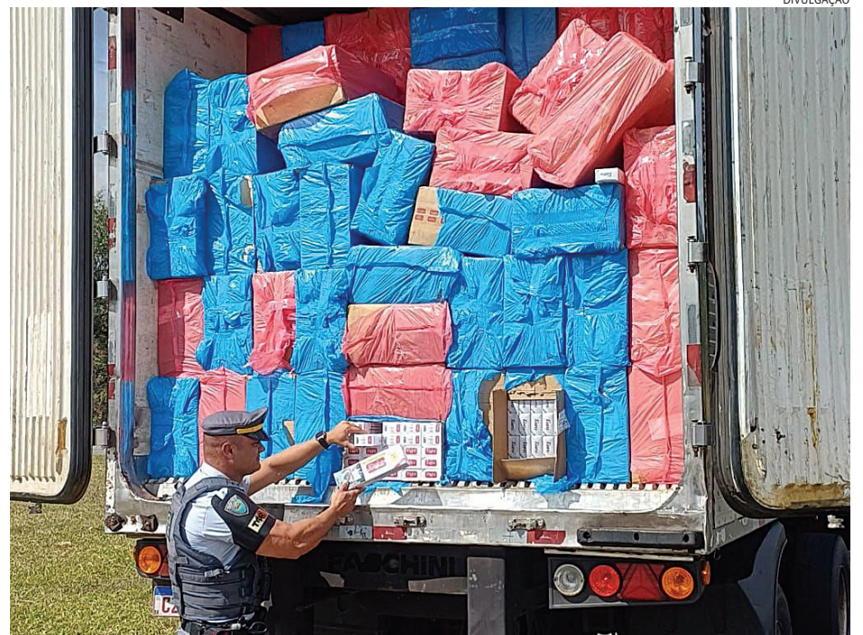
Os maços de cigarro e o caminhão foram apreendidos pela polícia

Os itens e o caminhão foram apreendidos e, o motorista, encaminhado à Polícia Federal, onde o caso foi registrado.