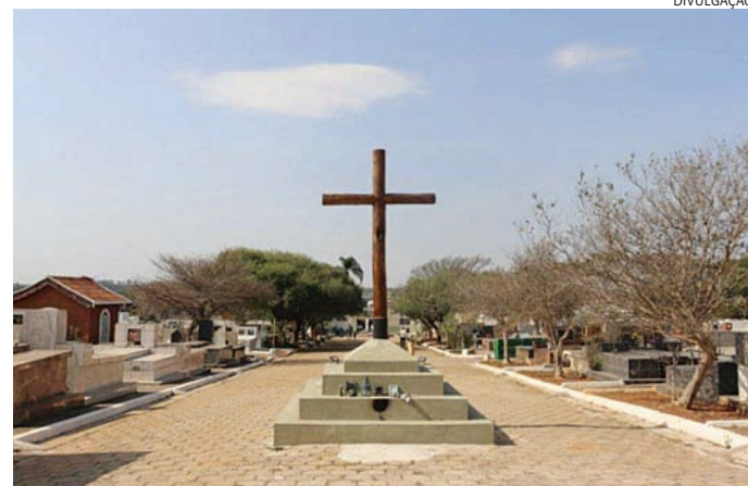
Os funcionários plantonistas são acionados aos fins de semana