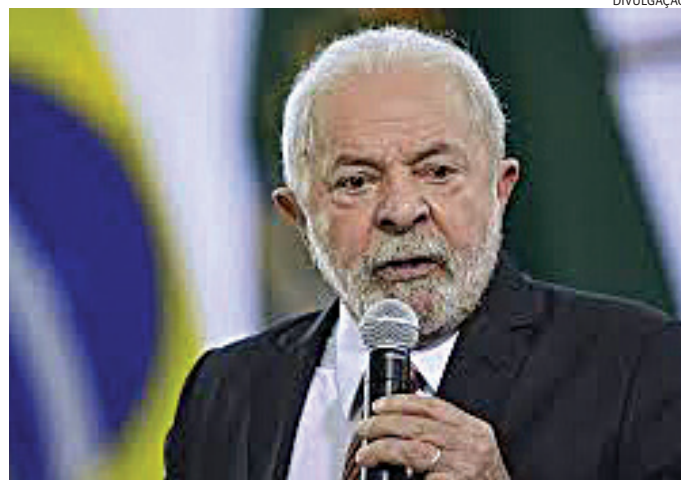
Presidente inicia conversas com base aliada para troca de ministros

há aposta na acomodação dos presidentes da Câmara, Arthur Lira (PP-AL), e do Senado, Rodrigo Pacheco (PSD-MG). Eles deixarão o comando das duas Casas em fevereiro.