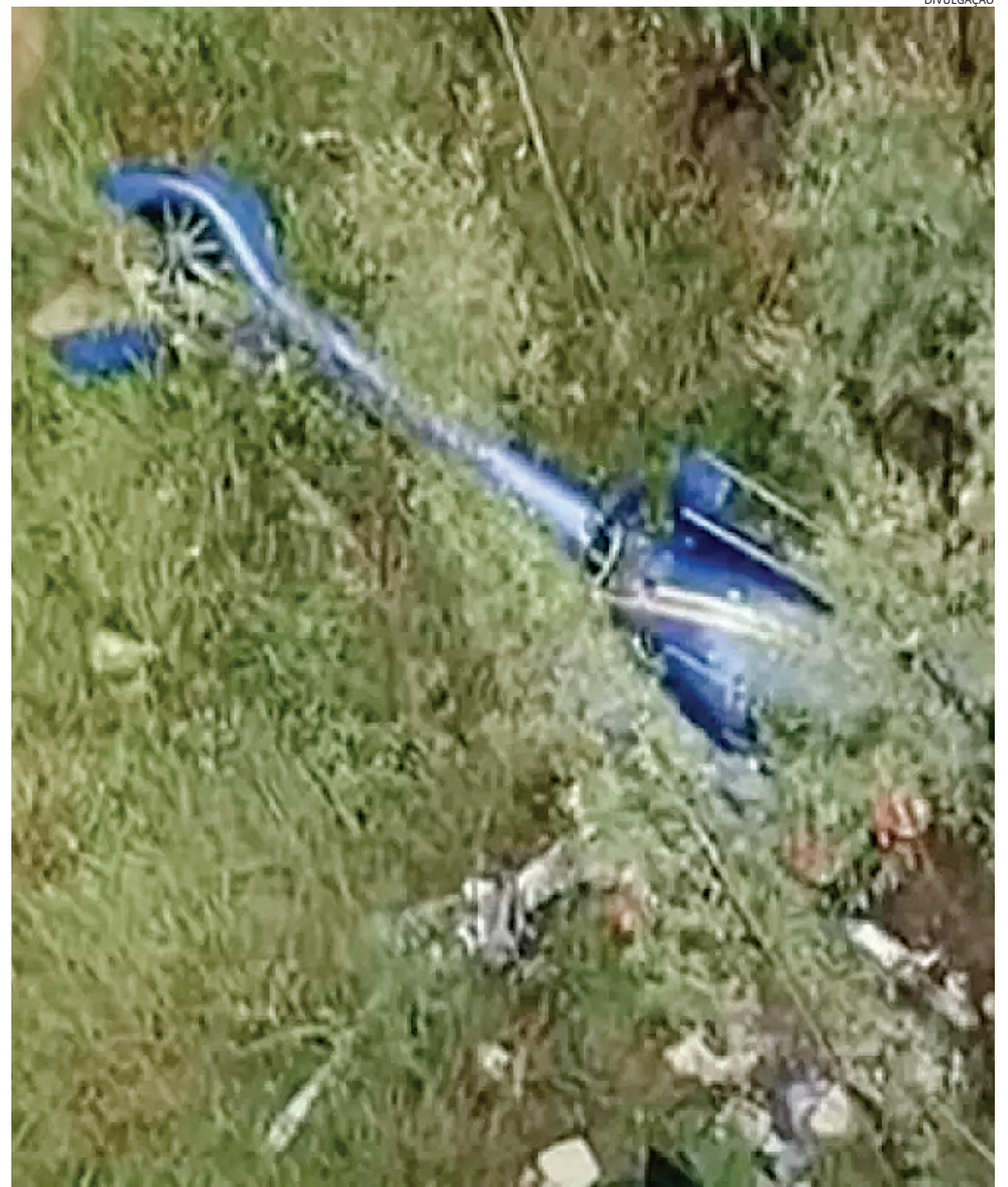
O empresário, a mulher e a filha, de 11 anos, saíram na noite de quinta e seguiam para a cidade de Americana

As autoridades seguem investigando as causas do acidente e trabalhando no local. Mais informações serão divulgadas à medida que os trabalhos avançarem.