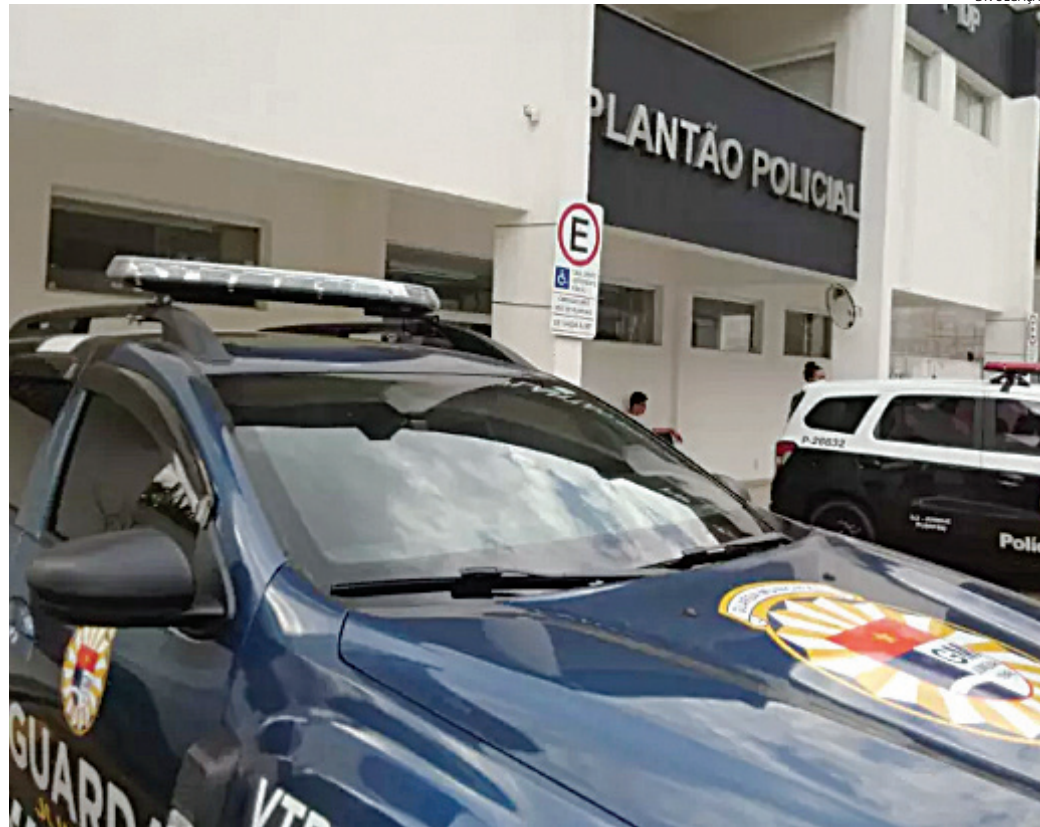
Os GMs realizaram um cerco e conseguiram prender as duas suspeitas

A mulher que estava do lado de fora tentou disfarçar, mas acabou sendo abordada. Enquanto era questionada, a comparsa apareceu