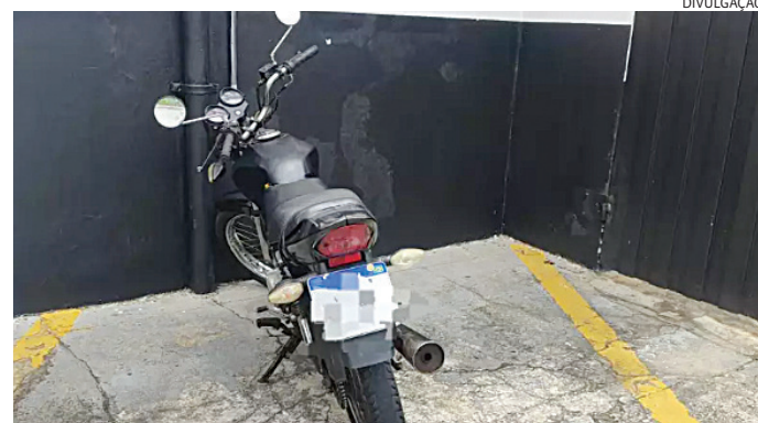
A moto estava com queixa de furto e foi recuperada pelos GMs

GMs em patrulhamento foram informados de que uma moto com queixa de furto estava circulando pela região da cidade, e então efetuaram um cerco nas principais vias.