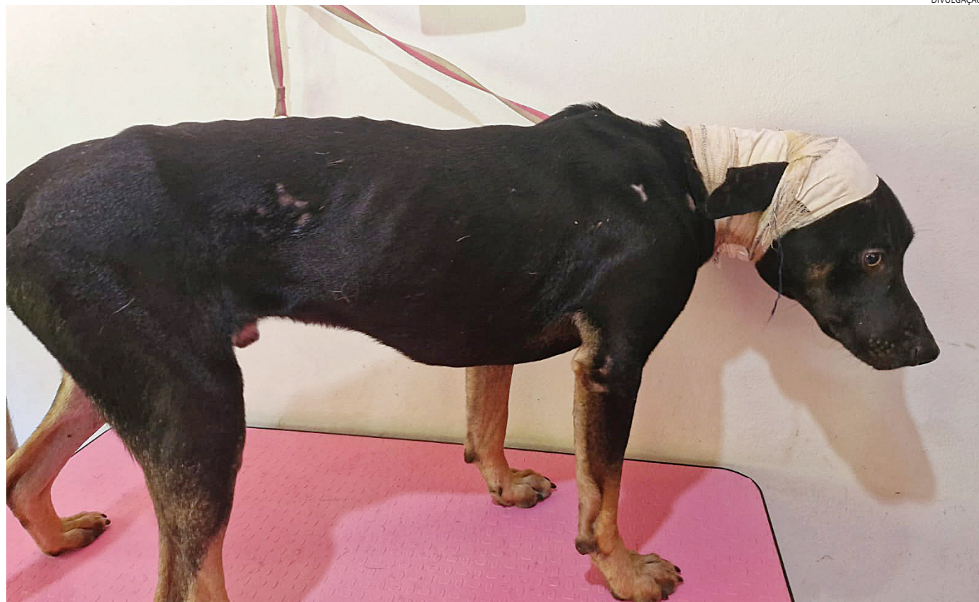
Há 15 anos, a ONG Amiga dos Animais resgata e cuida de cães; ajude com doações de ração