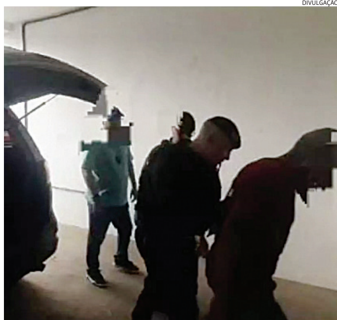
O homem foi preso por dever pensão alimentícia