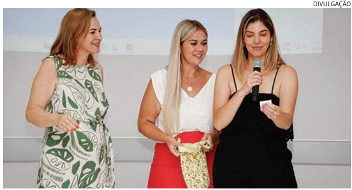
O projeto tem como objetivo proporcionar apoio, acolhimento e fortalecimento

A reportagem do JJ procurou a empresa Gabetta de Campo Limpo Paulista por telefone e foi atendida, mas não obteve retorno sobre a demanda até o fechamento da matéria.