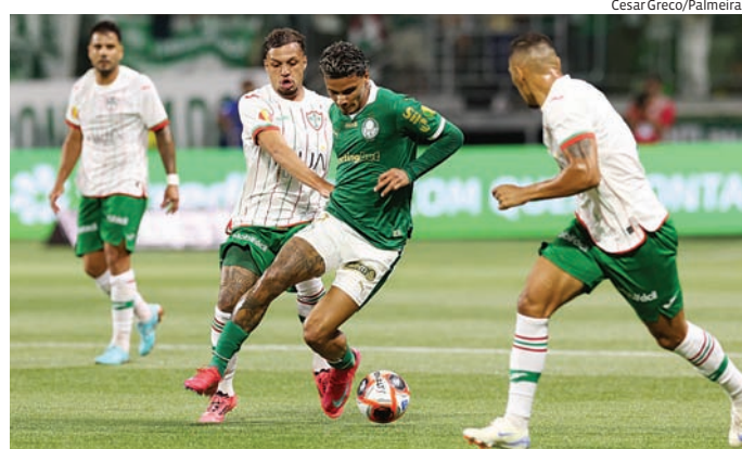
O Verdão deve ir a campo com uma escalação diferente da estreia

No treino de ontem, o Palmeiras encerrou sua preparação para a partida e a novidade foi a presença de Piquerez, que ainda se recupera de lesão no