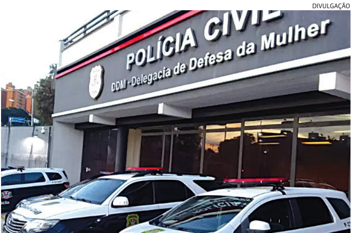
O ex-namorado foi levado para a DDM e depois para a cadeia

Os investigadores da DDM deram cumprimento ao mandado nesta segunda-feira e ele foi levado para o Centro de Detenção Provisória (CDP) de Jundiaí.