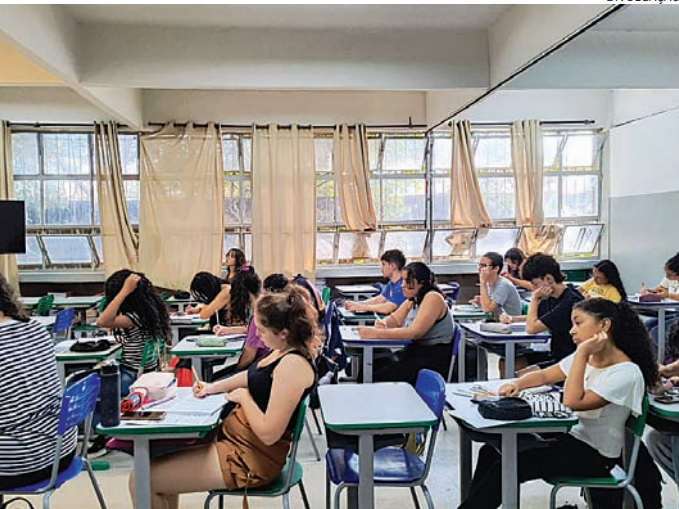
Estudantes e egressos de escola pública podem se inscrever

Os conteúdos das aulas focam os processos seletivos mais concorridos – ENEM, Fuvest, Unicamp e FATECs –, incluindo círculos culturais sobre temas sociais brasileiros e internacionais, o que é um diferencial da rede, pois proporciona aos estudantes o domínio de conceitos comumente requeridos nas redações dos processos se-