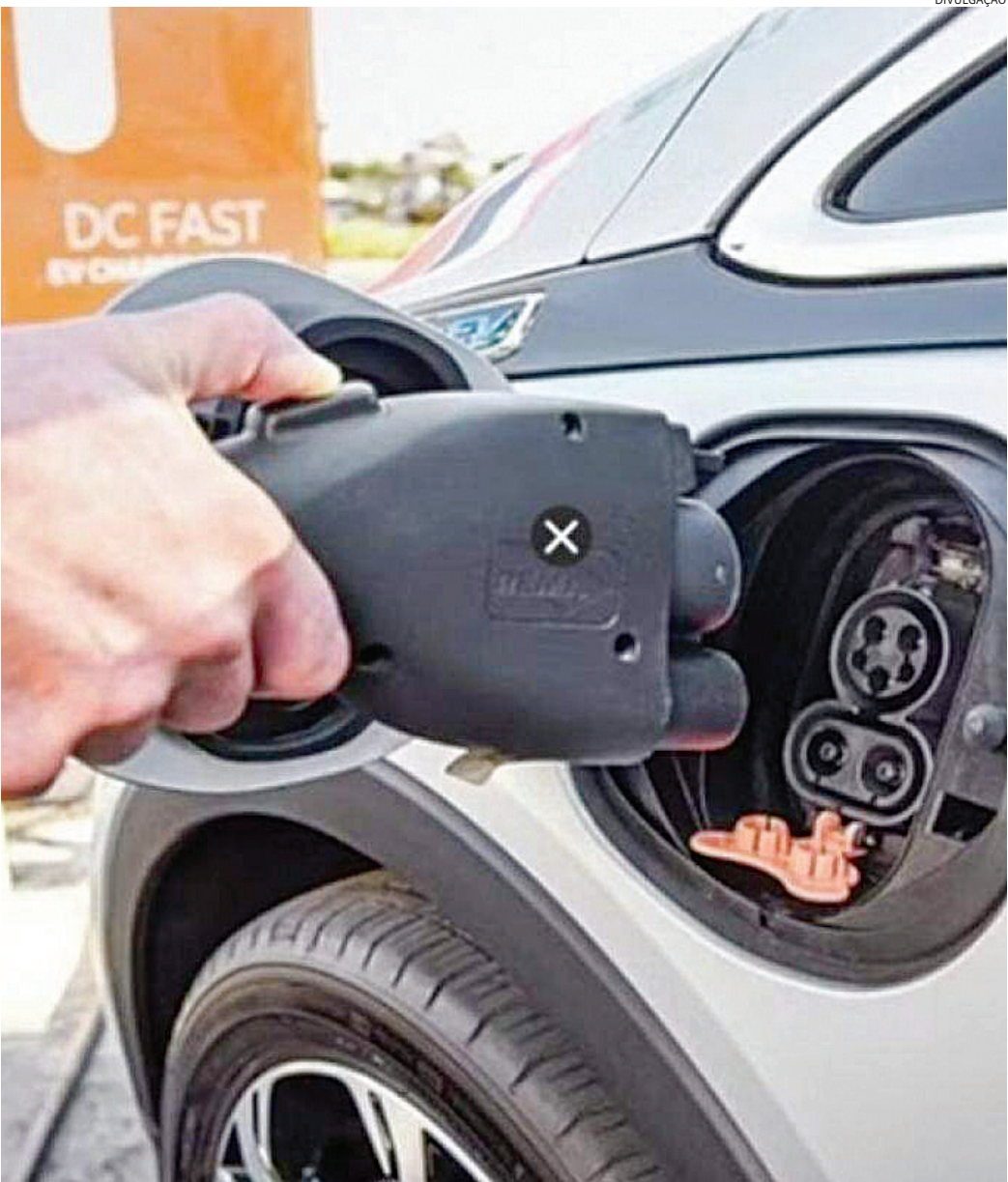
Em 2023, a cidade contava com 921 veículos elétricos e híbridos, número que saltou para 1.934 em 2024.

da enfrenta desafios na expansão da infraestrutura para carros eletrificados. Hoje, há apenas dois pontos de recarga públicos em funcionamento, localizados em frente ao Paço Municipal, disponíveis de segunda a sexta-feira,