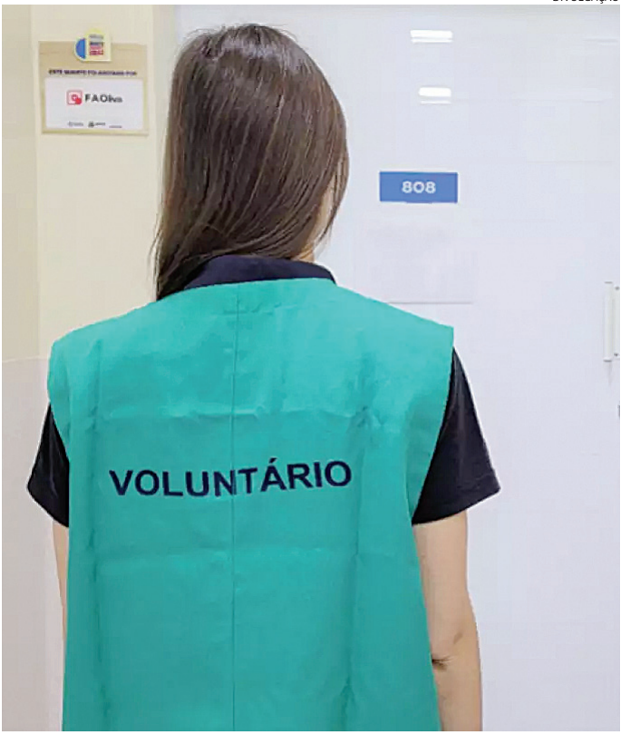
Poderão se candidatar, até o dia 5 de fevereiro, maiores de 25 anos

As inscrições poderão ser feitas pelo e-mail savocientesolidario@hsv-icente.org.br . Nele, os interessados deverão informar o nome completo, a idade e o telefone para contato. Há a possibilidade também de realizá-las por WhatsApp pelo número 4583-8181, enviando o nome e a idade. Após a inscrição, o candidato receberá todas as informações sobre o processo seletivo. A Instituição reforça que é obrigatória a apresentação do certificado de vacinação contra a covid-19.