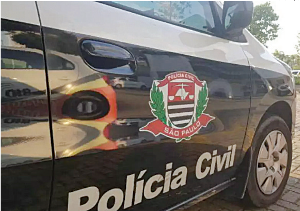
A Polícia Civil vai investigar o caso

Pai e filha - segundo informações do pai, ela não tem mãe -, brincavam nas piscinas, quando as monitoras e outras pessoas que se divertiam no local, co-