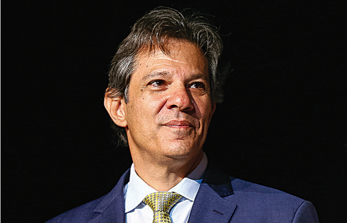
Equipe de Fernando Haddad conseguiu cumprir a meta fiscal para 2024

A redução nas compensações tributárias também ajudou o governo a ampliar receitas. O instrumento permite aos contribuintes usar créditos tributários para abater o valor de impostos a pagar. Quanto menor é o valor compensado, maior tende a