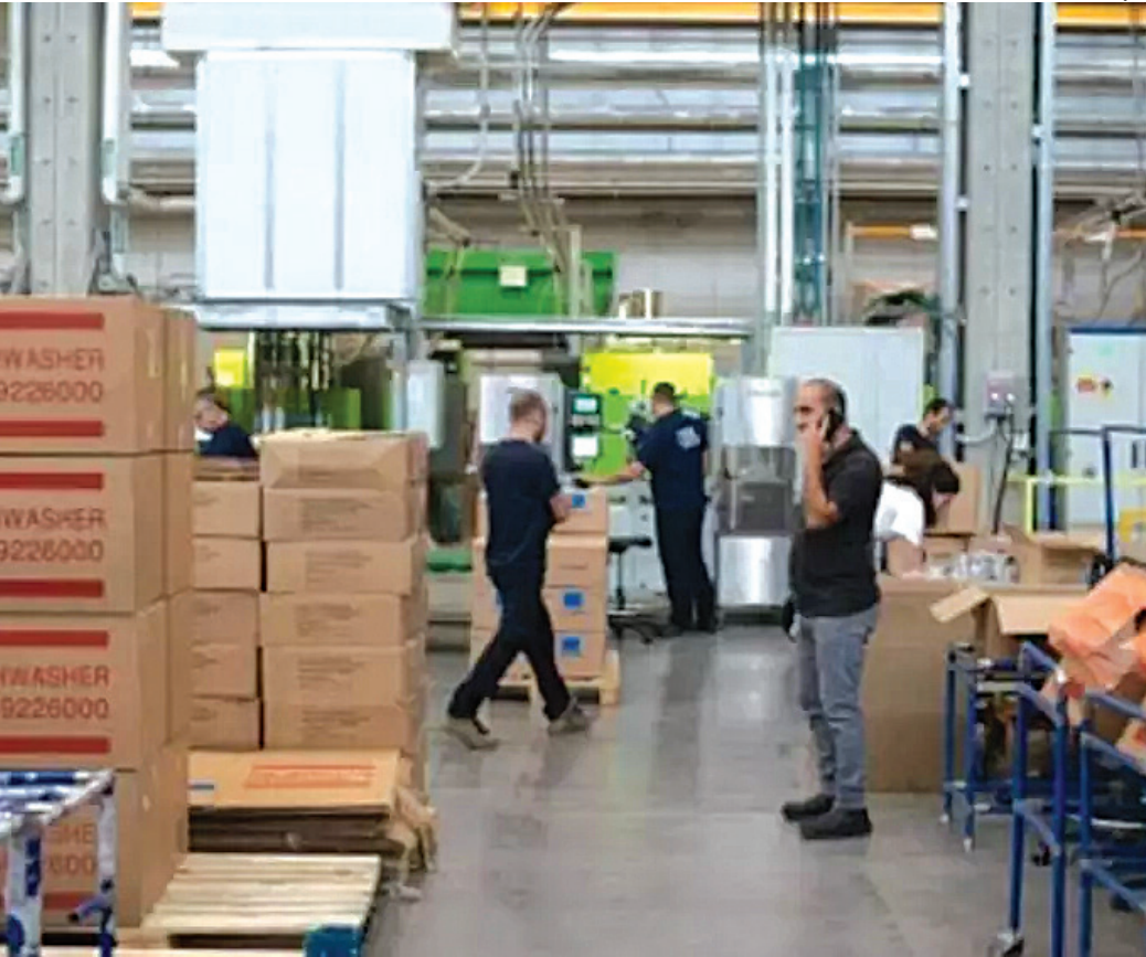
Para habilitar-se a uma vaga específica, o serviço deve ser solicitado de forma presencial