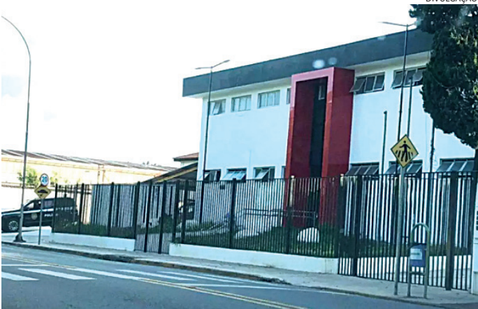
O caso será investigado pela Polícia Civil de Louveira

Em documento enviado para a polícia de Louveira, Prado destacou: “tendo em vista a idade da vítima (13 anos), encaminha-se o presente expediente para a Delegacia responsável, a fim de que se proceda as diligências de polícia judiciária necessárias com o escopo de investigar o possível crime ou ato infracional análogo a crime contra a dignidade sexual, previsto no art. 217-A do Código Penal, inclusive com a qua-