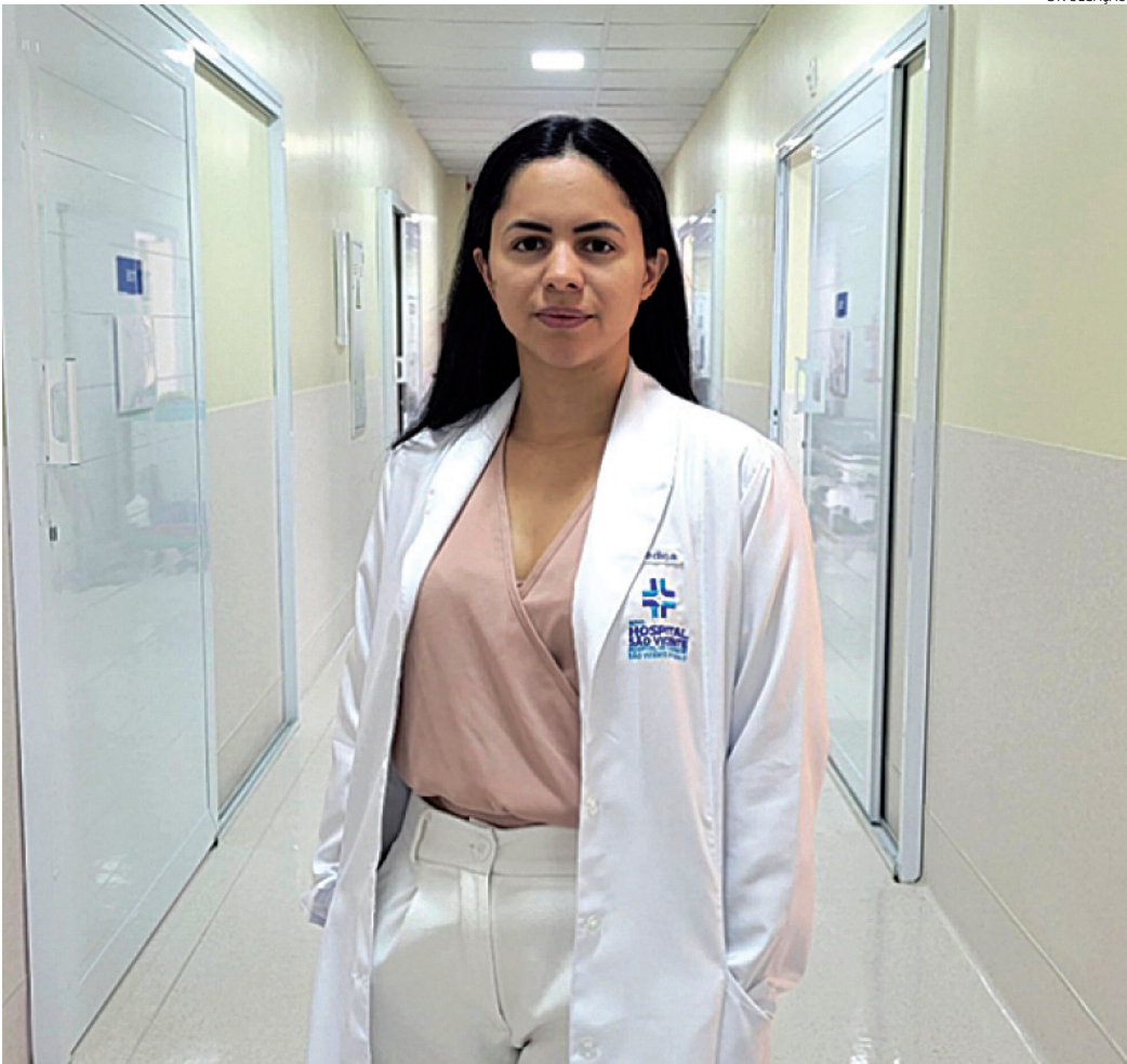
De acordo com a especialista, é possível contrair dengue até quatro vezes, pois existem quatro sorotipos