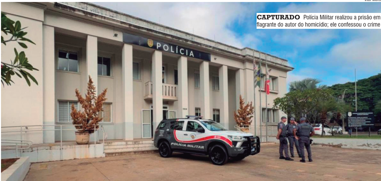
CAPTURADO Polícia Militar realizou a prisão em flagrante do autor do homicídio; ele confessou o crime