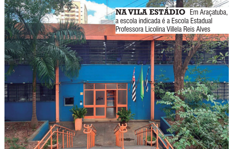
Diretoria de Ensino

Em Araçatuba, a unidade indicada é a Escola Estadual Professora Licolina Villela Reis Alves, na Vila Estádio. Em Guararapes, a unidade contemplada é a Professor Waldemar Quei-