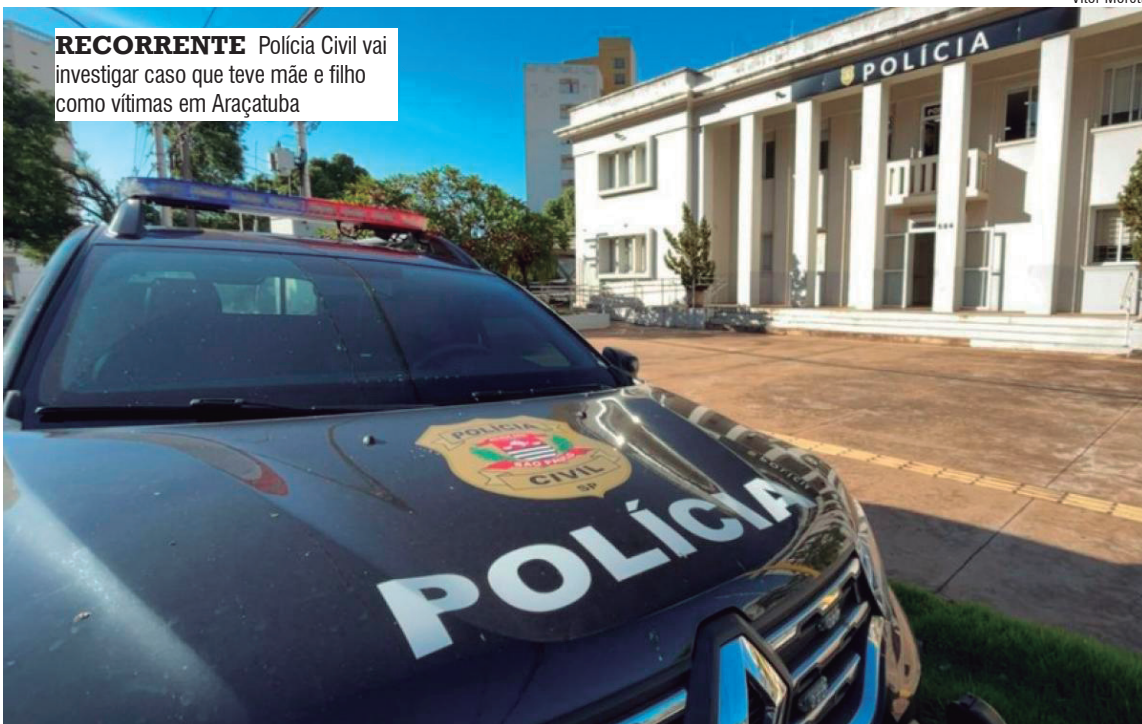
RECORRENTE Polícia Civil vai investigar caso que teve mãe e filho como vítimas em Araçatuba

telionatário afirmou que o processo havia sido julgado favoravelmente e de que haveria uma quantia de R$ 11 mil a ser recebida, mas que para a liberação do crédito seria necessário o pagamento, via PIX, de valores referentes à quitação de impostos e taxas.