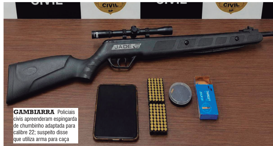
GAMBIARRA Policiais civis apreenderam espingarda de chumbinho adaptada para calibre 22; suspeito disse que utiliza arma para caça

Ele se apresentou espontaneamente na delegacia, na presença do advogado, entregou o aparelho e foi liberado. As investigações continuam. Já outro investigado que tem mandado de prisão em aberto não foi localizado pelas equipes policiais.