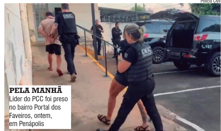
PELA MANHÃ Líder do PCC foi preso no bairro Portal dos Faveiros, ontem, em Penápolis

O caso de ser “disciplina”, de acordo com os códigos dos criminosos, corresponderia a ser o responsável por manter a ordem interna e aplicar os estatutos da organização na região de Araçatuba.