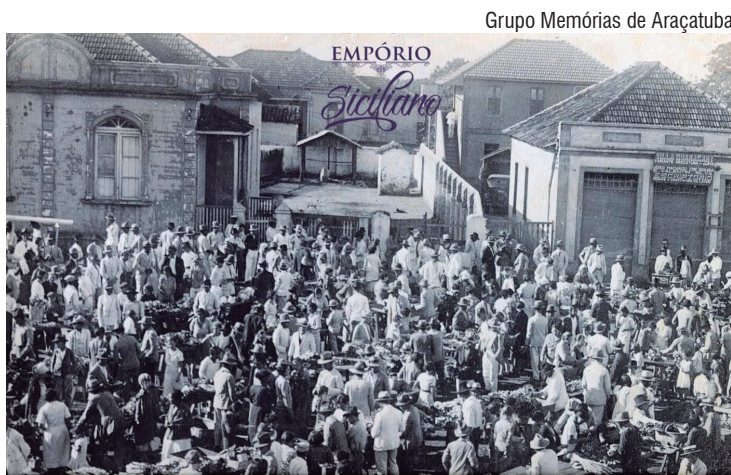
Feira livre em Araçatuba