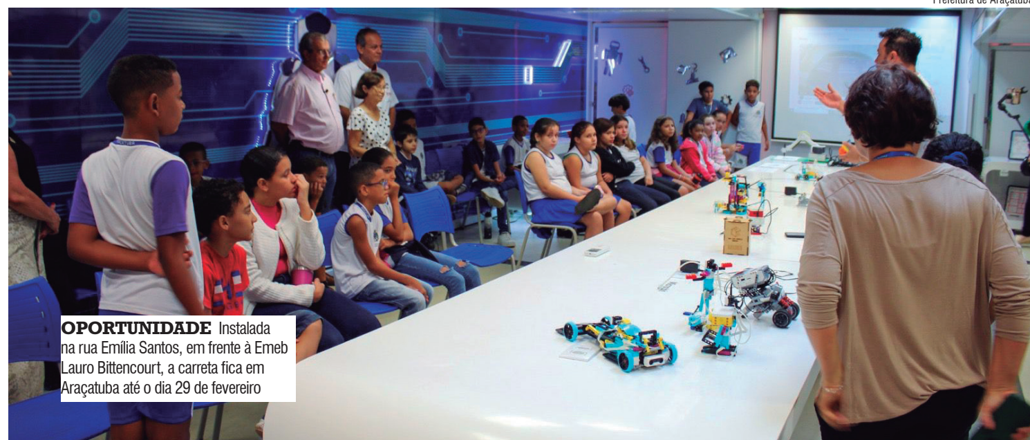
OPORTUNIDADE Instalada na rua Emília Santos, em frente à Emeb Lauro Bittencourt, a carreta fica em Araçatuba até o dia 29 de fevereiro

Instalada na rua Emília Santos, em frente à Emeb Lauro Bittencourt, a carreta fica em Araçatuba até o dia 29 de fevereiro.