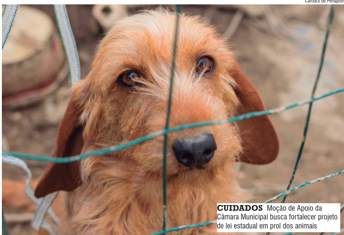
CUIDADOS Moção de Apoio da Câmara Municipal busca fortalecer projeto de lei estadual em prol dos animais