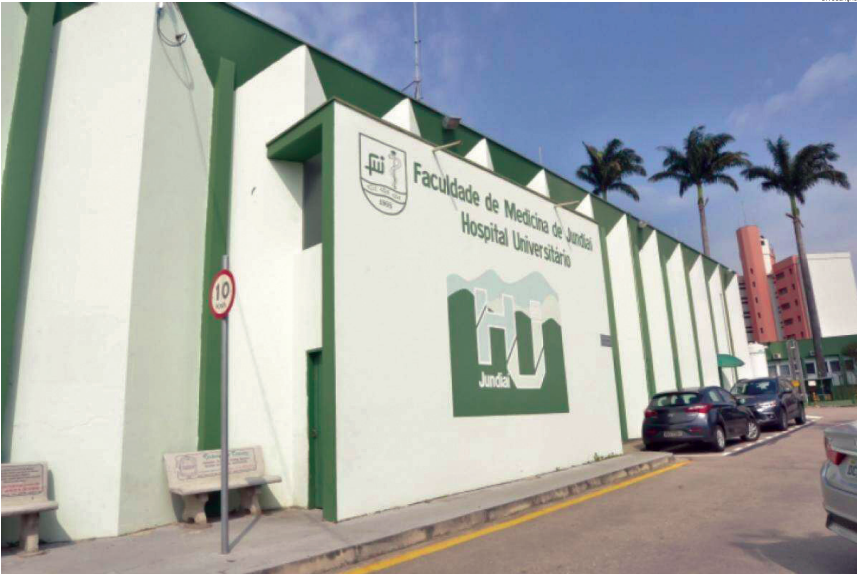
Com aumento da Síndrome Respiratória Aguda Grave (SRAG). Todos os leitos de UTI Pediátrica estão ocupados por pacientes de média e alta complexidade, muitos em uso de respiradores

Para lidar com o cenário, o HU adaptou espaços e adquiriu novos respiradores, mas a situação segue desafiadora, especialmente pelo crescimento de casos em bebês com menos de 3