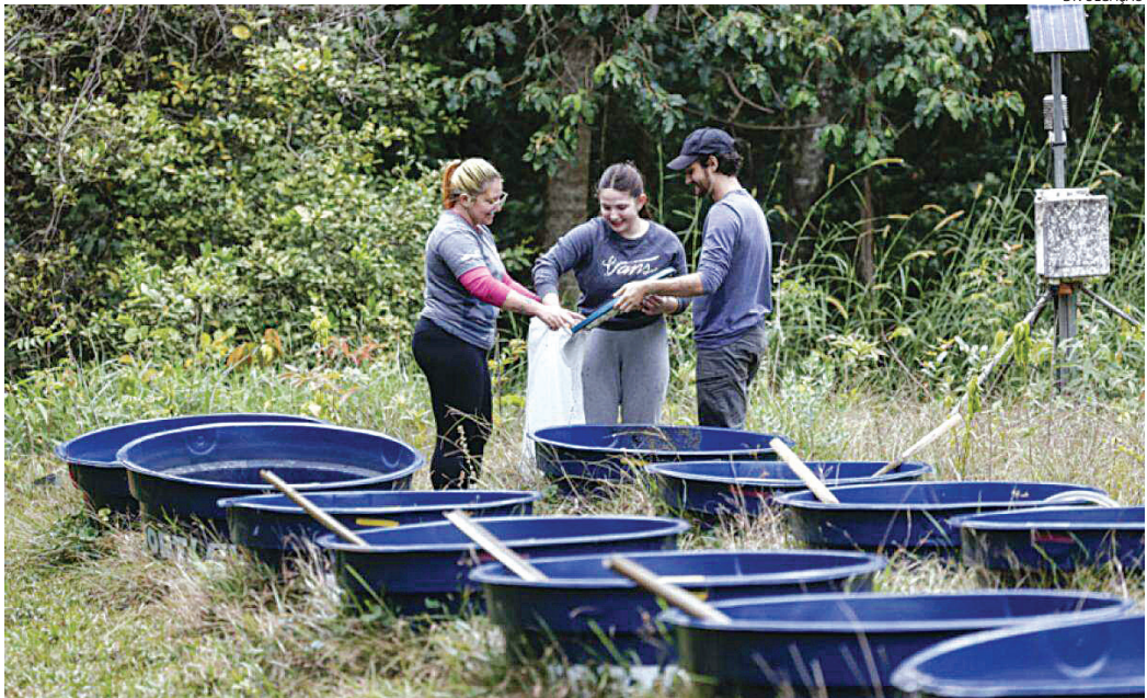
Durante os seis meses de trabalho, a equipe coletou amostras de diversos organismos aquáticos

Para isso, a equipe montou na Base Ecológica um sistema experimental controlado com tanques com água que simulam ecossistemas aquáticos em escala intermediária, nos quais foram adicionadas cinzas de dois tipos: cana-de-açúcar e ingá, uma planta nativa da Mata Atlântica que também ocorre no Cerrado. “Esse ambiente controlado permite que manipulemos as variáveis de maneira precisa, algo difícil de fazer na natureza, onde os fatores são múltiplos e incontornáveis”, detalha o pesquisador.