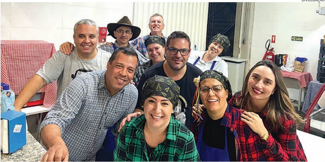
No Santuário Nossa Senhora Aparecida, na Vila Rami, a festa prossegue nos dias 14, 21 e 28

O artesanato e demais produções criativas também marcam presença na programação, com os artistas do programa Jundiaí feito à Mão, os empreendedores das Rotas Turísticas do Município e os participantes do Galpão Criativo.