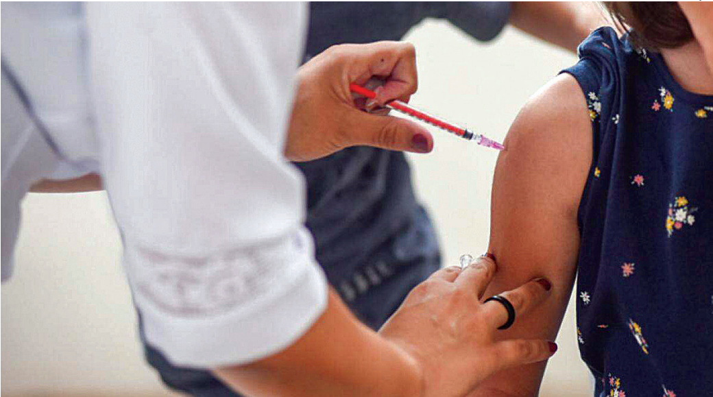
Entre os grupos prioritários, a maior adesão é entre idosos a partir de 60 anos, com 50,26% de cobertura