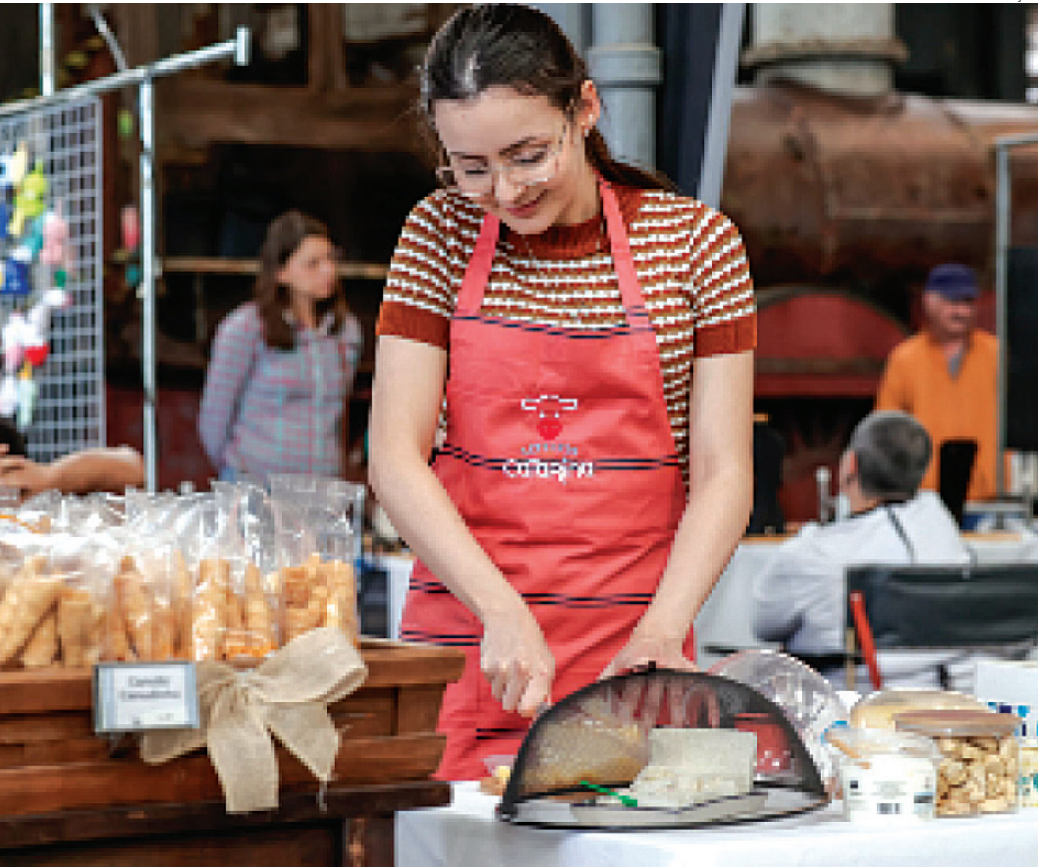
O evento atraiu centenas de visitantes e reuniu 50 expositores