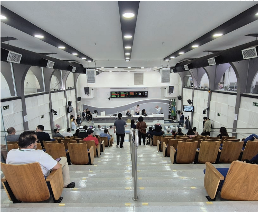
Câmara deve ter sessão tranquila com projetos leves na pauta