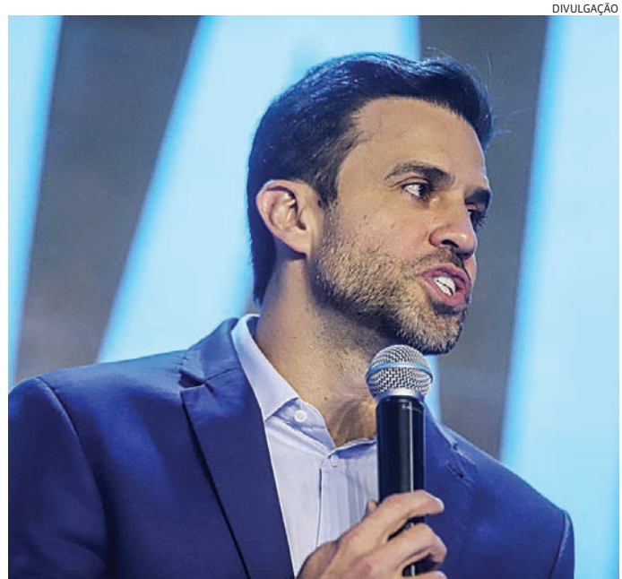
Debate Folha/Uol mostrou misoginia, preconceito e ofensas, mais uma vez

A construção do Recanto Novo encerra o processo de desapropriação iniciado em 2011, quando o núcleo de submoradia foi removido e as famílias encaminhadas para o residencial Tupi ou para o auxílio-aluguel. As 26 famílias já moravam no local e vão concretizar o sonho da casa própria.