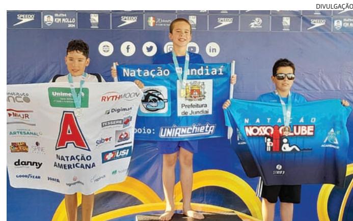
Equipe de Jundiaí foi representada por 37 atletas

A natação da Prefeitura de Jundiaí conta com o apoio do Unianchieta e da APANJ (Associação de Pais e Atletas da Natação Jundiaí).