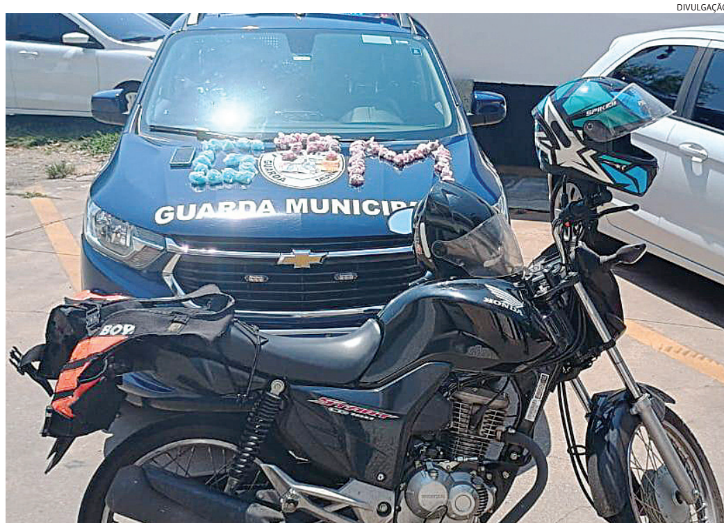
A moto e as drogas foram apreendidas e o suspeito foi preso

O suspeito foi levado para a delegacia, onde foi preso em flagrante por tráfico de drogas.