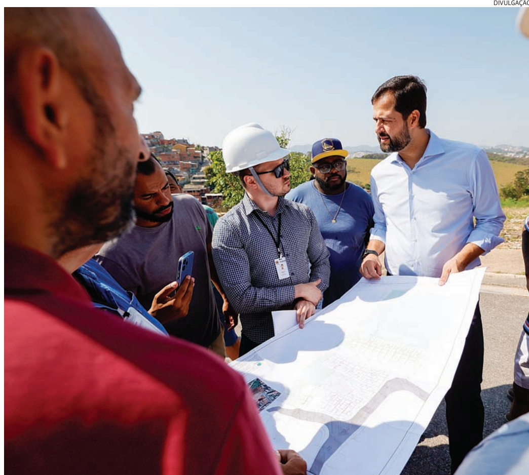
O valor do investimento, entre a infraestrutura para regularização e a construção é de R$ 5.169.919,64

Outros projetos habitacionais estão em andamento como o Caminhos do Traviú (504 unidades), Jardim Sorocabana (400 unidades), Empreendimento Bucchianico – Jardim São Camilo (160 unidades) e o Cravos III e IV – Fazenda Grande (140 unidades).