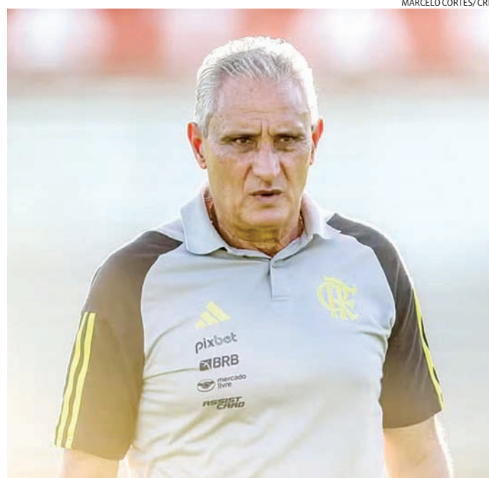
A eliminação na Libertadores foi a gota d'água para o ex-técnico

O Flamengo foi o primeiro clube de Tite após