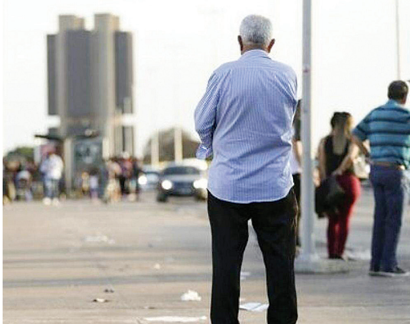
Nesta terça (1º), Dia do Idoso, a data relembra a necessidade de se assegurar direitos a essa parcela crescente da população

Nesta terça (1º), Dia do Idoso, a data relembra a necessidade de se assegurar direitos a essa parcela crescente da população que ainda tem suporte aquém do que precisa.