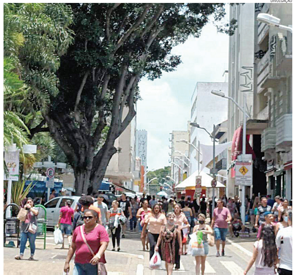
Sábados de horário estendido costumam elevar as vendas em até 30%