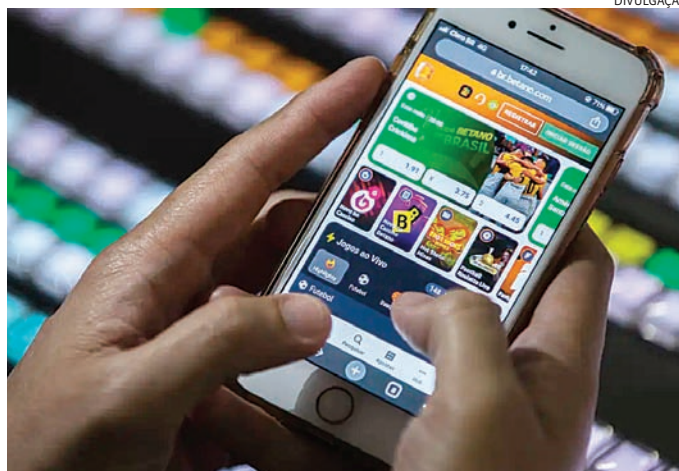
Crise das Bets e recentes queimadas têm piorado a imagem de Lula

Pesquisa do Datafolha de julho mostrou que Paes tinha intenção de voto de 42% dos eleitores que se declararam em algum grau bolsonaristas. Esse é um dos motivos que levaram o gestor a optar por direcionar os ataques ao governador Cláudio Castro (PL), do mesmo