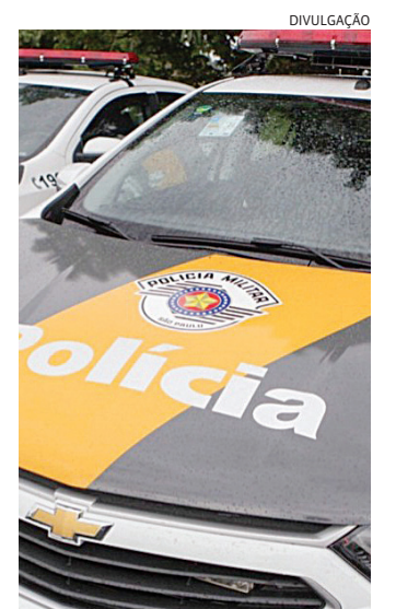
O caso, ocorrido neste domingo, foi atendido pela Polícia Militar

O caso foi registrado na delegacia de Atibaia.