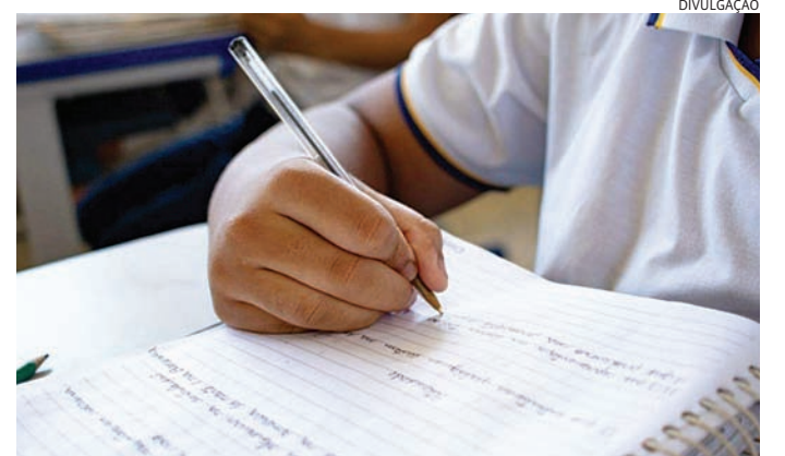
Escolas da região terão o reforço no quadro de professores

Questionada sobre reposição de déficit no quadro de docentes, a Secretaria de Educação de São Paulo informa que não há falta de professores nas unidades da rede estadual de ensino. Em caso de ausência, todos os docentes designados como vice-diretores, professores-coordenadores,