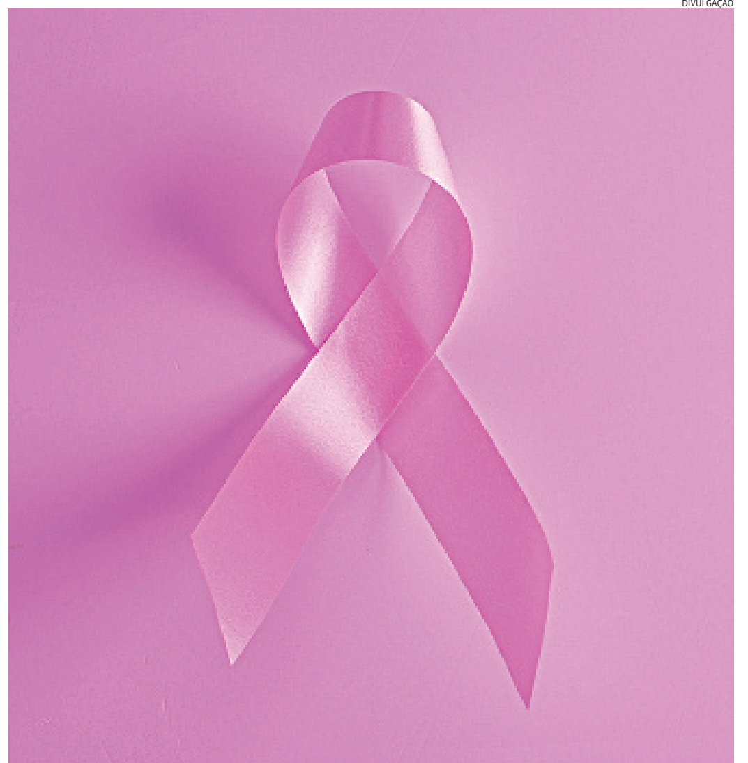
Apenas no estado de São Paulo, a previsão é de 20.470 casos de tumores malignos

Os sintomas mais comuns que a doença apresenta são o surgimento de caroços endurecidos nas mamas e região da axila e pescoço, alterações no bico dos seios, liberação de líquido dos mamilos e pele avermelhada com aspecto de “casca de laranja”. Apesar de não haver uma causa específica para o seu desenvolvimento, fatores como, histórico de câncer na família, exposição frequente aos raios ionizantes, (utilizados em exames de raio-x e tomografia), obesidade e até hábitos como tabagismo, alcoolismo e o sedenta-