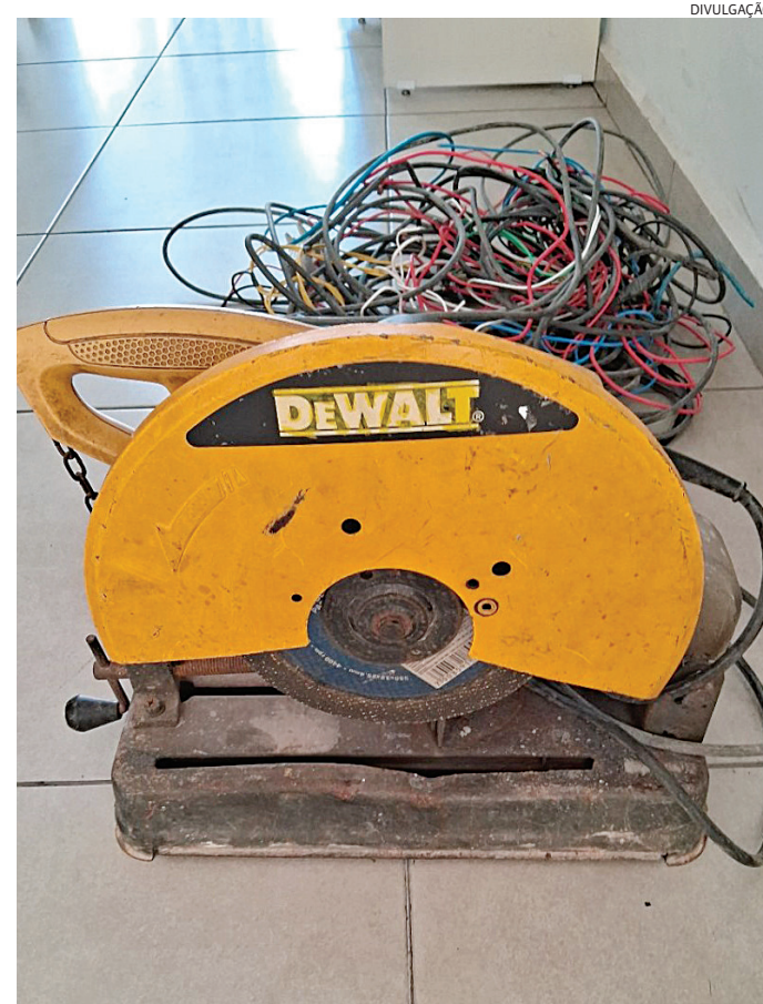
A máquina foi recuperada pelos guardas e o suspeito foi preso