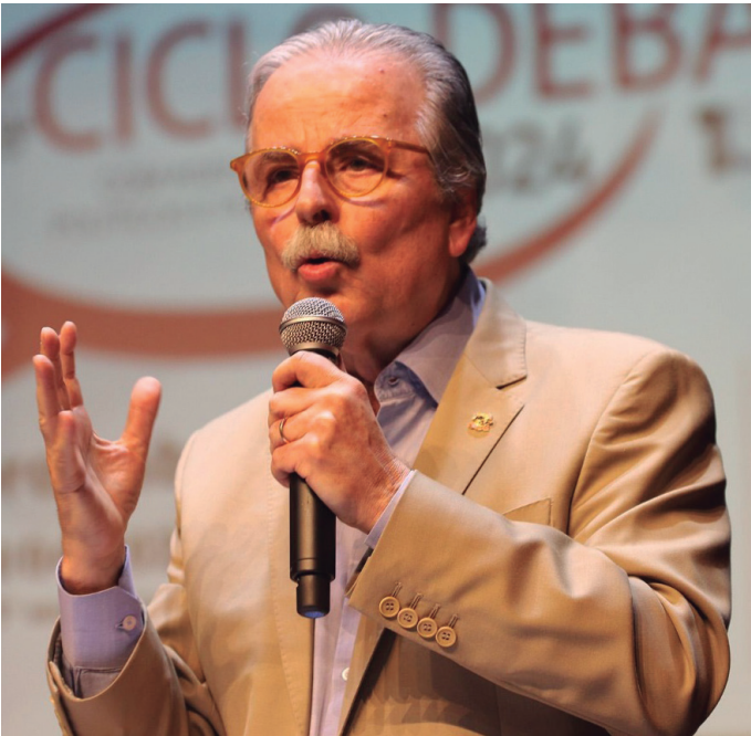
CONFIRMADO Presidente do TCE-SP, Renato Martins Costa

Lei de Licitações e Contratos, bem como os procedimentos necessários para os ajustes e prestação de contas dos recursos públicos aplicados no Terceiro Setor. Além disso, na pauta de discussões está a orientação sobre as práticas que os gestores públicos devem evitar no último ano de mandato, visando a transparência e a correta aplicação dos recursos. Será também discutido como os indicadores do TCE podem contribuir significativamente para aprimorar as ações e políticas públicas nos municípios participantes.