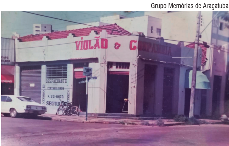
Grupo Memórias de Araçatuba

Esquina da rua Tupi com Quinze de Novembro, nos anos 1980