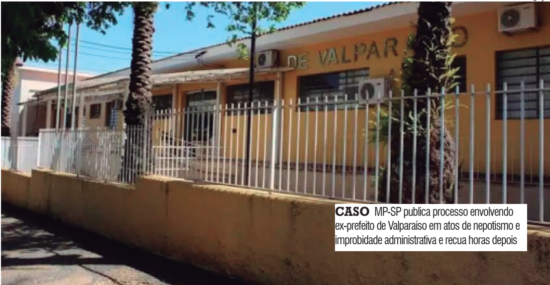
CASO MP-SP publica processo envolvendo ex-prefeito de Valparaíso em atos de nepotismo e improbidade administrativa e recua horas depois

A decisão do STJ de março deste ano condenou 14 pessoas por nepotismo e improbidade na prefeitura de Valparaíso. Os réus foram condenados ao pagamento de multa civil e à proibição de contrato com