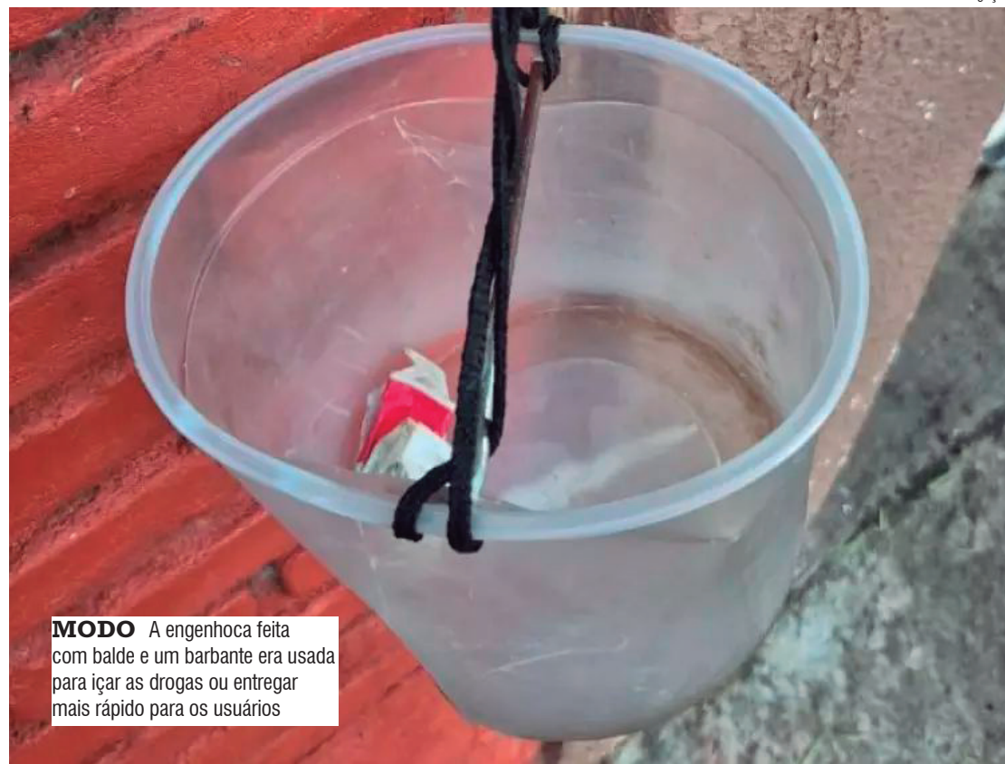
MODO A engenhoca feita com balde e um barbante era usada para içar as drogas ou entregar mais rápido para os usuários

Os homens, presos, foram conduzidos até o plantão policial, e após os procedimentos, permaneceram à disposição da Justiça. As investigações continuam.