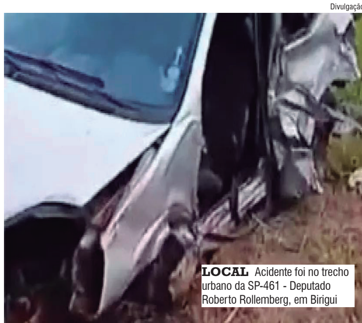
LOCAL Acidente foi no trecho urbano da SP-461 - Deputado Roberto Rollemberg, em Birigui

Os condutores realizam o teste do etilômetro, que descartou a