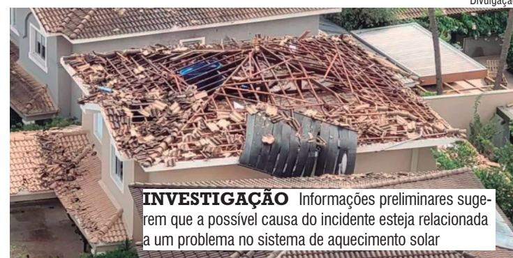
INVESTIGAÇÃO Informações preliminares sugerem que a possível causa do incidente esteja relacionada a um problema no sistema de aquecimento solar

Além disso, ao menos uma outra casa no mesmo condomínio teve