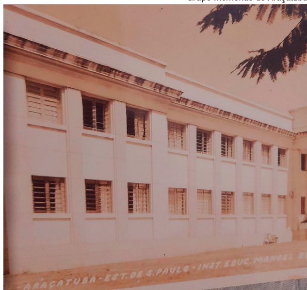
Escola IE Manoel Bento da Cruz nos anos 60