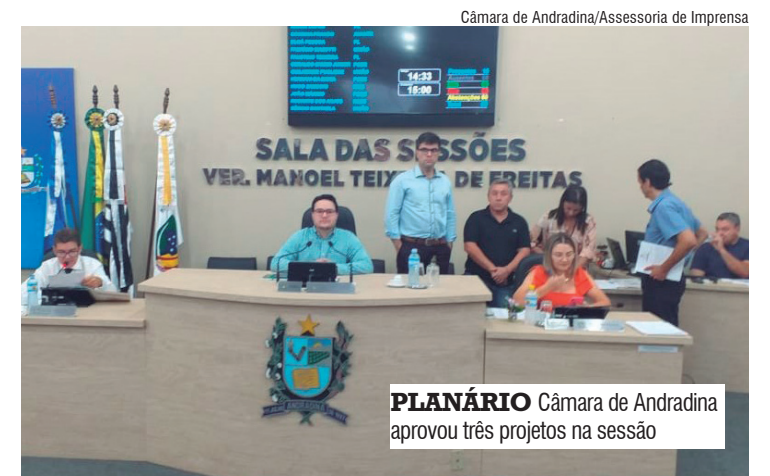
PLANÁRIO Câmara de Andradina aprovou três projetos na sessão