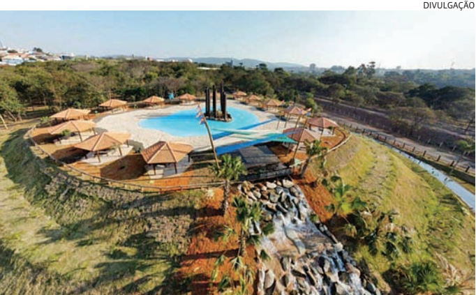
Agendamento para utilização do Espaço das Águas já estão valendo

Funcionando de terça a domingo, o Espaço das Águas fica dentro do Mundo das Crianças, próximo à portaria principal do parque. Assim como as demais atrações do Mundo, tem acesso liberado em dias de