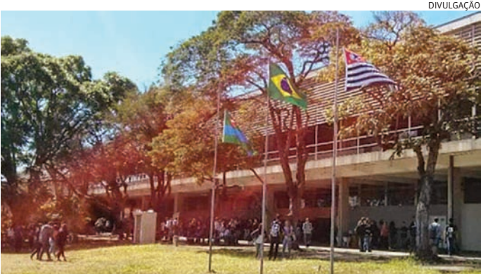
As escolas técnicas também oferecem ensino profissionalizante

Todos os arquivos devem ser digitalizados, com tamanho não superior a 1MB, nos formatos ‘pdf’, ‘png’, ‘jpg’ ou ‘jpeg’. É indispensável o correto preenchimento da ficha de solicitação e o envio dos documentos até hoje (30). As Etecs oferecem computadores e acesso à internet para auxiliar quem deseja solicitar o benefício. Para informações sobre datas e horários de atendimento, é necessário entrar em contato diretamente com a escola.