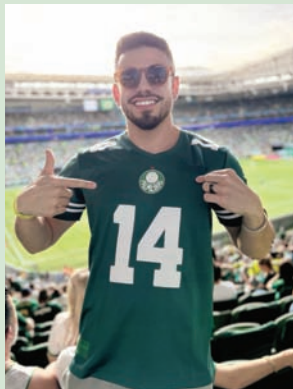
Empate de 2 a 2 contra o Fortaleza

Recentemente, tive a oportunidade de viver uma experiência incrível no Camarote Fanzone do Allianz Parque durante o emocionante jogo entre Palmeiras e Fortaleza, que terminou em empate de 2 a 2. O ambiente estava repleto de energia, com samba e pagode animando o pré-jogo. O open bar e open food foram um destaque à parte, oferecendo uma ampla variedade de petiscos, drinks, massas e açaí. A vista do camarote é sensacional, permitindo que os torcedores sintam a emoção do jogo bem de perto. Agradeço ao Bar Barbearia pelo convite e pelos serviços de barbearia, que tornaram o dia ainda mais memorável. Foram sete horas de pura diversão! @camarotefunzone @barbarbeariajundiai