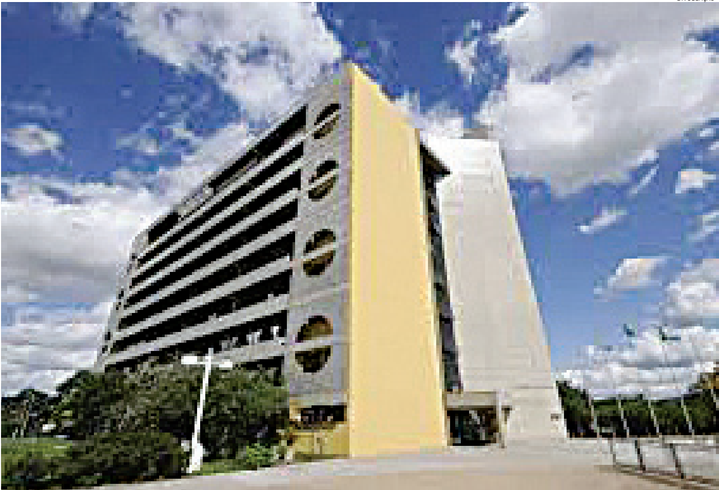
Paço Municipal deve receber equipe de transição a partir de 1º de novembro

O processo de transição da equipe do atual para o novo governo deve começar nos próximos dias. A lei municipal estabelece o dia 1º de novembro para o início dos trabalhos e cabe ao candidato eleito indicar ao prefeito municipal os nomes que irão compor a equipe. Isso se faz necessário para que o candidato eleito tenha condições de receber de seu antecessor todos os dados e informações necessários à implementação do programa do novo governo, desde a data da sua posse, no caso, 1º de janeiro de 2017, primeiro mandato de Luiz Fernando Machado Como se dá o processo Cabe ao candidato eleito indicar ao prefeito municipal, por meio de ofício, a equipe de transição que terá acesso a todas as informações da administração pública, ou seja, as contas públicas, programas e obras em andamento, bem como outros dados que julguem necessários. Cabe à atual administração