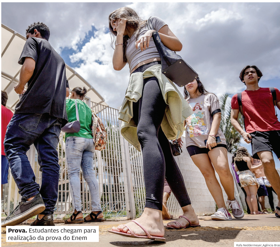
Prova. Estudantes chegam para realização da prova do Enem

“Avaliar erros e acertos não diz muita coisa, pois