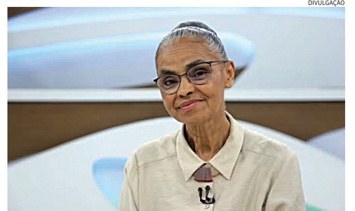
PSOL não abre mão de lançar Marina Silva como senadora

Por isso, na resolução divulgada na terça, o PSOL diz que apoiará “outra candidatura do campo progressista”