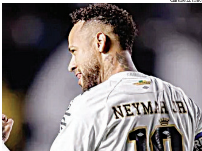
Peixe busca reação em casa pela 12ª rodada do Campeonato Brasileiro

Do outro lado, o Fluminense chega pressionado após compromissos recentes no meio de semana e busca manter regularidade no Brasileirão. O duelo reúne duas equipes que ainda buscam maior estabele-