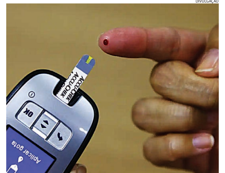
Pessoas vivem mais, com doenças crônicas combinadas com as agudas

3) O envelhecimento populacional significa que mais pessoas estão atingin-