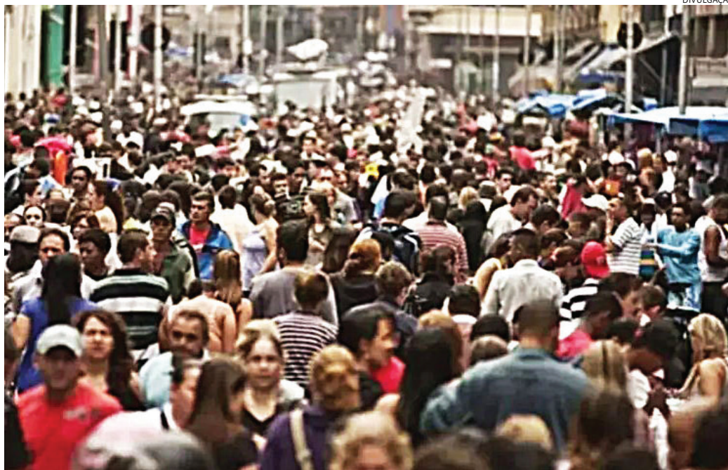
Brasileiros buscam cada vez mais a sensação de estar ascendendo na vida