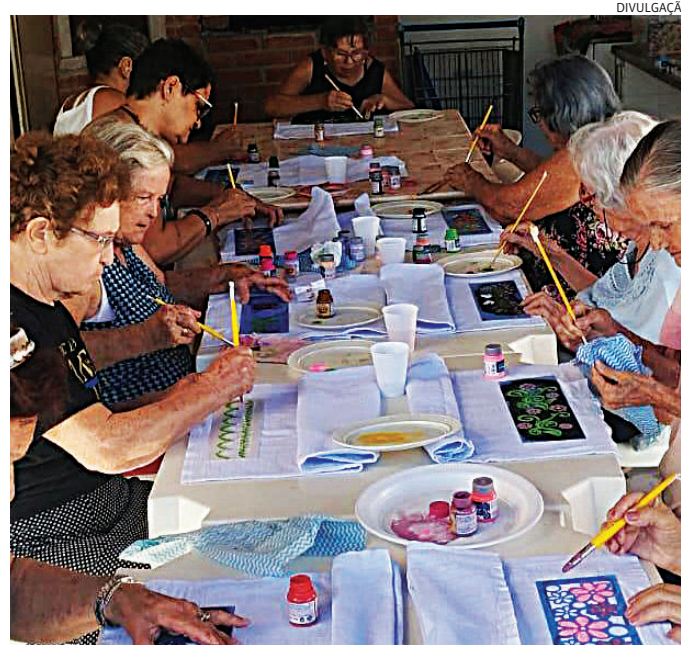
Atividades da prefeitura estimulam momentos de socialização

Em Jundiaí, algumas iniciativas públicas buscam justamente reconstruir esses laços. Os Centros de Convivência da Pessoa Idosa (CCI), como os espaços Argos e Hortolândia, oferecem atividades gratuitas que vão de dança a coral, além de bailes semanais. Já o CECCO promove inclusão digital e ações de saúde, aproximando gerações e incentivando a participação social.