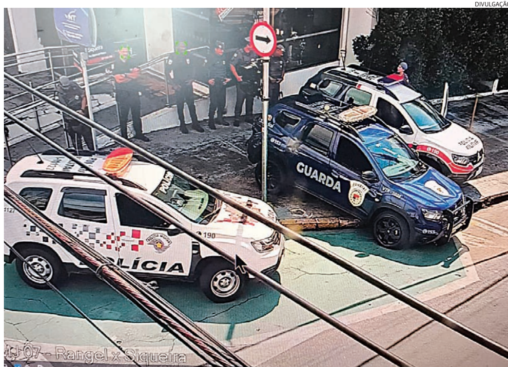
Ação foi realizada em conjunto entre Polícia Militar e Guarda Municipal

Após a confirmação do mandado, o suspeito foi detido e encaminhado à autoridade policial responsável, permanecendo à disposição da Justiça.