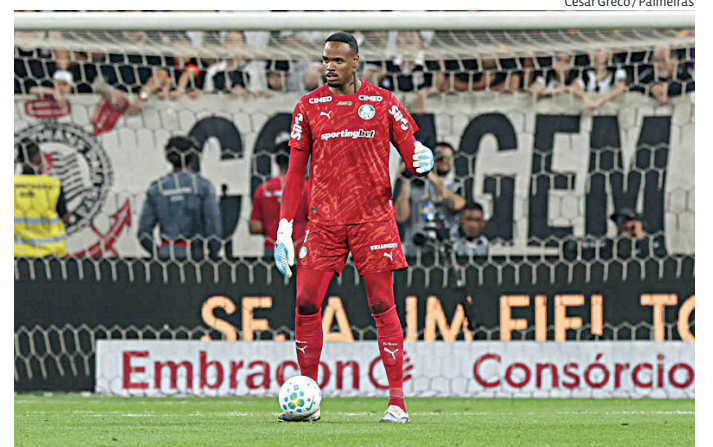
Verdão defende a liderança pela 12ª rodada do Campeonato Brasileiro

Do outro lado, o Athletico-PR tenta surpreender fora de casa para seguir próximo do