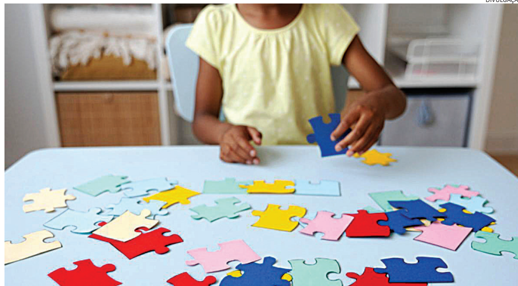
Em cinco anos, número de alunos que precisam de suporte aumentou 9 vezes

Neste mês de abril, que no último dia 2 teve o Dia Mundial de Conscientização do Autismo, a campanha Abril Azul foi estabeleci-