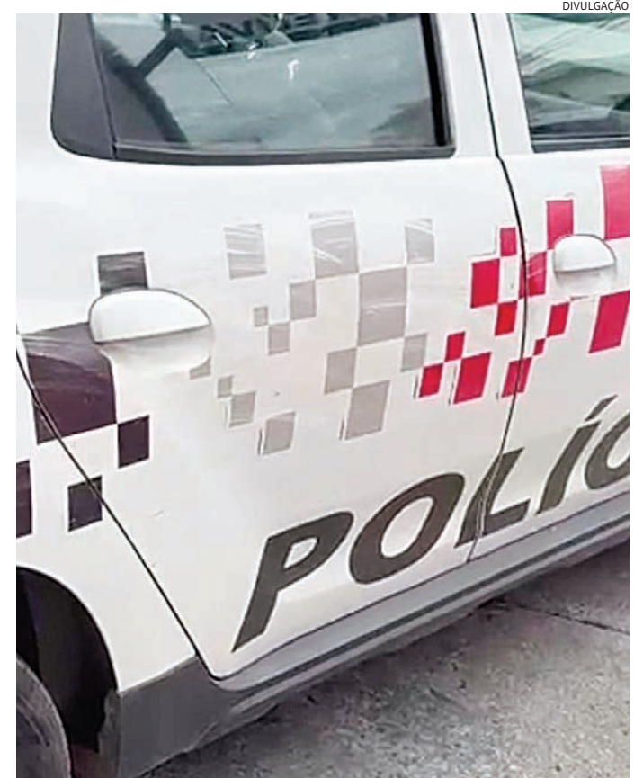
Mulher relatou aos agentes que sofria abusos e ameaças

Durante a ocorrência, também foi constatado que o homem cumpria pena em regime aberto e que uma das condições impos-