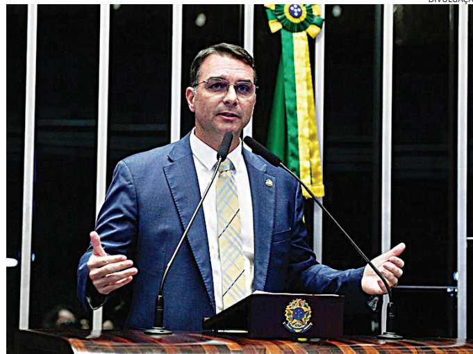
Pastores evangélicos ainda dão um apoio discreto a Flávio Bolsonaro

Como tantos outros líderes de porte nacional, ele simpatizava com uma chapa encabeçada por Tarcísio, a ex-primeira-dama Michelle Bolsonaro na vice. O disco virou. Mesmo Malafaia já se