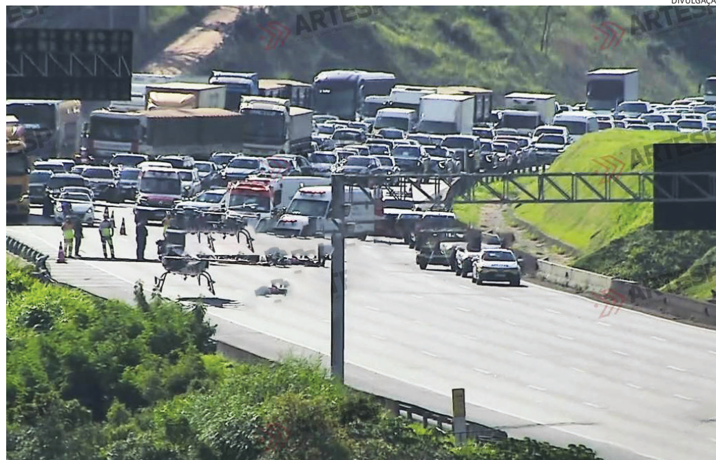
Helicóptero Águia foi acionado para atendimento da ocorrência

De acordo com as informações, a vítima que conduzia a motocicleta ficou em estado grave. O helicóptero Águia, da Polícia Militar, foi acionado e pousou na via, o que ocasionou a in-