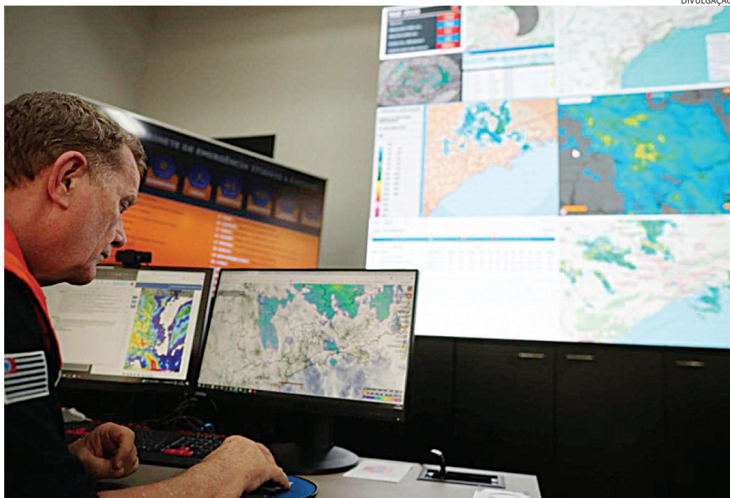
Os equipamentos têm seus dados integrados pelo Cepam