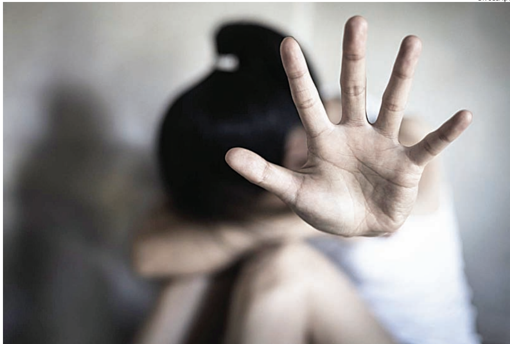
Combate à violência contra a mulher tem sido debatida em todas as esferas

Pelos textos, a vedação passaria a valer a partir da condenação judicial, podendo ocorrer após o trânsito em julgado. Caso o ocupante de um car-