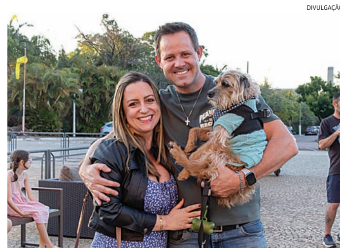
O evento tem início às 16h, no Paço Municipal, aberto à comunidade

A campanha Abril Laranja é promovida pela Prefeitura ao longo de todo o mês, com ações voltadas à conscientização sobre a causa animal. Em Jundiaí, o trabalho contínuo de proteção e cuidado é realizado pelo Departamento de Bem-Estar Animal (Debea), que atua com iniciativas de atendimento, orientação e promoção da saúde e bem-estar dos animais no município.