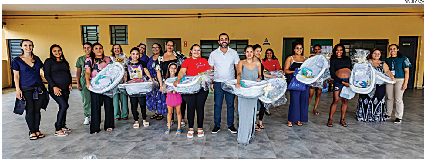
O ‘Colo de Mãe’ ajuda mulheres em vulnerabilidade social