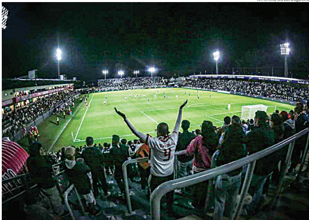
Equipe recebe o Blooming pela fase de grupos da Sul-americana