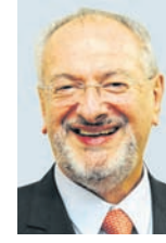
JOSÉ RENATO NALINI

O poeta Paulo Bomfim, o último Príncipe dos Poetas Brasileiros, nasceu em São Paulo, em 30 de setembro de 1926. Portanto, em 30 de setembro de 2026 completaria cem anos.