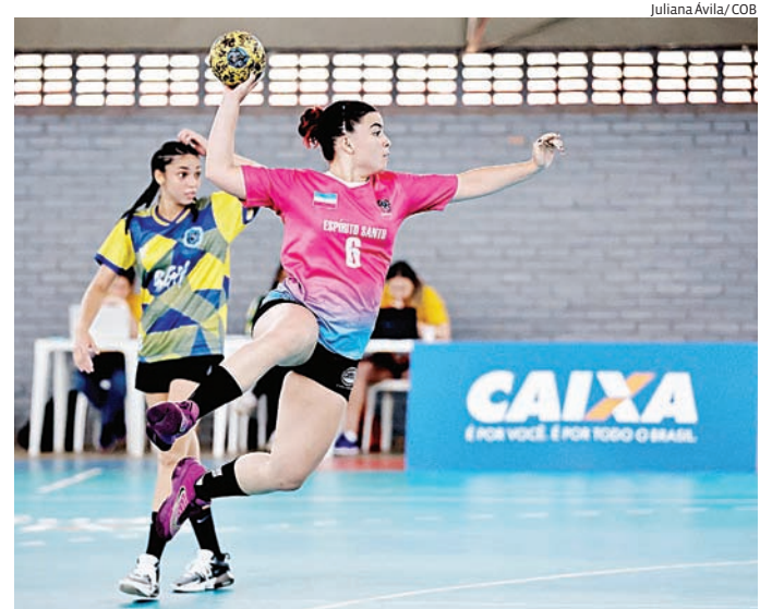
Verba da Caixa será distribuída via novo programa