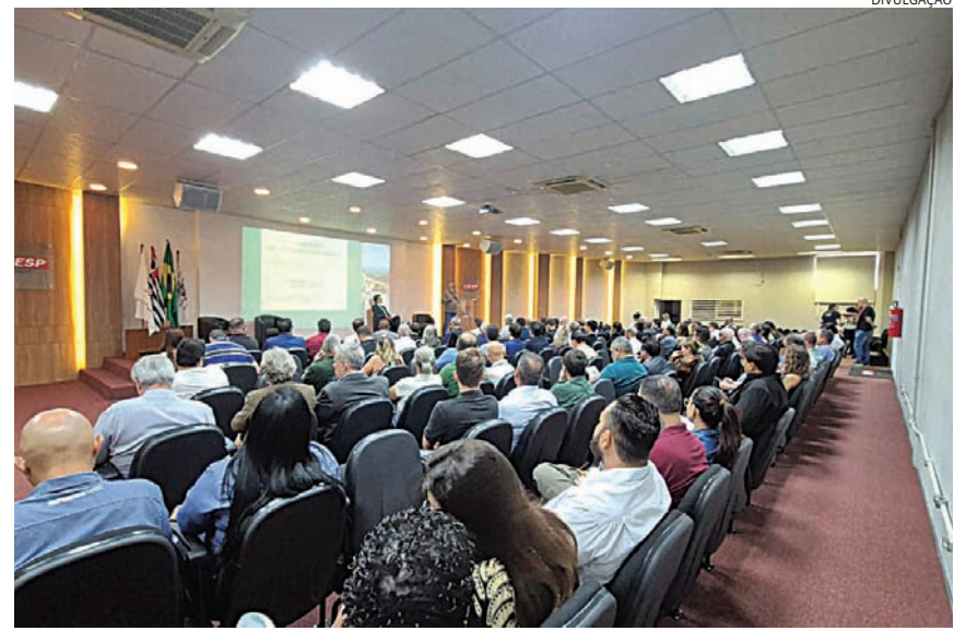
Evento reuniu especialistas e integrantes do poder público e privado

podem gerar energia, combustível e até retorno financeiro ao município. Com dinheiro em caixa, podemos destiná-lo para as prioridades da cidade”, comentou.