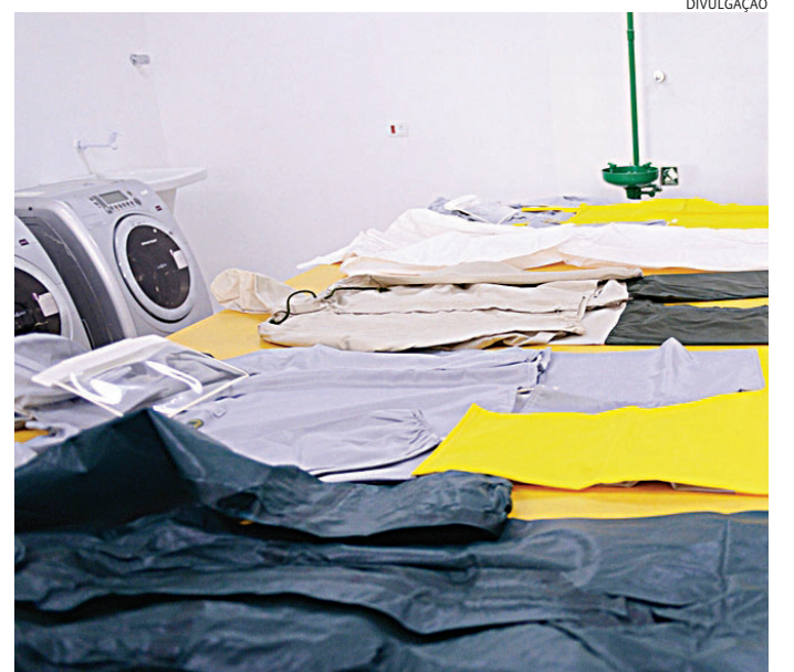
O ‘Quepia’ colocou a pesquisa na ‘roupa’ dos trabalhadores

Segundo Ramos, nos dias de hoje os principais processos de avaliação de qualida-