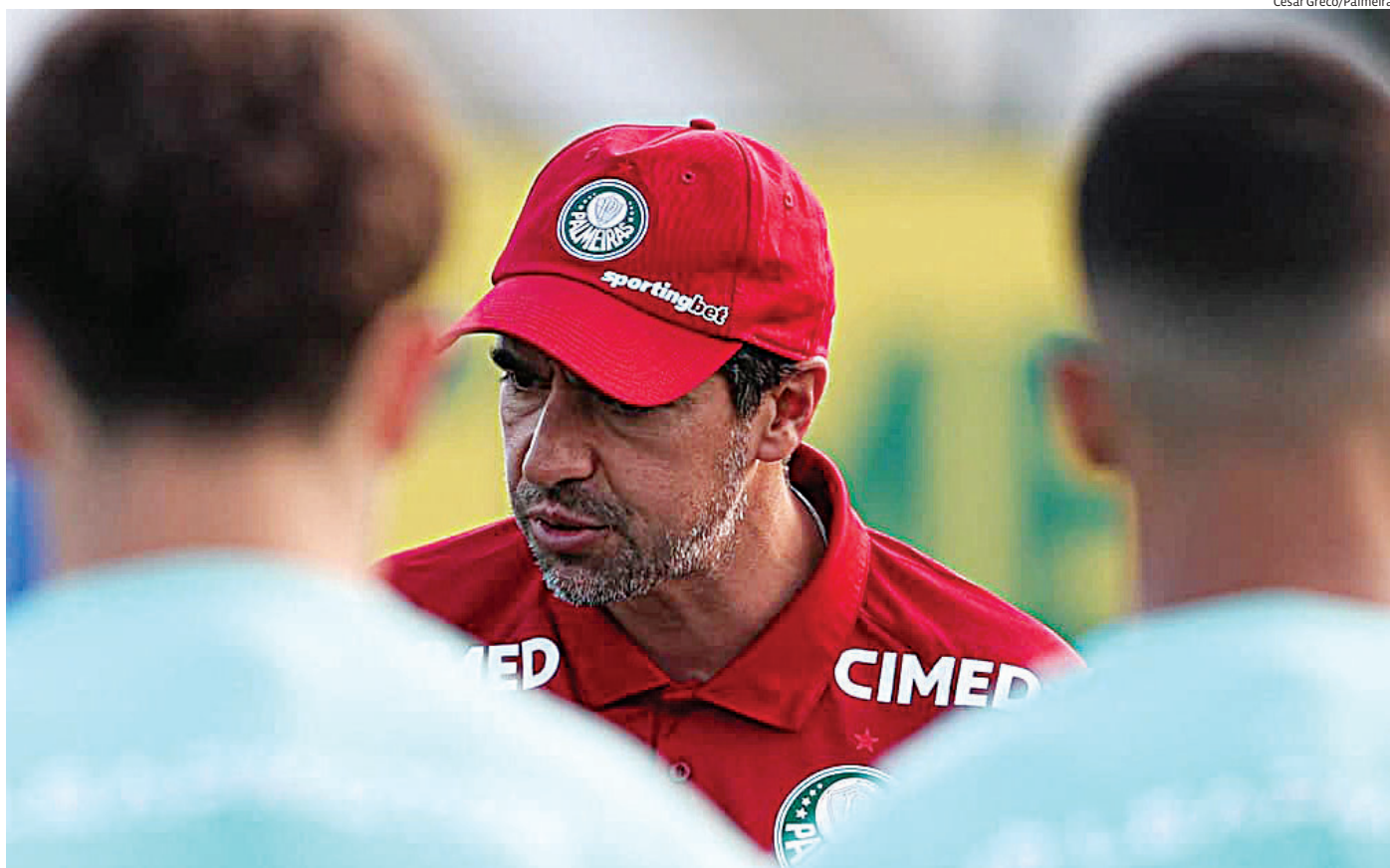
A partida terá transmissão ao vivo pelo serviço de streaming Paramount+, ampliando o acesso dos torcedores ao confronto continental

A previsão é de continuidade do repasse até 2028, consolidando a parceria como uma das principais fontes de investimento no esporte olímpico brasileiro.