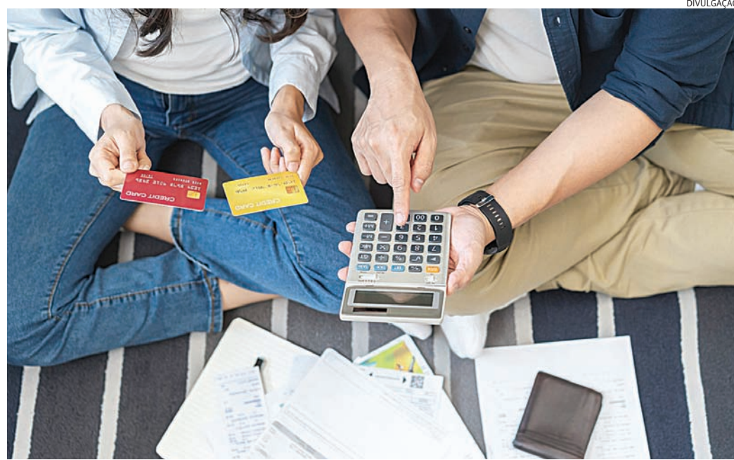
Facilidades como cartão de crédito ajudam a aumentar endividamento familiar

não sentem o peso na hora de gastar e, quando percebem, já estão sobrecarrega-