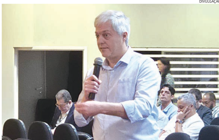
Vice-prefeito esteve com membros do poder público e empresários nesta quarta