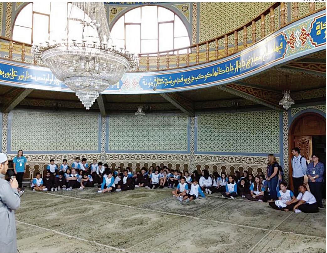
O passeio à mesquita será no próximo sábado (13) com inscrição antecipada e gratuita