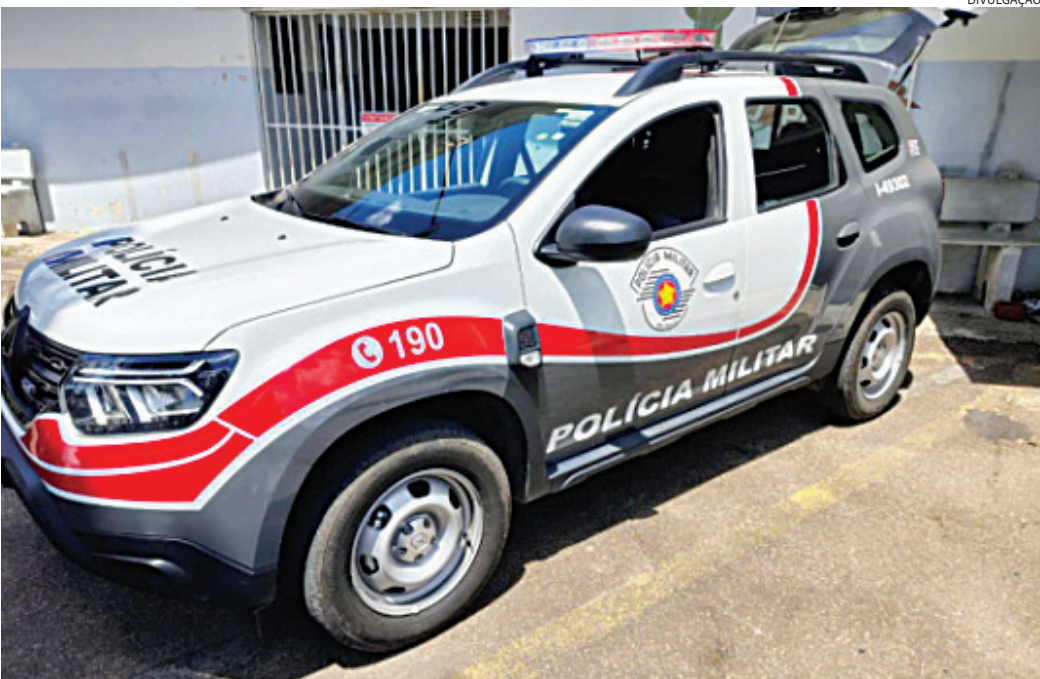
Com ele foram apreendidas mais de 100 porções de drogas

das mais de 100 porções de drogas, além de R$ 145. Ele recebeu voz de prisão e foi conduzido à delegacia, onde foi autuado em flagrante.