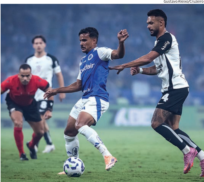
O Corinthians chega à semifinal com campanha invicta

No Campeonato Brasileiro, o Timão teve campanha irregular. Ainda assim, a comissão técnica intensificou o trabalho nos bastidores para contar com Rodrigo Garro e Yuri Alberto nas duas partidas da semifinal. Ambos apresentam