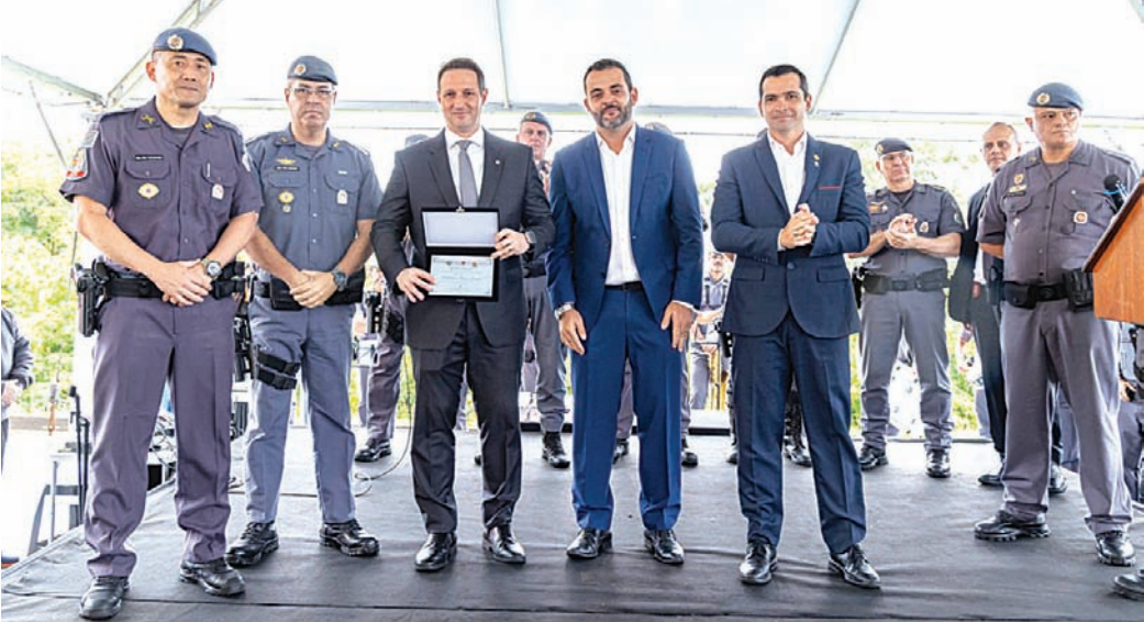
Prefeito Gustavo Martinelli recebe autoridade, incluindo o deputado federal Guilherme Derrite

essas 14 novas viaturas, que se somam às 39 previstas só neste mês para a nossa região, reforça um ponto muito importante e que é prioridade absoluta para nós. Segurança pública se faz com integração, estrutura e presença constante nas ruas. Hoje trabalhamos de forma alinhada, compartilhando informações estratégicas e resultados, e dessa integração temos garantido avanços concretos. Agradeço ao Governo do Estado por essa parceria que tem dado resultados reais para a população”, afirmou. O deputado estadual, Capitão Telhada, apontou que segurança pública depende de um “tripé” que envolve efetivo, equipamentos e treinamento. “Hoje esse tripé está sendo atendido: homens e mulheres preparados, dezenas de viaturas sendo entregues e um