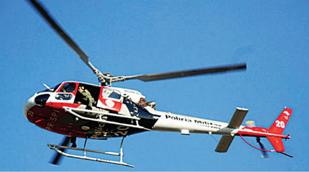
A vítima foi socorrida pelo helicóptero Águia

O Velório Municipal informou sobre 4 óbitos, autorizado pelas famílias.