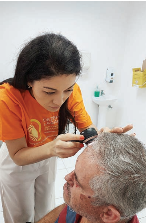
Mutirão terá o objetivo de identificar casos precocemente para tratamento e maior chance de cura