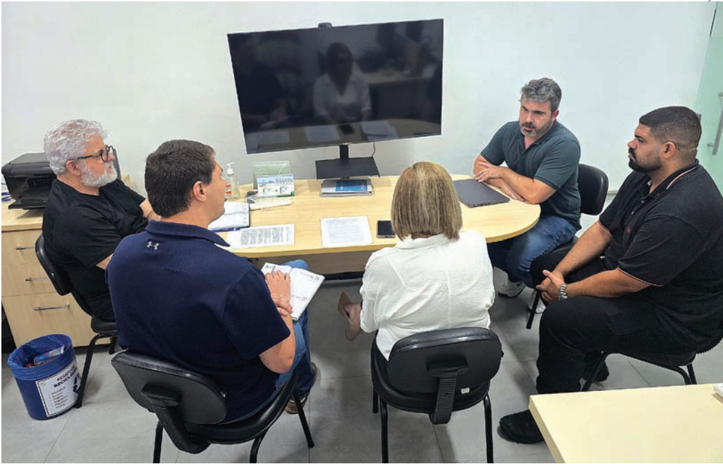
O aplicativo lançado pelas instituições ajuda na antecipação das faltas durante exames

A velha história de marcar exame e não aparecer, drama que atrapalha pacientes, sobrecarrega serviços e empurra diagnósticos para mais longe, ganhou um contraponto promissor em Jundiaí. A Faculdade de Medicina de Jundiaí (FMJ) e a Fatec Jundiaí desenvolveram e testaram um aplicativo capaz de diminuir significativamente o não comparecimento aos exames de colonoscopia. O projeto, conduzido no âmbito do PIBITI-FMJ e reunindo professores e alunos das duas instituições, mostrou resultados animadores: a taxa de ausência caiu cerca de 14%. Entre os usuários que responderam à pesquisa de satisfação, sete em cada dez aprovaram a experiência com o app. A iniciativa mira um problema mundial e bem conhecido já que cada falta atrasa o diagnóstico, aumenta filas, desperdiça recursos