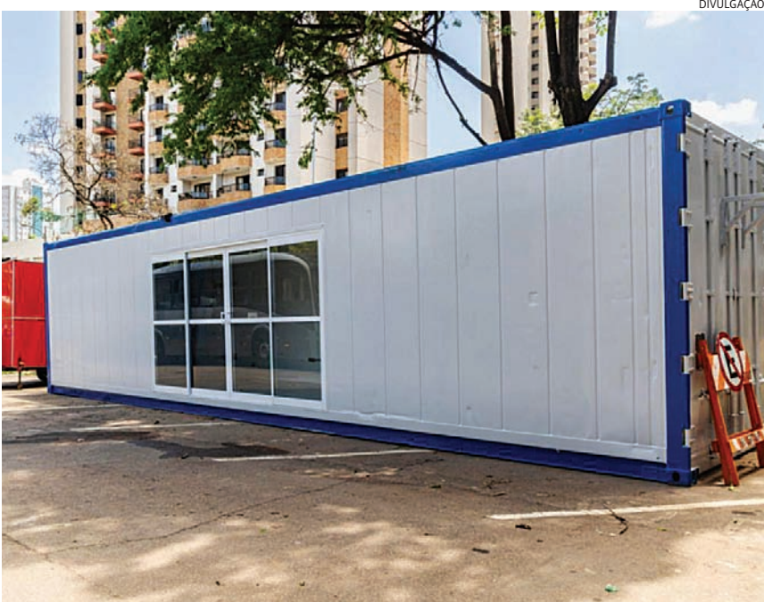
O espaço foi montado na avenida 9 de Julho para dar mais conforto aos profissionais

“Este projeto é um marco importante no avanço das nossas políticas de apoio aos trabalhadores que atuam diariamente nas ruas. A parceria com a iniciativa privada permitiu viabilizar um espaço moderno, funcional e pen-