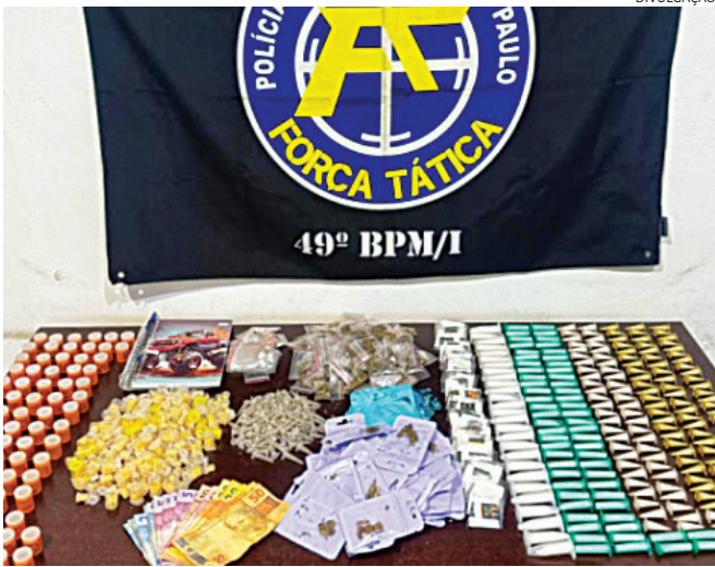
As drogas estavam com a dupla e foram apreendidas

maconha, 298 porções de cocaína, 199 pedras de crack, 36 porções de Ice, um celular e um caderno com anotações relacionadas ao tráfico. Ambos foram levados para a delegacia, onde acabaram presos e flagrante.