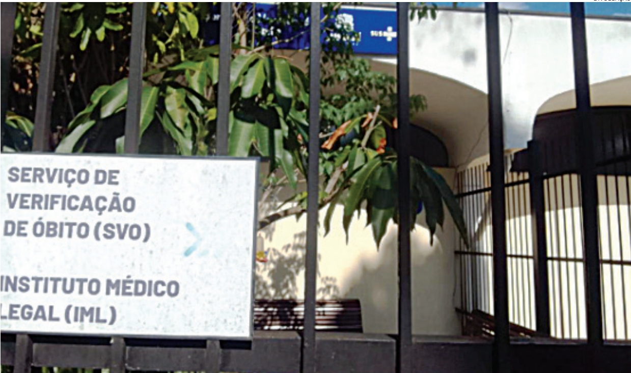
O corpo do homem foi levado para o Instituto Médico Legal

O corpo do homem foi levado para o Instituto Médico Legal (IML) para exames necroscópicos e posterior liberação para sepultamento.