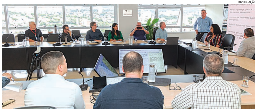
A previsão é de que as obras sejam iniciadas no primeiro semestre de 2027