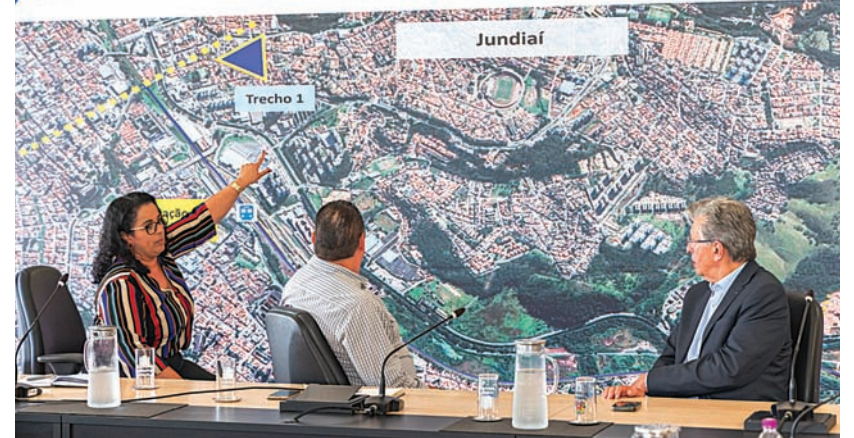
A previsão é de que as obras sejam iniciadas no primeiro semestre de 2027