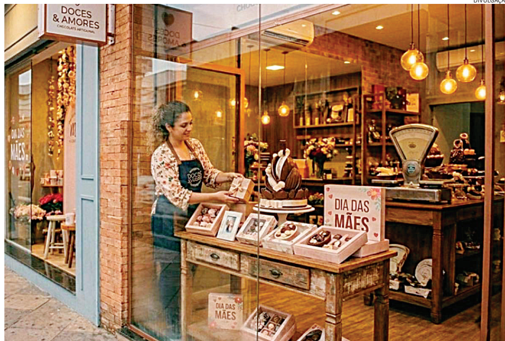
A loja vencedora ganha o prêmio de R$1 mil