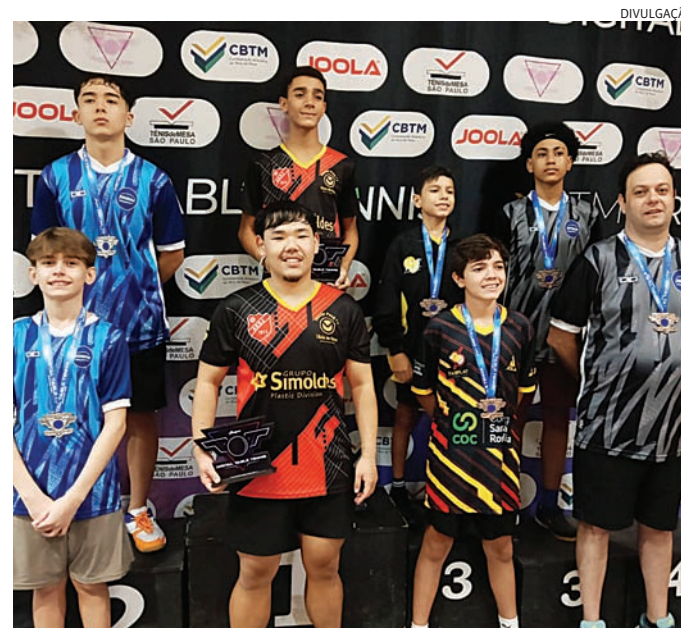
Equipe se destaca em etapa disputada em Suzano

O próximo compromisso será no próximo fim de semana, com a disputa da 2ª etapa do Campeonato Paulista, em Votorantim.