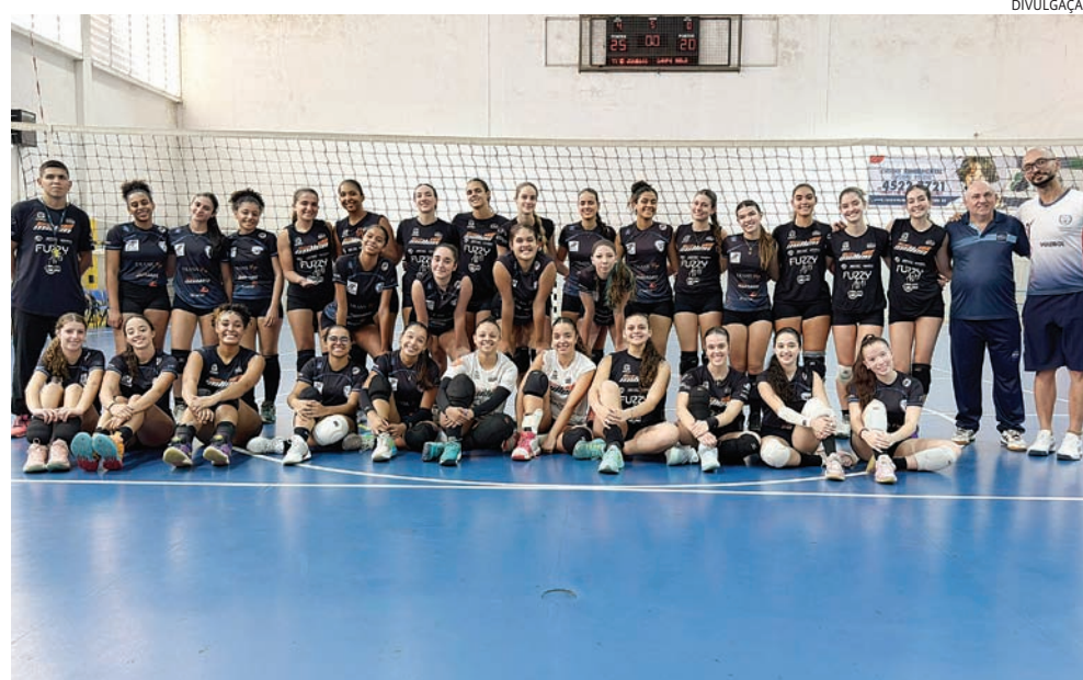
Equipe supera Campo Belo e mostra evolução de uma das categorias mais importantes do Time Jundiaí