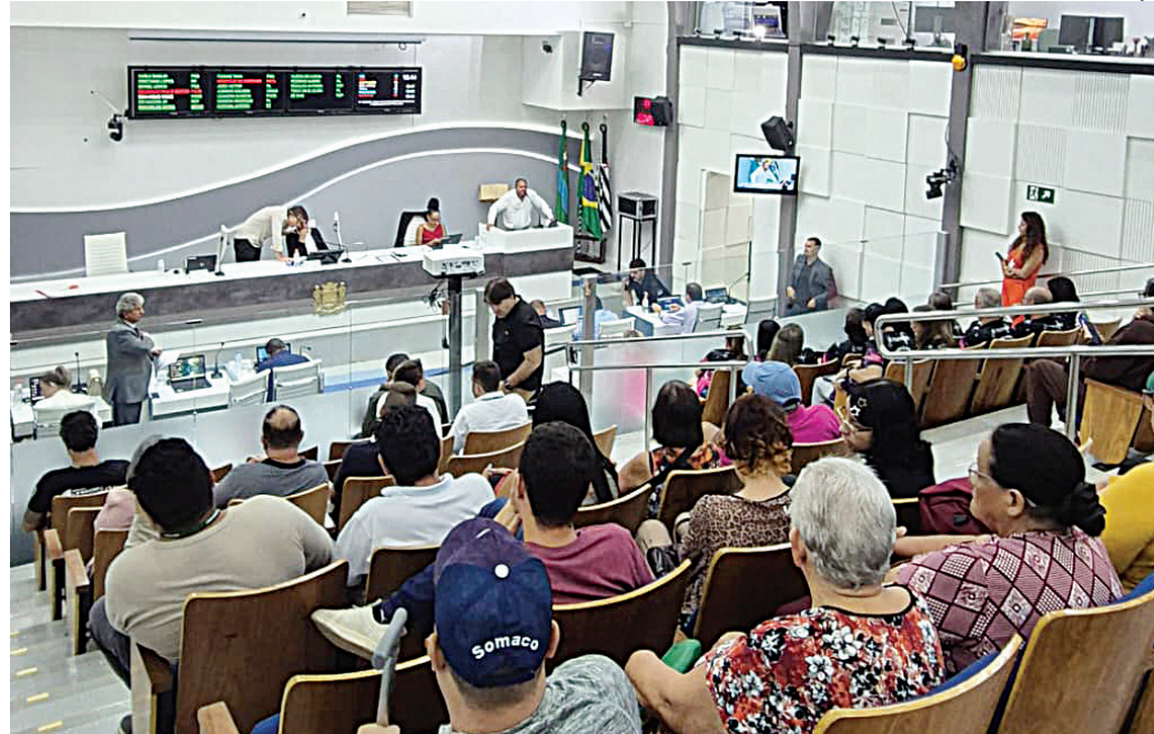
Pauta desta terça-feira está recheada de projetos de denominação de espaços públicos

A justificativa do projeto destaca a crescente importância dos animais de estimação no núcleo familiar e a dificuldade enfrentada por tutores no momento da perda, especialmente diante dos altos custos de servi-