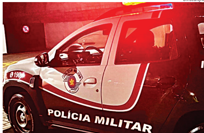
Os PMs conduziram a suspeita ao DP, onde ela foi presa

Quando os policiais chegaram, encontraram a mulher contida pelos funcionários. Durante vistoria no imóvel, foram constatados