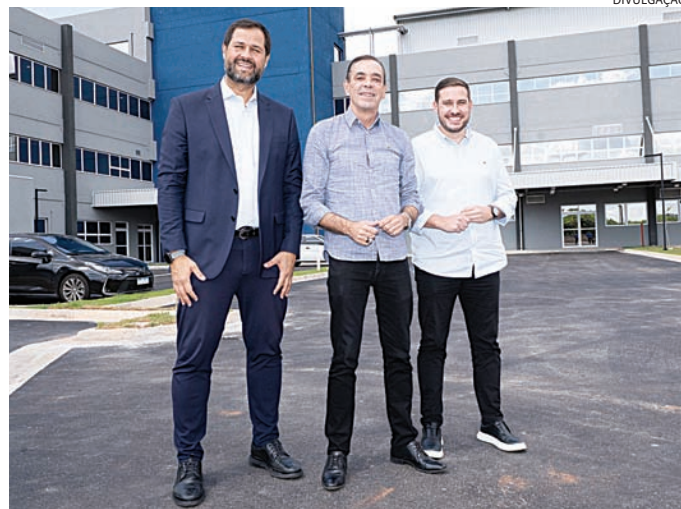
Interlocução política será feita nos 3 poderes, garante Luiz

O equipamento atende a um contexto de pressão crescente sobre a rede regional de saúde, que atende cerca de quase 1 milhão de habitantes e enfrenta dificuldades como filas para cirurgias eletivas, especiali-