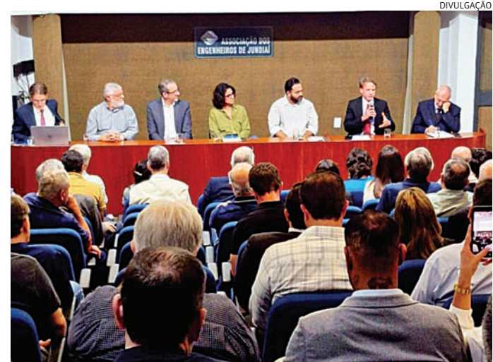
Os presentes poderão participar de painéis com especialistas

Na parte da manhã, os presentes poderão participar de painéis com especialistas sobre as políticas públicas de resíduos sólidos, financiamentos e linhas de crédito para municípios e sobre os aspectos legais e jurídicos do tema. A partir das 14h, grandes players irão