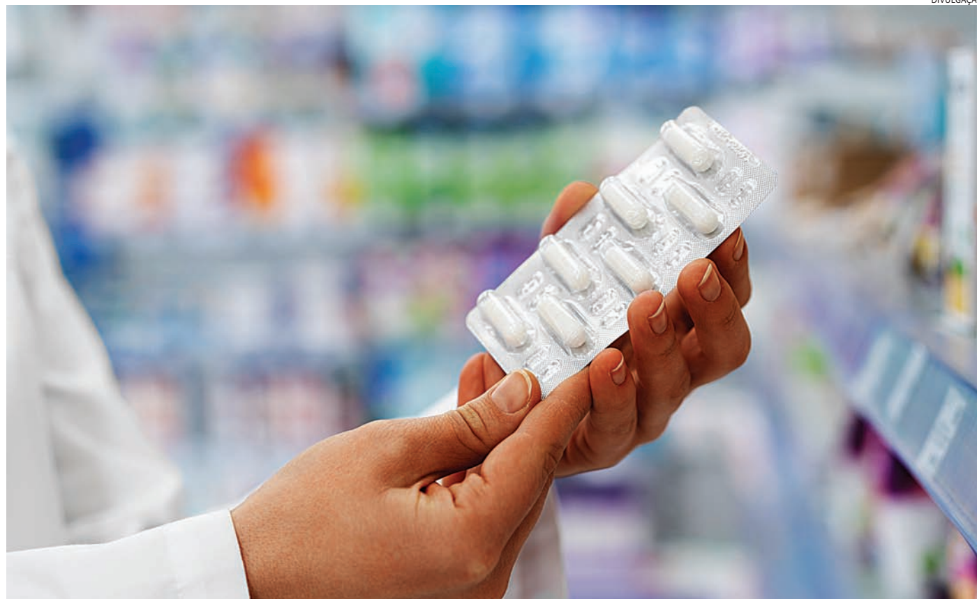
Assim como em Jundiaí, o maior impulso da região veio das classes intermediárias

Apenas no município de Jundiaí, o gasto anual com medicamentos passou de R$ 707,1 milhões em 2024 para R$ 858,1 milhões em 2025, alta de 21,4%. O crescimento foi puxado principalmente pelas classes B e C, que registraram aumentos de 31,3% e 22,1%, respectivamente. Já a classe A teve avanço mais moderado, de 4,4%, enquanto a classe D/E apresentou leve queda de 6%.