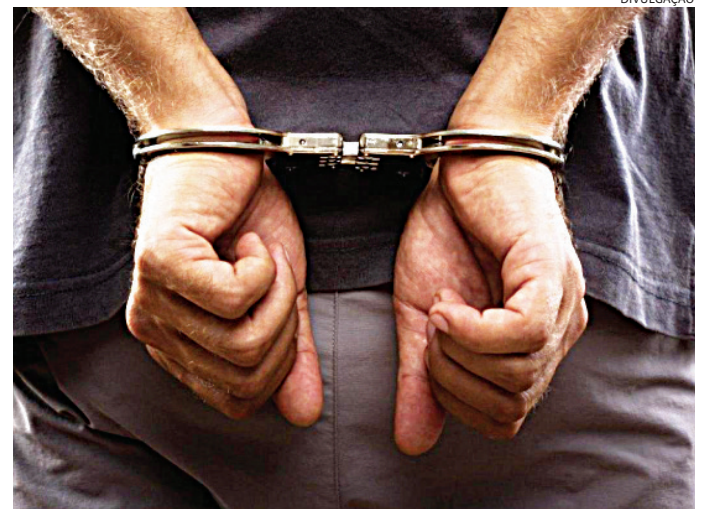
O homem foi levado para o DO e permaneceu preso

Em checagem aos dados pessoais, dois deles não constaram pendências com a Justiça e foram liberados. Um deles, porém, acusou