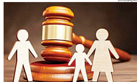
O pai devedor permanecerá preso no CDP de Jundiá

Nos dois casos, os detidos foram encaminhados ao Centro de Detenção Pro-