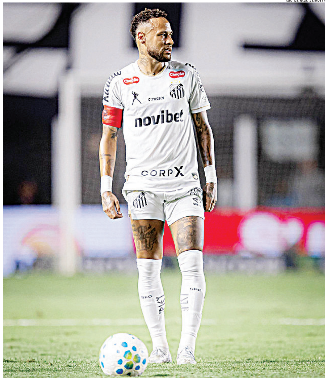
O Peixe busca seus primeiros pontos na competição após derrota na primeira partida

O jogo na Vila Belmiro terá transmissão em TV aberta, além de canais fechados e plataformas digitais, ampliando o alcance do confronto para os torcedores.