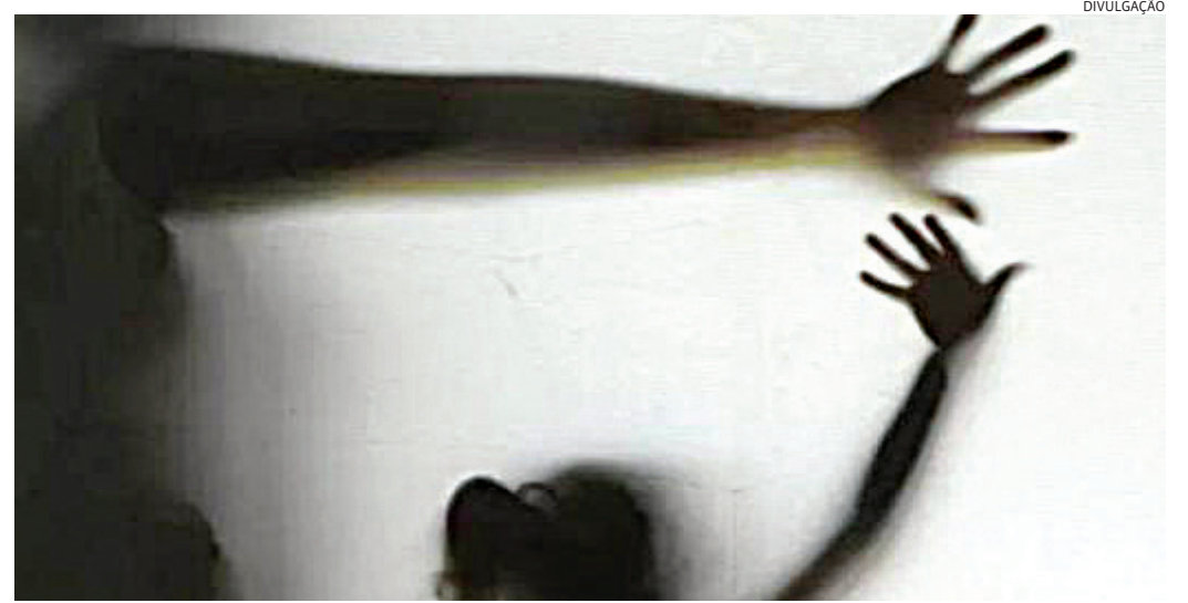
Casos de violência contra a mulher crescem em todo o país e em Jundiaí não é diferente

Ela afirma que, tão importante quanto denunciar é guardar as provas. "Isso sig-