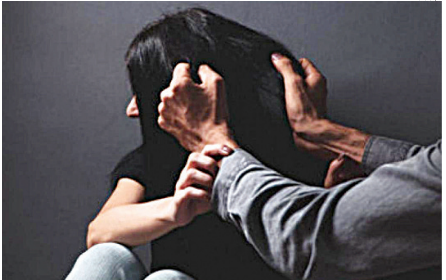
A vítima estava bastante assustada quando a PM chegou

O Velório Municipal informou sobre 3 óbitos, autorizados pelas famílias.