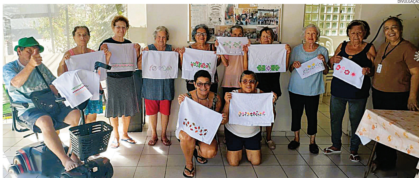
O espaço conta com 22 casas, além de área de convivência e lazer

As tintas e a revelação das cores a cada risco divertem os parceiros de moradia. Eles aproveitam para colocar a conversa em dia, cheia de risos e boas lembranças. As atividades integram a programação mensal do residencial e promovem bem-estar, convivência e qualidade de vida.