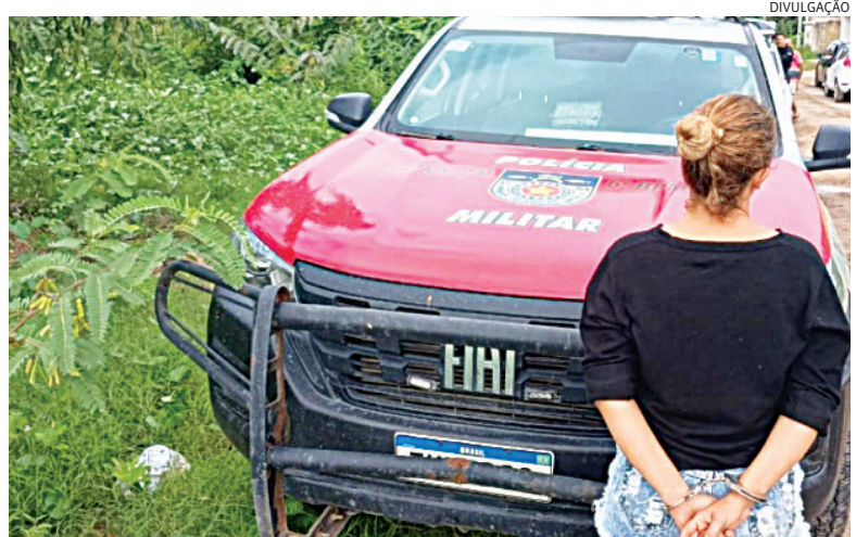
Além da foragida, foi preso um homem por tráfico de drogas