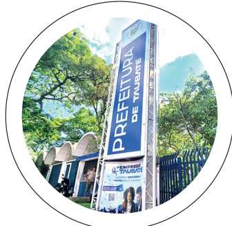
Arrumando a casa. Cortar de gastos e renegociar dívidas

e preciso, mapeando secretarias, despesas e contratos, o que trouxe mais clareza sobre a situação financeira da cidade de uma forma inédita e transparente – e mostrando que muita coisa precisaria ser feita.