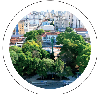
Desafio. Medidas difíceis, mas necessárias para Taubaté

O diagnóstico feito no começo do ano pela administração revelou uma realidade deficitária e problemas financeiros muito além do que se via nos discursos. Taubaté tinha um orçamento superestimado, receita subestimada e dívidas infundáveis: um montante de R$ 446 milhões da dívida venceu até 31 de dezembro de 2024 e outros R$ 658 milhões