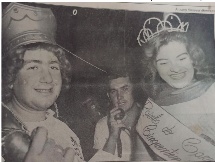
Carnaval em Araçatuba