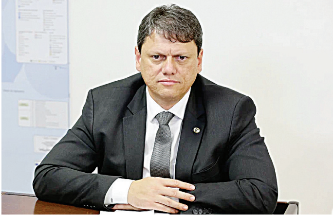
MDB se articula para conseguir ser vice na chapa de Tarcísio de Freitas

O PP, de Ciro Nogueira, e o próprio Republicanos, partido de Tarcísio, se mo-