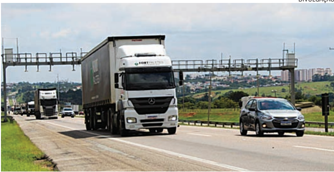
Os horários de maior fluxo será na sexta-feira (13), das 16h às 20h

Concessionária do sistema Anhanguera-Bandeirantes, a Motiva Autoban espera fluxo de 2,99 milhões de veículos nas rodovias sob gestão. Para atender o fluxo, a concessionária tem a Operação Carnaval. No domingo (15) e na terça-feira, os caminhões que se destinam à Capital pela Bandeirantes (SP-348) devem utilizar a Anhanguera (SP-330) no trecho do km 48 ao km 23, entre Jundiaí e São Paulo, aces-