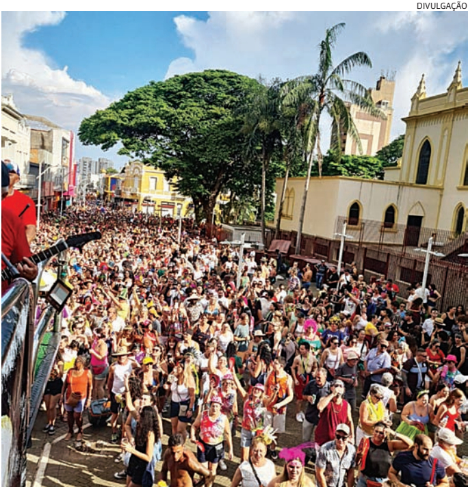
Cuidados com celulares e bebidas alcoólicas devem ser redobrados

Independente das estratégias, especialistas em segurança reforçam a importância de os próprios foliões