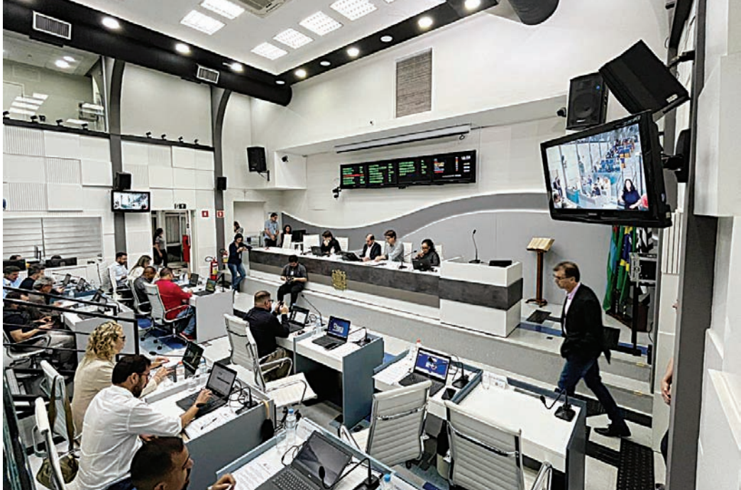
Projeto aprovado contra a adultização foi acompanhado pela maioria dos vereadores

O projeto proíbe apresentações, desfiles, danças, encenações ou quaisquer atividades, em eventos públicos ou privados, que exponham menores a situações inadequadas ou que estimulem a adultização. A norma também se estende às plataformas digitais administradas pelo município. Para participação de crianças e adolescentes em eventos com transmissão digital, passa a ser exigida autorização dos pais ou respon-