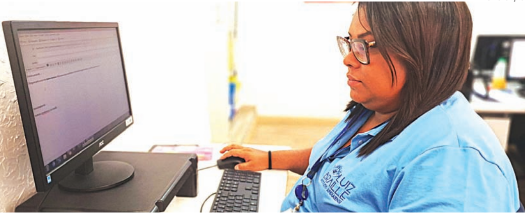
Mensalmente, o Braille realiza sete mil consultas e 15 mil exames gratuitos