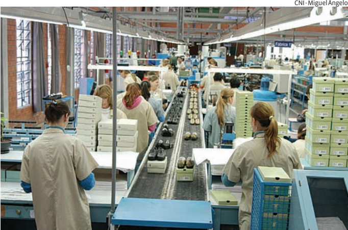
Atualmente, trabalhadores têm jornada de até 44 horas semanais

ra que estas empresas não tenham seus colaboradores trabalhando seis dias e folgando apenas um”, afirma. Ele explica ainda o que considera os benefícios desta medida no atendimento à população: “Imagina o motorista de ônibus que trabalha estas 44 horas semanais tendo sua carga horária reduzida. Vai poder descansar mais e estará melhor para trabalhar”, exemplifica, destacando ainda que os países que diminuíram sua carga de trabalho melhoraram em produtividade. “O que nosso PL e esta PEC querem trazer é esta qualidade de vida para o trabalhador, que terá mais tempo livre para ficar com a família, estudar, cuidar da saúde. Por ser um assunto que impacta fortemente a sociedade, o Psol quer um debate amplo”, afirmou. O vereador jundiaiense ainda destaca que o PL proposto pelo Cardume será levado para audiência pública no dia 24 de abril: “Vamos convidar secretários para falar-