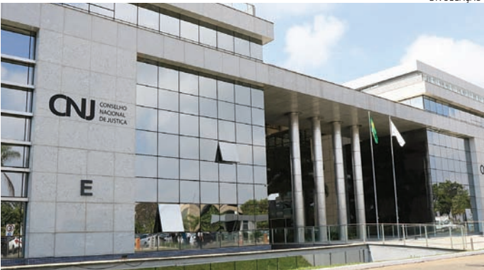
CNJ estabelece um limite para “penduricalhos” de juízes

quer passivo funcional, seja de forma isolada ou cumulativa, independentemente de sua natureza remuneratória ou indenizatória, não poderá exceder, mensalmente, o valor supramencionado [R$ 46,3 mil]”, escreveu o corregedor. Autorizações concedidas pelo CNJ e pelo STF a partir de 2020, permitindo excluir diversas verbas indenizatórias do cálculo do teto do funcionalismo, têm impulsionado o pagamento de penduricalhos a magistrados em todo o país. Por intermédio de entidades sindicais que fazem lobby para juízes e desembargadores, as cortes têm aceitado teses de que os magistrados teriam direito a pagamentos extras para indenizar trabalho em excesso.