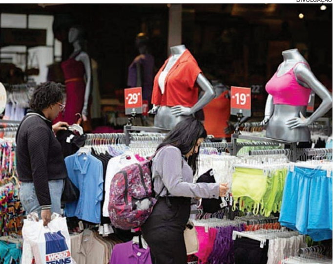
De cada 10 empresas brasileiras que exportam, entre 4 e 5 ficam em SP

O documento mostra que São Paulo tem quase quatro vezes mais empresas exportadoras que o segundo colocado no ranking