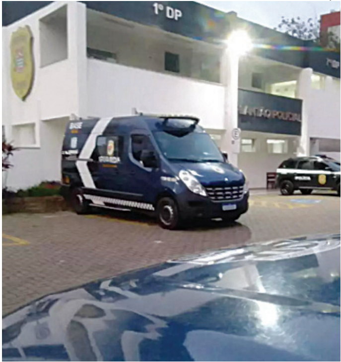
A Guarda Municipal prendeu um suspeito do crime de tráfico

a creche estava em pleno funcionamento atendendo crianças de 1 ano a 1 ano e meio de idade.