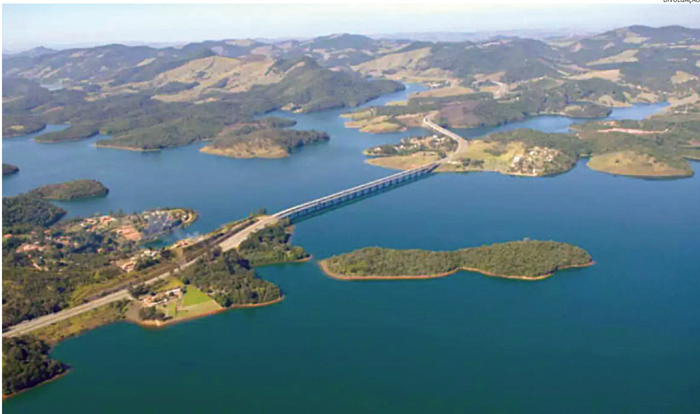
Apesar do índice próximo ao esperado, houve nove dias sem registro de chuvas ao longo do mês

Mesmo com chuvas 17% abaixo da média histórica, o Sistema Cantareira seguiu em recuperação, encerran-