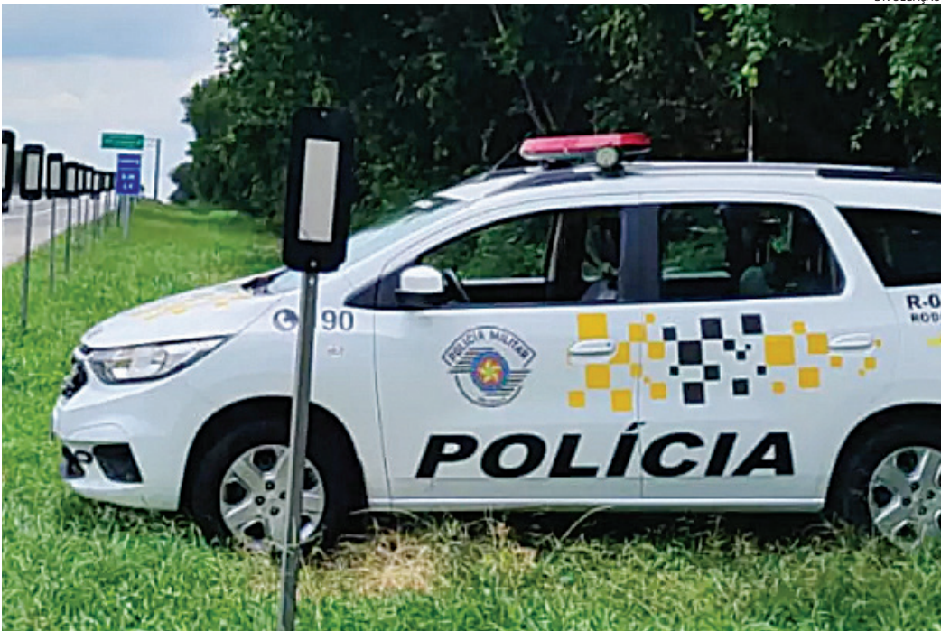
No local do atropelamento não há iluminação, faixa de pedestres e nem passarela

O atropelamento aconteceu por volta das 18h40 na altura do número 4401 da rodovia. Segundo informações da psicóloga à Polícia Militar, ela transitava em velocidade entre 80 e 90 km/h, quando de repente surgiu a vítima