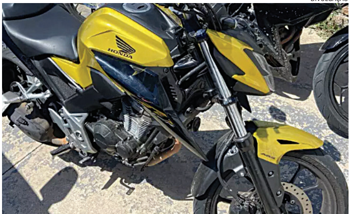
As motos foram apreendidas durante operação nesta quinta-feira