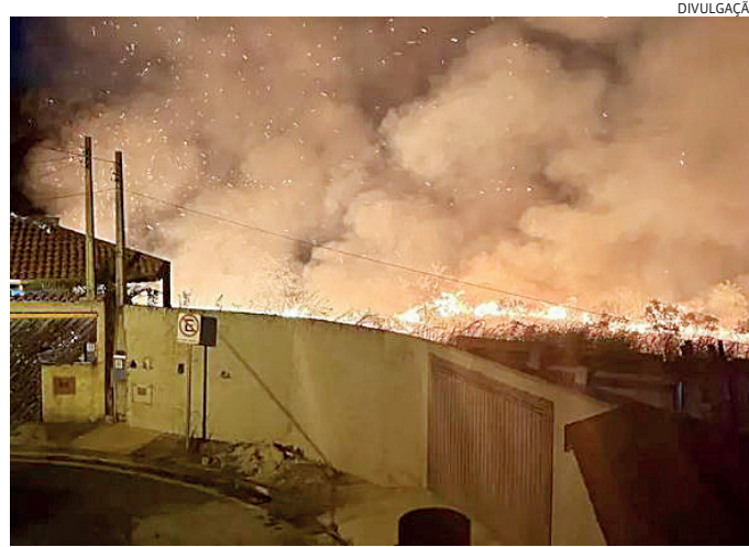
Atear fogo em área urbana, próximo a residências, leva risco a moradores

Também na terça-feira, um incêndio similar aconteceu na Rodovia Edgard Máximo Zambotto, no bairro Vista Alegre, em Campo Limpo Paulista. Dessa vez, porém, o autor do crime foi identificado por Guardas Municipais e, levado à delegacia, foi indiciado por atentado contra a segurança do meio de transporte. Não houve enquadramento