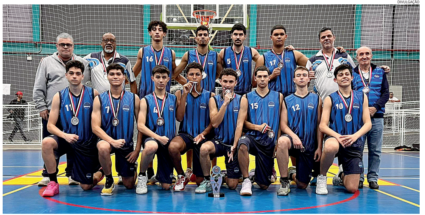
Com os resultados, Jundiaí segue na vice-liderança geral dos Regionais

Os Jogos Regionais terminam no dia 27 de julho.