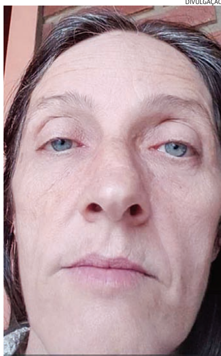
De acordo com a filha, ela está 40 quilos mais magra e bem debilitada