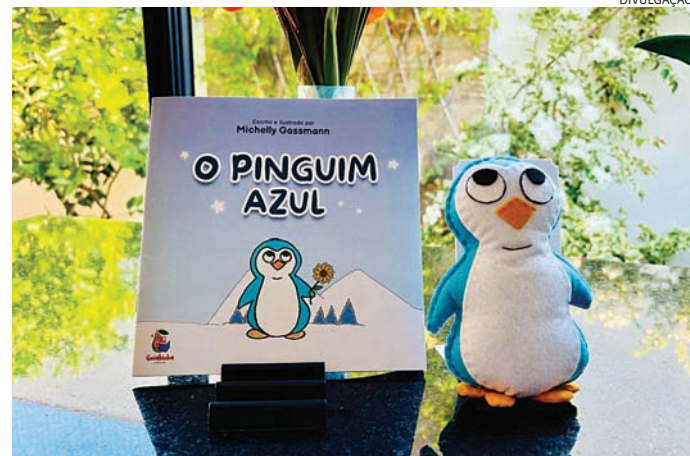
O Pinguim Azul: Conheça o personagem autista que ensina inclusão

Esse é o seu primeiro livro infantil, mas ela já escreveu outros dois livros: O Jardim de Inês e A Sétima Ordem, e é co-autora do livro Maternidade Atípica, que será lançado pela Literare Books ainda este ano.