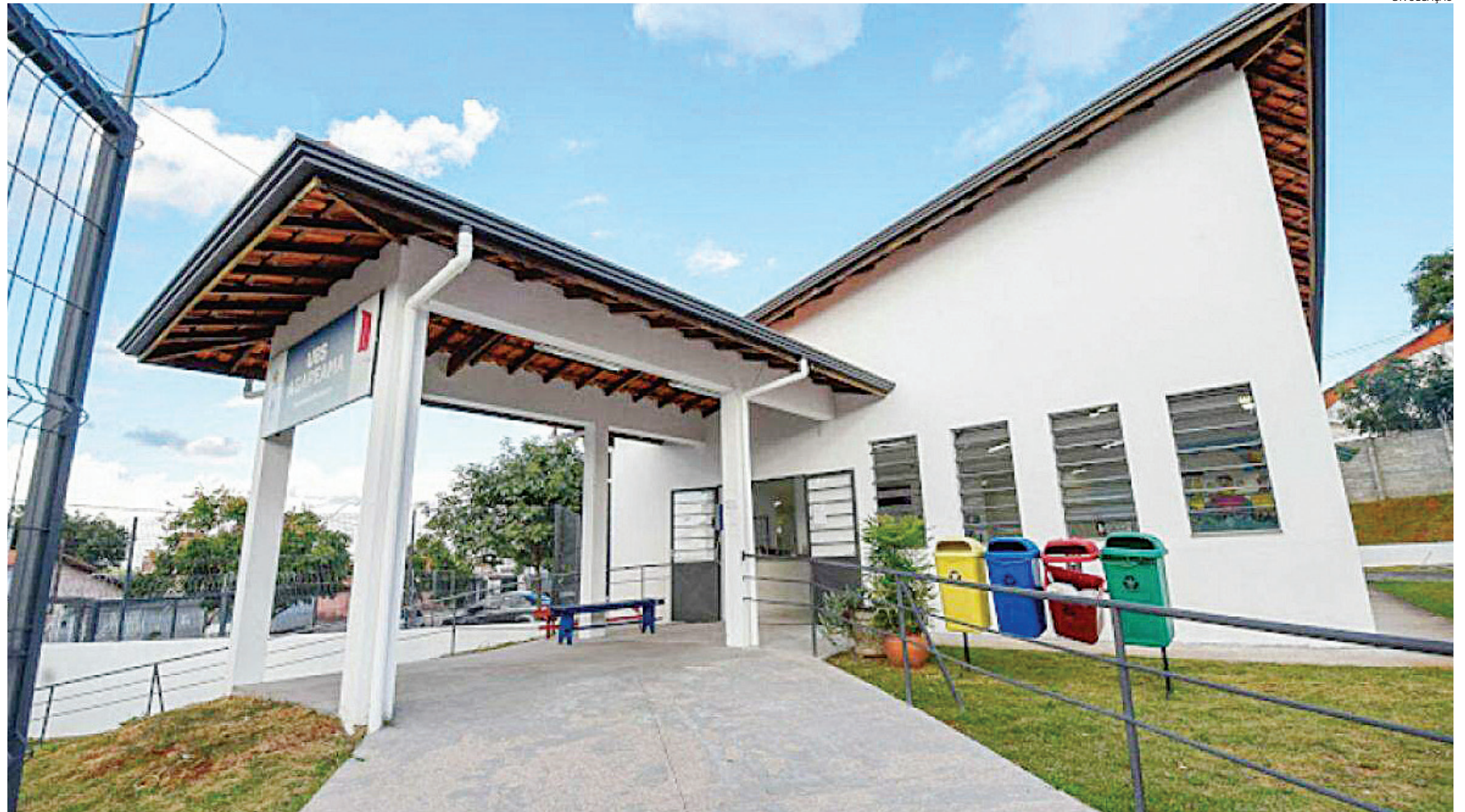
Cada UBSs responde um questionário com 15 perguntas que abordam temas como infraestrutura, oferta de serviços, quadro de funcionários, entre outros aspectos

De acordo com a Unidade de Gestão de Promoção da Saúde (UGPS), os gerentes das unidades no município já estão cientes quanto ao cumprimento do prazo e à fidelidade das respostas. "O Censo UBS é importante para o cenário nacional, para atualização dos dados do Ministério da Saúde, para o dimensionamento das ci-