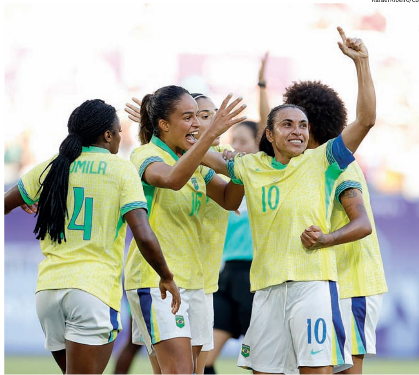
A seleção brasileira feminina de futebol estreou com vitória por 1 a 0 contra a Nigéria

O Brasil assim obteve seus três primeiros pontos no Grupo C, igualando a pontuação da Espanha, campeã mundial, que abriu a chave com um triunfo por