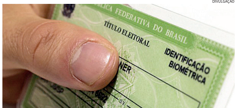
Órgãos públicos têm reforçado ações de combate ao assédio eleitoral