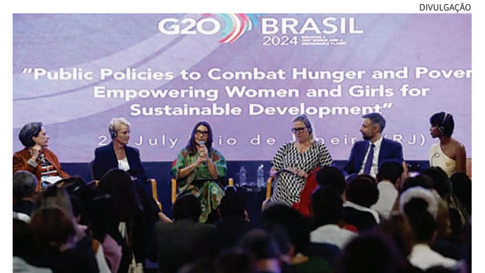
Primeira-dama participou de painel sobre empoderamento de mulheres

A socióloga e primeira-dama Janja Lula da Silva avaliou na última quarta-feira (24) que a Aliança Global contra a Fome e a Pobreza poderá ser um instrumento efetivo para a construção de uma sociedade mais igualitária. A iniciativa envolve um compromisso internacional para a mobilização de apoio político, de recursos financeiros e de conhecimento técnico com um único objetivo: disseminar políticas públicas e tecnologias sociais comprovadamente eficazes para a insegurança alimentar no mundo.