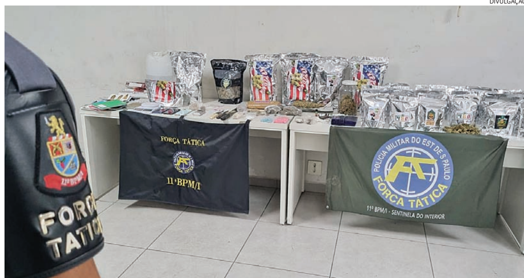
A droga foi encontrada dentro da casa pelos policiais militares

O suspeito recebeu voz de prisão e foi levado para a delegacia, onde teve determinada sua prisão em flagrante, sendo encaminhado ao Centro de Triagem de Campo Limpo Paulista.