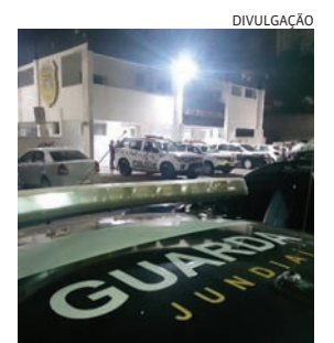
Os guardas detiveram ele e o conduziram à delegacia