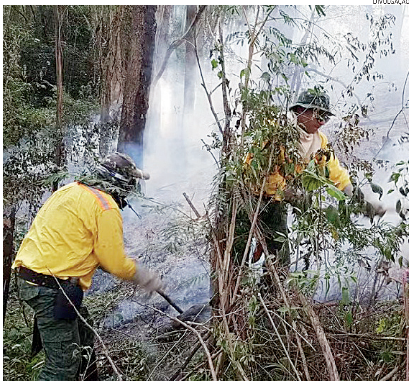
O período de maior ocorrência de incêndio é entre os meses de junho e outubro

O cheiro de queimado chega junto à fuligem no ar, logo as vias aéreas ficam irritadas e, para quem já tem alguma doença respiratória, é difícil respirar. Essa sequência afeta jundiáenses todos os dias, pois as queimadas no município têm sido diárias. O fogo próximo a rodo-