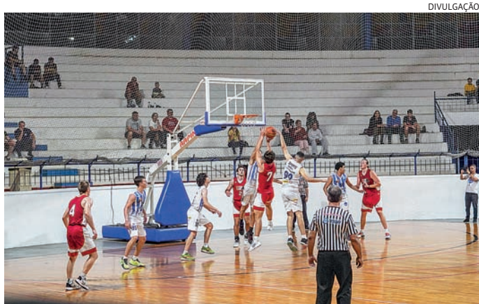
As inscrições são gratuitas e devem ser feitas pela internet