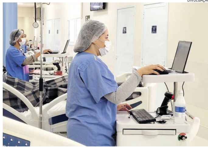
Checagem beira leito já é realizada na Instituição

"Neste primeiro momento, a consultoria verificou a utilização do prontuário ele-