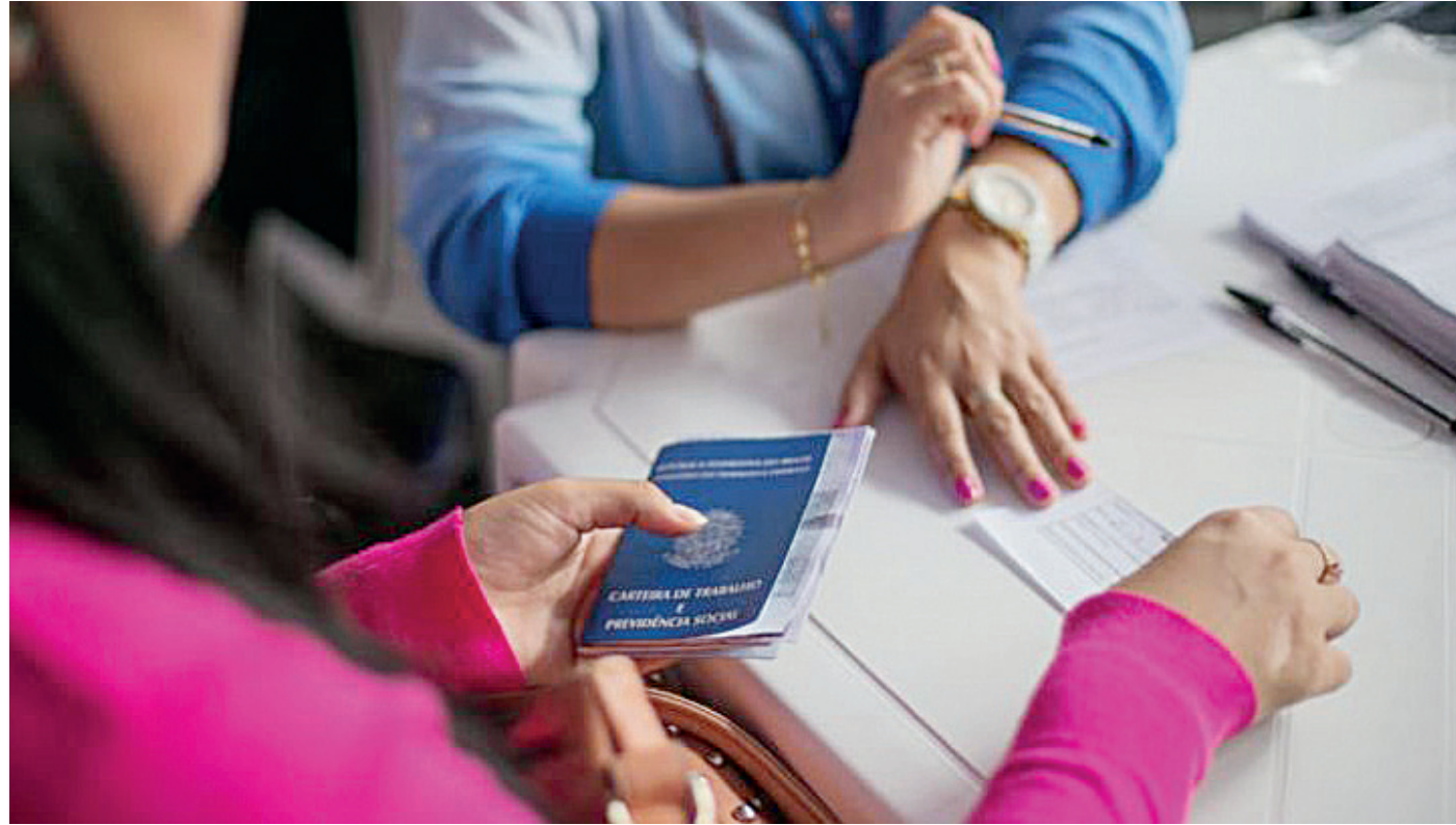
Uma das fontes relatou que foi demitida por conta de seu posicionamento político