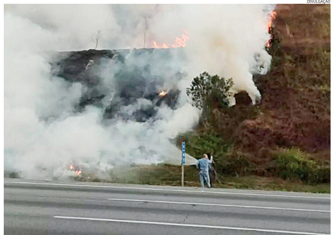
Os incêndios em beiras de rodovias acabam causando interdições das vias, por causa da baixa visibilidade

por crime ambiental e ele foi liberado para responder pela infração em liberdade.