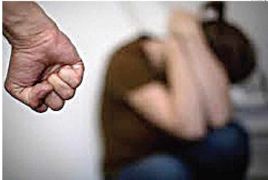
A vítima precisou ficar internada por conta do estado de choque

A Polícia Militar foi acionada para atender a uma ocorrência de violência doméstica e, quando chegou ao local, encontrou uma mulher grávida, ferida e bastante assustada, ao lado de uma moto danificada. Ao ser abordada pelo cabo Iorio e soldado Archilha - com apoio do cabo Miguel e soldado Bento -, ela contou