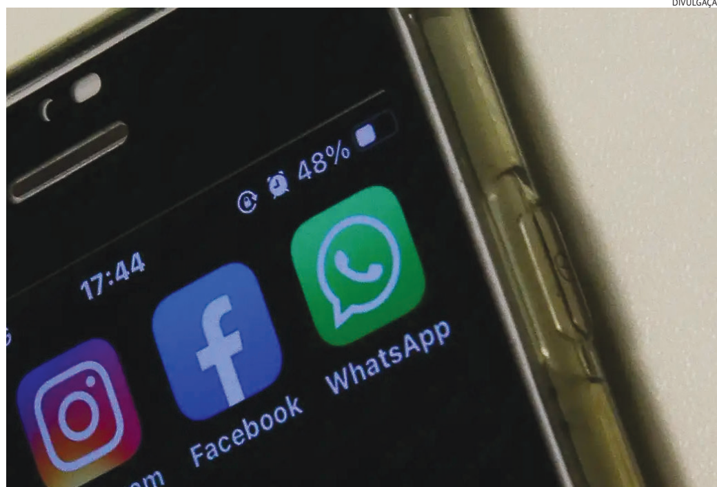
Pesquisa é do Laboratório de Estudos de Internet e Redes Sociais

Em muitos casos, os anúncios recorreram à simulação de páginas de instituições públicas e privadas. Em 40,5%, eles foram veiculados por anunciantes que se passavam pelo governo federal. Os pesquisadores do NetLab observam que os anúncios exploram a desin-