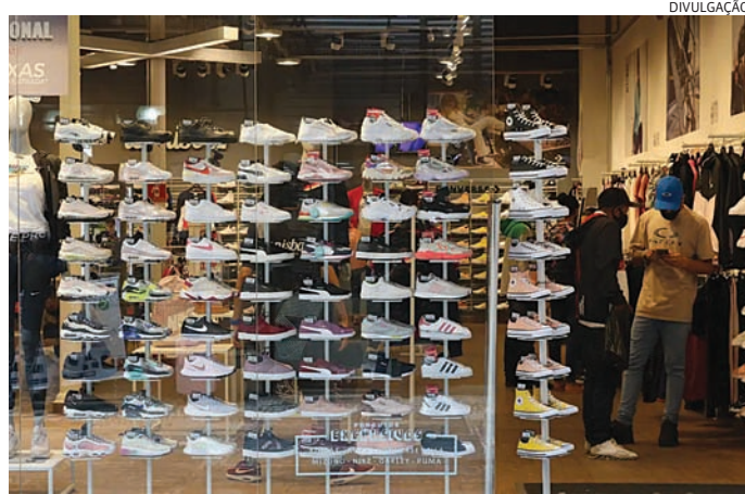
No varejo, serviços de entregas rápidas também devem ser priorizados

Para a assessora, “o futuro do comércio online e do varejo tradicional será marcado pelo equilíbrio cada vez