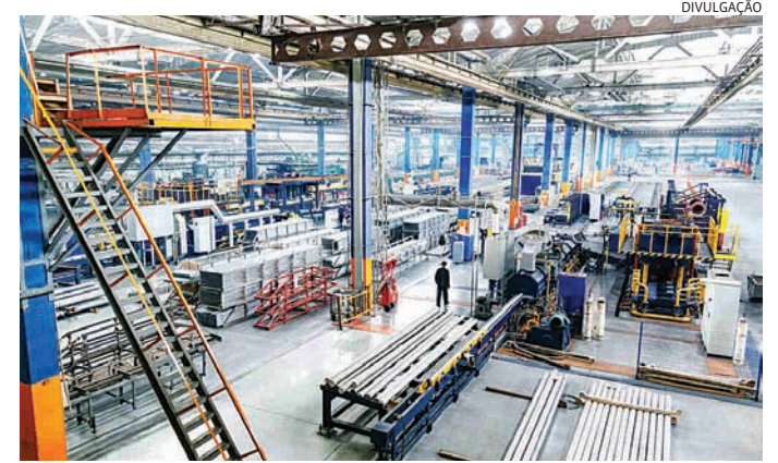
Demanda por bens industrializados foi estimulada pelo baixo desemprego

A utilização da capacidade instalada (UCI) caiu