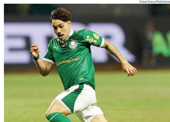
O Palmeiras ocupa a segunda colocação do Grupo D

A partida será transmitida pela Record TV (canal aberto) e Cazé TV, no Youtube.