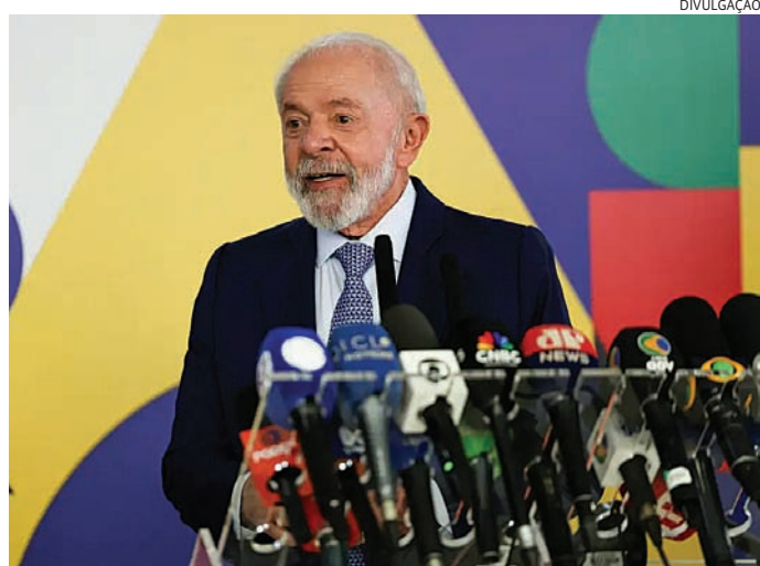
Lula afirma que irá liberar crédito à população

Lula falou sobre o assunto durante um discurso após o evento vinculado ao programa Água para Todos. “Muito dinheiro na mão de poucos significa miséria de muitos. Pouco dinheiro na mão de todos significa melhorar a vida de todo o povo brasileiro. É por isso que vamos fazer muitas políticas de