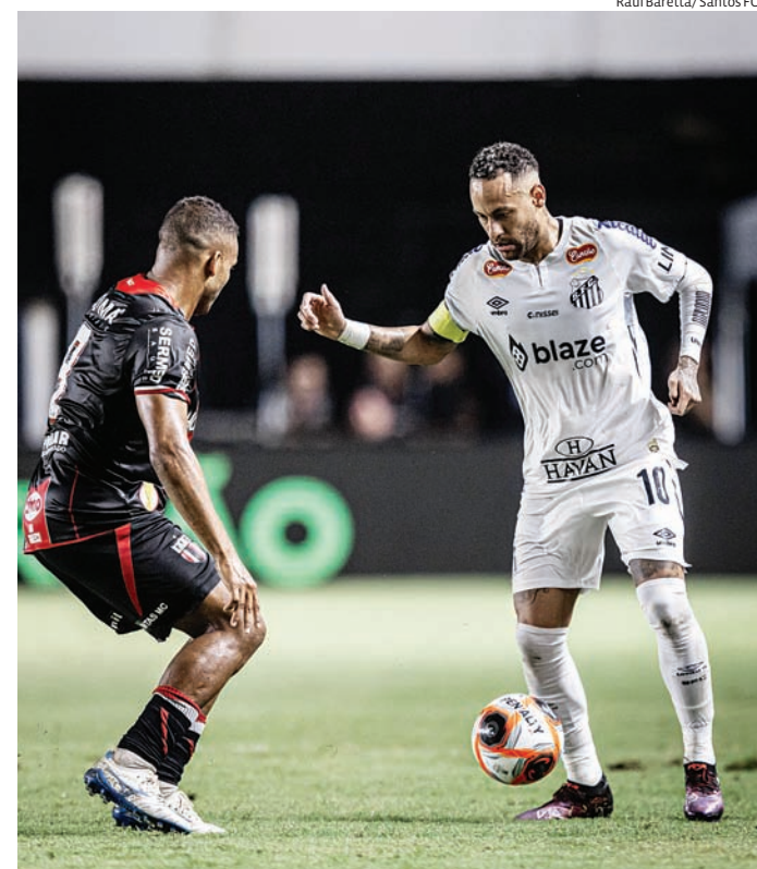
Santos reforçou a segurança para ter o craque no jogo

O Santos preparou um esquema de segurança para ter o craque no jogo desta tarde e viajou em voo fretado para