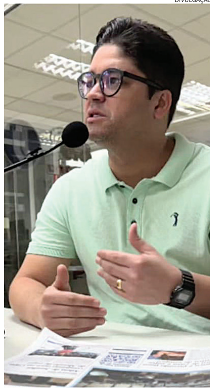
Madson traz em sua história espírito de luta dos nordestinos