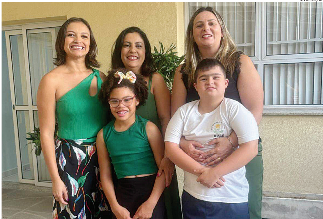
Mães atípicas não estão apenas cuidando de seus filhos, estão mudando o mundo com coragem, amor e resiliência