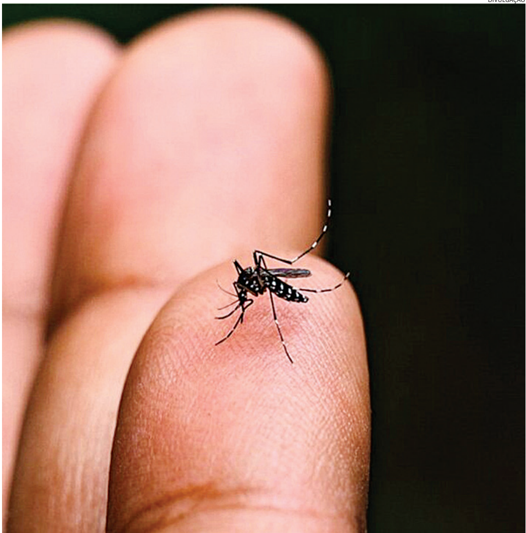
A dengue é transmitida pelo mosquito Aedes aegypti , que precisa de água parada para se reproduzir

como vasos de plantas, garrafas e latas abertas em local exposto ao tempo e caixas d'água, por exemplo. CENÁRIO Até o fim de janeiro, Jundiaí tinha cerca de 200 casos de dengue. Em fevereiro, o número aumentou para cerca de 500. Já em março, o aumento foi significativo e o município passou a acumular mais de 2,3 mil casos. Em abril, o número mais que dobrou e chegou à casa dos 5 mil. Neste mês, em pouco mais de uma semana, são mais