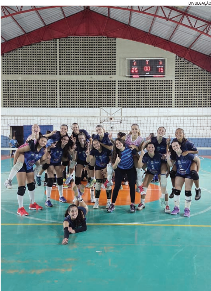
O volume de jogo e o saque foram fundamentais para a vitória

A equipe conta com apoio da Prefeitura de Jundiaí e dos patrocinadores: New Millen, Fuzzy Açaí, Sorvetes Jundiá, MHTech Engenharia, Madeireira