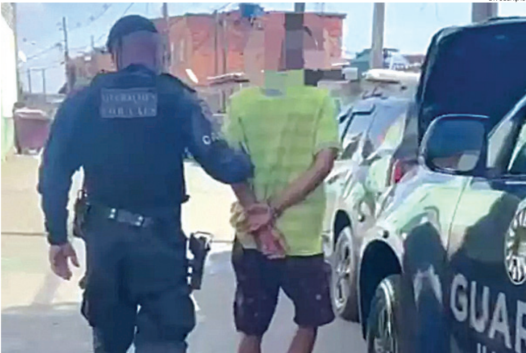
Os dois suspeitos foram presos pelos guardas municipais

conseguiram alcança-los. Com eles foram apreendidas centenas de porções de drogas. Ambos confessaram que estavam de fato vendendo entorpecentes.