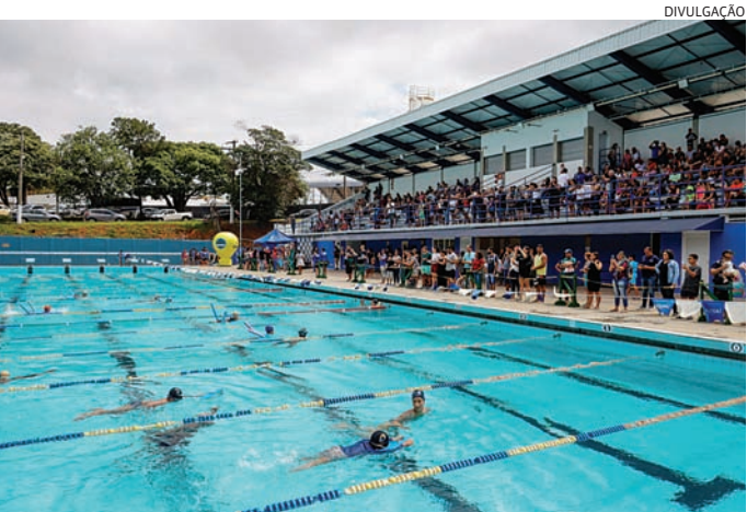
O torneio é gratuito e voltado para nadadores da região

Fora dos gramados há quase um mês, Neymar ainda não tem um prazo exato para voltar ao Santos. A expectativa é que ele possa ficar à disposição entre o final de maio e começo de junho.