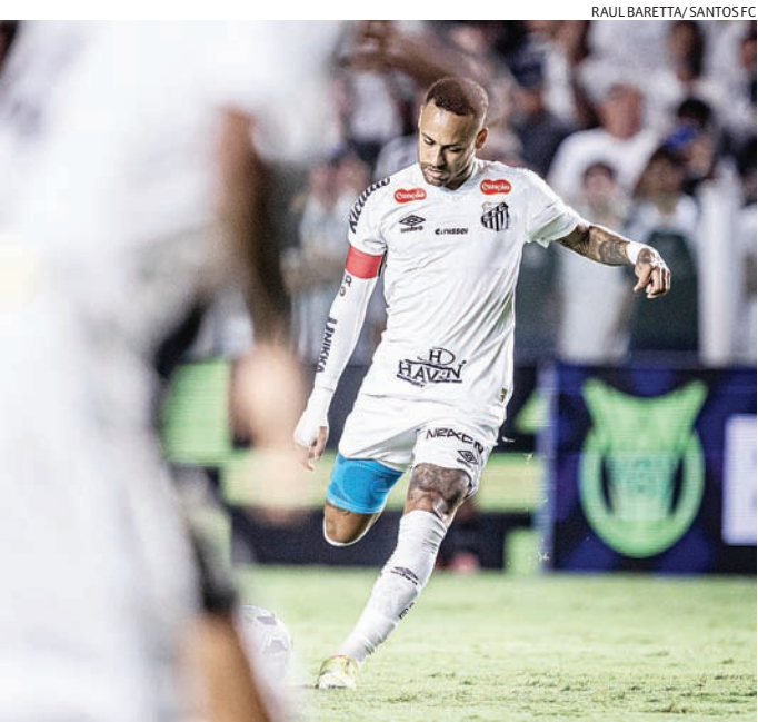
O camisa 10 tem feito intensos trabalhos de fisioterapia no clube

Desta vez, o Peixe decidiu assumir mais protagonismo, deixando o staff do jogador um pouco mais de lado. Na outra lesão, a equipe do astro teve participação mais ativa. Além disso, Neymar permaneceu na cidade de Santos. Ele não foi para sua mansão em Mangaratiba e tem aparecido menos em eventos. O meia-atacante foi bastante criticado por marcar presença em