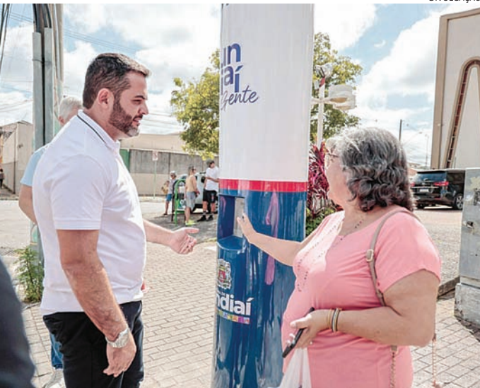
O equipamento operado pela Guarda Municipal, possui câmeras