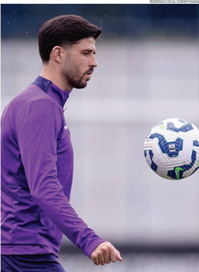
Com desfalques, Corinthians terá pelo menos uma mudança

Do outro lado, o Mirassol teve semana livre pa-