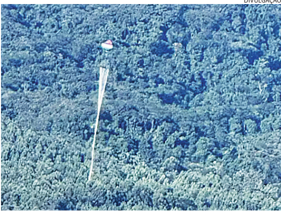
O balão estava com a tocha apagada e foi apreendido

Um morador do bairro Medeiros percebeu que o balão estava caindo e acionou a GM. A Corporação enviou uma equipe, que o localizou caído, e, por sorte, com a tocha apagada - do contrário poderia ter causado incêndio na Serra. O balão trazia identificações de grupos de baloeiros - não havia nenhum bando tentando resgatá-lo.