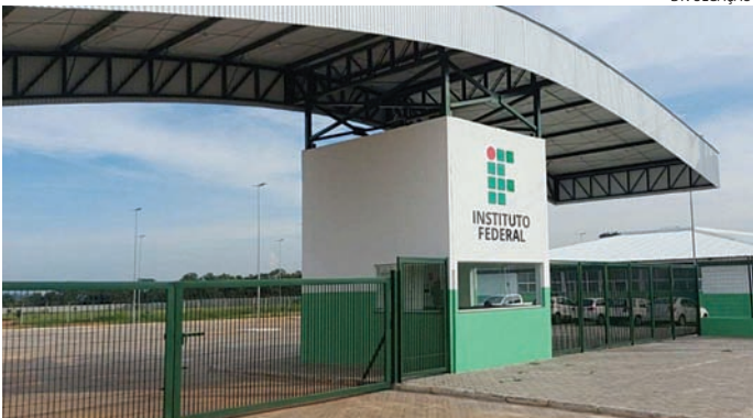
IFSP vai receber emenda de R$ 350 mil e Ateal, R$ 500 mil

A Primeira Turma do STF (Supremo Tribunal Federal) formou maioria nesta sexta-feira (9) pela derrubada