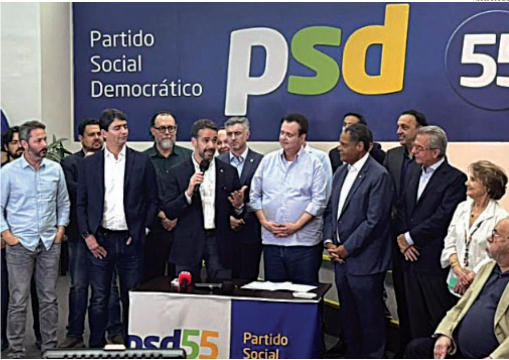
Eduardo Leite saiu do PSDB e se filiou nesta sexta ao novo partido, o PSD

A filiação foi anunciada na tarde desta sexta-feira no gabinete da direção nacional do partido, em São Paulo, e contou com a presença de Gilberto Kassab, presidente nacional do PSD. Agora Leite terá uma disputa interna com o governador do Paraná, Ratinho Júnior, para decidir quem será o nome do partido a disputar a presidência do Brasil nas eleições 2026.