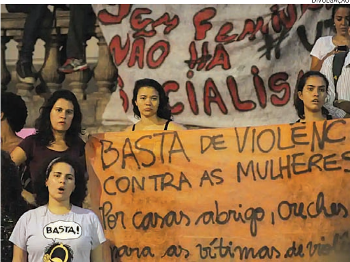
A maioria das vítimas não busca autoridades policiais nem registra B.O.

Outro dado que a pesquisa destaca é que 60% dos cerca de 1,2 mil entrevistados disseram conhecer um caso de criança ou adolescente com menos de 14 anos que foi estuprada, e 30% afirmaram ter conhecimento de um caso em que a vítima engravidou.