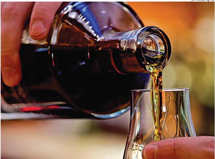
Em caso de intoxicação, o atendimento médico deve ser imediato

O Governo de São Paulo divulgou alerta à população sobre os principais sintomas relacionados à intoxicação por bebida adulterada com metanol. Em caso de sintomas como dores abdominais intensas, tontura e confusão mental, a orientação é buscar atendimento médico imediato. O socorro em até 6h após o início dos sintomas é fundamental para evitar o agravamento. A intoxicação por metanol é grave, pode levar à cegueira permanente e até o óbito. O metanol pode estar presente em bebidas alcoólicas clandestinas e adulteradas, além de produtos como combustível, solventes e líquidos de limpeza.