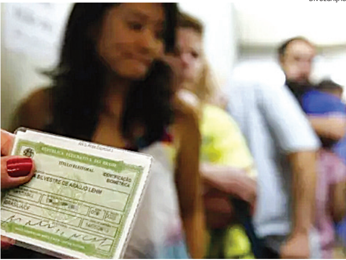
Novo enfrenta problemas na prestação de contas de candidatas mulheres