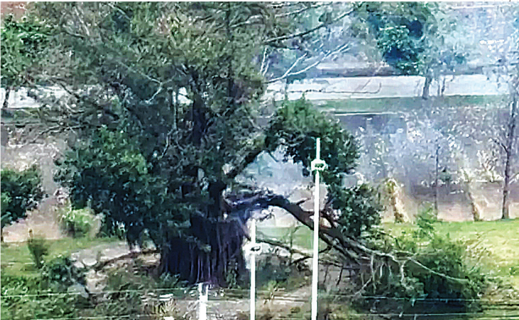
Bombeiros levaram quatro horas para conter o incêndio

O Corpo de Bombeiros combateu, no início da tarde deste sábado (4), um incêndio que atingiu uma árvore centenária no bairro Vianelo, em Jundiaí, em