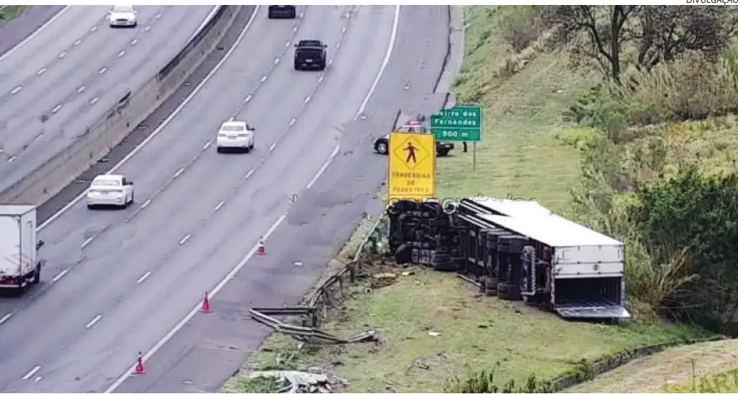
O motorista estava sozinho no caminhão; o óbito foi constatado no local

O motorista estava sozinho no caminhão. O óbito foi constatado no local. O corpo foi encaminhado ao Instituto Médico Legal (IML) de Jundiaí e, após exames, foi liberado à família para sepultamento.