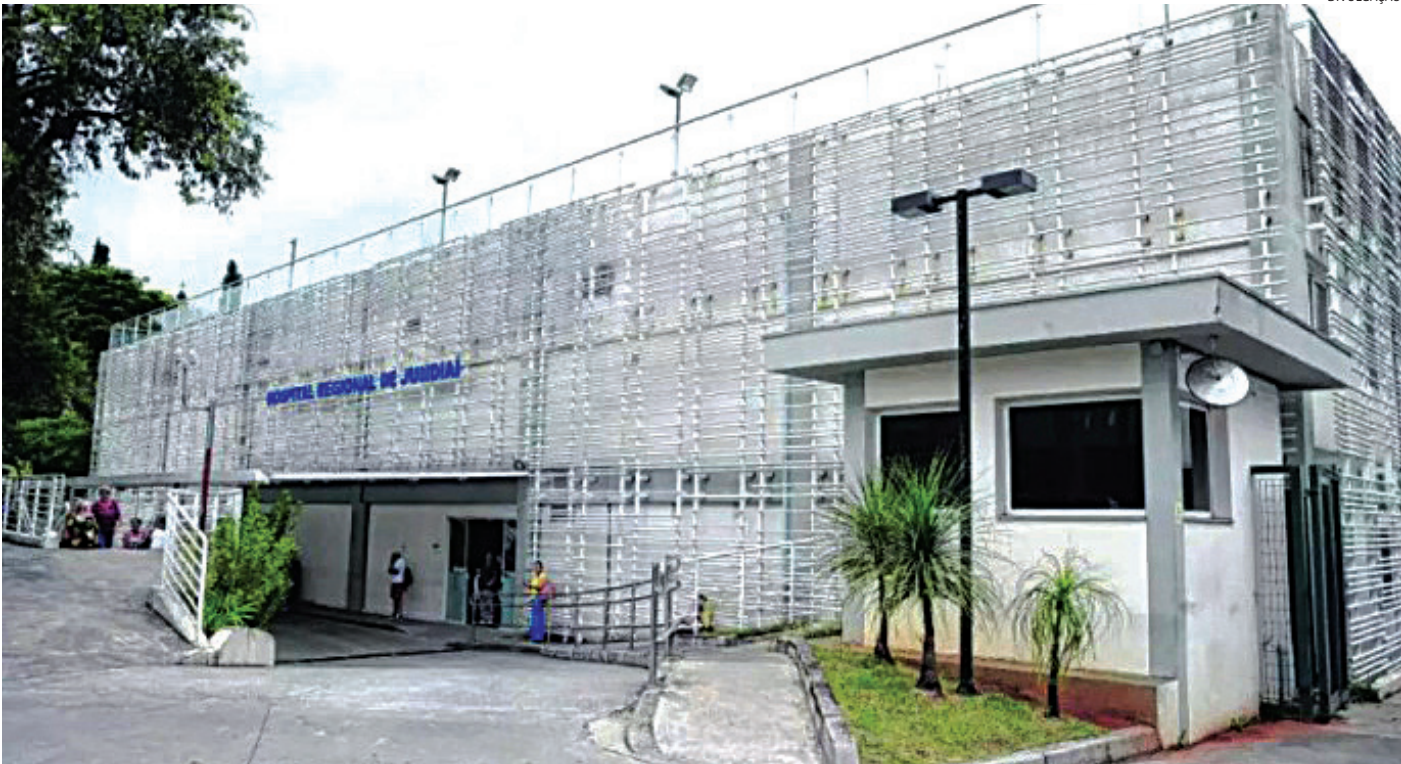
O Hospital Regional ampliou em 20% o atendimento em Jundiaí, pago pelo Estado

Os repasses do IGM SUS Paulista registraram um aumento expressivo. Os valores, que anteriormente eram de R$ 4 per capita, passaram a variar entre R$ 15 e R$ 40, aumentando significativamente o suporte financeiro para que as prefeituras possam estruturar seus serviços e responder às demandas da população. Além disso, segundo o Governo do Estado, o Hospital Regional de Jundiaí aumentou em 20% o número de cirurgias realizadas na unidade, ampliando o acesso da população a procedimentos essenciais. Em nota, a Secretaria de