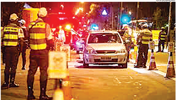
Operações são executadas pelo Detran com apoio das equipes locais

guez, por exemplo, é que ditará a pena”, completa. A advogada explica que a