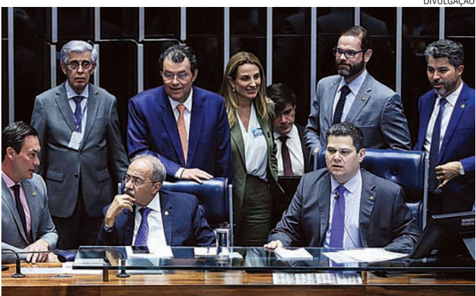
Senadores enrijecem regras para o consignado; projeto vai para a Câmara

“A concessão unilateral de crédito consignado leva o consumidor ao endividamento excessivo e injustificado, que ele muitas vezes não percebe, porque nem mesmo solicitou o empréstimo. Nesses casos, o consumidor pode ser considerado hipervulnerável, pois ele é muitas vezes idoso e aposentado”, apontou.