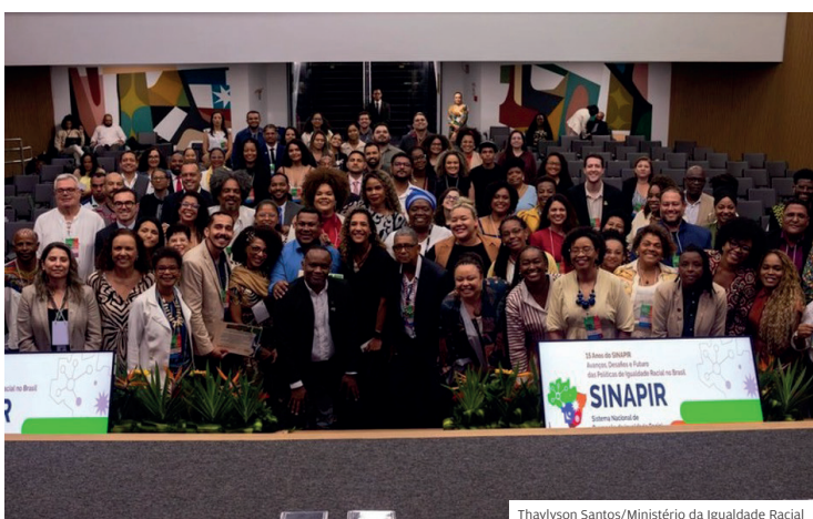
Thaylyson Santos/Ministério da Igualdade Racial

Direitos da Pessoa com Deficiência do governo do Estado de São Paulo. ■