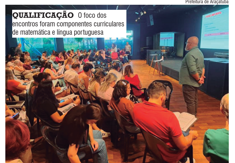
QUALIFICAÇÃO O foco dos encontros foram componentes curriculares de matemática e língua portuguesa

A programação foi voltada à formação de professores com foco nos componentes curriculares de matemática e língua portuguesa. Ao longo dos encontros, foram desenvolvidos estudos e práticas pedagógicas sobre temas como pensamento algébrico, resolução de problemas e gêneros textuais — entre eles, convite e