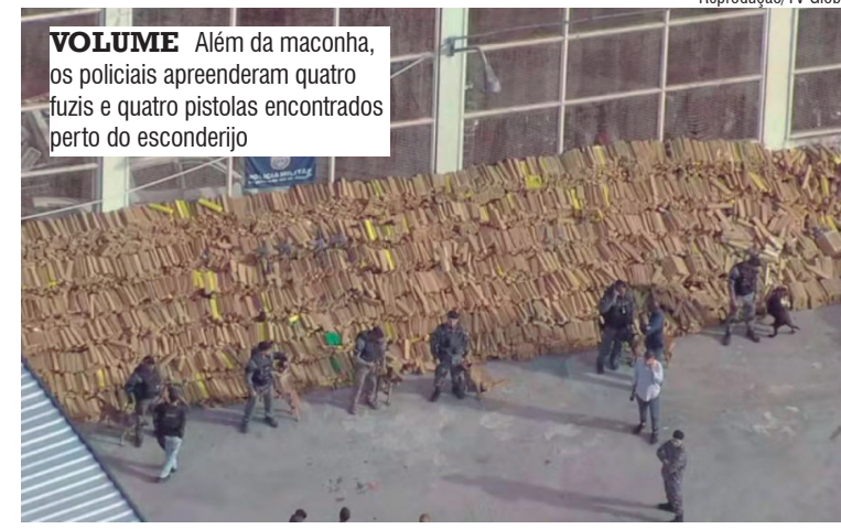
VOLUME Além da maconha, os policiais apreenderam quatro fuzis e quatro pistolas encontrados perto do esconderijo

A retirada do entorpecente mobilizou dezenas de agentes por cerca de cinco horas e exigiu o uso de quatro caminhões com capacidade para cinco toneladas cada. Além da maconha, os policiais apreenderam quatro fuzis e quatro pistolas encontrados próximos ao esconderijo.