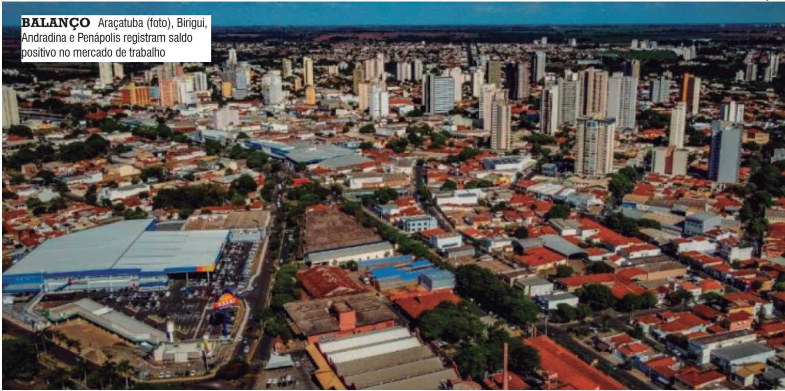
BALANÇO Araçatuba (foto), Birigui, Andradina e Penápolis registram saldo positivo no mercado de trabalho

Também houve crescimento nos demais segmentos: o comércio abriu 49 vagas, a indústria registrou 43, a construção civil acrescentou 40 oportunidades e a agropecuária teve aumento de 14 empregos.