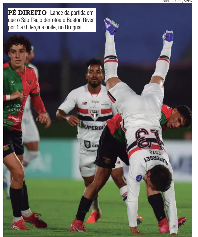
PÉ DIREITO Lance da partida em que o São Paulo derrotou o Boston River por 1 a 0, terça à noite, no Uruguai

No torneio nacional, a equipe são-paulina é vice-líder com 20 pontos, cinco a menos que o Palmeiras. O próximo compromisso será contra o Vitória, pela 11ª rodada, neste sábado, às 16h30, no estádio Barradão, em Salvador.