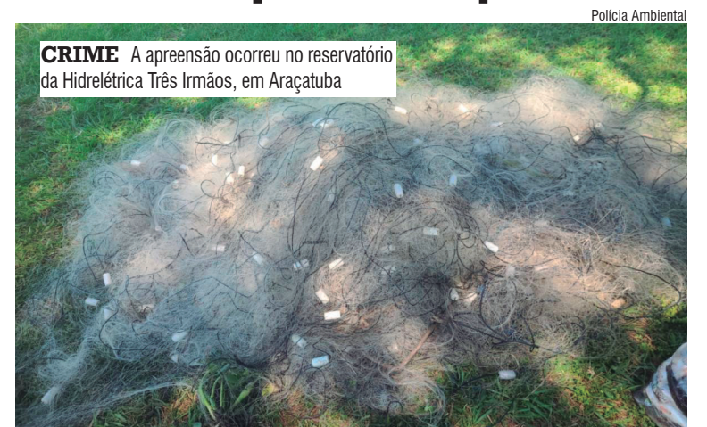
CRIME A apreensão ocorreu no reservatório da Hidrelétrica Três Irmãos, em Araçatuba

A ação ocorreu durante patrulhamento náutico realizado no contexto da Operação Algae – Fase 6. Segundo as informações da equipe responsável, o recolhimento do material ocorreu após denúncia. No local, os agentes localizaram quatro cordões de redes de nylon armados