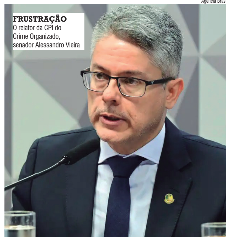
FRUSTRAÇÃO O relator da CPI do Crime Organizado, senador Alessandro Vieira

“Temos, ao mesmo tempo, a criminalidade violenta ocupando o território brasileiro, cada vez mais expulsando, dominando, restringindo brasileiros e brasileiras. E temos aqui, nos escritórios, gabinetes de Brasília e da Faria Lima (em São Paulo), em todos os centros onde se tenha recurso e poder, a infiltração pela corrupção”, concluiu o senador.