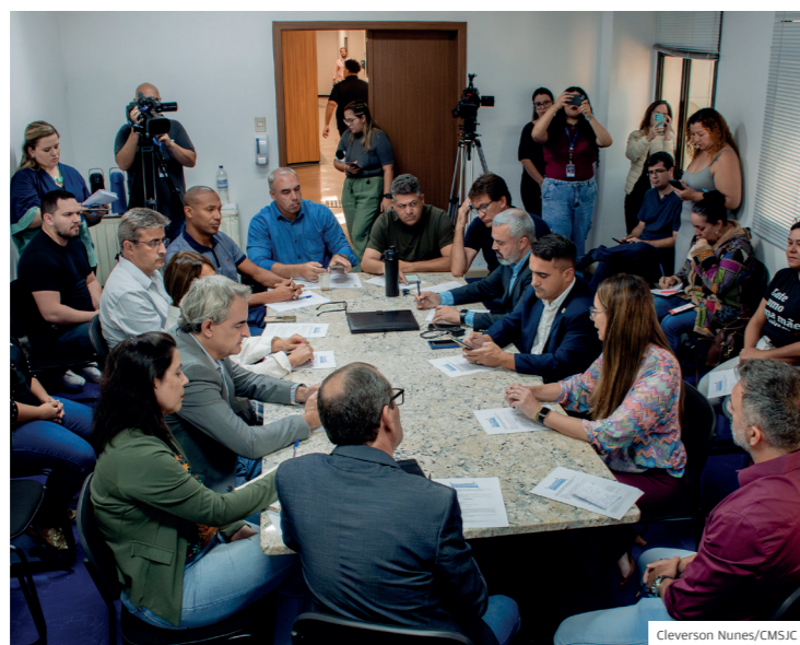
Frente Parlamentar em Defesa das Pessoas com Síndrome de Down