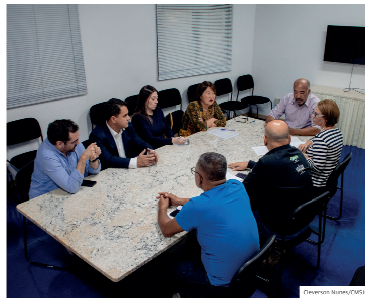
Frente Parlamentar da Habitação e Regularização Fundiária