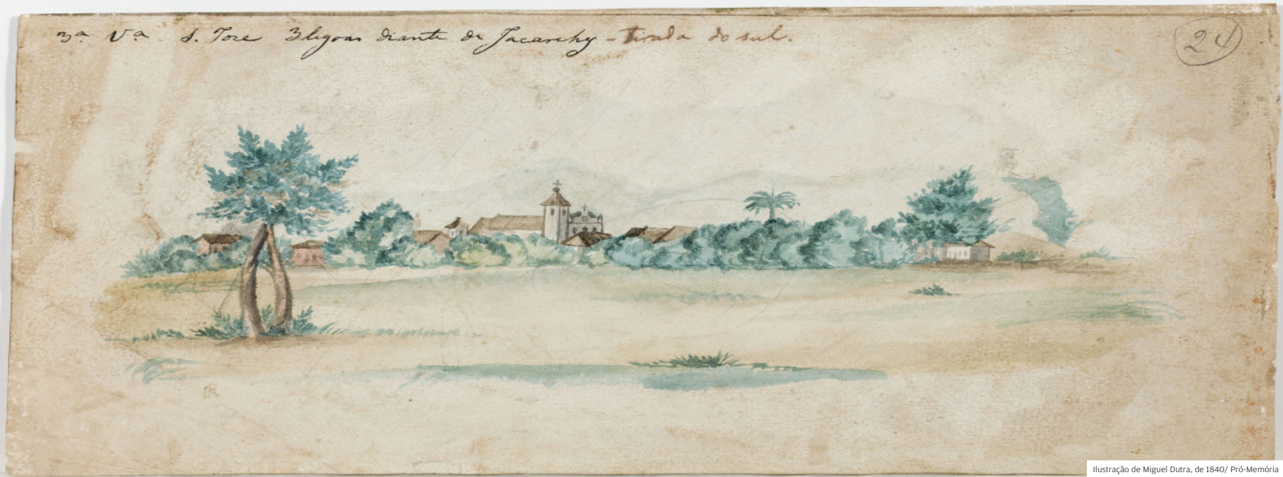
Ilustração de Miguel Dutra, de 1840/ Pró-Memória

Em 27 de julho, São José dos Campos completa 258 anos desde que o povoado de São José do Paraíba foi alçado a vila, entre Jacareí e Taubaté, pulando a categoria de freguesia. A aldeia próxima ao Rio Comprido surgiu no século XVII como uma fazenda de missionários jesuítas com mão-de-obra de indígenas aculturados e foi transferida por volta de 1680 para a área onde hoje se encontra a igreja matriz, no centro. A elevação ao status de vila em 1767 buscava aumentar o controle da coroa portuguesa sobre o território, pois no século XVIII o Vale do Paraíba era