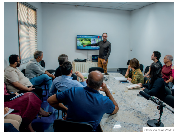
Frente Parlamentar em Defesa do Rio Paraíba do Sul