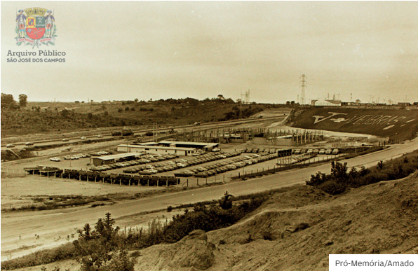
1975. Imagem da Veibras, às margens da Via Dutra