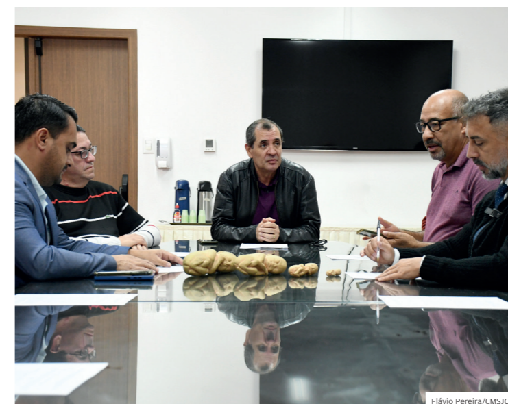
Frente Parlamentar em Defesa da Vida e da Família

A notificação de demolição de uma casa no núcleo Águas de Canindú, na zona norte, motivou reunião da Frente em junho. Participaram do encontro na Câmara moradores de outros núcleos informais ou