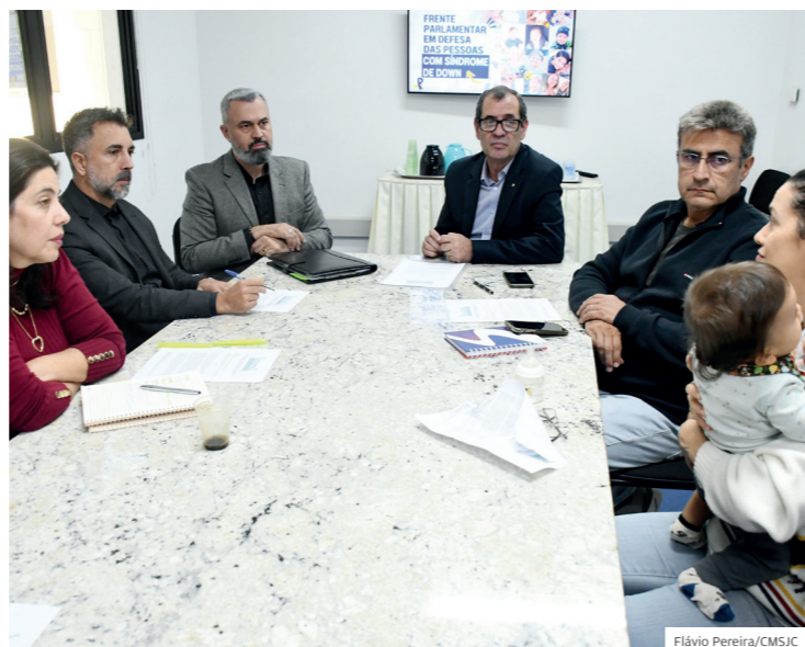
Frente Parlamentar em Defesa das Pessoas com Síndrome de Down