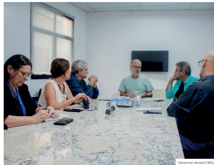
Frente Parlamentar em Defesa do Rio Paraíba do Sul

Em junho, o grupo voltou a se reunir partindo da ideia das famílias de sugerir à Prefeitura a criação de