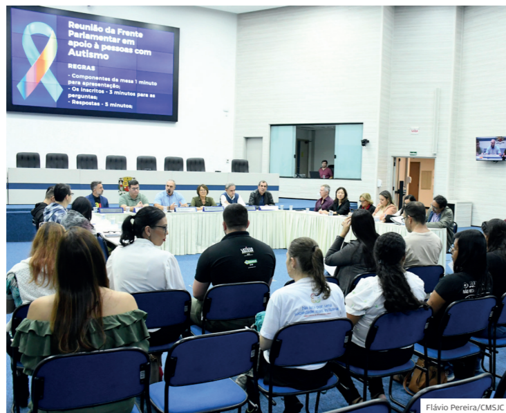
Frente Parlamentar em Apoio à Pessoa com Autismo