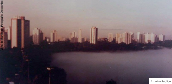
1986. Vista do Banhado, cartão postal de São José

Em 27 de julho, São José dos Campos completa 258 anos desde que o povoado de São José do Paraíba foi alçado a vila, entre Jacareí e Taubaté, pulando a categoria de freguesia. A aldeia próxima ao Rio Comprido surgiu no século XVII como uma fazenda de missionários jesuítas com mão-de-obra de indígenas aculturados e foi transferida por volta de 1680 para a área onde hoje se encontra a igreja matriz, no centro. A elevação ao status de vila em 1767 buscava aumentar o controle da coroa portuguesa sobre o território, pois no século XVIII o Vale do Paraíba era