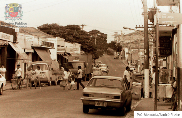
1985. Imagem do bairro de Santana, na região norte

FONTES HISTÓRICAS ESTUDANTES, PESQUISADORES E CIDADÃOS INTERESSADOS PODEM CONSULTAR MILHARES DE DOCUMENTOS