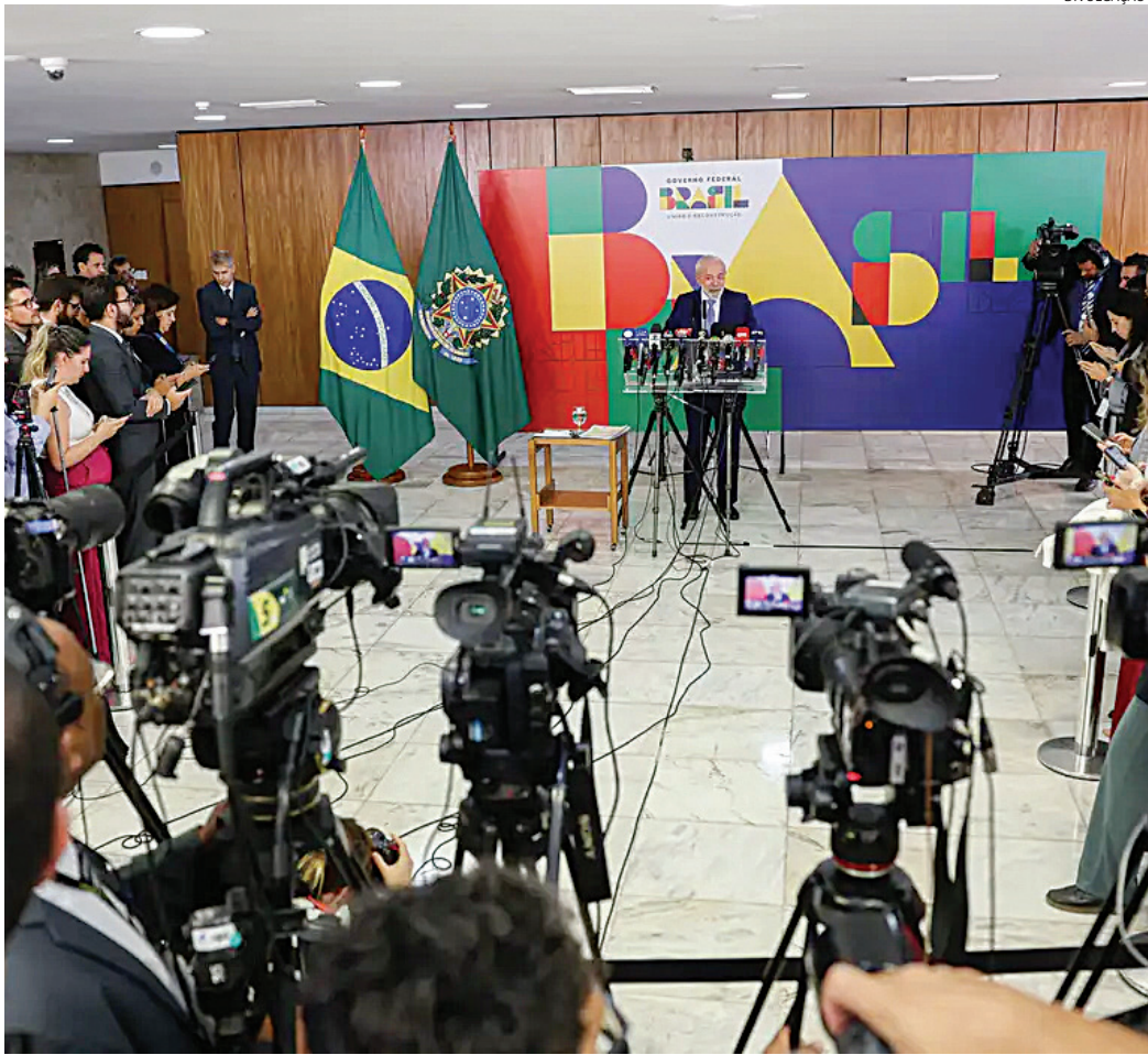
Lula deu entrevista em Brasília, em novo momento de comunicação do governo

Por outro lado, o próprio Lula já declarou publicamente que “2026 já começou”, em referência às eleições presidenciais. No entanto, o mandatário colocou em dúvida durante reunião ministerial que será candidato à reeleição.