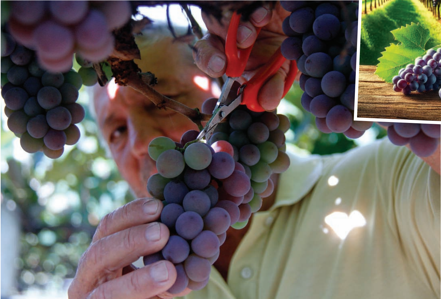
Revista mostra como a 4ª geração se mantém na terra, produzindo uva e vinho de qualidade