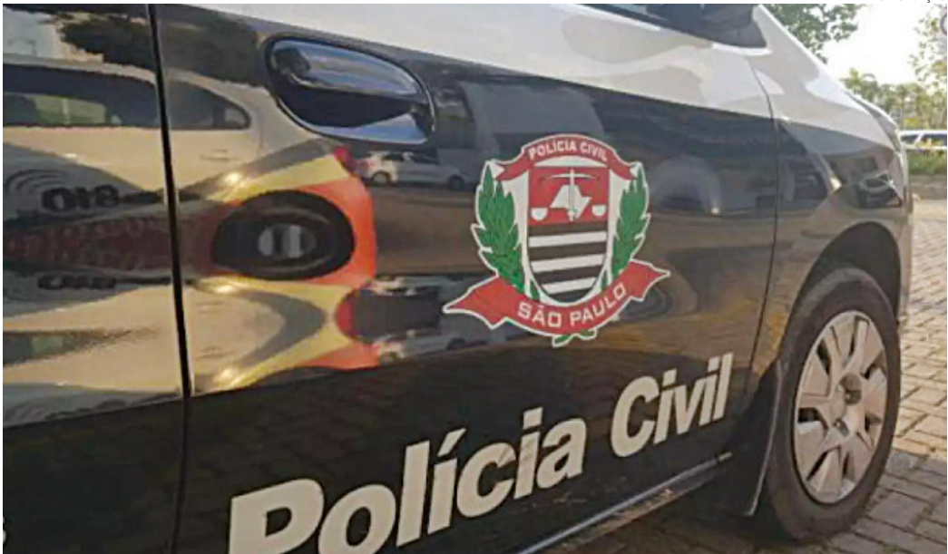
O caso está sendo investigado pela Polícia Civil de Cabreúva

se que apenas tratou a filha fraternalmente. Pai e filha - segundo informações do pai, ela não tem mãe -, brincavam nas piscinas, quando as monitoras e outras pessoas que se divertiam no local, começaram a notar comportamento estranho nele, como beijar a filha na boca, ‘encoxar’ a filha de forma lascívia e a tocar suas genitálias enquanto estavam na água ou quando subiam as escadas para descer o tobogã. A Guarda Municipal foi acionada e deteve o pai, levando-o para a delegacia, onde acabou preso em flagrante por estupro de vulnerável.