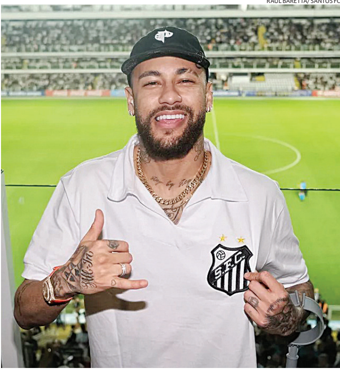
Recuperado de lesão, Neymar já pode voltar aos gramados

O jogador de 32 anos chega ao Peixe após uma passagem frustrante pela Arábia Saudita. Ele sofreu com lesões e disputou apenas sete partidas pela equipe. Mesmo assim, ele agradeceu aos momentos que viveu no país.