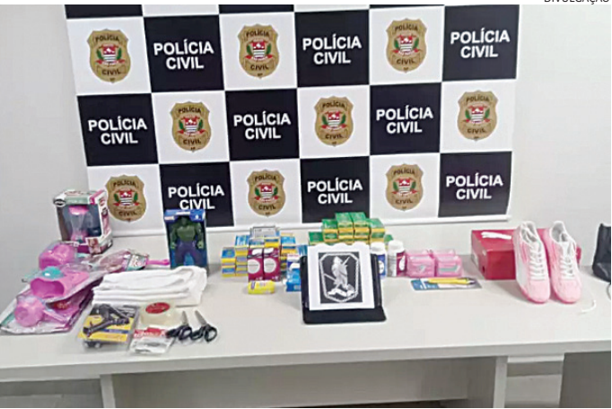
As mercadorias localizadas com o casal foram apreendidas

Um casal de Curitiba foi detido por guardas municipais, nesta quarta-feira (29), no Centro de Jundiaí, suspeito de envolvimento em uma onda de furtos a farmácias na cidade, que vem ocorrendo há pelo menos dois meses. Com a dupla foram apreendidas mercadorias suspeitas. Segundo apurou a reportagem, eles pertencem a uma quadrilha de ladrões residentes na cidade paranaense, e que vem atuando em Jundiaí. Os GMs Pires e Guerra faziam patrulhamento pela área central, quando foram acionados pelo Centro de Operações Táticas (COT), informando que um veículo alvo de investigações em inquérito sobre furtos a farmácias, estava circulando pelo centro.