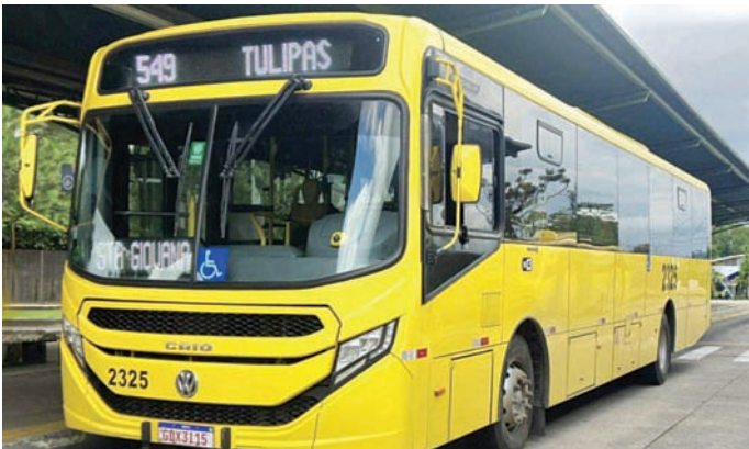
As novas tabelas horárias já estão disponíveis no site oficial do SITU

Para sugestões e mais informações, os usuários podem entrar em contato pelos canais oficiais da UGMT pelo telefone: (11) 4589-8763 ou e-mail: dtp@jundiai.sp.gov.br.