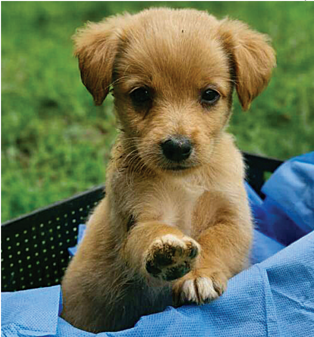
28 filhotes foram resgatados e já estão vacinados e vermifugados

Para quem quiser mais informações sobre os filhotes ou adotar algum cachorro adulto, que costuma ter menos procura do que os filhotes, pode falar com a protetora pelo telefone (11) 97484-8253.