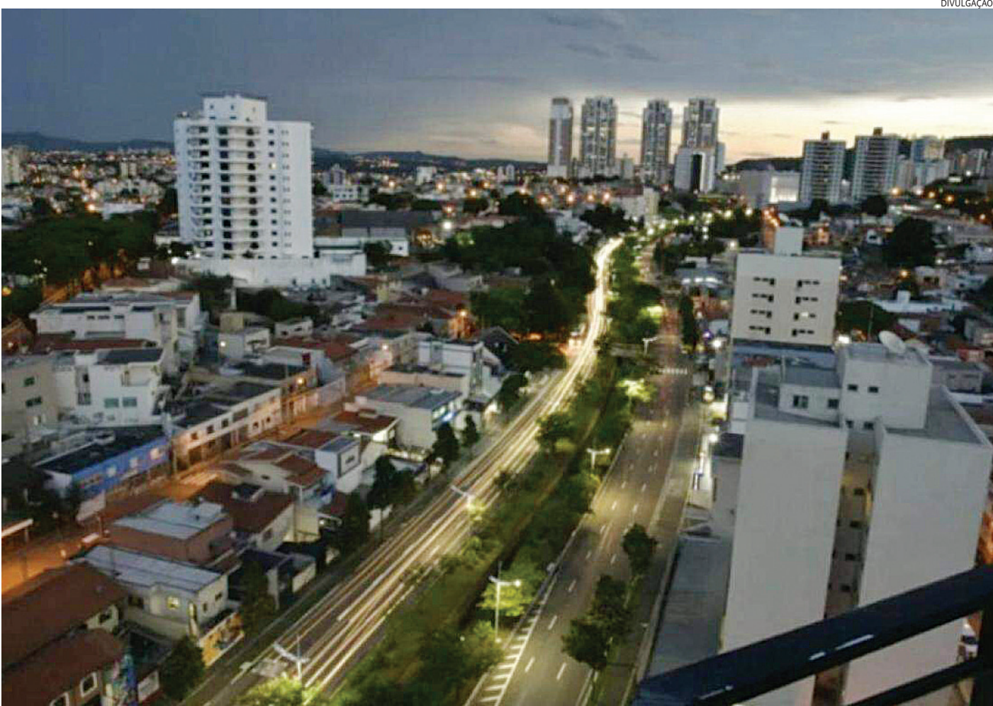
Houve um aumento de 136% no saldo positivo de empregos em 2024 em relação ao ano anterior.

Na comparação com 2023, houve um crescimento significativo no mercado de trabalho formal da cidade.