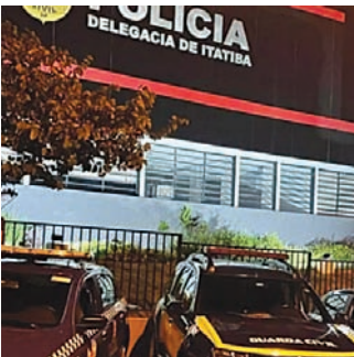
O homem foi preso pelos guardas municipais, por tráfico de drogas