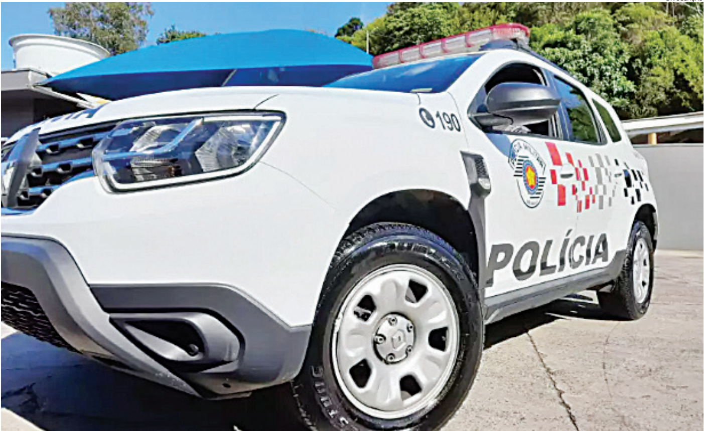
Os PMs o localizaram no bar e o prenderam

Um ‘Jack’ - gíria que surgiu na cadeia e que significa estuprador -, foi capturado por policiais militares em um bar na avenida Espanha, em Cabreúva. O estuprador de criança estava dentro do estabelecimento, consumindo cerveja, quando os PMs - que já tinham conhecimento sobre o mandado de prisão contra ele -, assim que o avistaram efetuaram a abordagem. Com ele nada de ilícito foi encontrado. Porém, constou contra ele mandado de prisão por estupro de vulnerável, importunação sexual e ameaça. Conduzido ao 1º DP de Cabreúva, foi dado cumprimento ao mandado de prisão, ficando ele à disposição da Justiça.