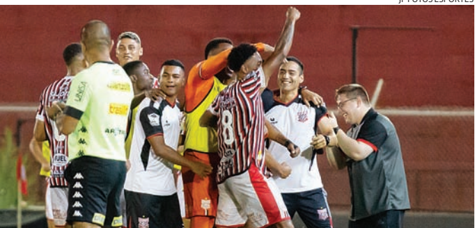
Além de vencer todos os jogos deste ano, o Galo ainda não sofreu gols

Com mais uma vitória na conta, o Galo subiu para a 3ª colocação do grupo único, com 9 pontos. A frente estão Araçatuba (2º) e Inter de Bebedouro (1º), todos com a mesma pontuação, ganhando apenas no saldo de gols. O time jundiaense volta a campo no sábado (1), às 16h, contra o Audax, em Osasco.