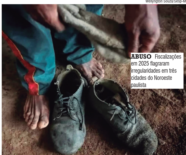
ABUSO Fiscalizações em 2025 flagraram irregularidades em três cidades do Noroeste paulista

Já em Américo de Campos e Magda, um empregador indi-