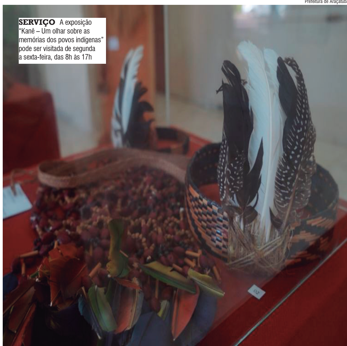
SERVIÇO A exposição “Kanê – Um olhar sobre as memórias dos povos indígenas” pode ser visitada de segunda a sexta-feira, das 8h às 17h