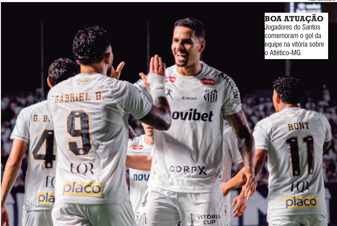
BOA ATUAÇÃO Jogadores do Santos comemoram o gol da equipe na vitória sobre o Atlético-MG