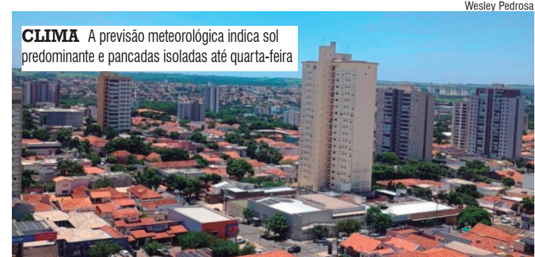
CLIMA A previsão meteorológica indica sol predominante e pancadas isoladas até quarta-feira

Para o período entre hoje e amanhã há previsão de pancadas rápidas e isoladas de chuva, com volume estimado de até 2 milímetros. Apesar disso, a possibilidade de precipitação é considerada baixa, sem impacto