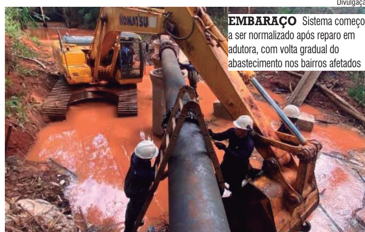
EMBARAÇO Sistema começou a ser normalizado após reparo em adutora, com volta gradual do abastecimento nos bairros afetados

Desde o início da crise, a prefeitura afirma ter acompanha-