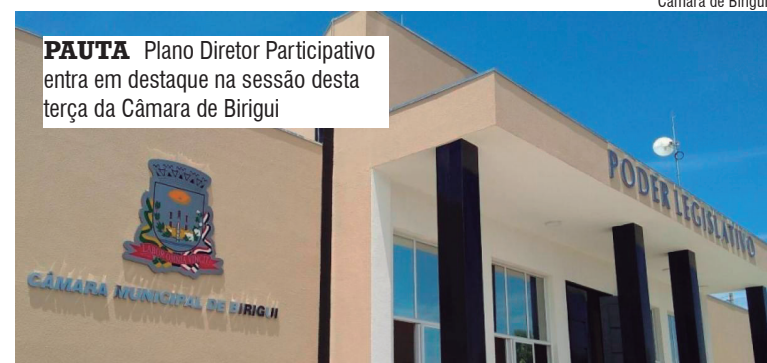
PAUTA Plano Diretor Participativo entra em destaque na sessão desta terça da Câmara de Birigui

Outro ponto importante da matéria é a regulamentação de parte das ruas e avenidas dos sistemas viários, necessária para consolidar a malha urbana e permitir o correto aproveitamento das áreas já ocupadas.