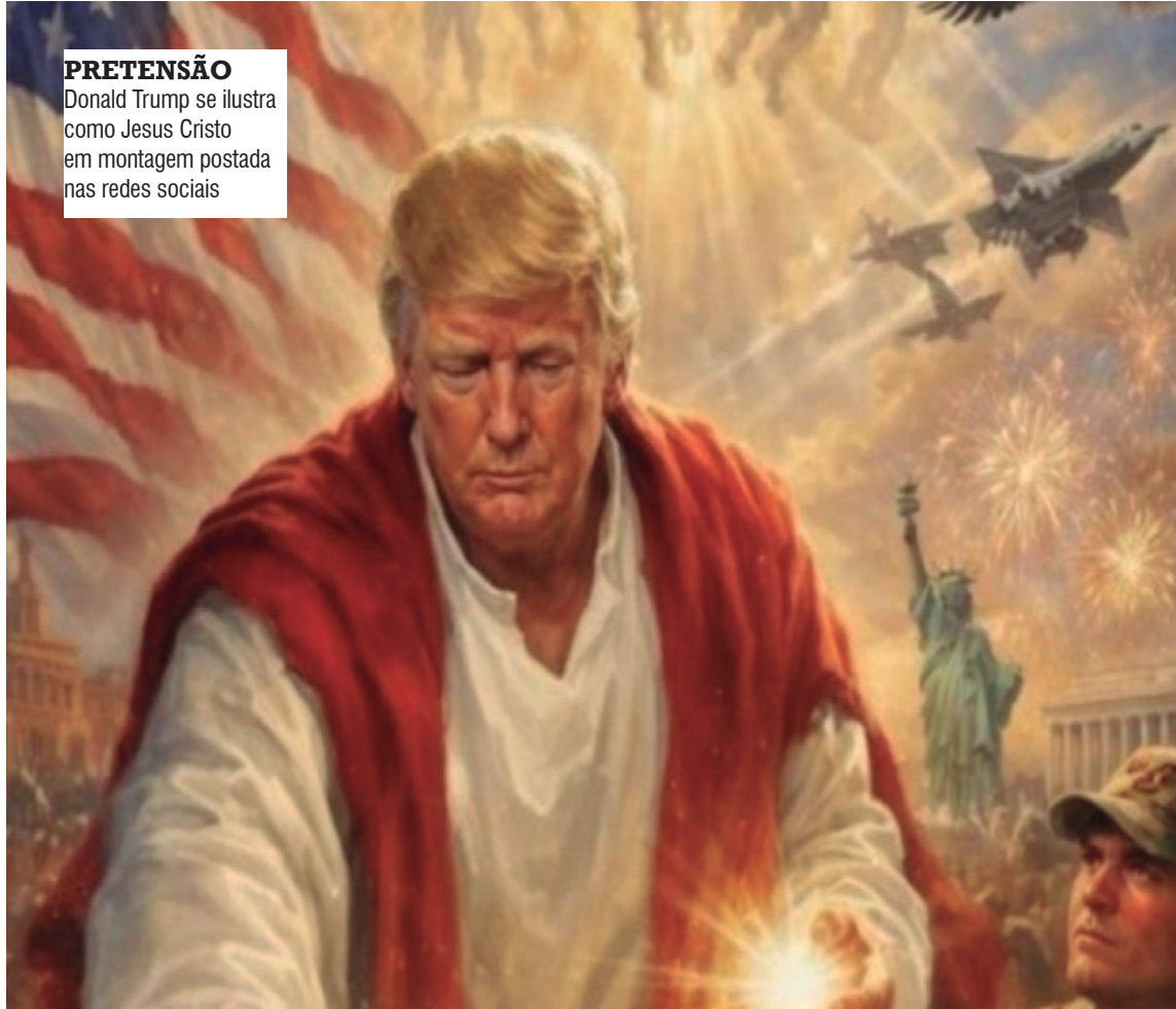
PRETENSÃO Donald Trump se ilustra como Jesus Cristo em montagem postada nas redes sociais

“Não quero um papa que ache que está bem o Irã ter arma nuclear. Não quero um papa que considere terrível